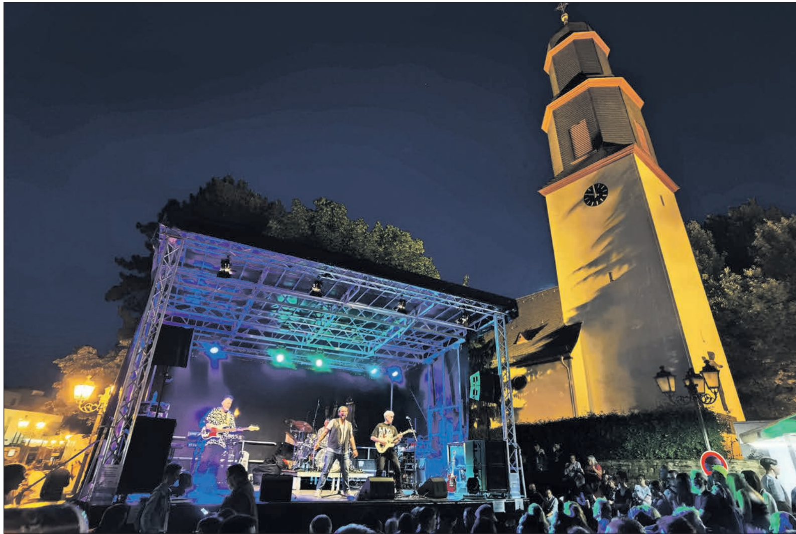
Schon im vergangenen Jahr konnten die Besucher auf dem Eschenplatz in guter Stimmung mit der Musik der Bands feiern. Auch für den 4. und 5. Mai hoffen alle auf gutes Wetter und ausgelassene Stimmung.