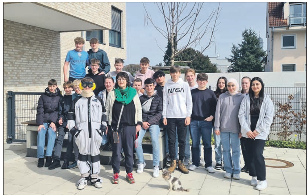
Die Schüler können mithilfe eines sogenannten Alterssimulationsanzugs zunächst ganz praktisch und „hautnah“ Einschränkungen von alten Menschen nachempfinden.