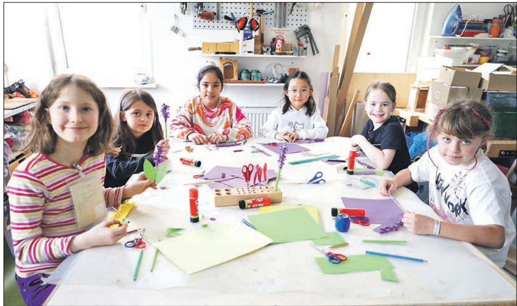
Mit Freude sind die Kinder des Schulkinderhauses I bei ihren verschiedenen Aktivitäten dabei.