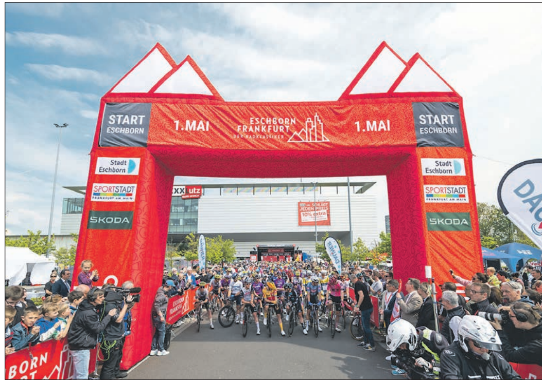
Der Start ist – wie auch im vergangenen Jahr – im Camp-Phönix-Park.