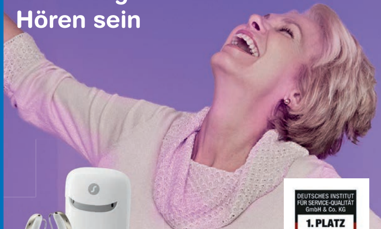
Styletto AX. Die Design-Hörgeräte von Signia