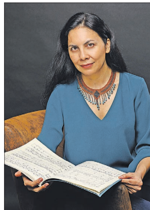
Abendkasse und bei Tourist Info + Service im Kurhaus, Telefon 06172-1783710, erhältlich. Veranstalter ist der Verein der Musikfreunde Bad Homburg, Bad Homburger Kammerorchester.