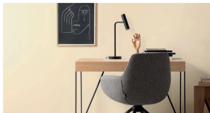
Mehr Eleganz für jeden Raum: Wärme und Natürlichkeit vereinen sich in der Designfarbe Naturbeige.

Kupfergrün für intensive Lebendigkeit und Optimismus steht, schafft Herbstbraun mit viel Wärme ein Gegengewicht zum stressigen Alltag. Diese Designfarbe sorgt für ein natürliches und harmonisches Gefühl von Gemütlichkeit. Ein sanfter klassischer Farbton mit zahlreichen Kombinationsmöglichkeiten ist Naturbeige, Blautöne wie Petrolblau wirken leicht und entspannend. Damit ist diese Farbe unter anderem für Arbeits- oder Schlafzimmer gut geeignet und vermittelt hier eine Extraportion Gelassenheit. Die Farbe Pfingstrosé steht für Anmut und Leichtigkeit. Felsgrau wiederum hilft mit zurückhaltendem Temperament dabei, Designelemente in Szene zu setzen, und punktet mit edler Zurückhaltung.