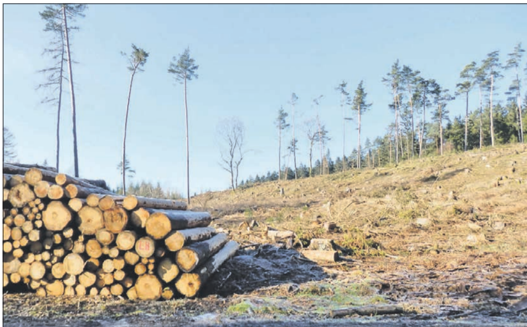
Folgen des Klimawandels: Das Bild zeigt die Räumung von Fichten wegen Borkenkäferbefalls am Weg zum Herzberg im März 2020.