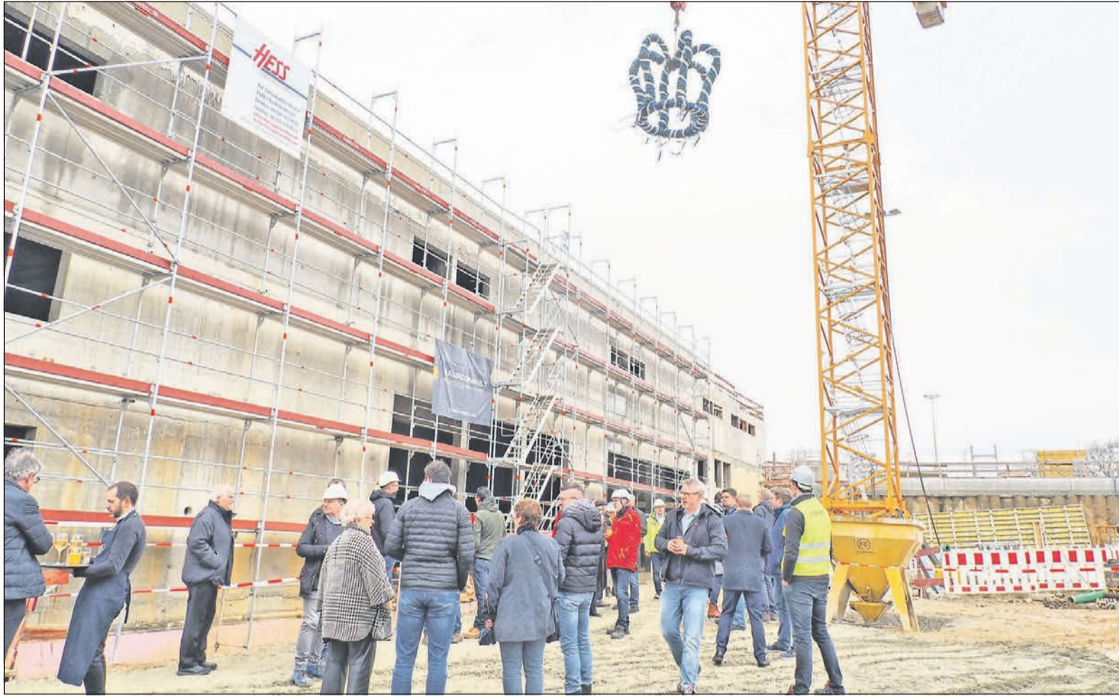
Majestätisch schwebt der Richtkranz über dem Rohbau des neuen Sportzentrums Süd. Zum Richtfest sind viele Besucher in den Massenheimer Weg gekommen, um diesen Meilenstein zu feiern.