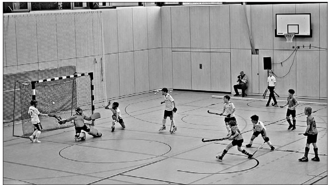
Jakob Winter (Mitte) des Hockey Clubs Bad Homburg verwandelt kurz vor Ende des Halbfinals gegen den Sport Club Frankfurt noch die Ecke zum 2:2.

FV Stierstadt: Die diesjährige Mitgliederversammlung findet am Freitag, 24. März, statt und beginnt um 19.35 Uhr im Vereinsheim. Außer Vorstandswahlen stehen auch Ehrungen auf der Tagesordnung. (gw)