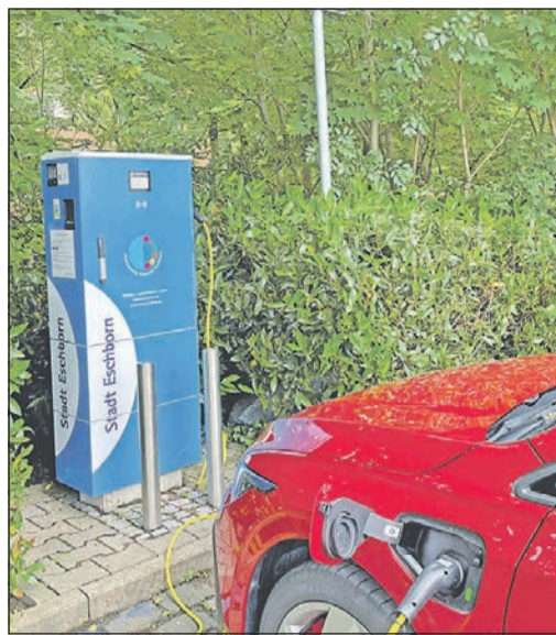
Mehr Ladesäulen soll es in Zukunft in Eschborn geben.

Auch das Laden an den bestehenden Ladepunkten der Stadt Eschborn – Rathaus, Montgeronplatz und Westerbach-Sportanlage – wird ab dem 3. April kostenpflichtig, wie die Stadtverordnetenversammlung in ihrer Sitzung im Januar beschlossen hat. Bislang wurde hier der Strom kostenlos abgegeben. „Zur Unterstützung des Markthochlaufs und der Steigerung der Attraktivität für Elektromobilität war es bislang der richtige Weg, das Laden kostenfrei anzubieten. Durch die kostenpflichtige Abgabe des Stroms sollen keine Gewinne für die Stadt eingefahren werden, sondern soll der Markteinstieg in Eschborn für weitere Dienstleister ermöglicht werden. Niemand bezahlt an einem neuen Ladepunkt, wenn es auch kostenlose Alternativen in der Umgebung gibt. Mit der Ressource Strom sollte zudem verantwortungsvoll umgegangen werden“, so Shaikh. Das Laden soll ab April dann zu marktüblichen und angemessenen Preisen möglich sein. Alle