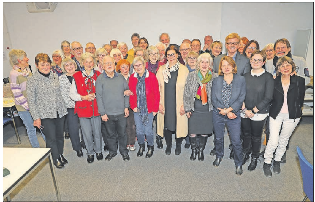
Der Arbeitskreis Avrillé-Schwalbach trifft sich nach zwei Jahren Pandemie wieder zu seinem traditionellen Neujahrsempfang.

Die Dekanatsynode tagt das nächste Mal am 13. Oktober. Dann wird die Entscheidung über die finale Bildung der Nachbarschaftsräume auf der Tagesordnung stehen, die bis Ende getroffen sein muss.