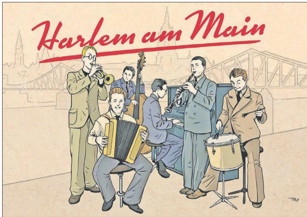
Eine Konzertlesung „Harlem am Main“ findet im Eschborn K statt und wird besonders alle Jazzfans begeistern.