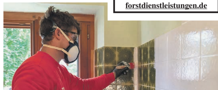
Vor dem Start der eigentlichen Arbeit sollte man unbedingt passende Schutzkleidung anziehen: Atemschutzmaske, einschiebige Schutzbrille und Multi-Flex-Handschuhe.