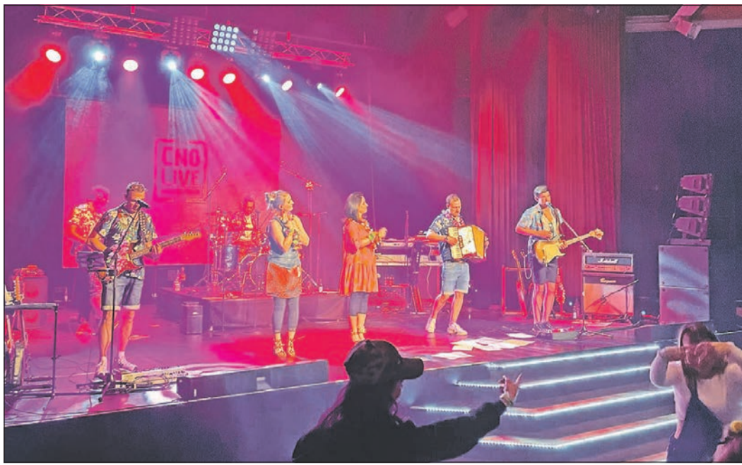
Beste Stimmung herrscht bei der „RambaZamba“-Faschingsparty des Tanzsport- und Carnaval-Clubs (TCC) Pinguine.