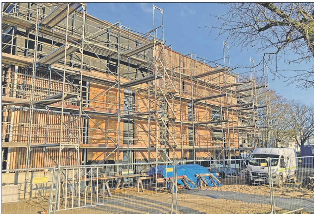
Ende Mai soll der Neubau an der Heinrich-von-Kleist-Schule fertig sein.

Weitere Informationen rund um die Heinrich-von-Kleist-Schule erhalten Interessierte unter Telefon 06196-9570-0 oder im Internet unter www.kleist-schule.de .