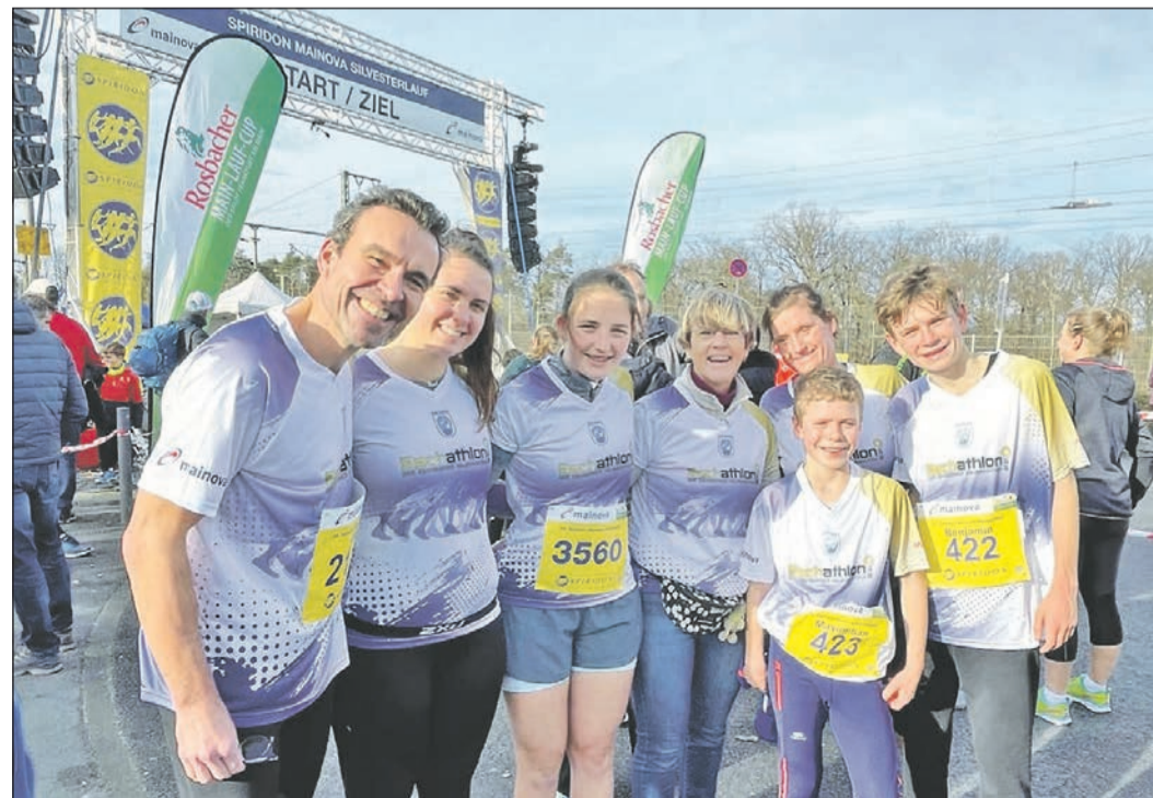
Das beliebte Läufershirt für den 10. Eschathlon kann sich jeder sichern, der sich bis zum 30. April anmeldet. Den ersten Auftritt hat es für das Jubiläumsshirt bereits beim Spiridon-Silvesterlauf gegeben.

Ab jetzt ist die Anmeldung im Internet möglich unter www.eschathlon.de/anmeldung-2023 . Die Anmeldung ist dann bis zum 15. Juni geöffnet, aber, um sich das tolle Jubiläumsshirt des Eschathlons zu sichern, sollte man nicht zu lange zögern: Bei Registrierung bis zum 30. April ist es auf jeden Fall gesichert.