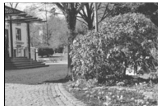
Erste Krokusse im Kurpark