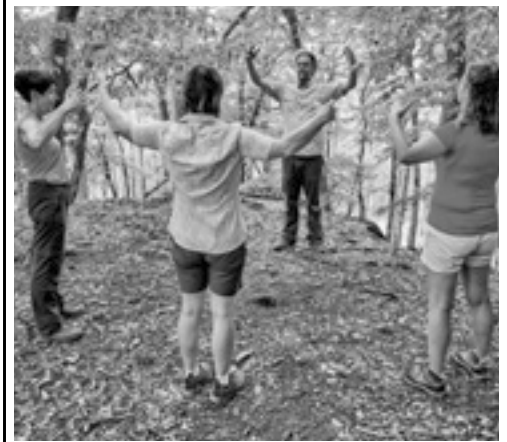
Waldbaden – Wellness unter Bäumen | Sonntag, 26. März 2023