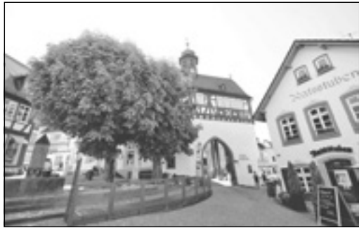
Das Königsteiner Stadtmuseum im Alten Rathaus

Neues Konzept gemeinsam mit der Stadt entwickeln