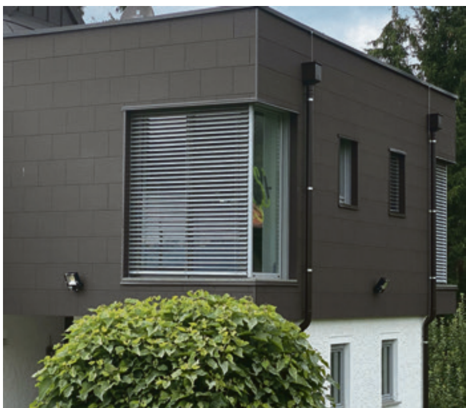
Für eine individuelle Optik der Gebäudehülle: Fassadenelemente von ZF Zierer bieten riesige Gestaltungsmöglichkeiten in Sachen Farbe, Oberflächenstruktur und Format.