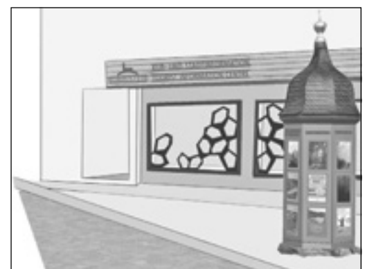
... wird neu!