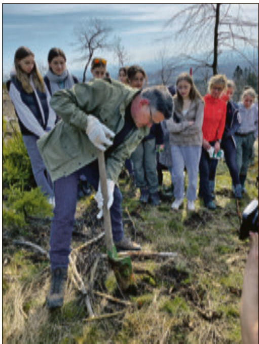
Ministerpräsident Boris Rhein musste ordentlich mit anpacken ...

„Bis zum Jahr 2018“, so Sebastian Gräf (Leiter des Forstamtes Königstein), „waren die heute neu zu beplantenden Gebiete am Ortsausgang von Königstein (Richtung Ruppertshain) dicht mit Fichten bewaldet. Bedingt durch Wassermangel und Borkenkäferbefall mussten die Bäume gerodet werden. Die Neubepflanzung wird zwar auch wieder Fichten enthalten, jedoch mit einer sinnvollen Beimischung von z.B. Winterlinden, Esskastanien und Speyerling, um eine gewisse Klimaresilienz der Wälder zu erreichen.“