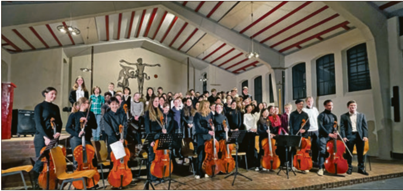
Die Orchester-Musikerinnen und -Musiker konnten ihr Publikum begeistern.