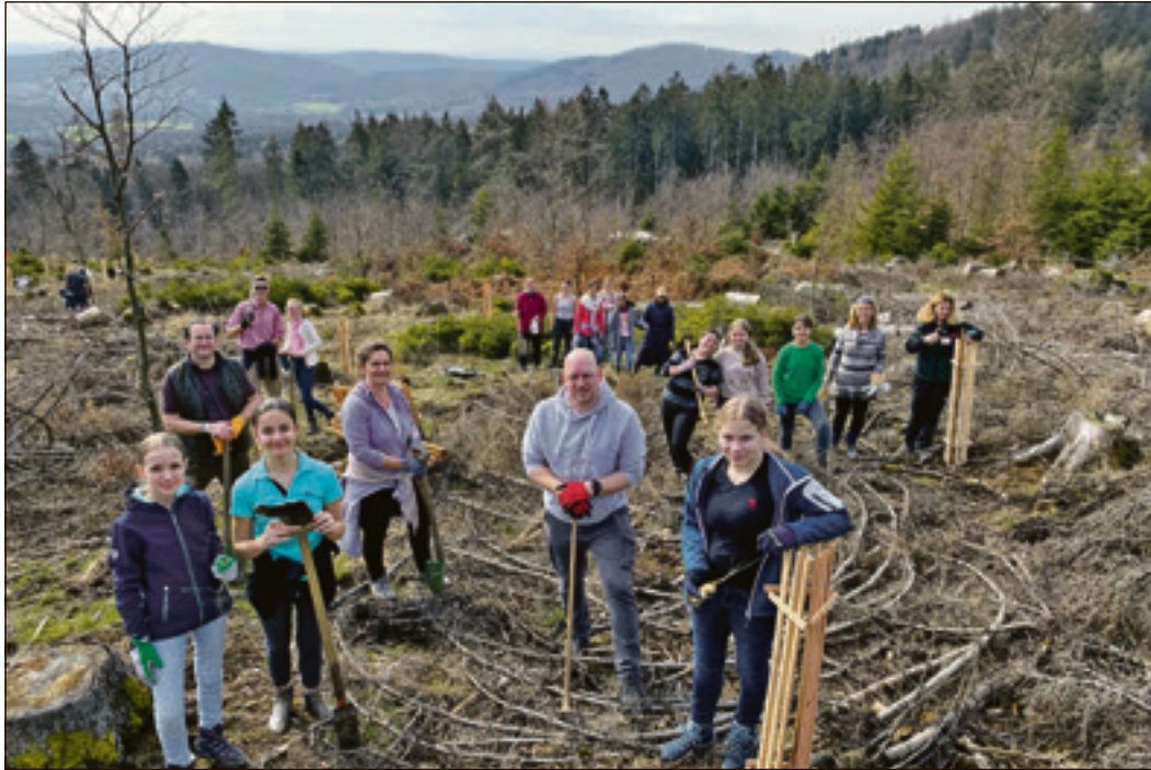
Die Schülerinnen der St. Angela-Schule waren mit vollem Einsatz bei der Pflanzaktion dabei.