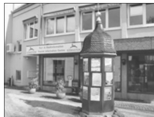
Aus alt ...

Anmeldung ab 27. März bei der Kur- und Stadtinformation unter Telefon (0 61 74) 202 251 oder per Mail an info@koenigstein.de oder auch persönlich im ehemaligen Parkhotel Bender, Frankfurter Straße 1.