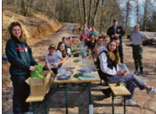
Zum Abschluss hatten sich die jungen Damen eine Stärkung verdient.

Trockenheit, Stürme, Schädlingsbefall – allein 90.000 Hektar Wald seien in den vergangenen fünf Jahren der Trockenheit zum Opfer gefallen. Eine nachhaltige Waldbewirtschaftung ist laut dem Regierungschef daher von immenser Bedeutung. „Für den Staatswald