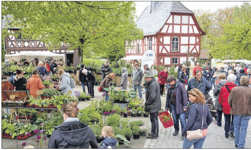
Rund 100 Pflanzenspezialisten verwandeln den Hessenpark in Neu-Anspach am ersten Mai-Wochenende in ein großes Blütenmeer.