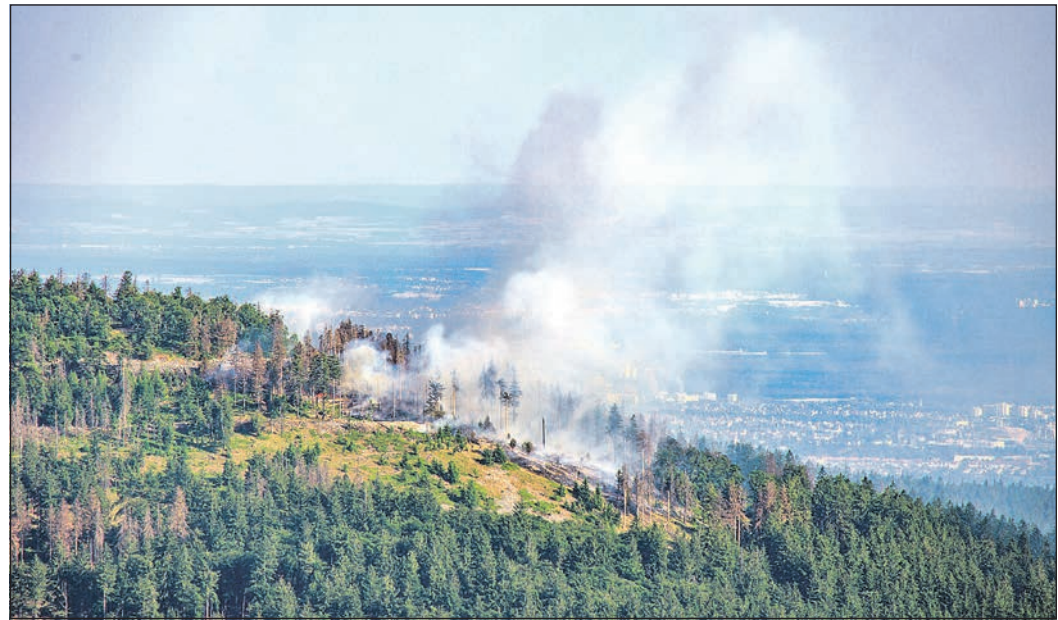
Am 12. Juni 2023 stehen 40 000 Quadratmeter Wald auf dem Altkönig in Flammen.

nehmen, und wie müssen sich Rettungskräfte neu organisieren? Welche Aufgaben kommen auf Gesellschaft, Politik und Verwaltungen zu? Antworten hierauf will der Fachkongress „Waldbrände – Eine Gefahr für die Zukunft unserer Wälder!“ liefern, der am Samstag, 20. April, von 14 bis etwa 17 Uhr in der Stadthalle Kronberg, Berliner Platz, stattfindet. Die Schutzgemeinschaft Deutscher Wald (SDW) hat drei namhafte Referenten eingeladen, die langjährige – teilweise internationale – Erfahrungen zur Bekämpfung von Waldbränden mitbringen. Anschließend gibt es eine Podiumsdiskussion mit Fragen aus dem Publikum. Weitere Informationen stehen im Internet unter www.sdw Hessen.de . Eingeladen sind alle waldinteressierten Bürger, aber vor allem Einsatzkräfte, die im Juni 2023 am Altkönig engagiert waren. Der Eintritt zur Tagung ist frei. Die Veranstalter bitten ausdrücklich um eine Anmeldung per E-Mail an kontakt@sdw Hessen.de . Die Teilnehmerzahl ist begrenzt.