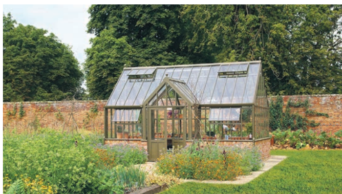
Die Struktur der Gewächshäuser ist klar, geordnet, praktisch und vor allem von langer Lebensdauer, Wind und Wetter können den Häusern über Jahrzehnte nichts anhaben.

Beliebt bleiben Häuser im viktorianischen Stil, neu sind Do-it-yourself-Modelle