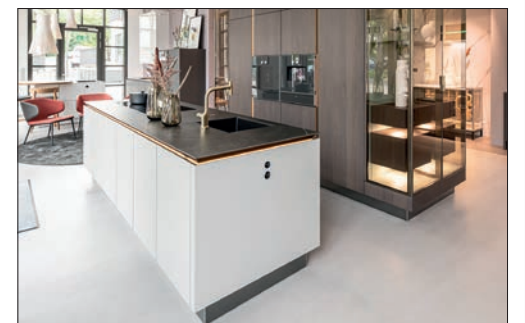
SieMatic by Krampe macht Küchenträume wahr.

Küchen von SieMatic sind dafür gemacht, über Jahre und Jahrzehnte hinweg zu überzeugen – im Jetzt ebenso wie im Morgen. SieMatic versteht De-