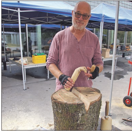
Auch Bildhauern kann man bei der Sommerakademie lernen.

hen zusätzliche Materialkosten. Die Teilnehmerzahl ist bei allen Werkstätten begrenzt. Anmelden können sich Interessierte ab sofort. Anmeldeschluss ist am Freitag, 5. Juli. Für Informationen und Anmeldung erreichen Interessierte die Kulturstiftung Friedrichsdorf unter Telefon 06172-731-296 oder per E-Mail an kulturstiftung@friedrichsdorf.de .