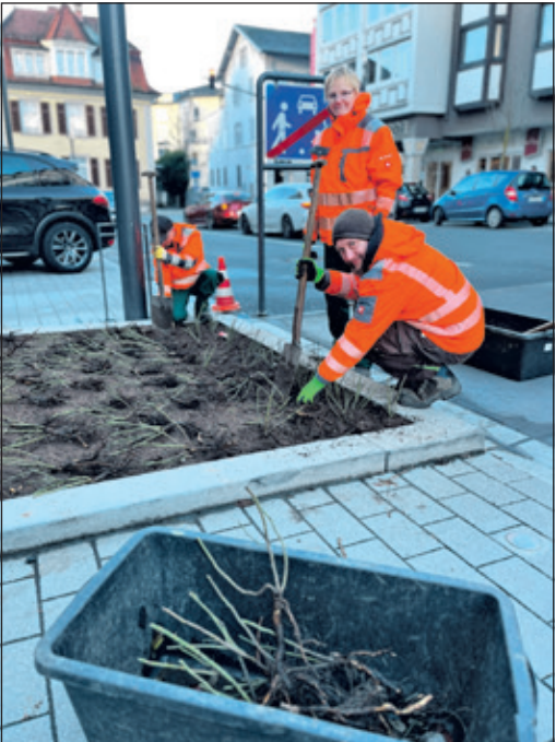
Die städtischen Gärtnerinnen und Gärtner begrünen eine Pflanzinsel in der Straße Am Bahnhof.

Auch wenn’s nicht gleich ins Auge fällt: Sogar das Dach über den Bussteigen haben die Gärtner mit verschiedenen Pflanzen begrünt, die zwischen 5 und 25 Zentimeter hoch werden. Diese müssen nicht intensiv gepflegt