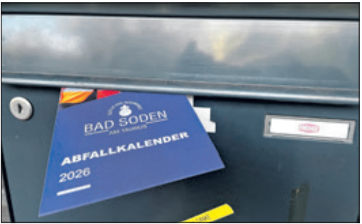
Der Abfallkalender 2026 listet alle Termine auf.