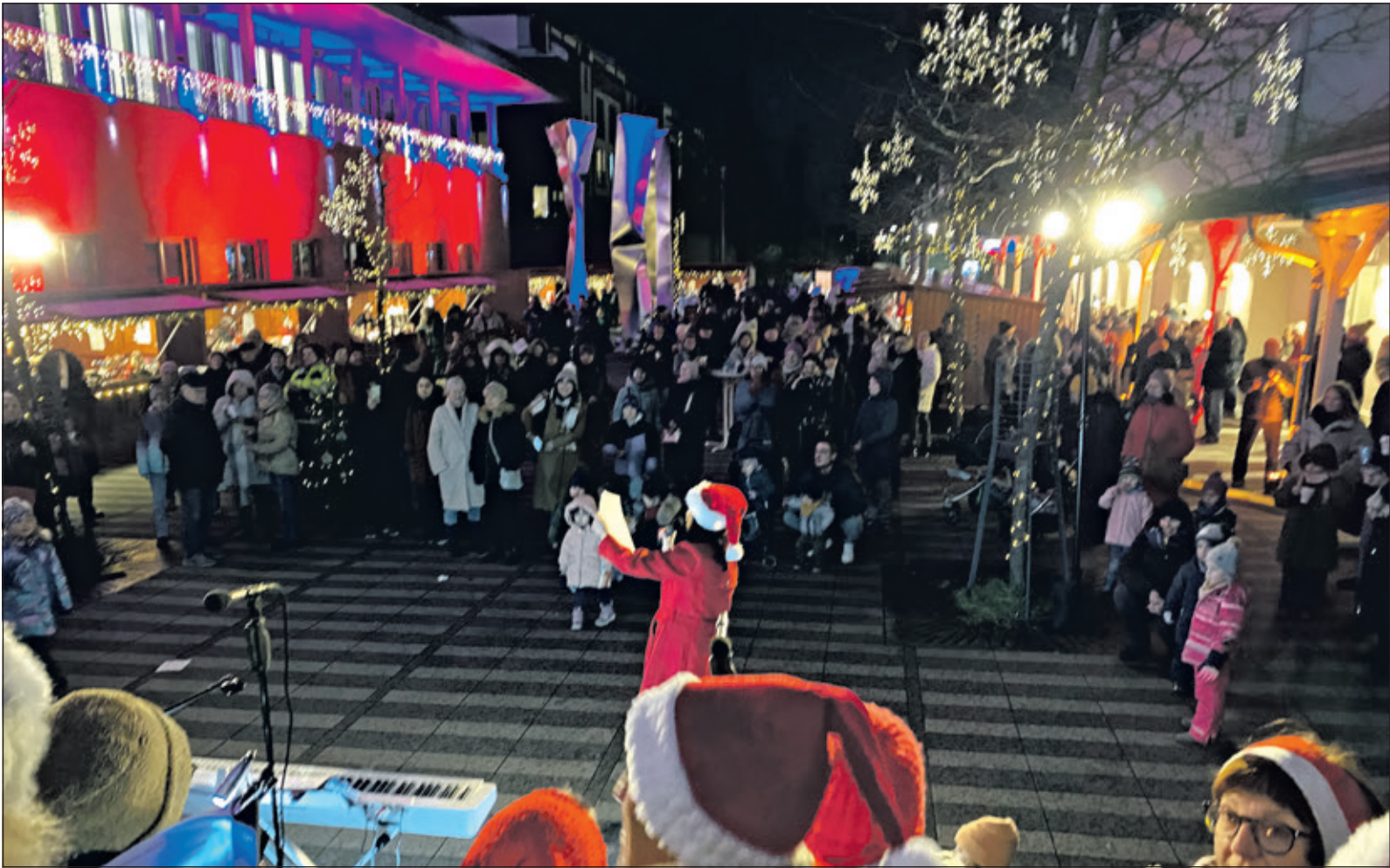
Mit einem Weihnachtshorkonzert des „Messer-Projektchores“ und dem „Sing-A-Long“ begeisterte Susanna Fan-Ebener die Gäste beim romantisch-schönen Weihnachtsmarkt auf dem Messerplatz.