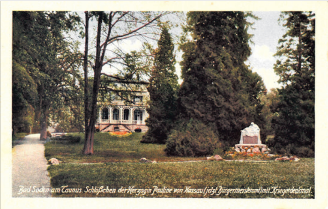
Das Ehrenmal an seinem ehemaligen Standort im Alten Kurpark um 1930

Jahre nach dem Ende des Ersten Weltkriegs, und sein ursprünglicher Standort war im Alten Kurpark nahe des Paulinenschlößchens. Künstlerisch gestaltet wurde das Denkmal vom damaligen Städtelprofessor und Bad Sodener Bürger Friedrich Hausmann. Nach dem Ende des Zweiten Weltkriegs musste die Liste der gefallenen Soldaten um zahlreiche Namen erweitert werden. Im Jahr 2014 wurde das Ehrenmal auf den Bad Sodener Friedhof in der Falkenstraße umgezogen. Jedes Jahr wird seitdem dort der Opfer von Krieg und Gewalt anlässlich des Volkstrauertags mit einer Kranzniederlegung gedacht.