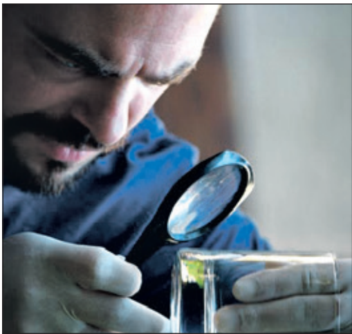
Diese Spur könnte zum Täter führen.

Bad Soden (bs) – Was für ein Handwerkzeug braucht eigentlich ein Detektiv? Wie kann man Spuren sichern und wie werden die Kriminalfälle dann gelöst? Diese spannenden Fragen werden beim Detektiv-Nachmittag in der Stadtbücherei am Mittwoch, 10. Dezember, von 15 bis 16.30 Uhr gelöst. Ein echter Detektiv wird den Kindern im Alter von sechs bis zwölf Jahre unter dem Titel „Interaktiv zum Junior-Detektiv“ viele Tricks und Arbeitsweisen erläutern. Die Teilnahme kostet fünf Euro. Alex Schrumpf ist ein echter Detektiv, der jeden Tag richtige Fälle bearbeitet und löst. Er führt seine Detektei Adler in Wiesbaden seit 25 Jahren. Die Zahl der Teilnahmeplätze ist begrenzt, deswegen sollte die Anmeldung bald erfolgen; am besten telefonisch unter der Rufnummer 06196 208-255.