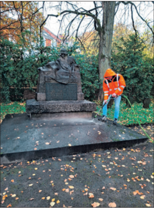
Das Ehrenmal auf dem Bad Sodener Friedhof vor der Reinigung.