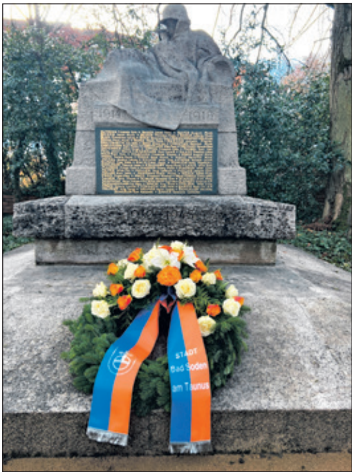
Kranzniederlegung zum Gedenken an die Opfer von Krieg und Gewalt am Volkstrauertag

Bad Soden (bs) – Rechtzeitig zum Volkstrauertag waren die Arbeiten abgeschlossen: Das von Wind und Wetter gezeichnete Ehrenmal auf dem Bad Sodener Friedhof wurde in den vergangenen Wochen fachmännisch gereinigt, die Schriftzüge der gefallenen Soldaten erneuert und der Platz rund um das Ehrenmal in einen gepflegten Zustand versetzt. In goldener Schrift zeugen die Namen der im Ersten und Zweiten Weltkrieg getöteten Männer davon, dass viele alteingesessene Bad Sodener Familien ihre Söhne als Opfer von Krieg und Gewalt zu Grabe tragen mussten. Errichtet wurde das Denkmal 1928, also zehn