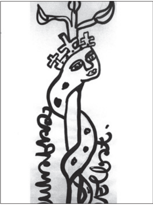
Unter dem Titel „Schrift und Figur“ zeigt die Künstlerin Regina Ouhrabka ihre Werke im KunstKabinett

Bad Soden (bs) – Vom 20. Dezember bis zum 11. Januar 2026 stellt die Künstlerin Sabine Ouhrabka ihre Werke im KunstKabinett im Kulturzentrum Badehaus aus. Die Ausstellung lädt die Besucher ein, die kraftvolle Verbindung von Sprache, Zeichen und Körperlichkeit in den Arbeiten der Künstlerin zu