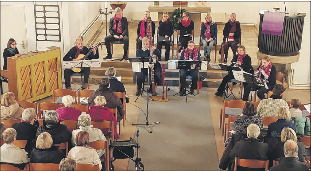
Die Instrumentalgruppe „Kreuzklang“ und ein sechsköpfiger Chor gestalteten die adventliche Musik in der Friedenskirche in Alt-Schwalbach.