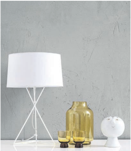
Weniger ist mehr: Wände in Sichtbeton-Optik verleihen der Wohnung einen industriellen Charme.

Minimalismus mit Charakter (DJD). Sichtbeton setzt markante Akzente im Innendesign. Der elegante, rohe Look prägt nicht nur Restaurants und Hotels, sondern zunehmend auch private Wohnräume. Der angesagte Stil lässt sich zum Beispiel mit der Trendstruktur „Sichtbeton-Optik“ von Schöner Wohnen-Farbe erstaunlich realistisch nachbilden. Zwei Schichten, zuerst die Grundfarbe und dann der Effektpatchel, erzeugen Farbe, Tiefe sowie die typischen Ausbrüche. Mit einer Kreativfolie entstehen kleine Lufteinschlüsse, die später wie echte Materialporen wirken. Glatte Untergründe und eine sorgfältige Vorbereitung sorgen für ein authentisches Ergebnis. So entsteht eine Wandgestaltung mit industriellem, minimalistischem Flair. Unter www.schoener-wohnen-farbe.com finden sich weitere Tipps zur kreativen Wandgestaltung.