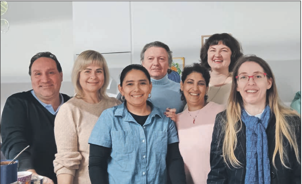
Dreieinhalb Jahre lang waren die Mitglieder des Teams des „Cafés Amica“ wichtige Ansprechpartner für Geflüchtete aus der Ukraine.