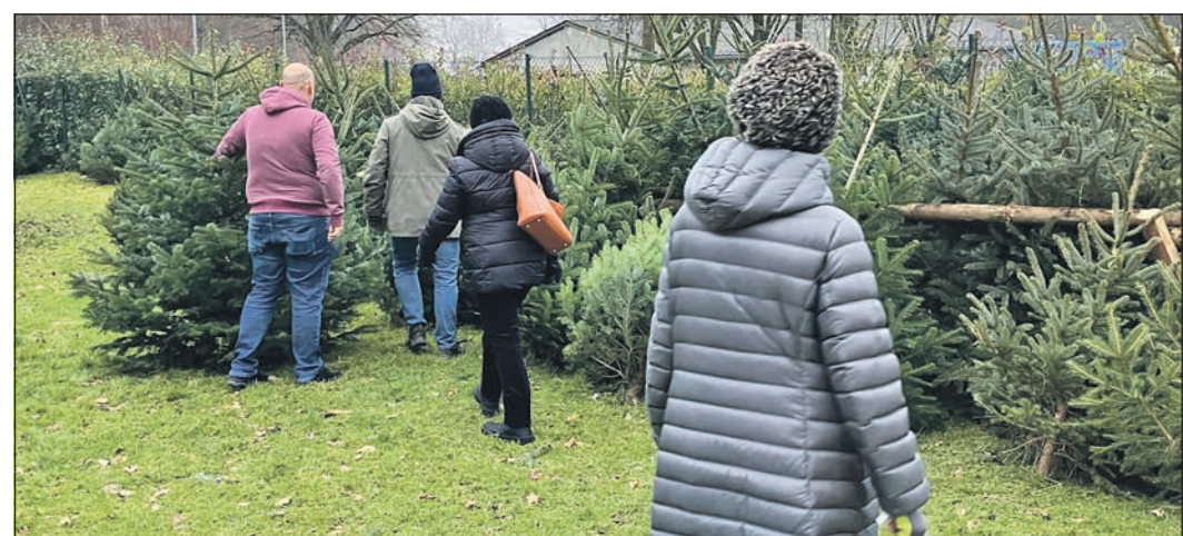
Frisch geschlagene Christbäume aus der Region können am Samstag am Waldhaus im Arboretum gekauft werden.