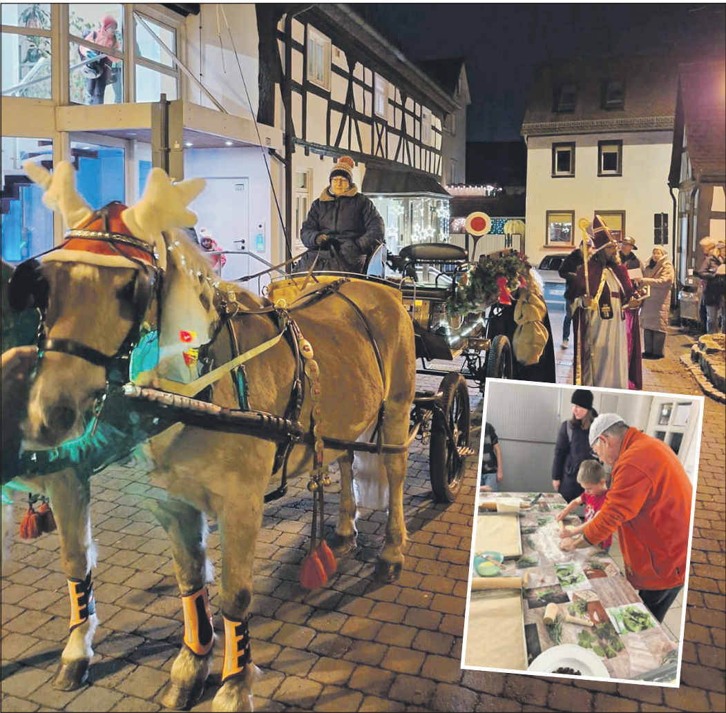
Mit einer Kutsche kam der Nikolaus zum Vereinshaus des Niederhöchstädter Brauchtumsvereins. Vor dem Besuch hatten die Kinder kleine „Nikeleeser“ gebacken.