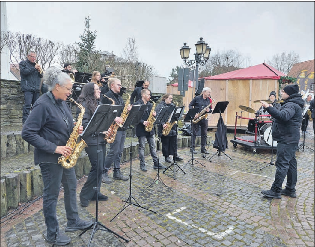
Tapfer spielten die Musikerinnen und Musiker der Impulse-Big-Band beim Weihnachtsmarkt auch beim einsetzenden Regen weiter ihr adventliches Programm.