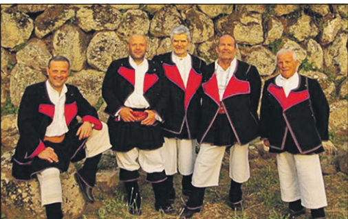
Die „Tenores di Neoneli“ kommen am 20. Dezember nach Eschborn.

ens über die Insel hinaus bekannt zu machen. Das Konzert wird in Kooperation mit der Stadt Eschborn und dem Sardischen Kulturverein „Maria Carta Rhein-Main Frankfurt“ veranstaltet. Der Eintritt ist frei.