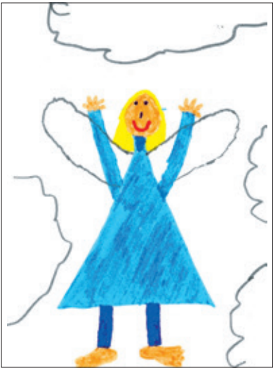
Dieser Engel zielt in diesem Jahr die Wunschkarten