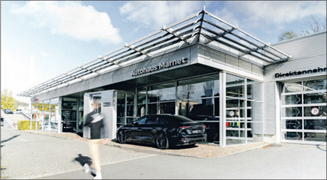
Der Audi-Betrieb in der Sodener Straße 1-3 wird zukünftig auch die Beratung und den Service der Volkswagen-Niederlassung übernehmen.

Der Umzug selbst wird voraussichtlich in der ersten Januarwoche 2026 erfolgen, was die Schließung der Niederlassung in der Wiesbadener Straße zum Jahresende 2025 bedeutet. Der Volkswagen-Service wird seine Tätigkeit in der Sodener Straße dann in der zweiten Januarwoche aufnehmen. Das Grundstück in der Wiesbadener Straße wurde von der Eberhard Horn Design Gruppe erworben. Mit ihrer großen Expertise bei der Entwicklung von Grundstücken in zentraler Lage in Königstein arbeitet die Immobilienentwicklungsgesellschaft aktuell an einem zukunftsfähigen Konzept zur Entwicklung der Liegenschaft mit Gewerbe- und Wohnflächen.