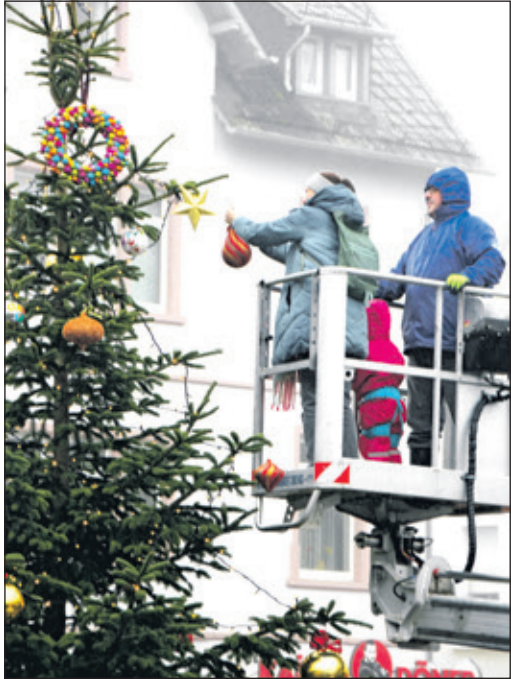
Noch ein Stückchen nach links – die Mamas halfen aus, wenn die Kinderarme noch etwas zu kurz waren.