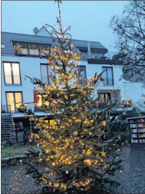
Das Ergebnis: So schön leuchtet es jetzt auf dem Bornplatz in Mammolshain.

Mammolshain (kw) – Es leuchtet wieder: Im historischen Ortszentrum hat der Kerbeverein Mammolshain am 1. Adventssamstag den Weihnachtsbaum auf dem Bornplatz in Mammolshain aufgestellt. Der Baum wurde auch in diesem Jahr wieder von der Neuenhainer Apfelschmiede gestiftet. Geschmückt wurde er mit Weihnachts-