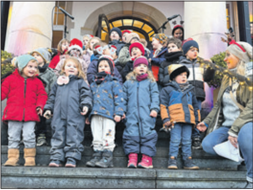
Die Kinder der Kita Christkönig aus Falkenstein sangen Weihnachtslieder.