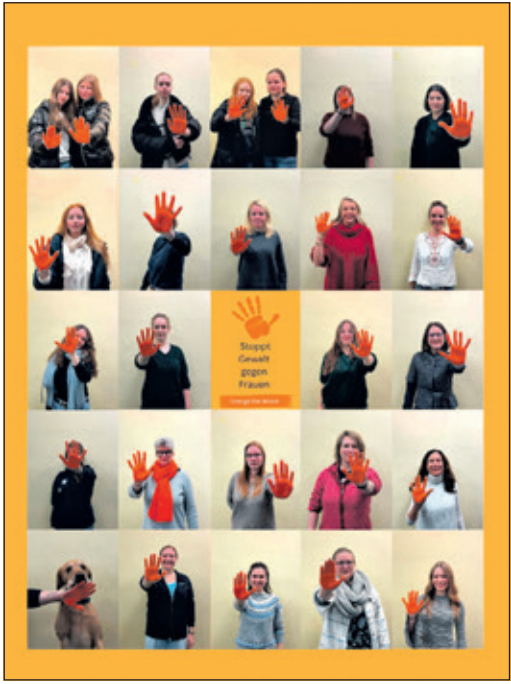
Orange the World: Eine Schule sagt „Nein“.