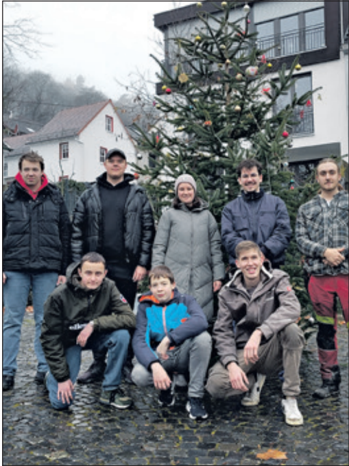
Die Macher: Der Kerbeverein hat den von der Apfelschmiede gestifteten Baum aufgestellt.

Mammolshain (kw) – Es leuchtet wieder: Im historischen Ortszentrum hat der Kerbeverein Mammolshain am 1. Adventssamstag den Weihnachtsbaum auf dem Bornplatz in Mammolshain aufgestellt. Der Baum wurde auch in diesem Jahr wieder von der Neuenhainer Apfelschmiede gestiftet. Geschmückt wurde er mit Weihnachts-