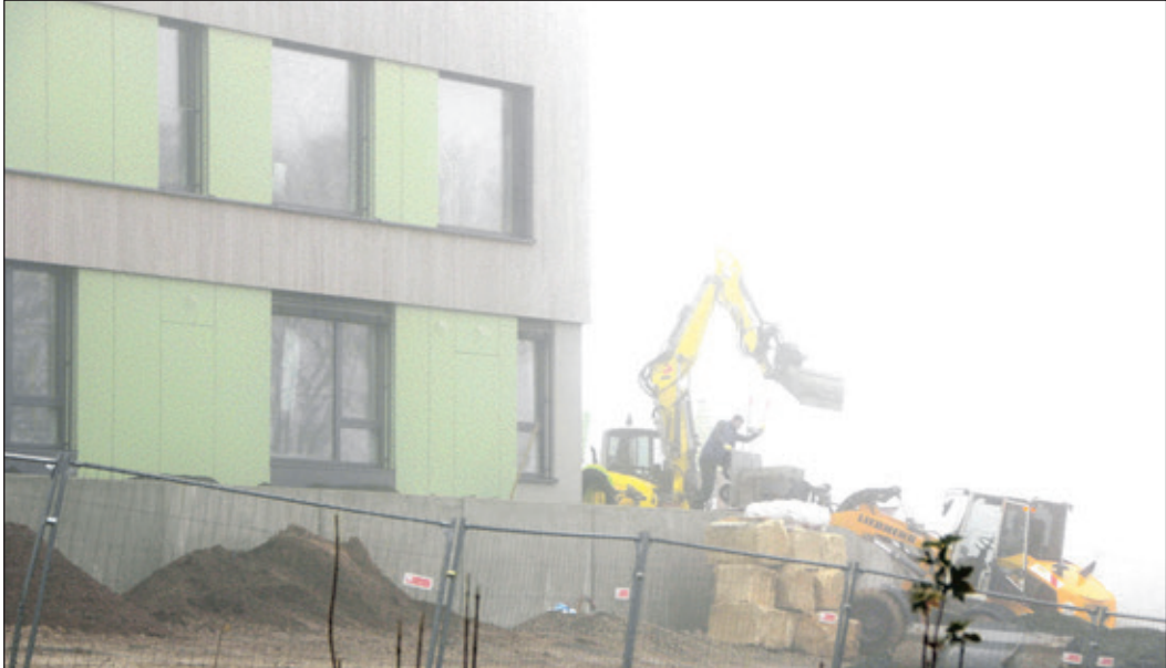
Die Bauarbeiten sind auch am samstags in vollem Gange, damit der straffe Zeitplan eingehalten werden kann.