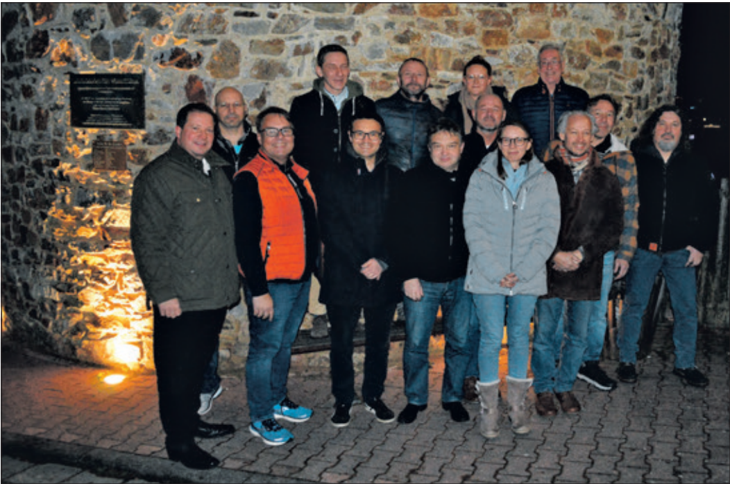
Die gemeinsame Liste von WGS / WGO für die Kommunalwahl hatte sich zum Gruppenbild in Schloßborn eingefunden.

WGS und WGO streben an, als zukünftig stärkste politische Kraft Glashütten lebenswert zu erhalten und weiterzuentwickeln. Der Fokus liegt dabei auf nachhaltiger Gemeindeentwicklung im Einklang mit der Natur – schließlich ist Glashütten ein Herzstück des Naturparks Hochtaunus. Der Zusammenschluss verfolgt ein ambitioniertes Programm: • Politisches Angebot stärken: Vorstellung eines klaren Wahlkampfprogramms, transparente Umsetzung politischer Maßnahmen und das Gewinnen neuer Mitglieder, die Verantwortung übernehmen möchten. • Verlässlichkeit & Klarheit: Projekte sollen finanziell solide geplant, bewertet und offen kommuniziert werden – inklusive nachvollziehbarer Kostenfolgen für den Haushalt. • Neue politische Kultur: Die WGS / WGO möchte verfestigte Strukturen aufbrechen und Kontrollgremien konsequent nutzen.