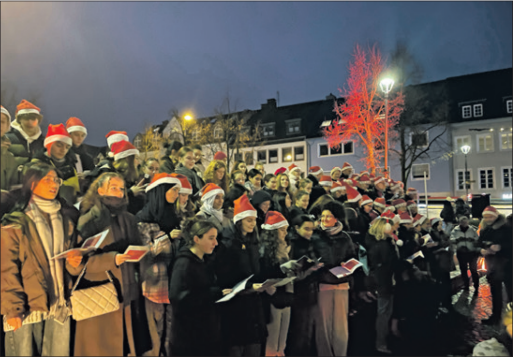
Die Singgemeinschaft bildete gemeinsam mit den Taunus Tunes einen beeindruckenden Chor von etwa 80 Sängerinnen und Sängern. Und rund 300 Besucher sangen mit.

Königstein (rb) – Pünktlich zum 1. Advent lud die Singgemeinschaft 1860/1893 am vergangenen Sonntag auf dem Kapuzinerplatz wieder zum „Sing Along am Weihnachtsbaum“ ein. Gemeinsam mit dem Musikverein Kronberg und den „Taunus Tunes“, dem Chor des Taunusgymnasiums, feierten die Singgemeinschaft und das Publikum den Beginn der Weihnachtszeit mit guter Verpflegung und bekannten Weihnachtsliedern. Mit der Veranstaltung, die nach der Corona-Pandemie ins Leben gerufen wurde und nun bereits zum dritten Mal stattfand, wird eine junge, aber beliebte Königsteiner Tradition fortgesetzt.