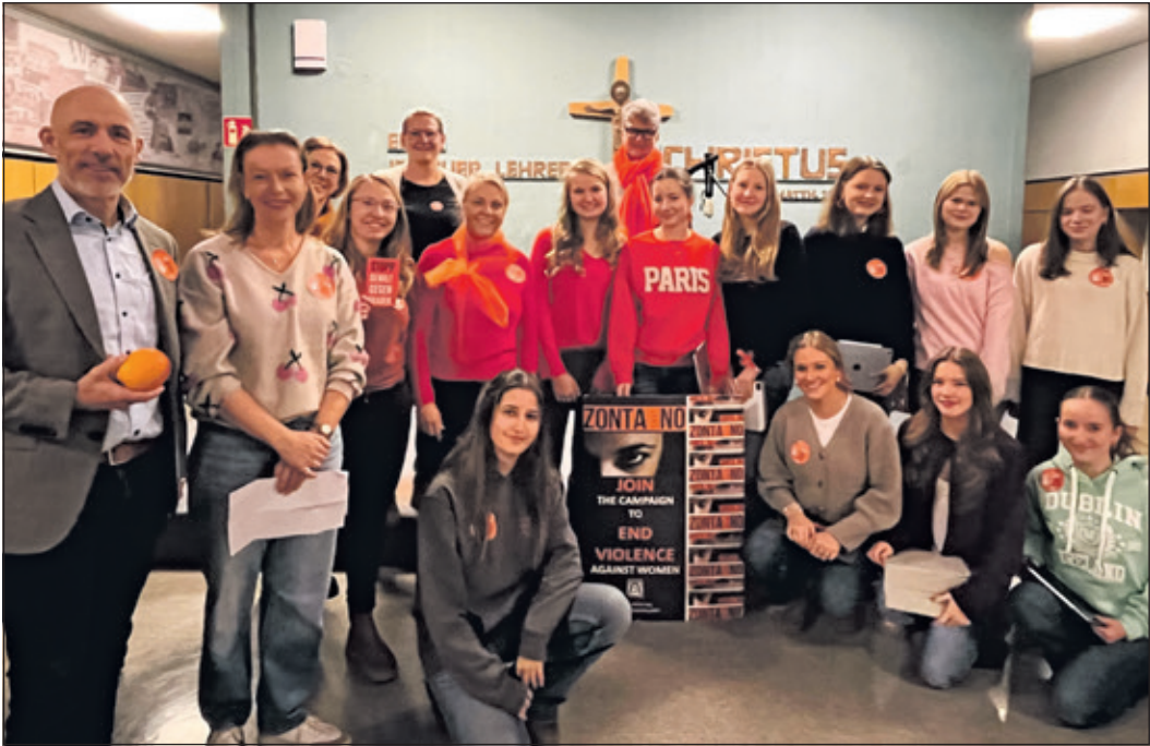
Das Organisationsteam des Aktionsteams an der SAS gegen Gewalt an Frauen

Königstein (kw) – Weltweit schließen sich jedes Jahr Frauen und Unterstützer zusammen, um ihre Stimme gegen Unterdrückung und Gewalt an Frauen zu erheben. Denn das Recht auf ein Leben frei von Angst und Gewalt steht jeder Frau und jedem Mädchen zu. Mit den Orange Days, einer seit 1991 bestehenden UN-Kampagne,