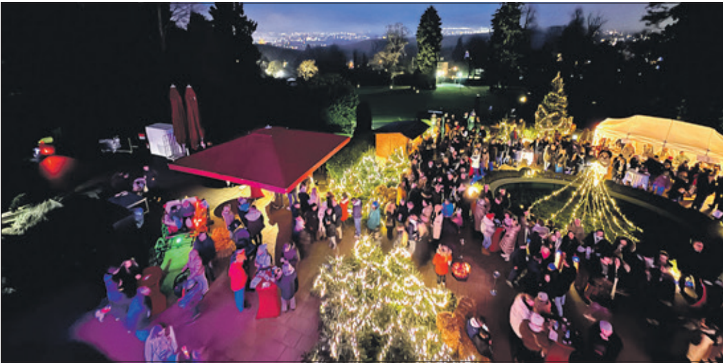
Tolle Abendstimmung mit bestem Blick auf die Skyline von Frankfurt.