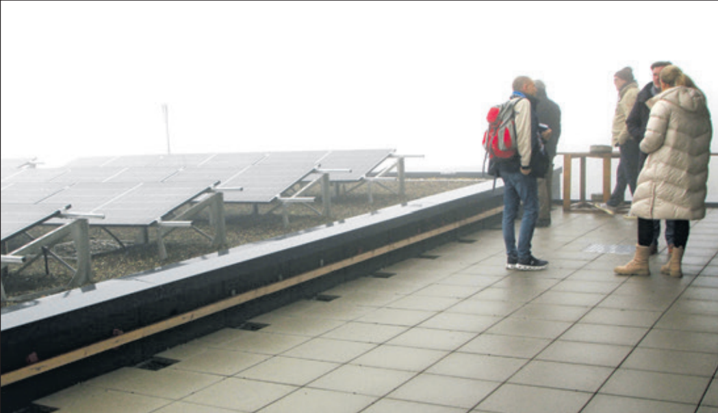
Bürgermeisterin Beatrice Schenk-Motzko und Architekt Christian Prokesch schauen sich die Photovoltaikmodule auf dem Dach an.