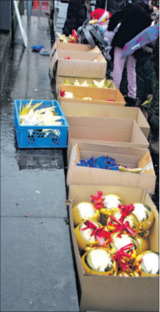
Für die Kinder lag ausreichend Weihnachtschmuck bereit.

Veranstaltungsabteilung der Stadt Königstein hatten wie immer eingeladen – am vergangenen Samstag durfte und sollte der Königsteiner Nachwuchs zwischen 11 und 14 Uhr den dort aufgestellten Baum verschönern. Der Kletterpark Kelkheim war mit geschultem Personal vor Ort: Sitzt der Gurt auch richtig, ist der Karabinerhaken eingerastet? Ja-wohl, jetzt konnte geschmückt werden, die Eltern hielten unten die Handykameras, die Kinder oben den Baumschmuck. Für das leibliche Wohl war auch gesorgt, Punsch oder heißer Orangensaft, Plätzchen und sonstige Leckereien gab es an der kleinen Hütte am Kapuzinerplatz. Den Kindern hat es offenbar gefallen, auch ohne Heißgetränke hatten die meisten knallrote Bäckchen, als sie wieder von der Hebebühne hinunter stiegen. Man kann davon ausgehen, dass die Hebebühnen in der Vorweihnachtszeit 2026 wieder aufgestellt werden!