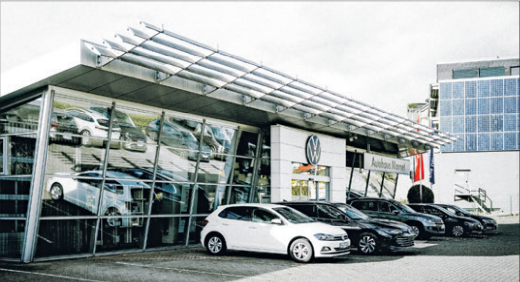
Im Rahmen der geschäftlichen Neuordnung schließt das Autohaus Marnet zum 31. Dezember seine Volkswagen-Niederlassung in der Wiesbadener Straße 68.

Königstein (Sc) – Dass am Volkswagen-Standort des Autohauses Marnet in der Wiesbadener Straße 68 wahrscheinlich eine Veränderung ansteht, ist schon lange in aller Munde – nun ist die Entscheidung gefallen: Die Liegenschaft neben dem italienischen Supermarkt wurde veräußert und der Volkswagen-Standort sieht einer Neuordnung entgegen. Wie das Autohaus Marnet bestätigt, wird der traditionsreiche Standort zum Jahresende 2025 geschlossen. Königstein bleibt jedoch Volkswagen Servicestandort und die Kompetenzen werden an einem Standort gebündelt: Im Zuge des Zusammenschlusses in der AVEMO verlagert Marnet den Vertrieb und die Werkstatteleistungen des Volkswagenbetriebes an den Audi-Standort in der Sodener Straße 1-3. Seit Januar 2023 bilden die Automobilhandelsgruppen Best, Gelder & Sorg, Göthling & Kaufmann und Marnet unter der gemeinsam gegründeten Holding AVEMO eine der stärksten nationalen Automobilhandelsgruppen in Deutschland. Durch den Zusammenschluss steht Kundinnen und Kunden seitdem eine Fahrzeugauswahl aus sieben Marken sowie ein dichtes Netz an Service-Standorten zur Verfügung