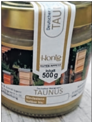
Honig aus lokaler Herstellung.