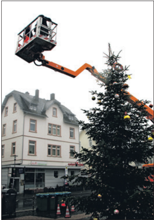
Ein bisschen Mut war schon erforderlich, wenn kind vom Hubsteiger aus seinen Weihnachtsschmuck selbst aufhängen wollte.