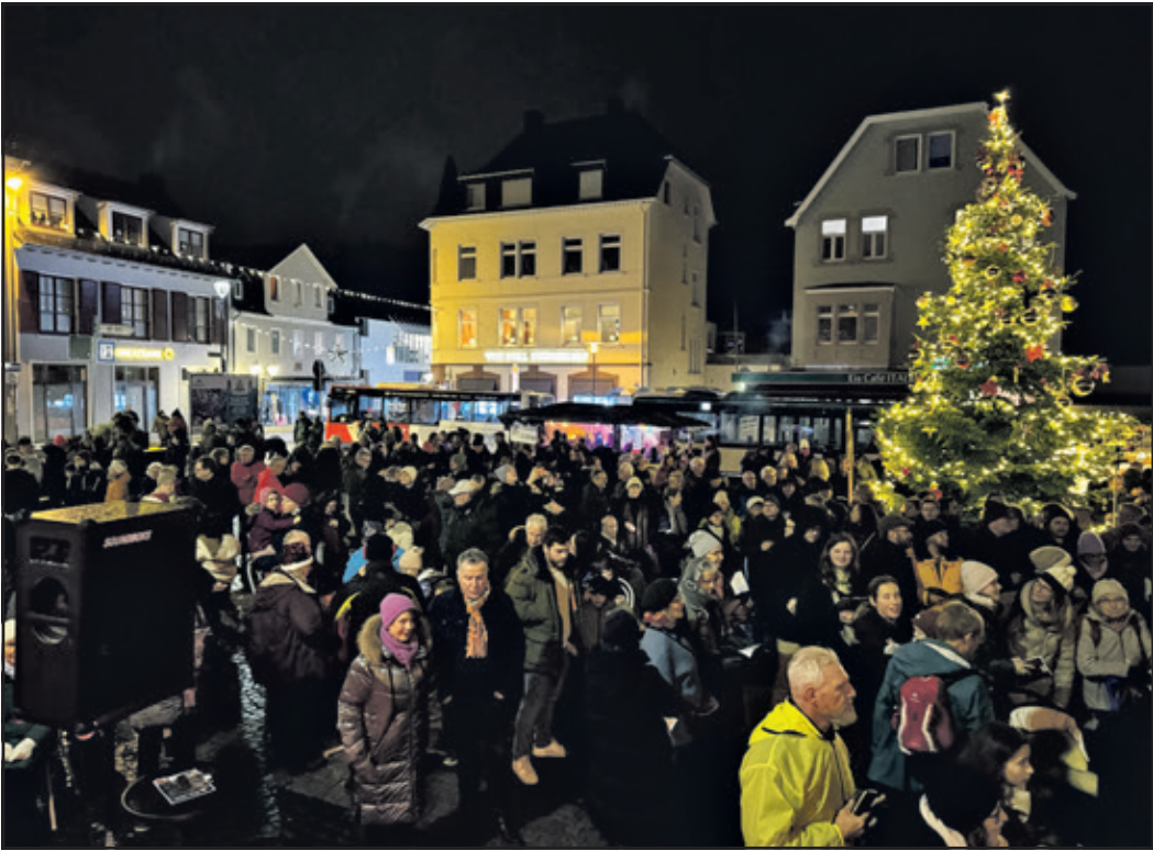
Der Kapuzinerplatz war mit den „Singbegeisterten“ gut gefüllt!

Weitere Informationen unter: die-singgemeinschaft.de