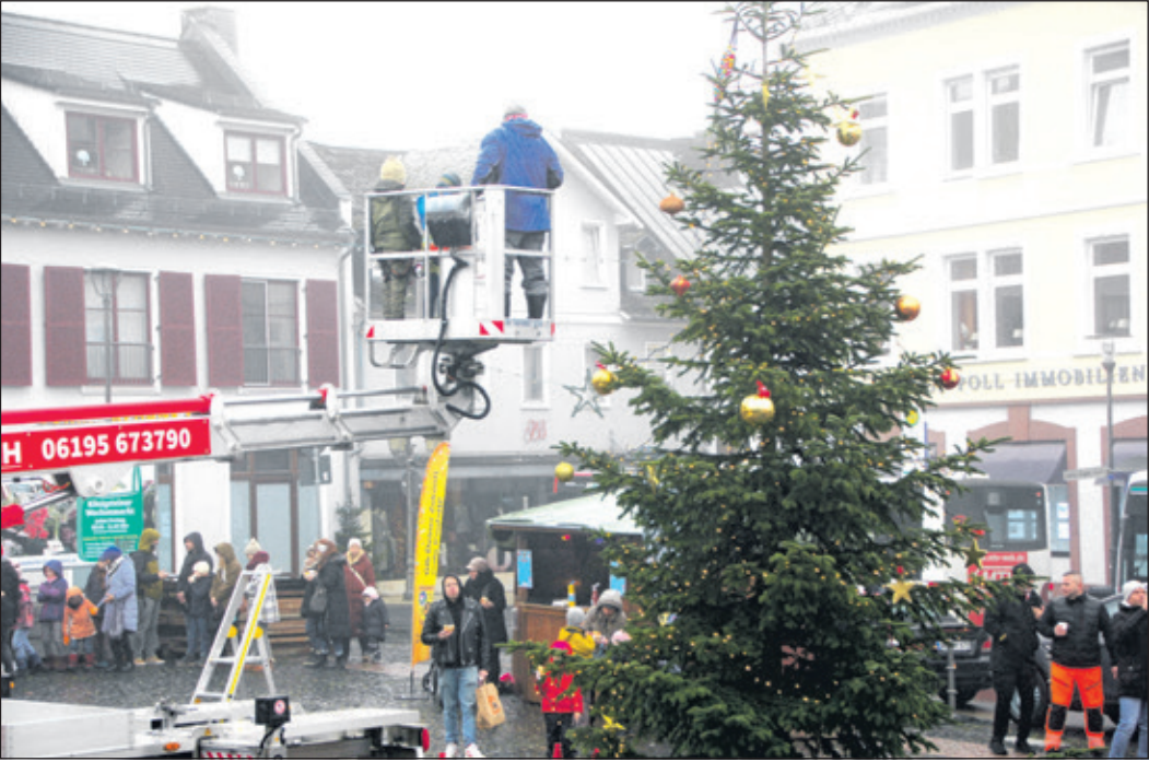
Auf die Hebebühne bei Wind und Wetter: Wegen des bisschen Nieselregens ließ sich ein echter Weihnachtsprofi das Baumschmücken nicht entgehen!

Königstein (iba) – Es war noch nicht einmal Dezember, aber Weihnachtsstimmung wurde auf dem Kapuzinerplatz trotzdem verbreitet. Mit großen Augen standen die Kinder geduldig in der Schlange, bis sie dran waren, dann ging es – ein Kind nach dem anderen – mit Hilfe zweier Hubsteiger hinauf bis zur Baumspitze, wo dann sorgsam der Weihnachtsbaumschmuck angebracht wurde. Manche Kinder wollten einen Stern, manche wollten eine Kugel, eines der Kinder schien zuerst mehr Interesse an dem Hund zu haben, der ebenfalls artig in der Schlange stand, bog dann aber im letzten Moment doch Richtung Hebebühne: Die Mutprobe war dann doch zu verlockend. „Toll, Du siehst aus wie ein Bergsteiger!“ Die Mama war sichtlich begeistert, der Sohn schnappte sich mit beherztem Griff einen Stern und stapfte dann auf die Hebebühne. Der Handwerker- und Gewerbeverein und die