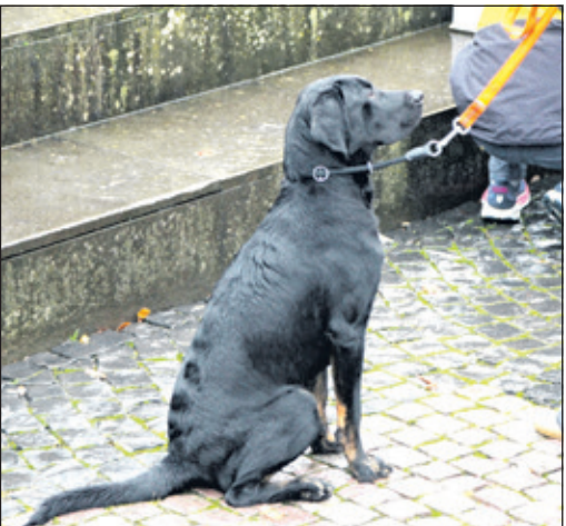
Während die Zweibeiner schmückten, mussten die Vierbeiner kurz warten!