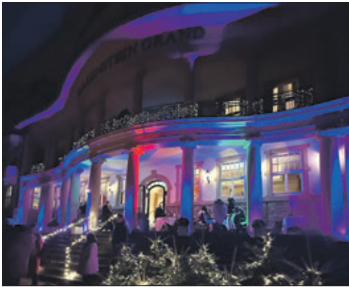
Das Falkenstein Grand erstrahlt in den schönsten Farben.