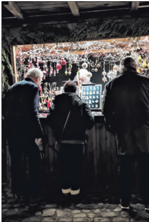
Ein Kronberger Stand auf dem Ballenstädter Weihnachtsmarkt

pfllegt. Tausende kamen damals erstmalig zum Weihnachtsmarkt nach Kronberg. Und die herzliche Aufnahme war der Anfang vieler Freundschaften, die die Idee der Städtepartnerschaft bis heute gemeinsam tragen. Wenn am Samstag, 6. und Sonntag, 7. Dezember der Kronberger Weihnachtsmarkt seine Tore in der Altstadt öffnet, erwartet die vielen Gäste am Stand des Partnerschaftsvereins Kronberg – Ballenstedt nicht nur eine große Auswahl kunsthandwerklicher Kostbarkeiten, sondern auch ein interessanter Austausch und zahlreiche persönliche Gespräche, denn, wie in jedem Jahr wird wieder eine Gruppe aus Ballenstedt vertreten sein. In dieser besinnlichen Zeit ist es auch diesmal für die Partnerstädte kein Markt wie jeder andere. Mehr denn je scheinen jedwede Zusammenkünfte ein unbedingtes Mittel zur Völkerverständigung zu sein, weil sich Vertrauen aufbaut und Beziehungen stärker werden. Ein wichtiges Fundament jetzt und erst recht für die Zukunft.