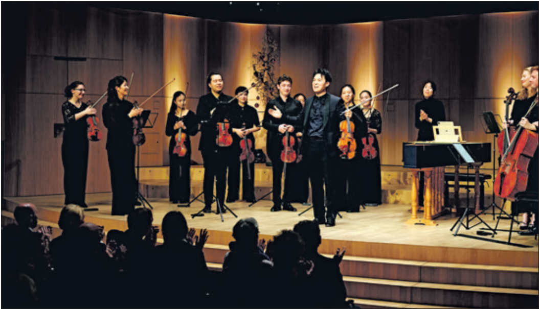
Stargeiger Ray Chen und das aus Studierenden der Kronberg Academy und der Hochschule für Musik und Darstellende Kunst Frankfurt bestehende Ensemble freuten sich über den begeisterten Applaus.