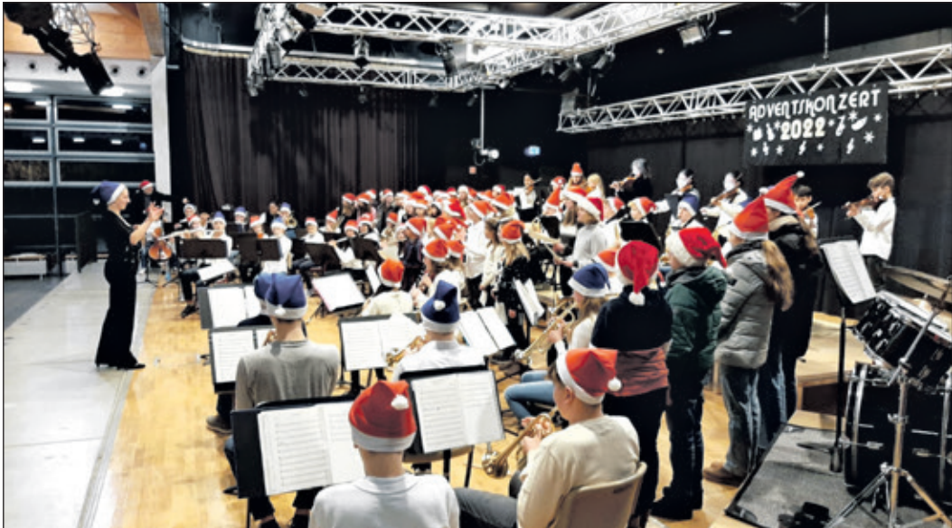
Selbst auf der großen Bühne wird es voll, wenn sich die Instrumentalensembles der AKS zusammenschließen.