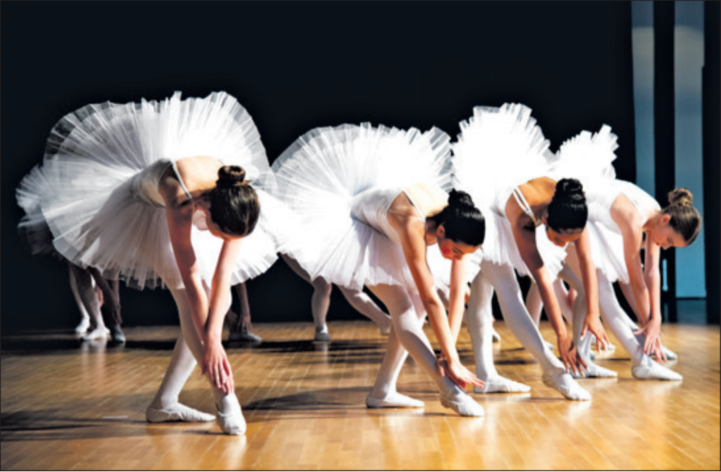
Auf elegante und anmutige Art und Weise schwebten die Tänzerinnen nahezu über die Bühne.