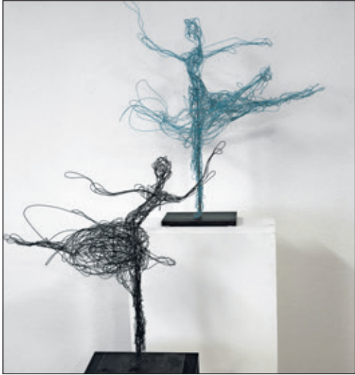
Tomasis Skulpturen aus Edelstahl und Stahl

Weitere Informationen gibt es im Internet unter www.henriette-tomasi.de , jederzeit können Termine auch telefonisch unter 0157-35378056 vereinbart werden.