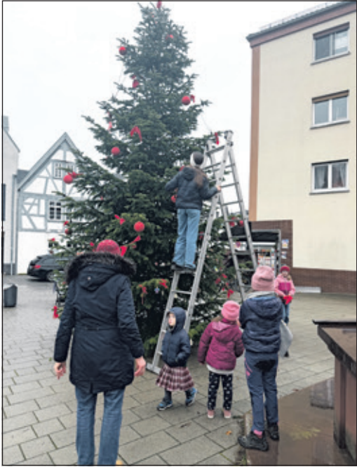
Der große Weihnachtsbaum am Dalles steht

Oberhöchststadt (kb) – Pünktlich zum ersten Adventswochenende wurde der große Weihnachtsbaum am Oberhöchstädter Dalles fest-