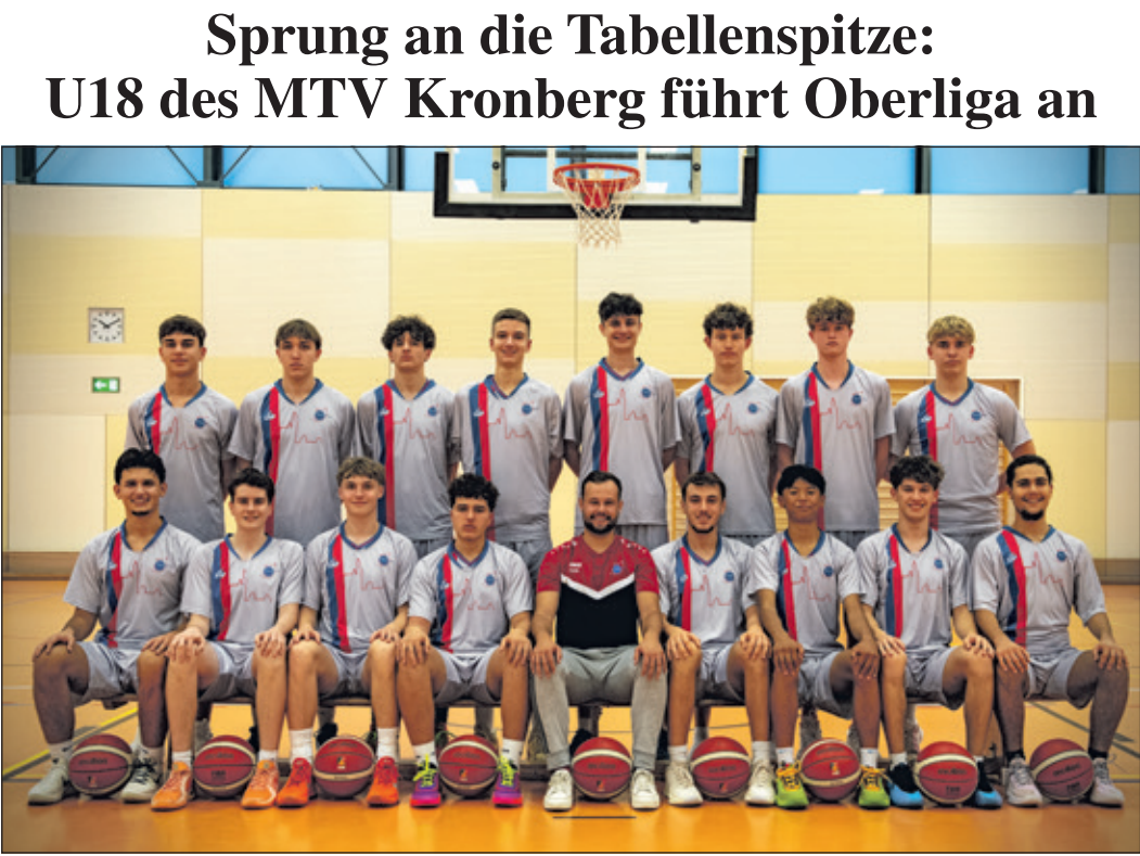
Die U18-Oberligamannschaft des MTV Kronberg