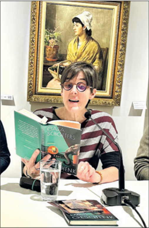
Die Bestseller-Autorin von „Trophäe“ stellt ihr neues Buch vor: „Das Geschenk“, in der Hauptrolle 20 000 Elefanten in Berlin.