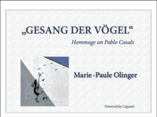
Dass das Wandgemälde eine Hommage an den Namensgeber des Casals Forum ist, daran erinnert dieses Schild.

Fortsetzung von S. 1 eingeladen, seit 18 Jahren tätig im Kultur- und Regionalmanagement und seit vier Jahren Projektleiter der „Route der Industriekultur Rhein-Main“. Er schrieb den zweiten Buchbeitrag mit dem Titel „Hüte, Häuser, HiFi – Designgeschichte im Hochtaunuskreis“.