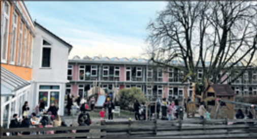
Der kleine Weihnachtsmarkt auf dem Außengelände der Kita.

Kronberg (kb) – Am Montag, 1. Dezember, fand am Nachmittag ein kleiner Weihnachtsmarkt auf dem Außengelände der Kita Arche Noah statt. Ehemalige, aktuelle und neue Eltern mit ihren Kindern fanden sich ein, um schöne selbstgemachte Dinge für die Weihnachtszeit zu kaufen. Bei warmen Getränken, leckeren Waffeln und angeregten Gesprächen verging die Zeit wie im Fluge. Den Gesamterlös spendet die Kita der Aktion Kinderzukunft.