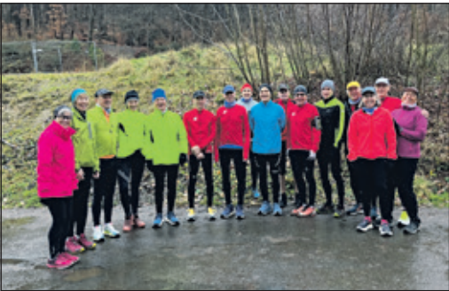
Die Läuferinnen und Läufer des MTV Kronberg

de 45 Minuten trafen sich die Sportlerinnen und Sportler wieder auf dem Parkplatz in Falkenstein, wo mit heißen Getränken und Selbstgebackenem der 38. Lauf seinen Abschluss fand. An dieser Stelle spricht der MTV ein herzliches Dankeschön an alle Helfer, die in irgendeiner Form am Drei-Berge-Lauf beteiligt waren, aus.