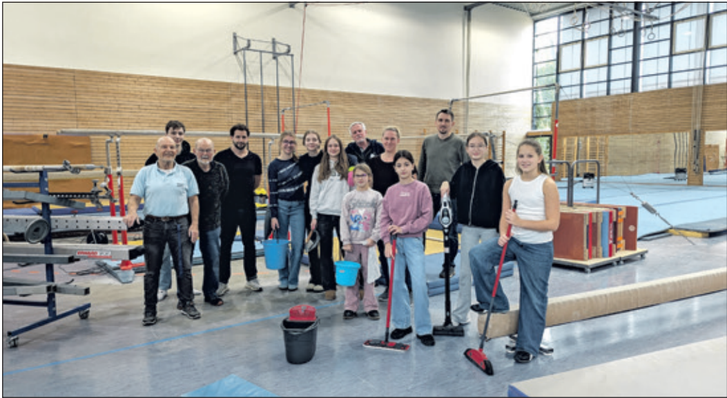
Das Putzteam ist stolz auf die geleistete Arbeit und freut sich über die frische Gerätehalle, die nun wieder mehr zur Nutzung einlädt.