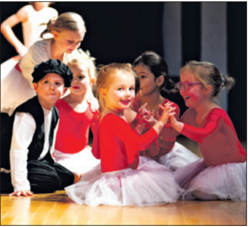
Auch die ganz Kleinen hatten ihre Momente und waren mit sichtlicher Freude dabei.