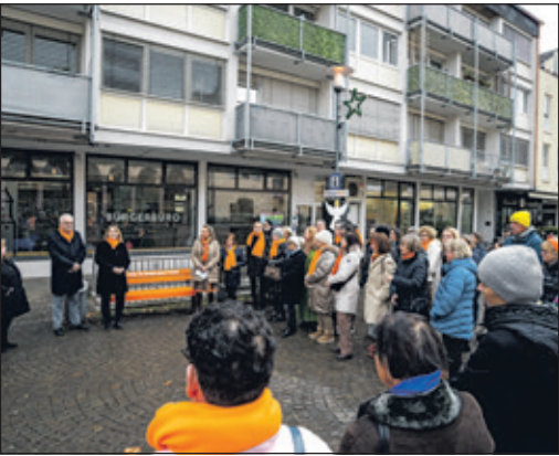
Eine große Zahl an Frauen und Männern hatte sich auf dem Berliner Platz eingefunden, um ein Zeichen gegen Gewalt an Frauen zu setzen.

Kronberg (kb) – 116 016 – bei den meisten Menschen hierzulande dürfte diese Notfallnummer sehr viel weniger hinterlegt sein, als es die 110 oder die 112 sind. Dabei kann es für Frauen und Mädchen überlebenswichtig sein, diese Nummer zu kennen. Denn wer die 116 016 wählt, der erreicht das Hilfetelefon „Gewalt gegen Frauen“. Frauen und Mädchen, die Opfer von Gewalt sind und Hilfe suchen, finden hier anonym und kostenfrei an 365 Tagen im Jahr Rat – und das rund um die Uhr und in 18 Sprachen. Wie dringend notwendig es ist, dieses Beratungsangebot des Bundesfamilienministeriums noch stärker publik zu machen, lässt sich an aktuellen Zahlen ablesen. Allein für das Jahr 2024 verzeichnet die gerade erst vorgestellte Polizeiliche Kriminalstatistik 266 000 Fälle von häuslicher Gewalt. In 70,4 Prozent der erfassten Übergriffe waren die Opfer weiblich. 132 Frauen, auch das ist der Statistik zu entnehmen, wurden im vergangenen Jahr von ihrem Partner oder Ex-Partner getötet, 59 Frauen und Mädchen wurden von Familienmitgliedern umgebracht. Die Zahlen sind nicht nur bedrückend, sondern in den zurückliegenden fünf Jahren auch signifikant