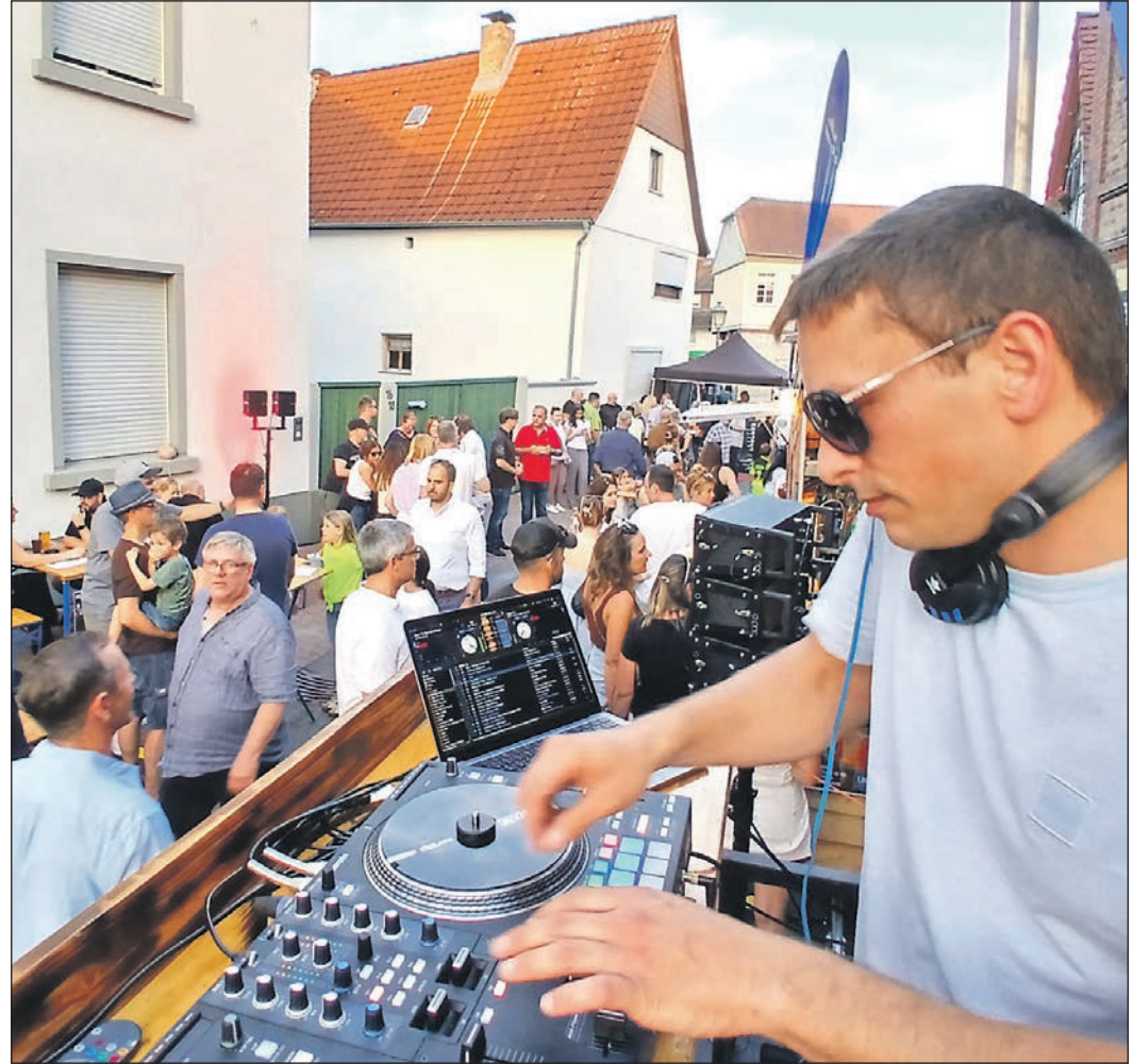
Erstmals stand vor der St.-Pankratius-Kirche keine Bühne, sondern sorgte ein DJ für Stimmung. Beim Publikum kam das vor allem zur späteren Stunde gut an.