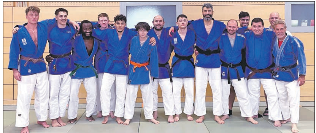
Mit zwei deutlichen Siegen beschloss die zweite Judo-Mannschaft der TG Schwalbach die Saison in der Oberliga.