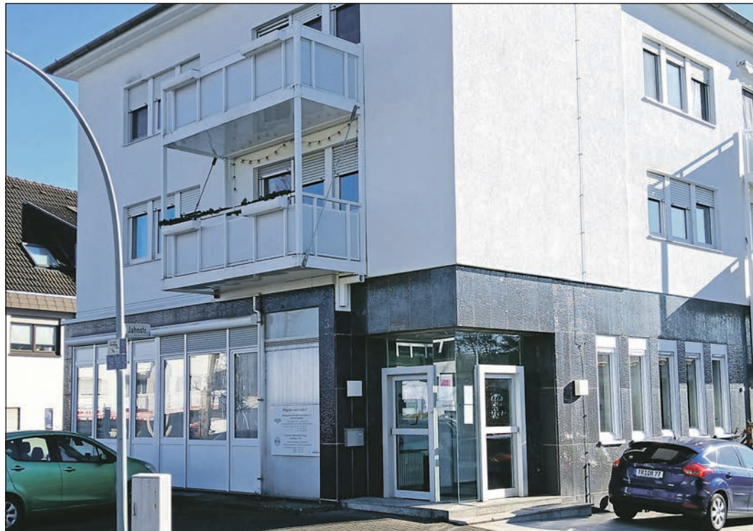
Die Kreistagsfraktion der „Linken“ hält das Vorgehen des Main-Taunus-Kreises bezüglich der Suchtberatungsstelle der AgS in Schwalbach für „völlig unverantwortlich“.

GALERIE DUBAI · Telefon: 06196 4021328 Schulstraße 1A, 65824 Schwalbach a. Ts. Inh. Herr Bengo