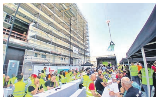
Direkt vor der Baustelle am Kronberger Hang feierten am vergangenen Donnerstag die Bauarbeiter und die Verantwortlichen der Firma „Maincubes“ das Richtfest des riesigen Rechenzentrums „FRA03“ auf dem ehemaligen Samsung-Gelände.