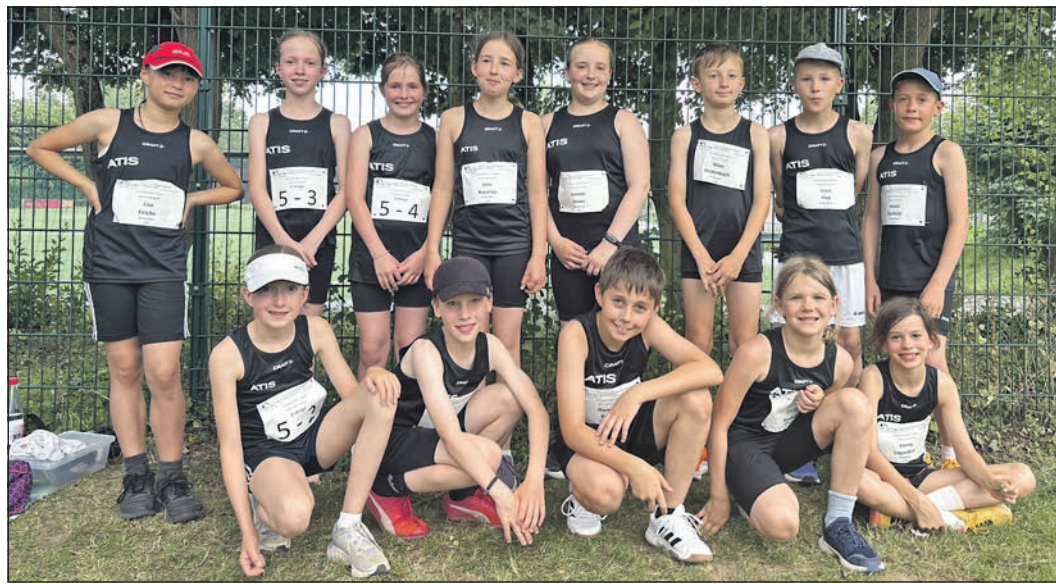
Das U12-Team der TG Schwalbach, die „Schwalben“, kamen auf Platz drei.

Mannschaften an der Reihe. Zu Beginn liefen die Mannschaften die 6x50-Meter-Staffel. Danach ging es zum Drehwurf und zum Stab-Weitsprung. Zum Abschluss stand noch die 6x600-Meter-Staffel auf dem Programm. Die „Schwalben“ der TG Schwalbach erreichten den dritten Platz, ganz knapp um einen Punkt hinter der zweiten Hattersheimer Mannschaft. Auf den geteilten sechsten Platz kamen die „Wildvögel“ – eine Startgemeinschaft der TGS mit TuRa Niederhöchstadt. Bei sommerlichen Temperaturen suchten die Kinder den Schatten und ein Wassereimer zum Kühlen stand auch immer parat. Pro Altersklasse dauerte der Wettkampf für die Kinder jeweils etwa drei Stunden.