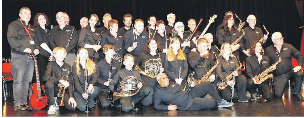
Beim jüngsten Besuch aus der französischen Partnerstadt Avrillé reiste auch das „Orchestre d'Harmonie“ der dortigen Musikschule mit nach Schwalbach.