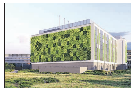
So soll „FRA03“ aussehen, wenn es im Frühjahr 2026 fertig ist. Grafik: Maincubes

Lob hatten die „Maincubes“-Verantwortlichen auch für die Kommunalpolitiker in Schwalbach und Hofheim. Die Realisierung des Projekts sei nicht zuletzt Ergebnis einer konstruktiven Zusammenarbeit mit den poli-