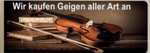
Wir kaufen Geigen aller Art an

Wir zahlen sofort den ermittelten Wert in BARGELD aus!