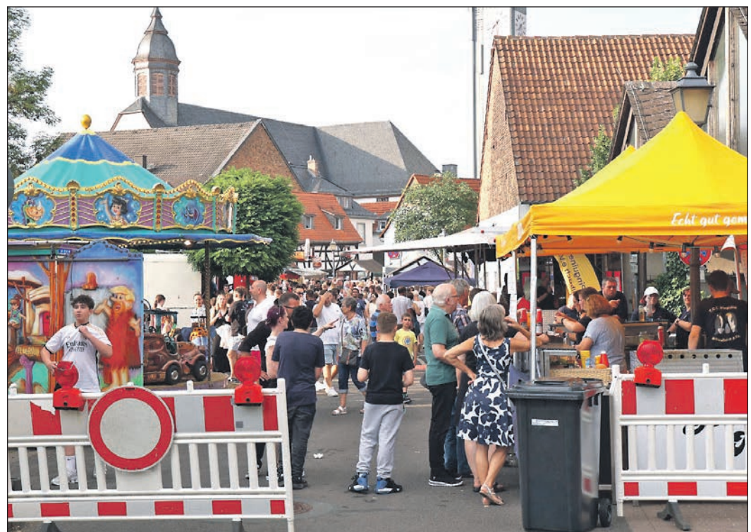
Am Samstagabend wurde es in der Sauererlenstraße richtig eng.