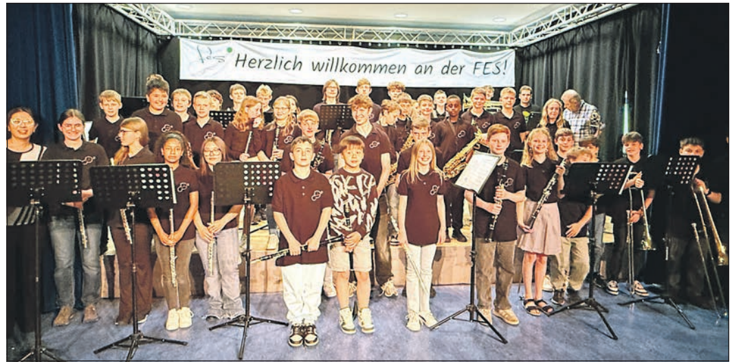
Schülerinnen und Schüler aller Jahrgangsstufen standen beim diesjährigen Sommerkonzert der Friedrich-Ebert-Schule auf der Bühne in der Aula.

Bad Homburger Woche · Friedrichsdorfer Woche Oberurseler Woche · Steinbacher Woche Kronberger Bote · Königsteiner Woche · Kelkheimer Zeitung Eschborner Woche · Schwalbacher Zeitung Sulzbacher Anzeiger · Bad Sodener Woche