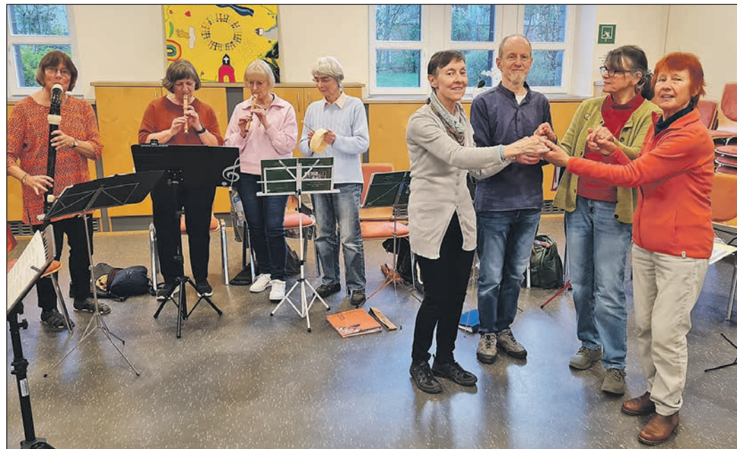
Gemeinsam im Takt vergangener Jahrhunderte: Das Blockflötenensemble „Wind-Spiel“ erweckt mit Klängen und Tänzen die Musik von John Playford zu neuem Leben.