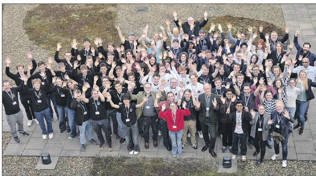
Die Schüler aller Teams und ihre Betreuer beim CanSat-Wettbewerb