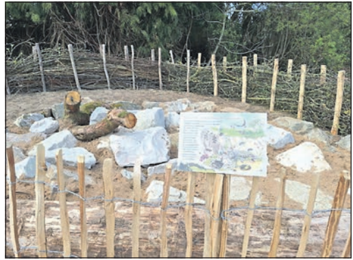
Das neue Sandarium am Plätzenberg ist nun fertiggestellt.

Bad Homburg (hw). Nicht nur wir Menschen erfreuen uns an den steigenden Temperaturen und der wieder aufblühenden Natur. Es beginnt auch überall zu summen und zu krabbeln. Wildbienen und andere Insekten und Kleintiere suchen nach Lebensraum und Nahrung. Die Stadt Bad Homburg hat durch den Betriebshof am Plätzenberg ein neues Sandarium errichten lassen, das nun fertiggestellt wurde. Dabei handelt es sich um eine offene Sandfläche mit Steinen und Gehölzen. Die lockere und offene Bodenstruktur bietet ideale Bedingungen für bodennistende Wildbienenarten, die dort ihre Nester anlegen können. Ein natürlicher, ungewaschener Sand in Verbindung mit lehmigem Boden ist eine der besten Nistmöglichkeiten für Wildbienen. Besonders geeignet sind Flächen in sonniger Lage, da Wildbienen Wärme benötigen, um aktiv zu sein. In Verbindung mit Totholz, von