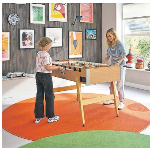
Kräftige Teppichfarben setzen lebendige Akzente und strukturieren den Raum.

(DJD). Teppiche beeinflussen die Wirkung von Wohnräumen stärker als oft angenommen. Sie sorgen für Wärme, reduzieren Trittschall und helfen, offene Grundrisse optisch zu strukturieren. Mit verschiedenen Teppichfarben lassen sich unterschiedliche Zonen innerhalb einer Wohnung gestalten, ohne bauliche Veränderungen vorzunehmen. Neben klassischen Bahnen bieten modulare Teppichfliesen, etwa von tretford, flexible Gestaltungsmöglichkeiten. Ein aktueller Trend ist auch das Teppich-Layering, bei dem mehrere Teppiche überlappend kombiniert werden. Unter dem Link designer.tretford.eu gibt es einen kostenlosen virtuellen Raumplaner. Teppich mit Naturfasern wie Schurwolle oder Ziegenhaar kann die Luftfeuchtigkeit regulieren und Staub binden, was das Raumklima positiv beeinflusst.