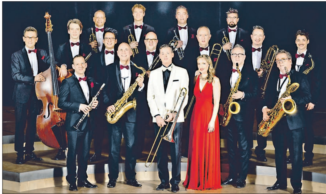
Unter dem Motto „Swing Forever“ kommt das Glenn Miller Orchestra in der letzten Mai-Woche in das Kurtheater.

„Ich möchte die Qualität bewahren und neue Akzente setzen – im Sinne des Glenn-Miller-Stils.“ Am Mittwoch, 27. Mai, können sich die Bad Homburger 20 Uhr davon überzeugen, dass die Übergabe gelungen ist: Im Kurtheater gastiert das Glenn Miller Orchestra mit dem neuen Programm „Swing Forever“. Eintrittskarten gibt es unter der Telefonnummer 06172-1783710 und an allen bekannten Vorverkaufsstellen. Wer zusätzliche Informationen sucht oder die Karten per Post geschickt bekommen möchte, kann sich unter der Telefonnummer 06185-818622 oder auf der Website www.glenn-miller.de informieren.