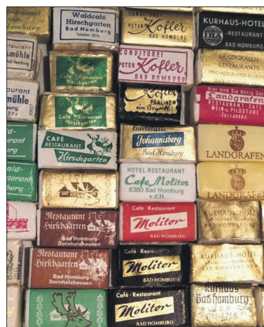
Nahaufnahme einer Sammlung nostalgischer, einzeln verpackter Zuckerwürfel mit historischen Werbeaufdrucken verschiedener Cafés und Restaurants, zum großen Teil aus Bad Homburg

Mit der Industrialisierung verändert sich die Rolle des Zuckers grundlegend. Er wird zum schnellen Energielieferanten einer arbeitenden Gesellschaft. Zucker liefert sofort verfügbare Kalorien – ein Vorteil in einer Zeit, in der körperliche Arbeit den Alltag bestimmt. Damit wandert er aus den exklusiven Räumen der Höfe in die bürgerliche Welt. Silberne Zucker Dosen, verschließbare Gefäße und feines Gerät zeugen von dieser neuen Tischkultur. Wie aufwendig sein Gebrauch zuvor war, zeigt der Zuckerhut. Als massiver Kegel musste er mit großen, schweren Zuckerzangen unter erheblichem Kraftaufwand zerteilt werden. Erst mit der Erfindung des Zuckerwürfels wird er handlich, hygienisch und alltagstauglich. Zahlreiche Zuckerwürfel aus lokalen und überregionalen Cafés veranschaulichen, wie sehr sich dieses kleine Format durchgesetzt hat. „Der Zucker soll in kleinen, handlichen Stücken bereitstehen“, meinte der Erfinder des Zuckerwürfels Jacob Christoph Rad 1843. Mit der Zuckerrübe beginnt um 1800 eine neue Epoche und sie führt direkt nach Seulberg. Entscheidenden Anteil daran hat der aus einer Hugenottenfamilie stammende Naturwissenschaftler Franz Carl Achard, der die industrielle Zuckergewinnung aus Rüben vorantreibt. „Was einst aus Übersee kam, wächst