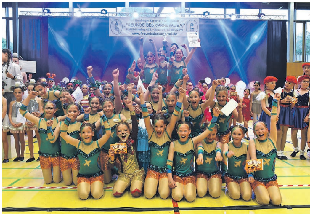
Mit Präzision, Ausdruck und spektakulären Hebungen begeistern die Tanzgruppen beim FdC-Turnier das Publikum – ein farbenfrohes Zusammenspiel aus Sport, Kreativität und Teamgeist.

Auch bei den Gardegruppen wurden alle drei Altersgruppen prämiert. Bei den Kleinsten von sechs bis 10 Jahren gewannen die Blue Twinkles vom Glauberger SKC vor der 1. Jugendgarde vom TV Sterbfritz und den Sweet Lions der Eschbäjer Zuckerreube.