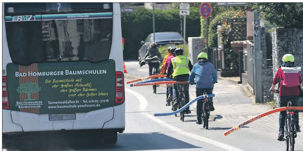
Das Fahren mit einer Nudel im Gepäck auf der Dietigheimer Straße zeigt, welchen Platz ein Fahrrad benötigt und dass es für einen Bus eng wird.

Auf der Rückfahrt von der Höhestraße zur Saalburgstraße hat die Fahrt mit der Nudel klar illustriert, dass der dort eingezeichnete Radfahrstreifen viel zu schmal ist. Denn auch hier steht die Schwimmnudel deutlich über den Radfahrstreifen hinaus, so dass ein Überholen mit einem sicheren Seitenabstand nur bei einem Fahrspurwechsel möglich ist. Tatsächlich fahren aber fast alle Fahrzeuge an Rädern ohne Nudel direkt an der Linie entlang, was einem Überholabstand von rund 70 Zentimetern entspricht.