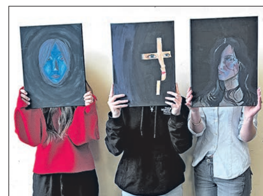
Zwischen historischen Meisterwerken und jugendlicher Selbstbefragung: Schülerinnen der Humboldtschule zeigen eindrucksvolle Selbstporträts im Museum Malerkolonie in Kronberg.