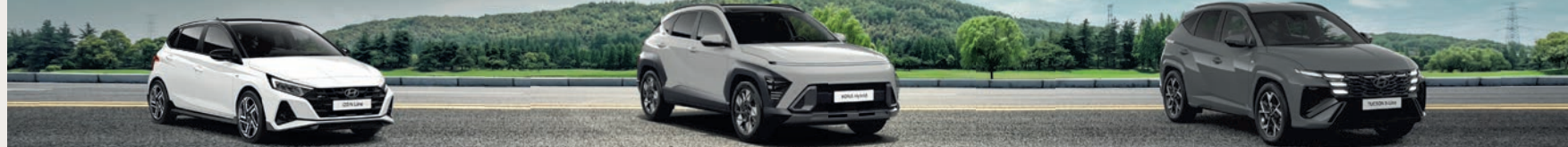
Abb. zeigen Sonderausstattung

Hyundai i20 Blackline 1,0 Benzin 66 kW (90 PS), Neuwagen Top-Ausstattung inkl.