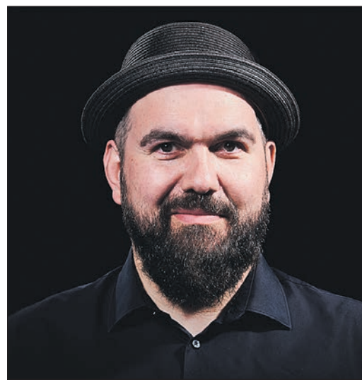
Wenn aus spontanen Ideen ganze Geschichten werden: Im Rahmen des Late Night Shopping verwandelt Shaggy Schwarz gemeinsam mit dem Improtheater Fulda die GALERIA in eine Bühne für überraschendes Theater ohne Drehbuch.

burg. So wird der 30. April in der GALERIA Bad Homburg zu mehr als einem verlängerten Einkaufstag. Er wird zu einem lebendigen Beispiel dafür, wie viel Atmosphäre entstehen kann, wenn regionaler Handel, Genuss und Kultur aufeinandertreffen.