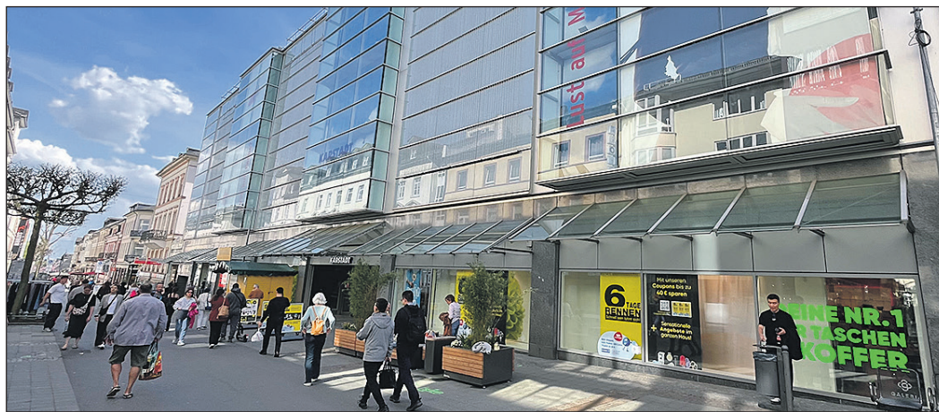
Hier wird Einkaufen zum Event: Aktionen, Shows und Mitmachangebote sorgen beim Late Night Shopping am Donnerstag, 30. April, für besondere Momente bei GALERIA Bad Homburg. Bei Sekt, Tastings und süßen Spezialitäten können Besucher nicht nur tolle Schnäppchen ergattern, sondern auch entspannt verweilen und probieren.