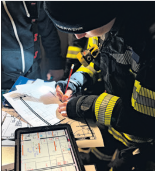
Kameraden der Freiwilligen Feuerwehr besuchten die Baustelle der neuen Feuerwache.

„Es ist beeindruckend zu sehen, wie sichtbar der Fortschritt auf der Baustelle ist“, freut sich Marc Bauer, Pressesprecher der Bad Sodener Feuerwehr. „Mit jedem Bauabschnitt nimmt die künftige Feuerwache weiter Form