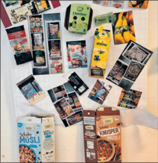
Diese Fairtrade-Produkte haben die Kita-Kinder in Geschäften entdeckt.

Bad Soden (bs) – Der Erste Sodener Schwimm-Club 1927 e.V. bietet zwei Technikurse „Kraulschwimmen“ für Erwachsene an. Beginn ist am Dienstag, 27.1. bis 24.2. (kein Kurs am 10.2.), jeweils von 20.30 bis 21.15 Uhr – 4 mal in der Schwimmhalle der Int. Schule Sindlingen. Weitere Informationen zu beiden Kursen finden Interessierte unter www.essc-online.de oder E-Mail: schwimmsport@essc-online.de