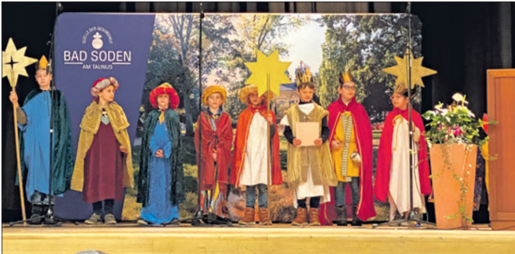
Der traditionelle Besuch der Sternsinger auf dem Neujahrsempfang.

An der einen oder anderen Stelle wurde gefachsimpelt und es ist zu wünschen, dass viele neue Unterstützerinnen und Unterstützer für die engagierten Vereine gewonnen werden konnten, denn angesichts der angespannten politischen Weltlage kann ein bisschen mehr „Zusammenrücken“ und Gemeinsamkeit durchaus wünschenswert sein!