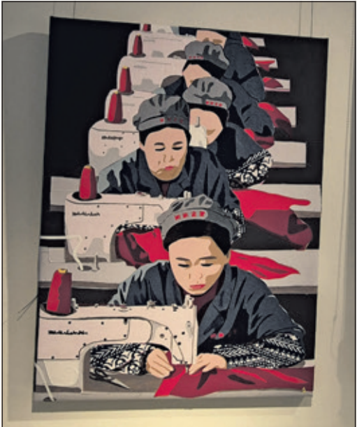
Massenproduktion als Thema.

In direktem Bezug dazu steht der Titel des Bildes „Nicht systemrelevant“, welches eine Reihe Näherinnen zeigt, die in einer chinesischen Fabrik beschäftigt sind. Es öffnet die Augen dafür, wie unsinnig Berge von Klamotten produziert werden, die in unserer schnelllebigen Zeit schon bald im Müll lan-