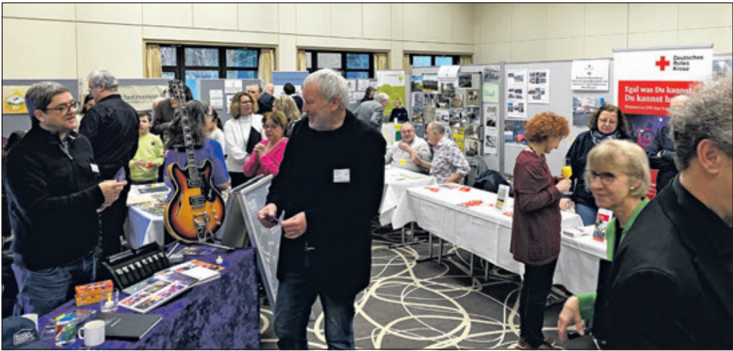
Blick auf die mehr als fünfzig Informationsstände im Foyer des H+ Hotels.