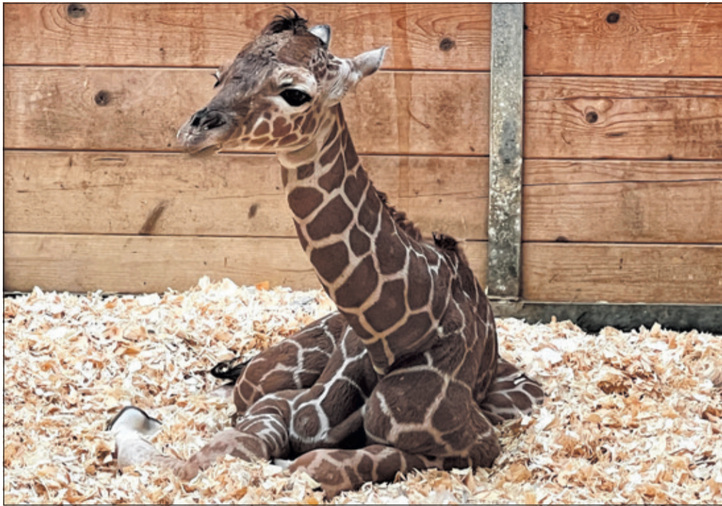
Netzgiraffenkalb „Mumbi“ im Opel-Zoo, einen Tag alt