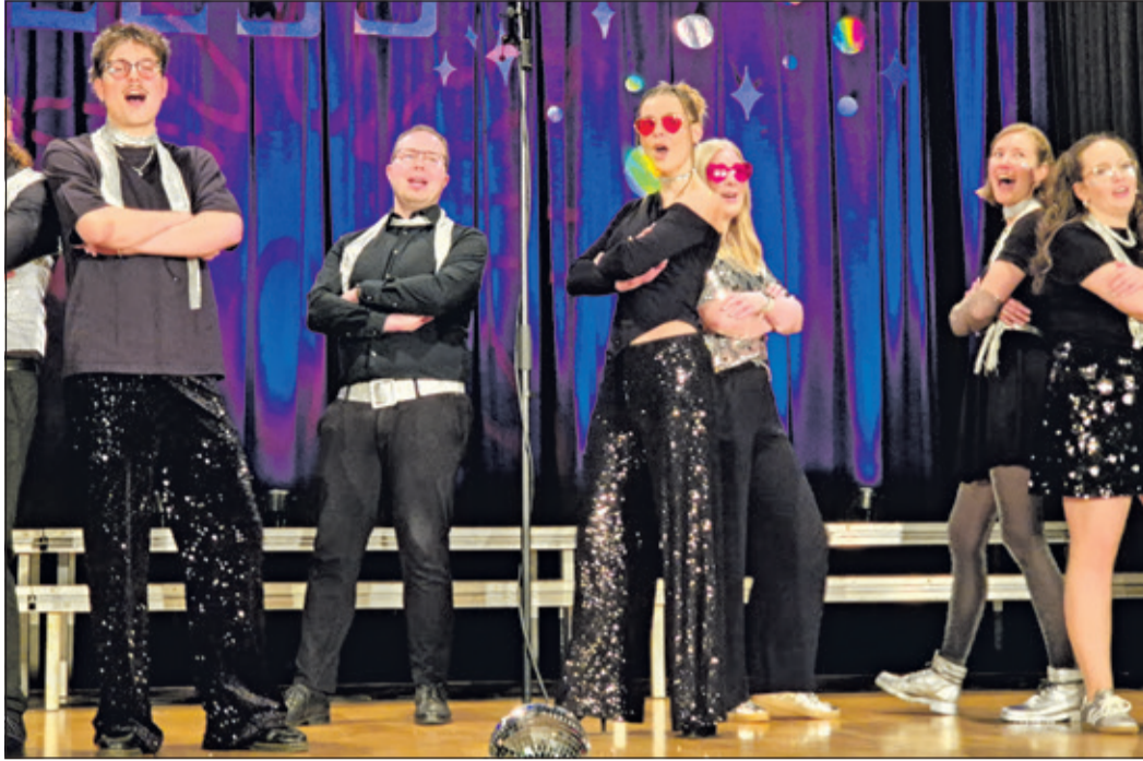
Leidenschaftlich und mit einer gehörigen Portion „Spaß am Auftritt“ waren die Chormitglieder auf der Bühne in Aktion.

Neuenhain (es) – Aus dem Foyer war mehrmals lautes Klatschen und die La-Ola-Welle zu hören. Drinnen stieg die Spannung. Das zweite Tageskonzert der Jugendchöre JUKA und JUVOKAL hat nochmals zahlreiche Besucher angezogen, nachdem die 16 Uhr-Vorstellung bereits ausverkauft war. Die Klänge aus dem Foyer zeugten von der vollen Energie und Begeisterung, die die Jugendlichen nochmals aufbringen wollten.