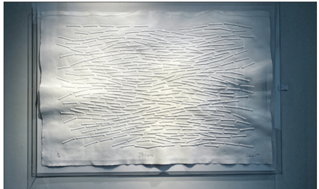
Mit seinen „Nagelbildern“ wurde Günther Uecker weltberühmt.

In der Ausstellung zu sehen ist auch Ueckers letztes Werk. Mit dem Titel „Lichtschauer“ hat er zwei zusammengehörende Werke geschaffen, die – das eine ganz weiß, das andere tief-schwarz – anmuten wie eine Auseinandersetzung des Künstlers mit Tag und Nacht. Diese sensationellen, großflächigen Werke wurden