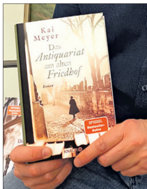
Das Buch ist in jeder gut sortierten Buchhandlung erhältlich.

Sein Roman „Das Antiquariat am alten Friedhof“ spielt, wie sollte es anders sein, in einem Antiquariat. Hier haben sich fünf Freunde (vier Herren und eine Dame) zusammengefunden und ein Geschäftsmodell entwickelt, das sich auf den Raub seltener, okkultur Bücher und deren Weiterverkauf gründet. Dazu muss man wissen, dass das Thema „Okkultismus“ in den 30er Jahren eine Renaissance erlebte und die Menschen „verrückt“ nach entsprechender Literatur waren. Allerdings legt sich das Quintett mit Mächten an, die nicht wirklich gut für sie sind. Eine Figur namens Aleister Crowley