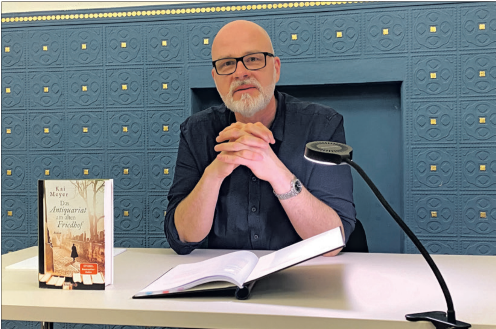
Bestsellerautor Kai Meyer las im Badehaus aus seinem neuesten Roman „Das Antiquariat am alten Friedhof“ und nahm die Zuhörer mit in die okkulte Welt der 30er- und 40er-Jahre des vergangenen Jahrhunderts.

Bad Soden (Sc) – Am Mittwochabend vergangener Woche war Bestsellerautor Kai Meyer im Kulturzentrum Badehaus mit einer Lesung aus seinem aktuellen Roman „Das Antiquariat am alten Friedhof“ zu Gast. Der Roman ist der vierte Teil einer Reihe von Kriminalromanen, die alle im ehemaligen „Graphischen Viertel“ in Leipzig angesiedelt sind. Zwar haben die Romane den gleichen Handlungsort, sie sind jedoch, was die Story betrifft, unabhängig voneinander.