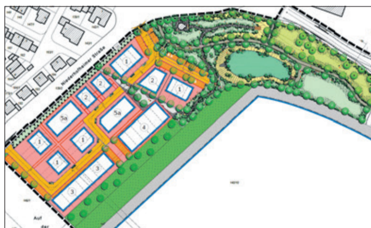
Das neue Wohngebiet wird eine „Plus-Energie-Siedlung“.

Die Gebäude sind entsprechend dem Energiekonzept im Passivhausstandard zu errichten und mit Luftwärmepumpen sowie Photovoltaikanlagen (PV) auszustatten. Auch auf den Carportanlagen sind PV-Anlagen vorgesehen. Zur Sicherstellung der energetischen Vorgaben ist bei der Stadt eine Bürgschaft oder Kautions in Höhe von 50 Euro je Quadratmeter Bruttogeschossfläche zu hinterlegen. Zudem besteht die Verpflichtung, die Gebäude innerhalb von drei Jahren fertigzustellen. Die Vergabe erfolgt im Rahmen eines Bieterverfahrens und ist in insgesamt sechs Lose auf-