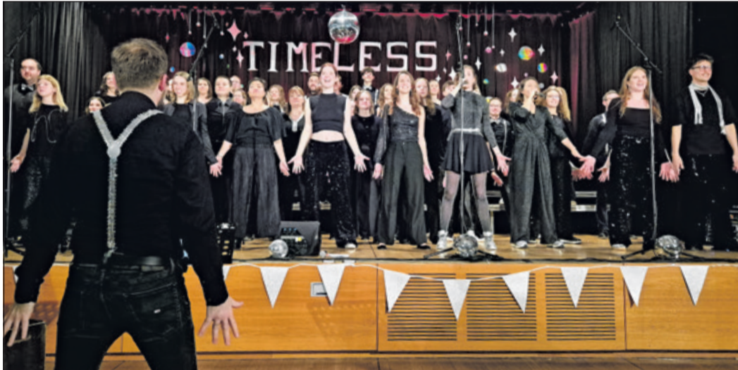
Der Rhythmus, wo man mit muss ...

siedel mit den Jugendlichen ist es, den musikalischen Ausdruck mit gezielter Körpersprache zu unterstreichen. So war jeder Song auch für die Gäste im Saal ein Hör- und Seherlebnis. Da alle Beiträge auswendig gesungen wurden, war der Körper frei für die Bewegung. Das kam so leicht daher, doch dahinter steckt eine disziplinierte Chorarbeit. Ständig entstanden neue, ausdrucksstarke Bilder. Aufeinander zugehen, sich abwenden, zwei Gruppen sangen sich zu, Einzelne traten zum Solo hervor, neue Formatierungen entstanden, mit bewegten Händen verdeutlicht. Dieses miteinander Agieren wurde besonders bei dem Song von den Dire Straits, „Brothers in Arms“, dargestellt. Der Song handelt von der Sinnlosigkeit der Kriege. Die volle Kon-