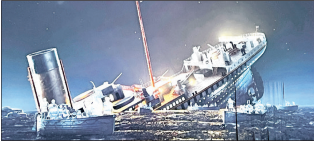
Nur 706 Menschen überlebten den Untergang der Titanic. Die meisten Toten waren Passagiere der Dritten Klasse.