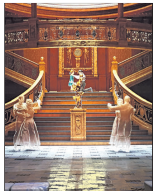
Die Besucher erleben Szenen, wie sie sich auf dem Ozeanliner zugetragen haben könnten.

tanic frei erkunden – jedes Deck, jede Kabine, jede Lounge. Eine interaktive Zeitreise, die Nähe schafft zu einem Schiff, das längst Geschichte ist und doch bis heute fasziniert. Ausgestattet mit VR-Brille und Headset begibt sich der Besucher auf einen Zeitreise, beginnend bei dem Wrack auf dem Meeresboden in einer Tiefe von 3.800 Metern. Viel Zeit bleibt dem Schiff nicht mehr. Das Wrack der Titanic wird von einer Bakterie namens Halomonas Titanicae verzehrt, die dazu führt, dass die gesamte Oberfläche des Wracks mit Sta-