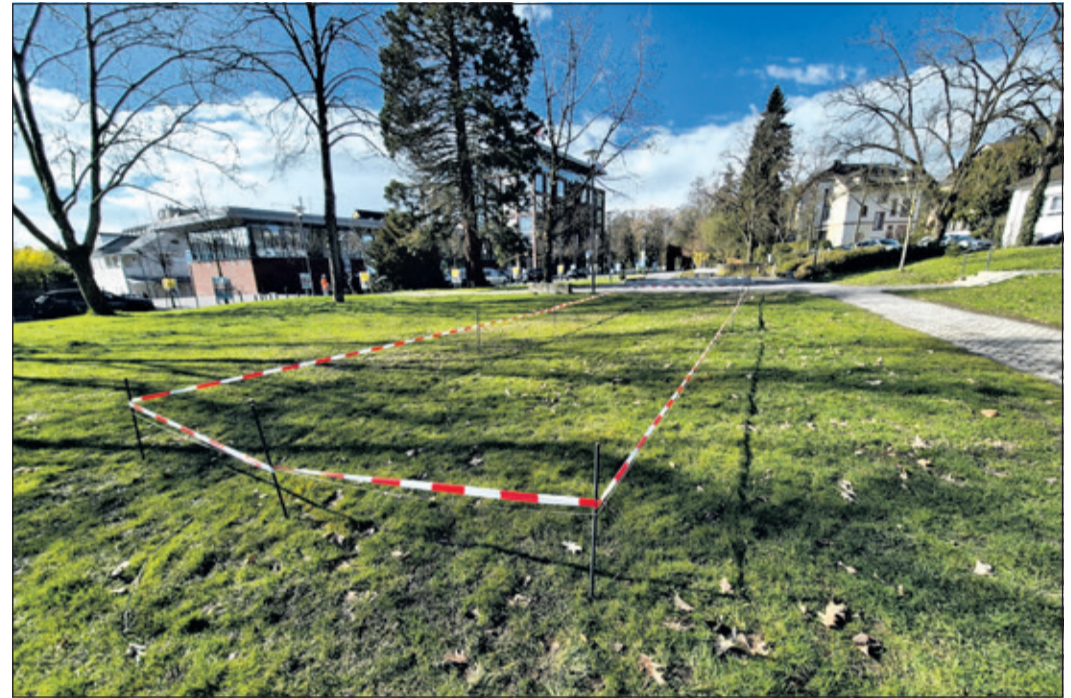
Im Neuen Kurpark sind die Planungen für eine Boulebahn angelaufen.

Bad Soden (bs) – Im Neuen Kurpark haben in dieser Woche die Planungen für eine neue Boulebahn begonnen. Die Anlage ist ein weiterer Baustein zur Umsetzung des Stadtentwicklungskonzepts „Bad Soden am Taunus 2030“, das vorsieht, den Park schrittweise zu einem Bürger- beziehungsweise Mehrgenerationenpark weiterzuentwickeln. Bereits umgesetzte Maßnahmen wie die Erweiterung des Kinderspielplatzes oder die Umgestaltung der Hochfontäne zu einem „Lesekreis“ werden von den Besucherinnen und Besuchern sehr