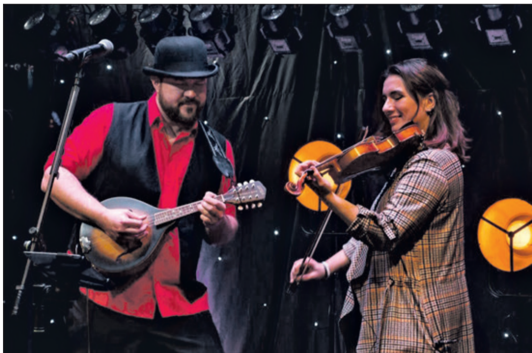
„Port & Sherry“ sind zu Gast beim Irischen Abend am Samstag, 25. April 2026. Foto: „Port & Sherry“

Bad Soden (bs) – Die Irischen Abende an der Kulturscheune (Zum Quellenpark 42) sind längst fester Bestandteil des Bad Sodener Veranstaltungskalenders. Am Samstag, 25. April, steht ab 18 Uhr die Musikgruppe „Port & Sherry“ mit ihrem mitreißenden irischen Repertoire auf der Bühne und sorgt für authentische Pub-Atmosphäre. Bei den beliebten Irischen Abenden in Bad Soden stimmt einfach alles: Neben stimmungsvoller Live-Musik dürfen natürlich auch die passenden Getränke nicht fehlen.