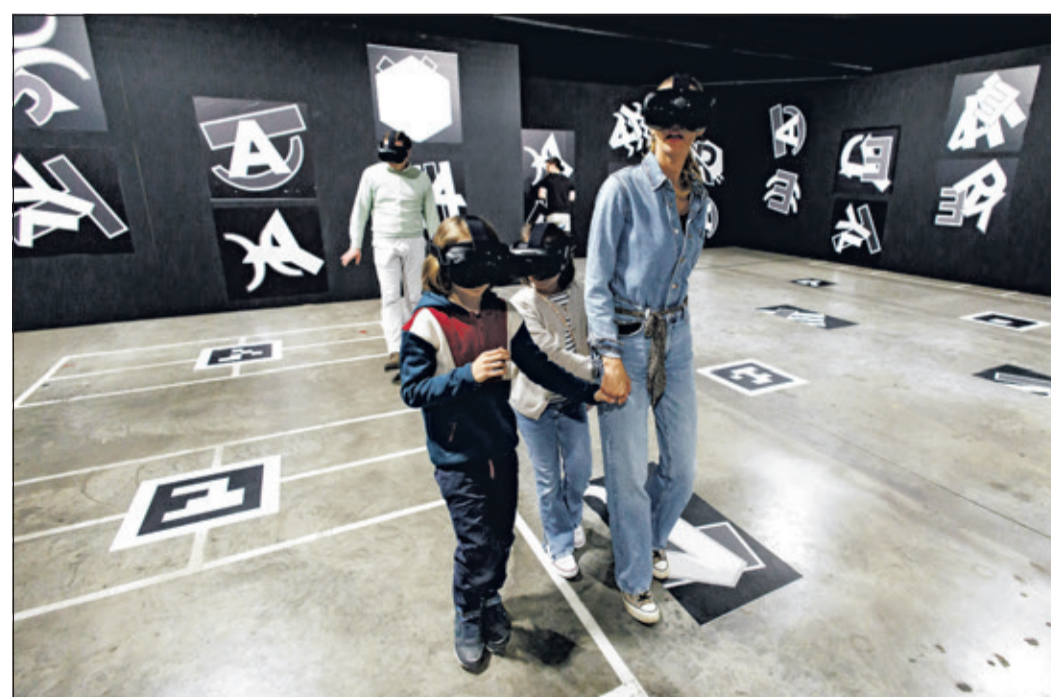
Im Metaversum wandelt man durch die Gänge der Titanic, lauscht den Gesprächen der Passagiere und kann einen Blick über die Reling werfen.

Im immersiven Showroom entfaltet sich schließlich das gesamte Drama: In 360-Grad-Projektionen erleben die Besucher die Geschichte der Titanic von ihrer Konstruktion bis zum Untergang in der Nacht vom 14. auf den 15. April 1912. Im Mittelpunkt steht da-