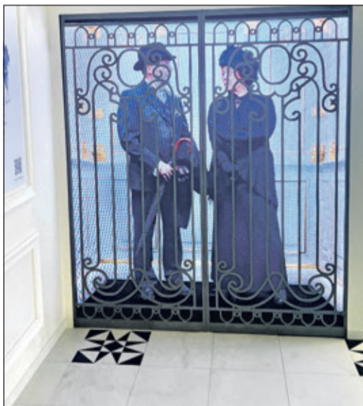
Vier Fahrstühle gab es auf der Titanic. Einer davon wird in der Ausstellung virtuell wieder „in Betrieb“ genommen.

Frankfurt (ju) – Das Meer ist schwarz wie Tinte. Kein Stern glitzert am Himmel. Mit voller Geschwindigkeit pflügt die Titanic durch die bleierne See. Höchstgeschwindigkeit (21-22 Knoten = 37 km/h) und die Warnungen anderer Schiffe, bezüglich der Sichtung von Eisbergen, ignorierend. Kapitän Edward J. Smith hatte sich bereits in seine Kajüte zurückgezogen. „Eisberg voraus“ hallt es plötzlich durch die Nacht. 1 Minute und 7 Sekunden später kommt es gegen 23.40 Uhr zur Kollision. Schnell wird klar: Das „unsinkbare“ Schiff sinkt. Eisige Kälte frisst sich durch Holz und Stahl, Schreie zerreißen die Nacht. Menschen klammern sich an die Reling. Gepäckstücke treiben im Wasser, während sich der größte Ozeanliner seiner Zeit langsam, unausweichlich neigt. In den frühen Morgenstunden des 15. April 1912 versinkt die Titanic im Nordatlantik – und mit ihr über 1.500 Menschen. Ein Mythos ist geboren, aus Hoffnung wird Horror, aus Fortschrittsglaube eine der größten Tragödien der Menschheitsgeschichte.