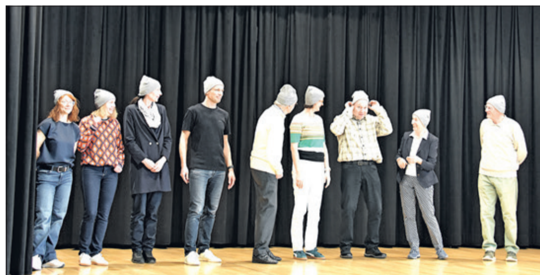
Sport hat auch viel mit guter Laune zu tun – Hauptsache, die Mütze sitzt!