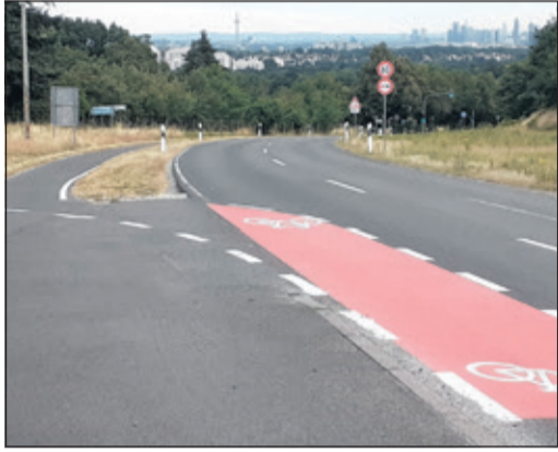
In der dunklen Jahreszeit könnte dieser Weg sicherer sein.