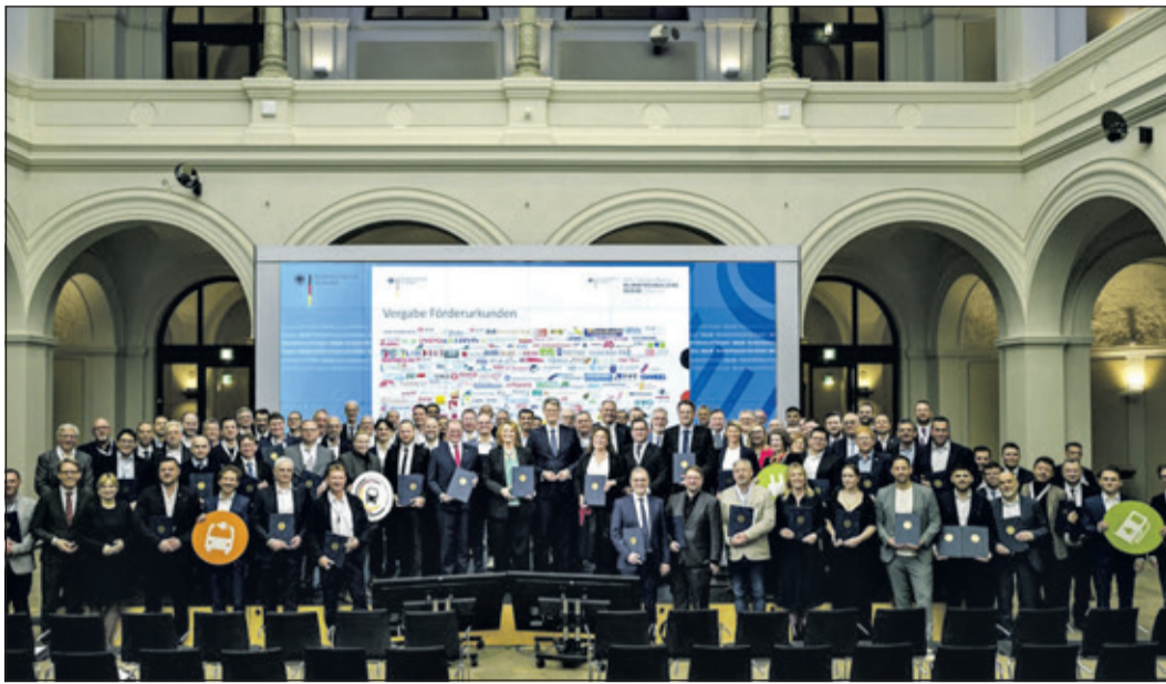
Übergabe von Förderurkunden durch Bundesminister Patrick Schnieder.