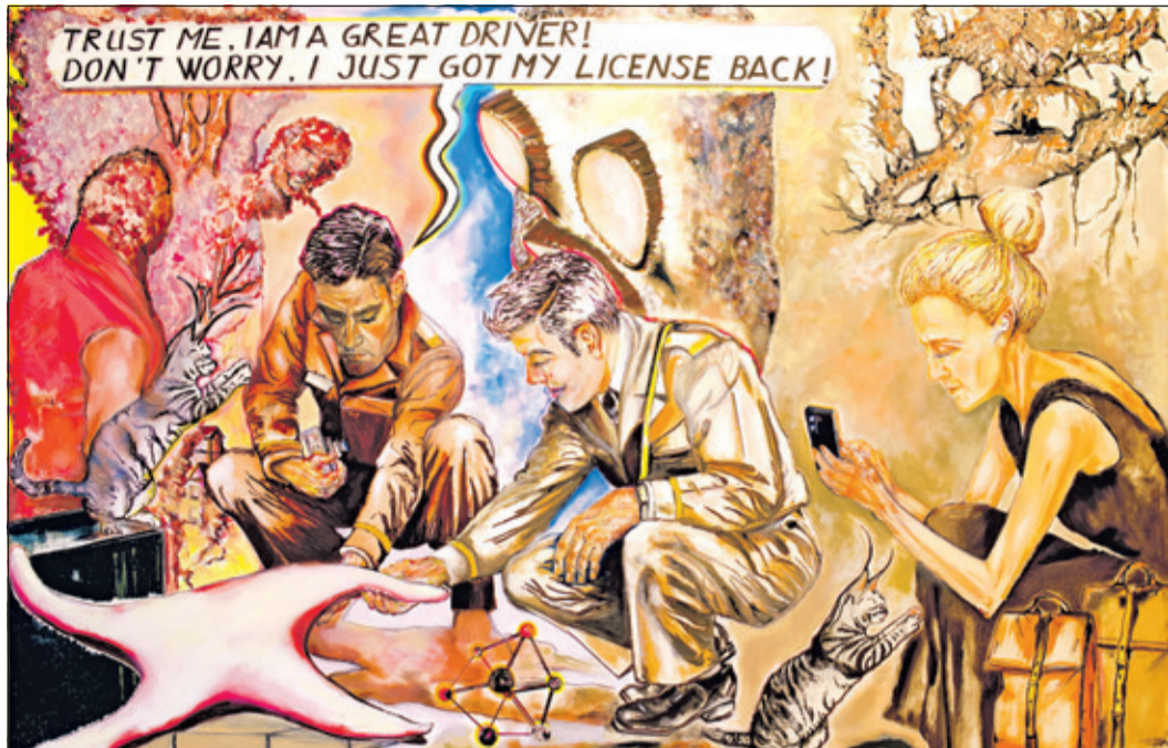
Das Kunstwerk mit dem Titel „Die Wahrheit ist belanglos“, Öl auf Leinwand, 2025, wird in der Ausstellung von Ali Tarlan zu sehen sein.