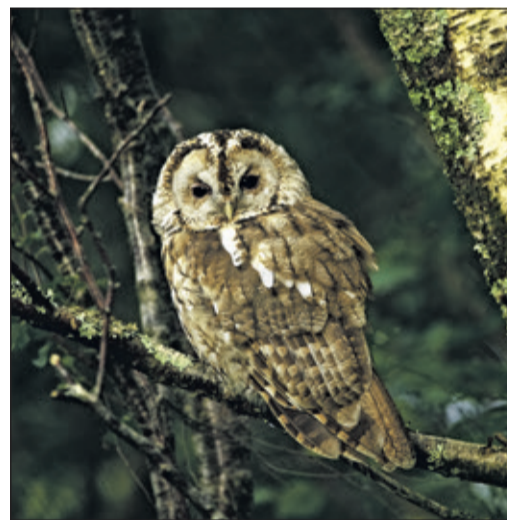
Der Waldkauz ist in Europa weit verbreitet.