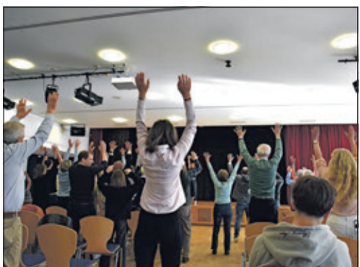
...und alle machten mit!

Mit dieser Bilanz ist das vergleichsweise kleine Bad Soden auf Platz zwei im gesamten Main-Taunus-Kreis, so gab es Moderator Jan Nowitzky von der TSG Neuenhain am Rednerpult sichtlich stolz zu Protokoll. Allerdings mussten sich die „Ausgezeichneten“ auch bei diesem offiziellen Termin noch einmal kurz sportlich betätigen: Die Prüfer standen nämlich auf der Bühne und wollten wissen, wie es um den Trainingszustand der Anwesenden bestellt war, „also greifen wir zunächst mit den Armen nach oben und machen uns gaaanz lang!“