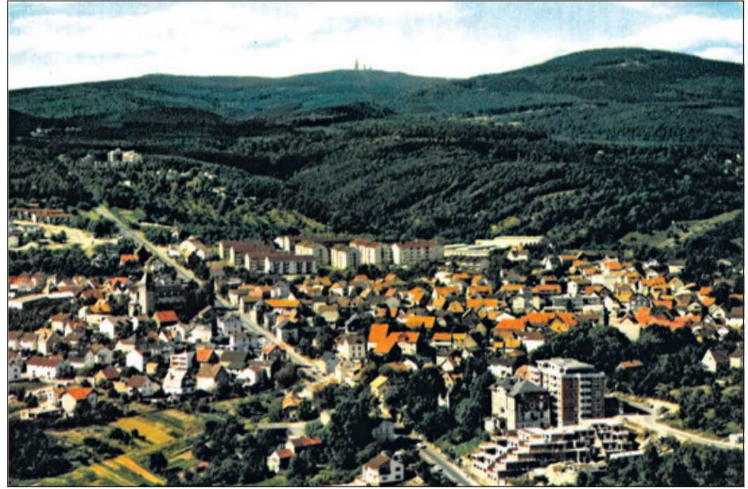
Neuenhain im Jahr 1971. Postkarte von Jürgen Butzer