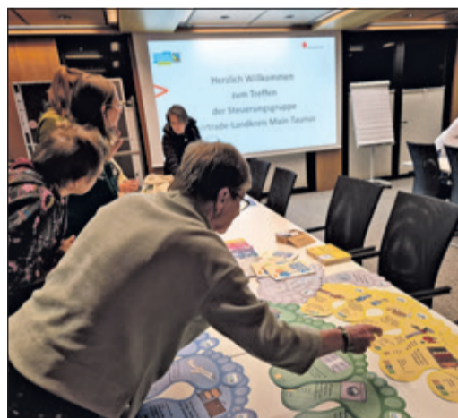
Die Teilnehmer des MTK-Steuerungsgruppentreffs ermittelten ihren ökologischen Fußabdruck.

Derzeit bereiten sie weitere Events für das laufende Jahr vor, so einen „Markt der Möglichkeiten“ und einen Bekleidungsflormarkt. Auf Kreisebene unterstützen sie den „Tag der Erde“ am 26. April und den Apfelmarkt am