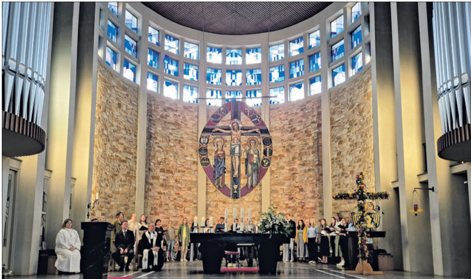
JuVokal im Chorraum – ein echtes Klangerlebnis.