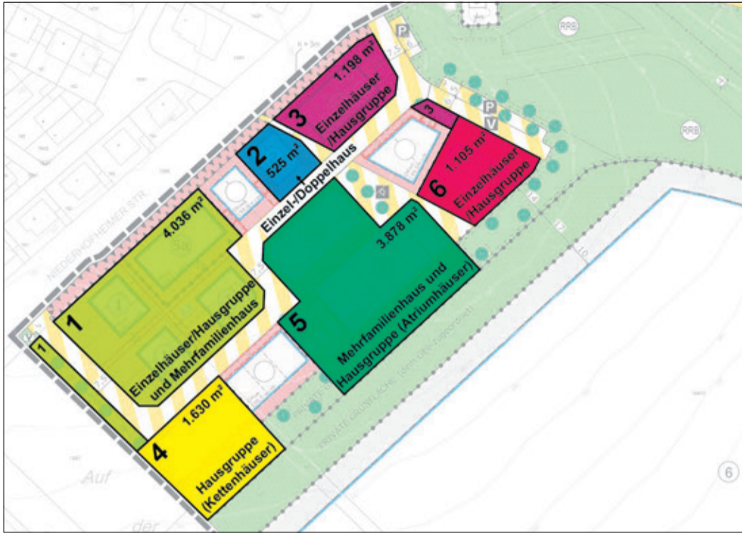
Die Aufteilung des neuen Wohngebiets