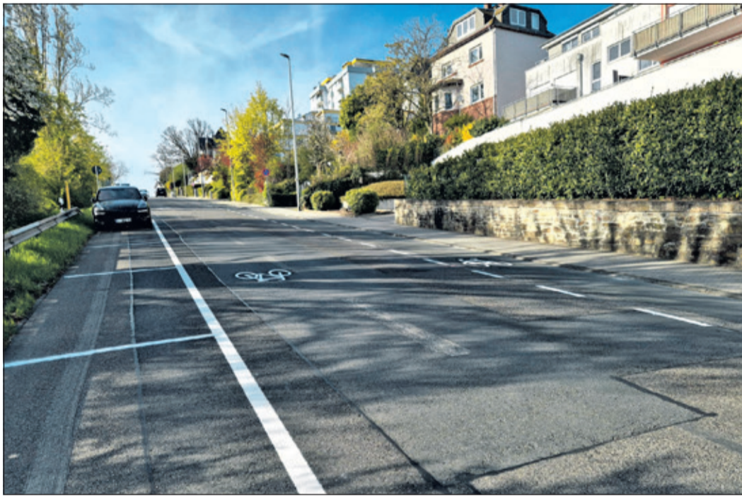
Piktogramme markieren die Fahrradschutzstreifen auf der Königsteiner Straße.