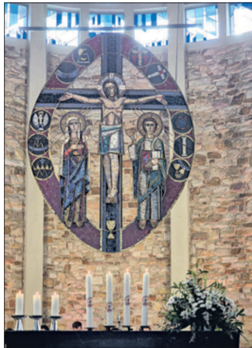
Die neu entzündeten Ökumenekerzen

lich zündeten die Vertreter der Evangelischen Kirchen in Bad Soden und Neuenhain, der Katholischen Kirche Bad Soden und der Evangelisch-methodistischen Kirche die neuen ökumenischen Osterkerzen an und stellten sie als Zeichen der Verbundenheit auf den Altartisch, bevor sie wieder für ein Jahr in den jeweiligen Kirchen ihren Platz finden. Noch lange standen die Menschen nach dem Gottesdienst bei Sekt oder Wasser in der Sonne und freuten sich an der Begegnung. Der nächste ökumenische Gottesdienst wird an Pfingstmontag vor der Konzertmuschel im Kurpark, anlässlich der Bad Sodener Weintage, stattfinden. Weitere Informationen und Einladungen in die Bad Sodener Kirchen sind auf den jeweiligen Homepages der Kirchen zu finden.