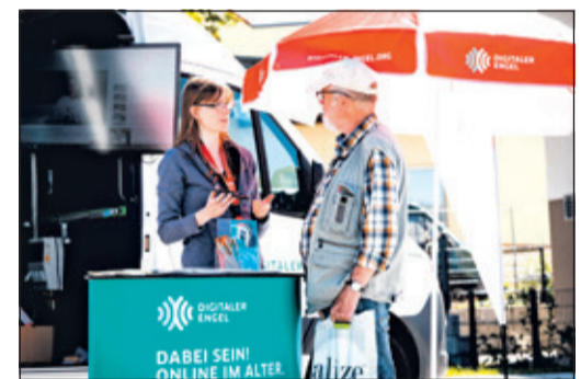
Digitalreferenten helfen bei Fragen rund um Online-Angebote und Digitalisierung.

Im Mittelpunkt der Veranstaltung stehen praxisnahe Einblicke und hilfreiche Tipps, die den Teilnehmenden den Umgang mit digitalen Angeboten erleichtern und mehr Sicherheit im Alltag geben. Ziel ist es, Berührungs-