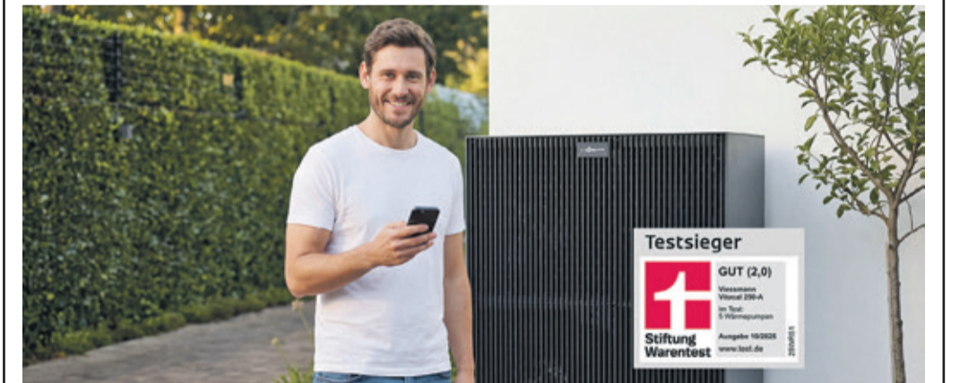
Clever und zukunftssicher – MVV Wärmepumpen und Photovoltaikanlagen inkl. intelligentem Energiemanagementsystem bis 31.5.2026 mit attraktivem Rabatt

Die Energiepreise steigen – insbesondere für Öl und Gas – und belasten viele Haushalte. MVV bringt die Energie der Zukunft in den Taunus und das Rhein-Main-Gebiet: Die Energiewende beginnt bei Ihnen zu Hause – und die MVV Energie AG, ein führendes Energieunternehmen mit über 150 Jahren Branchenerfahrung, unterstützt Sie dabei mit ihrem Standort in Schwalbach. Exklusiver Rabatt bis zum 31. Mai Im Rahmen des Maimarkts, einer der größten regionalen Verbrauchermessen Deutschlands, erhalten Sie im April und Mai exklusive Rabatte auf Photovoltaik-Anlagen und Wärmepumpen – entweder auf dem Maimarkt oder auch bequem hier in der Region über unseren Standort Schwalbach. Das Besondere an den MVV Lösungen: Das smarte MVV Energiemanagementsystem! Es vernetzt die eingesetzten Komponenten und optimiert