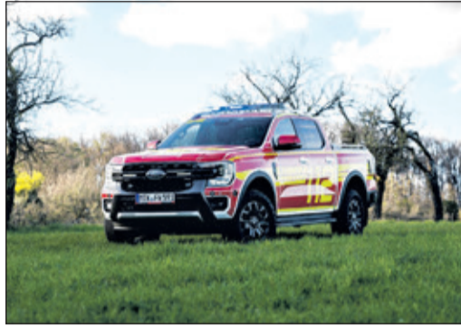
Der neue Kommandowagen der Feuerwehr Bad Soden

Bad Soden (bs) – Die Freiwillige Feuerwehr Bad Soden hat ein neues Einsatzfahrzeug in Dienst gestellt. Bei dem neuen Fahrzeug handelt es sich um einen sogenannten „Gerätewagen – Sonstige“ auf Basis eines Ford Ranger Wildtrak. Er ersetzt den bisherigen Kommandowagen, der aufgrund eines irreparablen Motorschadens außerplanmäßig außer Dienst gestellt werden musste.