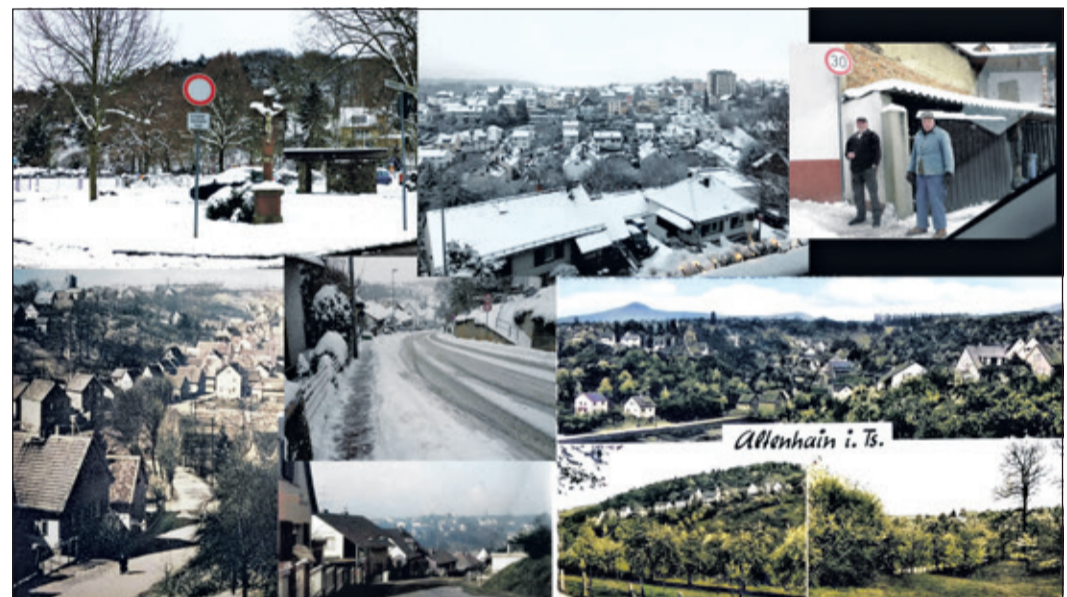
Geschichten aus Altenhain gibt es am 26. April ab 14 Uhr im alten Rathaus.

Altenhain (bs/Sc) – Menschen zusammenbringen, sich gemeinsam an die „gute alte Zeit“ erinnern und zusammen einen schönen Nachmittag verbringen – mit dieser charmannten Idee lädt der Altenhainer GeschichtsVerein e.V. am 26. April zu seinem traditionellen Dorfkaffee ein. Los geht's um 14 Uhr im alten Rathaus in Altenhain – bei einer guten