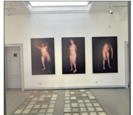
Die Körper-Bild-Trilogie beeindruckt.