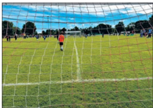
Die jungen Spielerinnen und Spieler in Aktion

Zum ersten Mal auf Rasen und mit der Unterstützung des F2-Torhüters absolvierten die jungen Kicker im Alter von sieben Jahren und jünger acht Spiele gegen Mannschaften aus Rüsselsheim, Griesheim, Hochheim, Freudenberg, Dörnigheim, Zeilsheim, Schierstein und Unterliederbach.