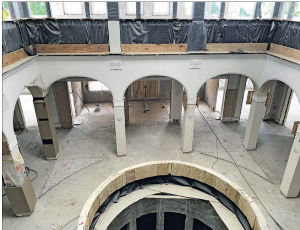
Der Blick vom 2. Obergeschoss zeigt die wunderschöne Symmetrie des Gebäudes.

Taunus (bs) – Unter dem Motto „Mit Herz dabei“ lobt die Taunus Sparkasse zum 21. Mal ihren Bürgerpreis aus. Bis zum 31. Mai können engagierte Bürgerinnen und Bürger, Gruppen oder Initiativen aus dem Main-Taunus-Kreis und dem Hochtaunuskreis nominiert werden, die sich uneigennützig für andere einsetzen und das gesellschaftliche Miteinander stärken. Der Preis ist mit insgesamt 5.000 Euro dotiert und wird gemeinsam von den Landräten der beiden Kreise sowie dem Vorstand der Taunus Sparkasse verliehen. Neben Preisgeld erhalten die Preisträgerinnen und Preisträger eine Auszeichnung sowie öffentliche Würdigung im Rahmen einer feierlichen Preisverleihung am 9. September in Bad Homburg. Der Bürgerpreis wird in vier Kategorien vergeben: „U 21“, „Alltagshelden“, „Engagierte Unternehmer“ und „Lebenswerk“. Vorschläge sind online unter taunussparkasse.de/buergerpreis möglich.