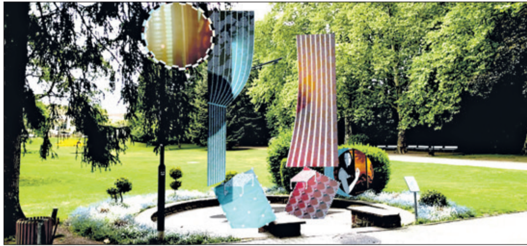
Eine spannende Erfahrung: Das virtuelle Kunstwerk an der Quelle VI (Standesamt) lädt zum Verweilen ein, denn es ist der stetigen Verwandlung und Erneuerung unterworfen.

AR bedeutet „erweiterte Realität“. Dabei werden digitale Elemente in die echte Welt eingeblendet, meist über ein Smartphone, Tablet oder eine spezielle Brille. Bei AR-Kunst kann ein Kunstwerk z. B. so funktionieren: Das Mobiltelefon wird auf eine bestimmte Fläche ausgerichtet und scannt diese, daraufhin erscheint auf dem Display eine digitale