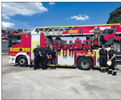
Die Minifeuerwehrrinder mit ihren Betreuerinnen und den beiden Drehleitermaschinenisten.