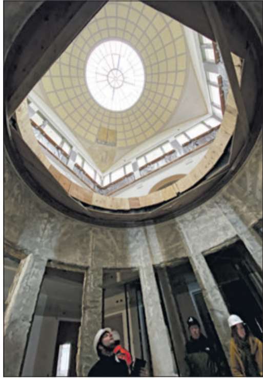
Der Blick vom Erdgeschoss in die Kuppel

Da wären zunächst die Fenster, die in ihrer Originalität erhalten werden sollen, aber natürlich nicht den aktuellen Vorgaben zur Wärme- und Schalldämmung entsprechen. Hier hat man die Idee, die alten Fenster aufzuarbeiten und damit die äußere Fensterebene zu erhalten, jedoch eine zusätzliche Verglasung an der Innenseite der Fensternische einzusetzen, um die energetischen Anforderungen zu erfüllen – öffnen lassen sollen sich die Fenster trotzdem! Eine weitere Herausforderung sind die Unterzüge an den Decken, die im Einzelnen auf ihre Statik überprüft und ggf. verstärkt/nachgearbeitet werden müssen.