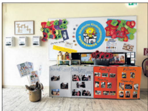
Die Ergebnisse der Projektwoche wurden in einer Präsentationsecke für die Eltern ausgestellt.

Unter dem Motto „Stark sein – Kinderrechte erleben“ beschäftigten sich die Kinder eine Woche lang spielerisch, kreativ und alltagsnah mit wichtigen Themen wie Mitbestimmung, Selbstvertrauen, Sprache, Grenzen und Gemeinschaft.