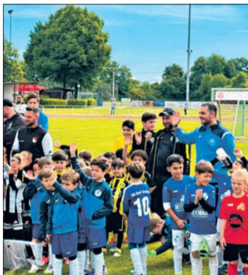
Begrüßung der 27 Mannschaften in Hochheim

derlage – aber vor allem glückliche und stolze Kinder, die als Mannschaft leidenschaftlich zusammen gekämpft haben und gemeinsam einen tollen Tag auf dem Fußballplatz verbringen konnten.