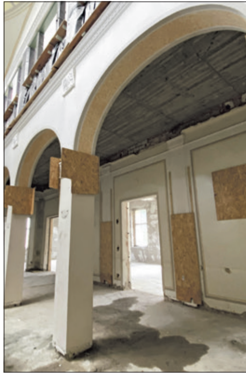
Wo früher Inhalationskabinen waren, werden Gesprächsräume geschaffen.