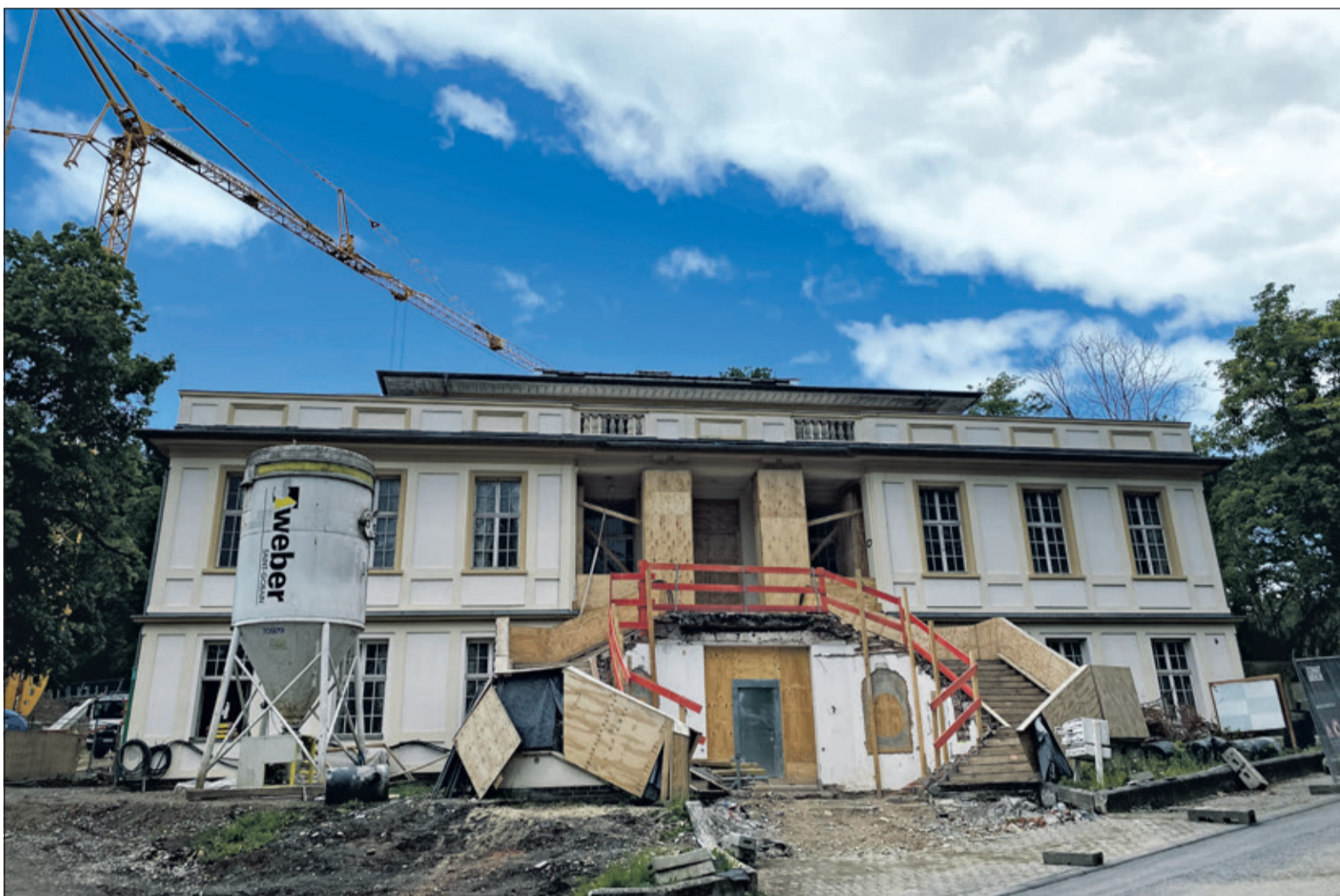
Es bleibt noch viel zu tun – spannende Einblicke in die Baustelle des neuen Bad Sodener Rathauses