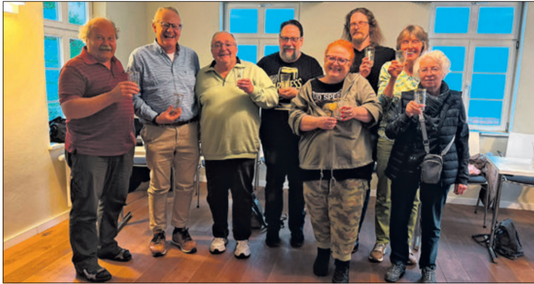
„Never change a winning team“ – Der alte Vorstand des Altenhainer Geschichtsvereins ist auch der neue.