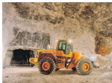
Calciumsulfat-Fließestriche werden regional in Deutschland produziert, was oftmals die Lieferwege kurz hält.

ter www.pro-fliessestrich.de finden sich mehr Informationen zu energieeffizienten Systemen für Neubau oder Modernisierung.