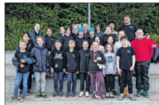
Die Mannschaft und das Team des ESSC Bad Soden Kelkheim e.V. konnte sich über tolle Erfolge freuen.