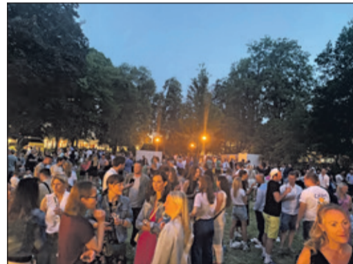
Abendstimmung auf der großen Wiese ...