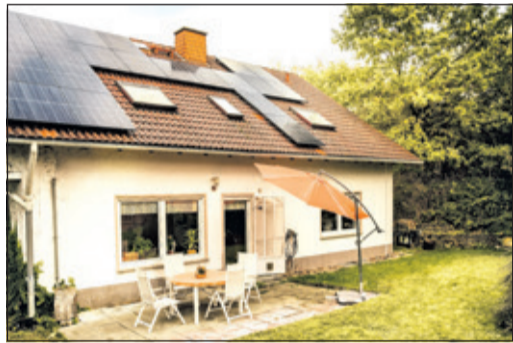
Hauseigentümer können sich zu den Möglichkeiten von Photovoltaik auf dem eigenen Dach informieren.