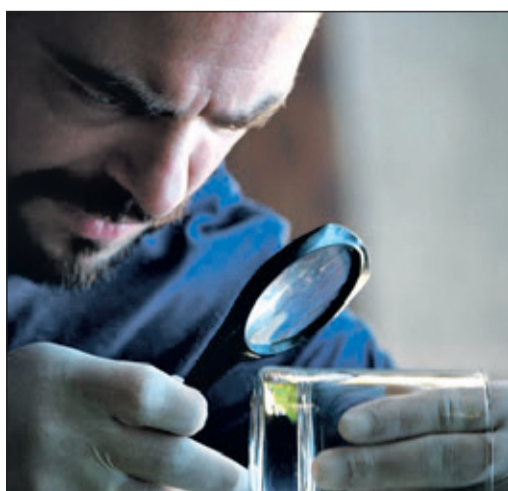
Diese Spur könnte zum Täter führen.

Die Zahl der Teilnahmeplätze ist begrenzt. Anmeldung am besten telefonisch unter 06196 208-255 oder per E-Mail unter stadtbuecherei@bad-soden.de.