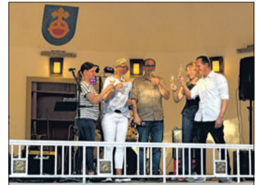
Ein Gläschen zur Eröffnung...