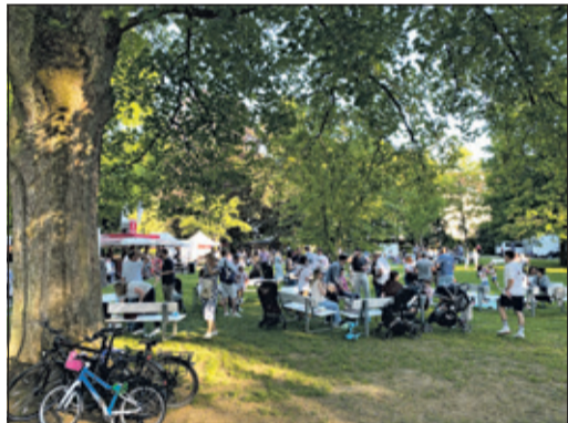
Weingenuß im Schatten der Bäume ...

Als sich dann der Abend über den alten Kurpark senkte und die sanften Lichterketten ein ganz eigenes Ambiente schufen, trauten sich sogar einige Tanzbegeisterte vor der Konzertschale auf „Parkett“, um zu poppigen und rockigen Rhythmen das Tanzbein zu schwingen. Ein wunderbarer Abend, dem bei hoffentlich gleichbleibendem Wetter noch ganz viele folgen werden!