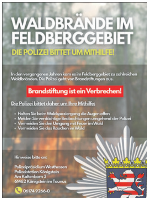
Die neuen Plakate in der Feldbergregion.