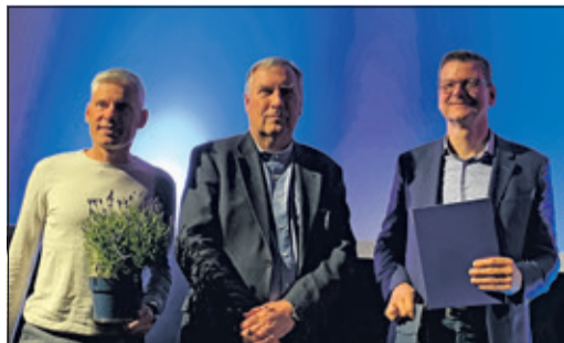
Der Verein Klimabewusstes Bad Soden erhielt den 1. Preis für seine ehrenamtliche Bürgersolarberatung.

So gelte es auch, mit vielen Einzelmaßnahmen die kommunale Widerstandsfähigkeit und die Gemeinschaft zu stärken sowie die Lebensqualität für alle zu verbessern. Neben Naturschutzprojekten gelte es auch, ein Augenmerk auf die angestrebte Verkehrswende