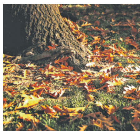
Für Schatten eignen sich spezielle Rasensaatmischungen. Laub sollte zudem regelmäßig entfernt werden, um Fäulnis zu vermeiden.

rund 300 Experten bundesweit für eine individuelle Beratung vor Ort.