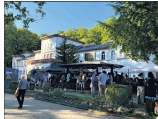
Weingenuß vor historischer Kulisse ...