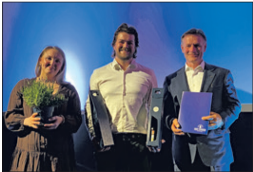
Mit dem 3. Platz wurde der OGV Altenhain ausgezeichnet.

Der Verein engagiert sich seit vielen Jahren für die Pflege und Weiterentwicklung von Streuobstwiesen und verbindet dabei traditionellen Naturschutz mit modernen Ansätzen zur Nutzung und wissenschaftlich fundierter Arbeit bei der Pflege. Besonders positiv bewertete die Jury, dass sich eine junge Generation mit großem Engagement und neuen Ideen für den Erhalt dieser wertvollen Kulturlandschaft einsetzt. Der OGV erhält neben der Urkunde einen Geldpreis in Höhe von 500 Euro.