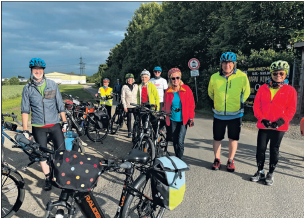
Trotz dunkler Wolken kamen alle Teilnehmer der ADFC Feierabendtour trocken in Bad Homburg an.

Bad Soden (bs) – Die diesjährige STADTRADELN-Aktion in Bad Soden ist nach drei aktiven Wochen erfolgreich zu Ende gegangen. Nach aktuellem Stand haben sich mehr als 186 Teilnehmerinnen und Teilnehmer in 26 Teams organisiert und mehr als 31.000 Kilometer bei über 1.900 Fahrten zurückgelegt. Rechnerisch haben sie damit fünf Tonnen CO2 vermieden, die angefallen wären, wenn diese Strecken mit einem Fahrzeug zurückgelegt worden wären. Die Teilnehmenden haben nun noch bis zum 28. Mai Gelegenheit, ihre gefahrenen Kilometer über die App oder die Kommunenseite nachzutragen, bevor die endgültigen Ergebnisse feststehen.