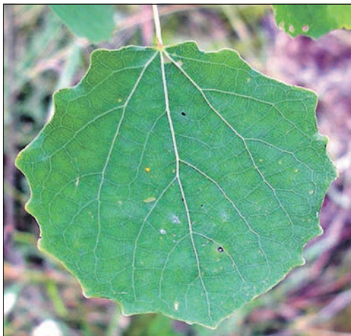
Das Espenlaub gehört zur Zitterpappel, dem Baum des Jahres 2026.

Schwalbach/Eschborn/Sulzbach (sz). Im Arboretum wird eine Zitterpappel als Baum des Jahres 2026 gepflanzt. Die Pflanzung findet am Freitag, 24. April, um 10 Uhr statt. Organisiert wird die Aktion vom Forstamt Königstein gemeinsam mit dem Förderverein Arboretum. Die Pflanzung ist Teil einer jährlichen Tradition. Seit 2008 wird im Arboretum jeweils der Baum des Jahres gesetzt. Der „Tag des Baumes“ wird in Deutschland seit 1952 begangen. Er soll die Bedeutung von Bäumen für Umwelt und Gesellschaft hervorheben. An der Veranstaltung nehmen neben Forstamtsleiter Sebastian Gräf auch Bürgermeisterinnen und Bürgermeister der umliegenden Kommunen teil. Zudem wirken SchülerInnen und Schüler sowie eine Naturkindergruppe mit. Musikalisch begleitet wird die Pflanzung von einem Bläserchor.