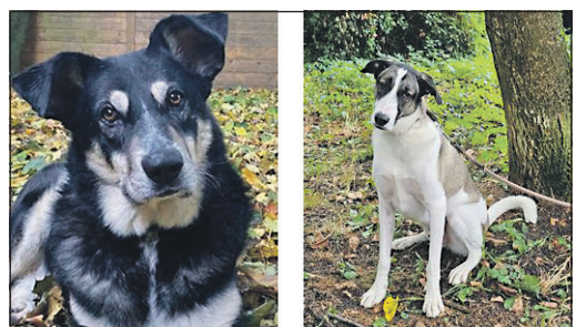
Die Rüden Dillon (links) und Lucky leben seit nunmehr drei Jahren im Tierheim am Arboretum, können dort aber nicht für immer bleiben.

Solange die Städte und Gemeinden wie Sulzbach und Eschborn nicht mehr für das Tierheim bezahlen, ist der Verein auf viele Spenden angewiesen. Wer die Arbeit des Tierheims unterstützen möchte, kann per Paypal an @TSVBadSodenSulzbach oder per Überweisung auf das Konto mit der IBAN DE95 5019 0000 0000 1638 05 helfen. „Wir sind für jede Spende dankbar“, sagt Therese Knoll.