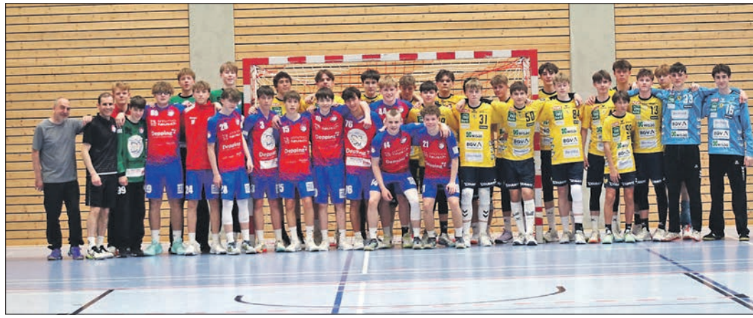
Gleich zwei Mal trat die B-Jugend der HSG Schwalbach/Niederhöchstadt in den roten Trikots gegen den Nachwuchs des Bundesligisten Rhein-Neckar-Löwen an.