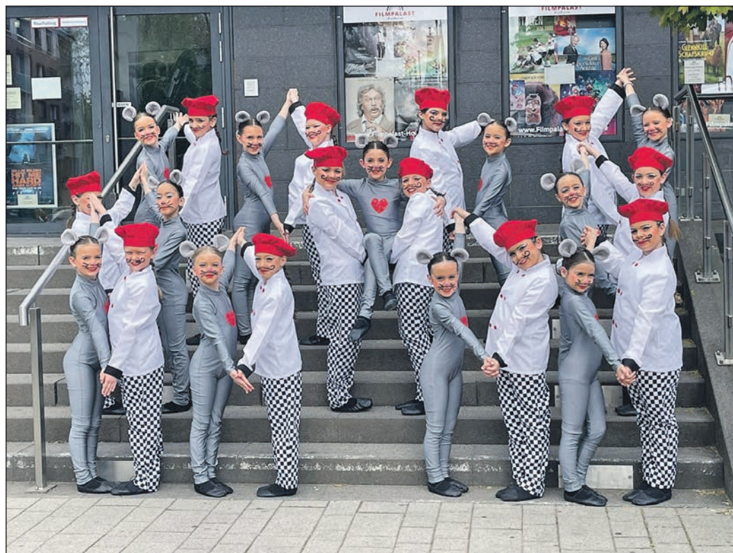
Ratten und Köche verstanden sich beim Showtanz sehr gut.

Der Tennisverein Westerbach Eschborn bietet ab der Sommersaison 2026 auch wieder eine Ballschule für Kinder und Jugendliche an. Ziel ist es, den Nachwuchs früh für Bewegung und Sport zu begeistern. Das Angebot