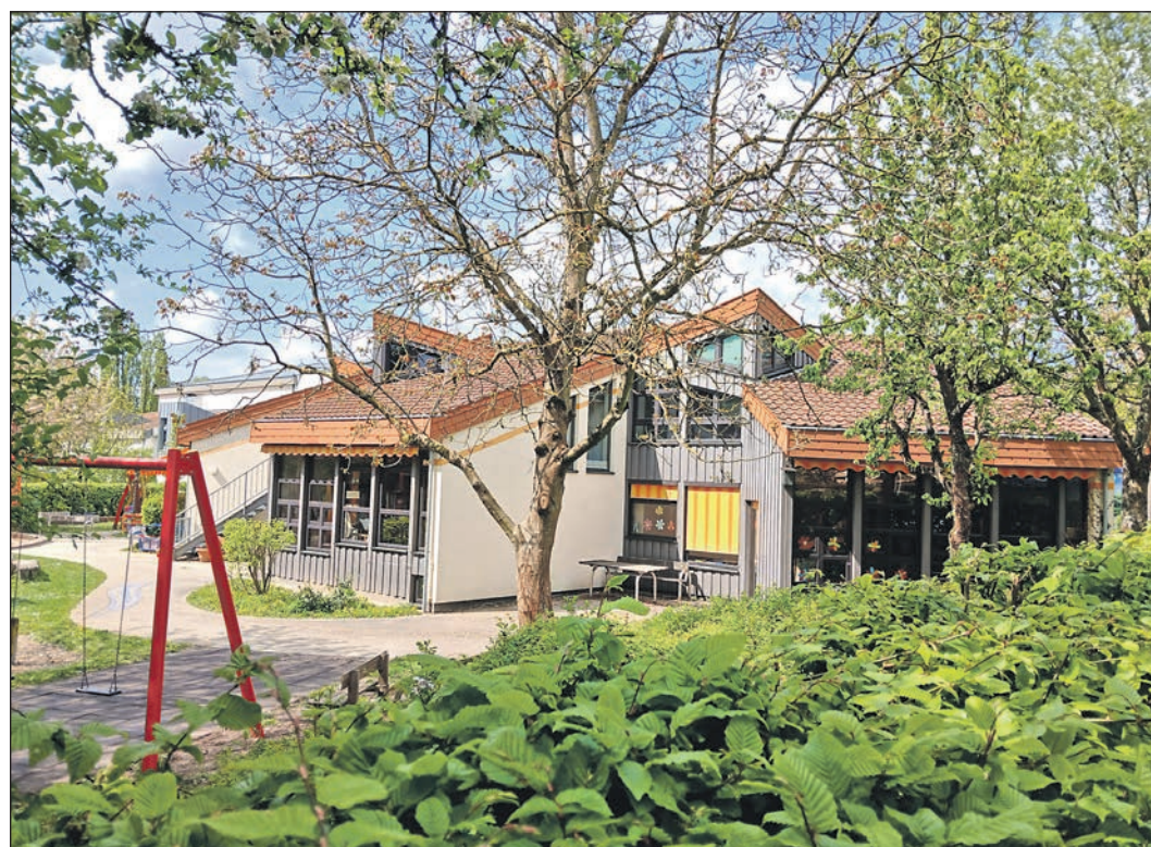
Die heutige Kita „Weingärten“ am Montgeronplatz soll im Jahr 2027 abgerissen und danach durch einen Neubau ersetzt werden.

Vorgestellt werden sollen die Pläne sowohl für die „Interimskita“ als auch für den Neubau der Kita „Weingärten“ bei einer Präsentation des Architekturbüros voraussichtlich in der Sitzung der Stadtverordneten am Donnerstag, 7. Mai.