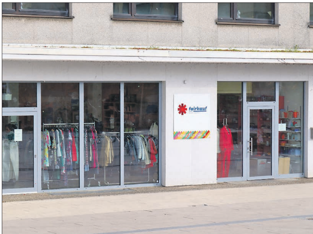
Am Eingang des Caritas-Ladens hängt seit Mitte März das neue Logo.