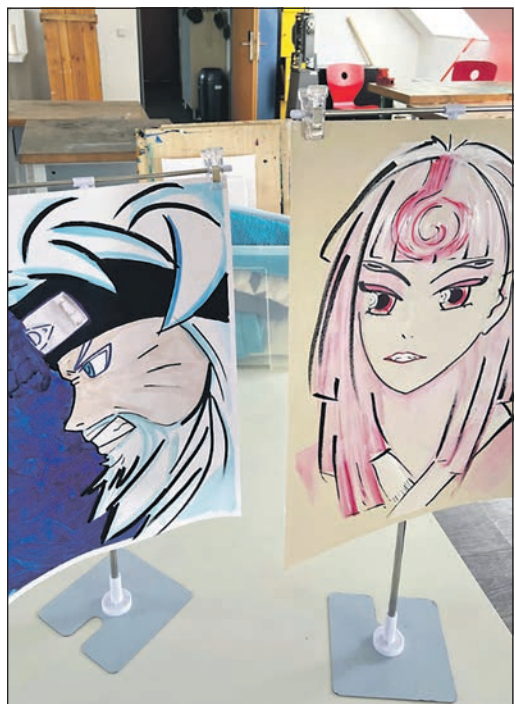
Auch Manga-Zeichnen steht auf dem Programm der Volkshochschule für die Sommerferien.

Weitere Informationen und Anmeldungen gibt es unter vhs-mtk.de im Internet. Die Kontaktaufnahme ist außerdem per E-Mail an info@vhs-mtk.de oder telefonisch unter der Nummer 06192-99010 möglich.