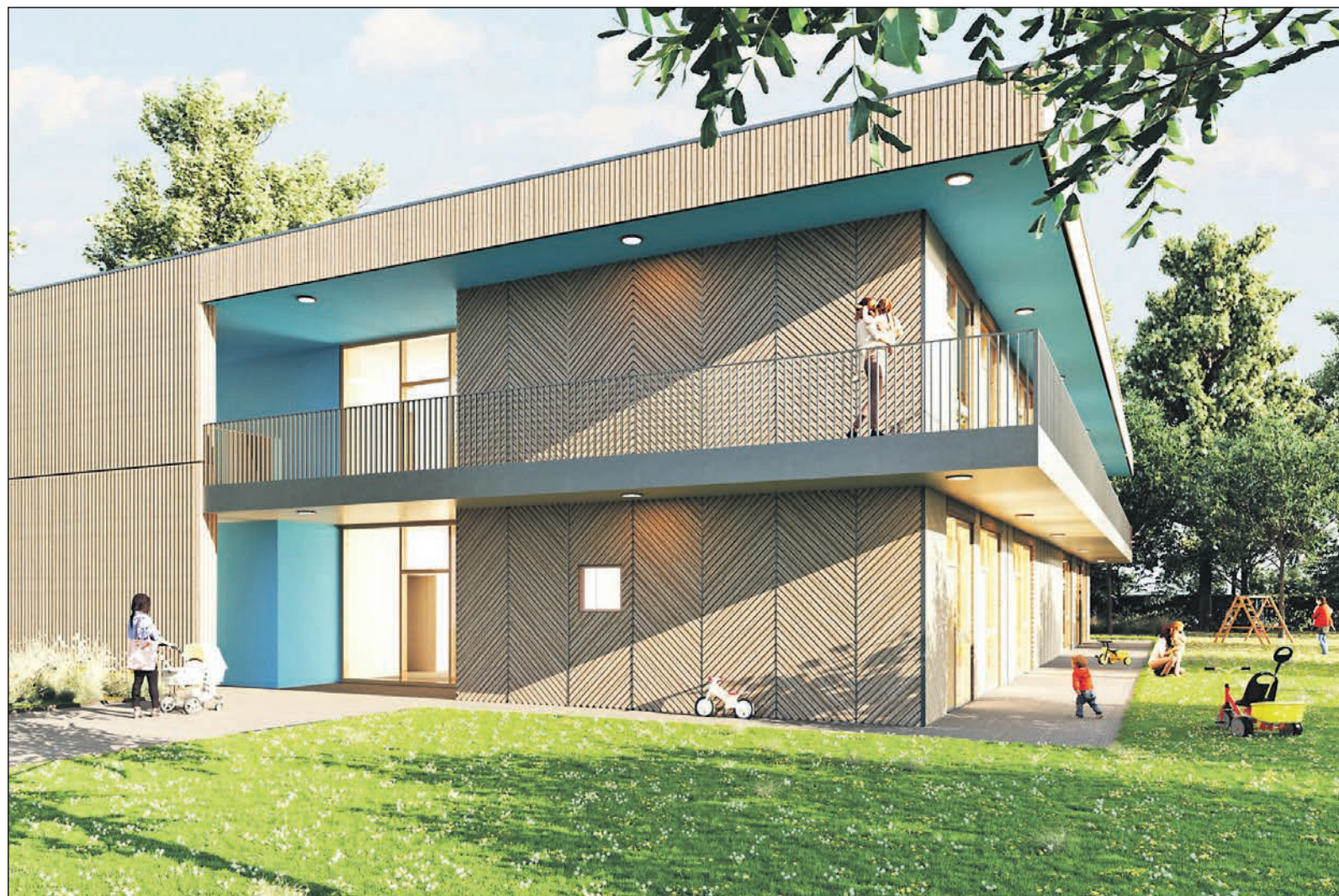
So soll die Kita „Weingärten“ in Niederhöhnstadt ab dem Jahr 2029 aussehen.

Grafik Stadt Eschborn/Ferdinand Heide Architekten