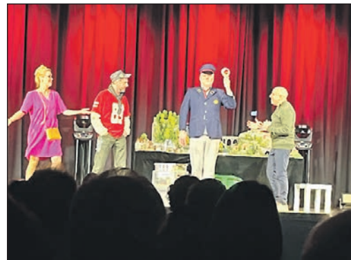
Das Ensemble des „Kom(m)ödchens“ brillierte am Samstag im Bürgerzentrum in Niederhöhnstadt.

Was dann folgte, konnten weder Malte noch das Publikum ahnen: Schräge Figuren aus ganz Europa fallen im Laufe des Abends in seine vier Wände ein. Sogar Ursula von der Leyen gibt ihr Stelldichein und äußert sich zur derzeitigen Lage. In Sekundenschnelle wechselten die Schauspielerinnen und Schauspieler ihre Kostüme und beeindruckten mit unbändiger Spiellaune, temporeicher Sprache und tollen Gesangseinlagen. „Amüsant bis ins letzte Detail“, so die positive Resonanz eines Gastes.