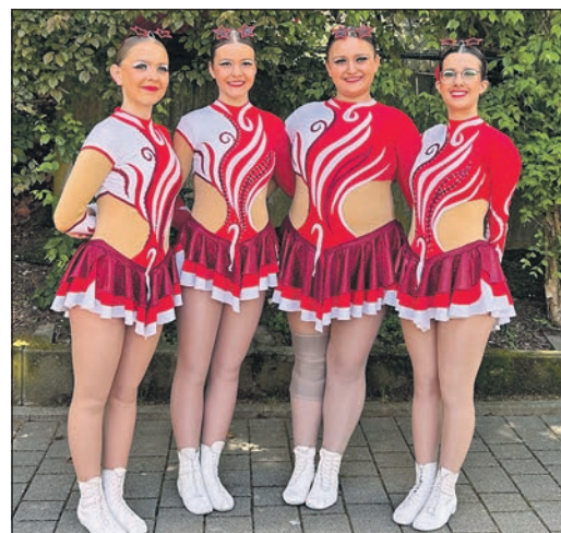
Die „FireStars“ kämpfen am Wochenende um die deutsche Meisterschaft.