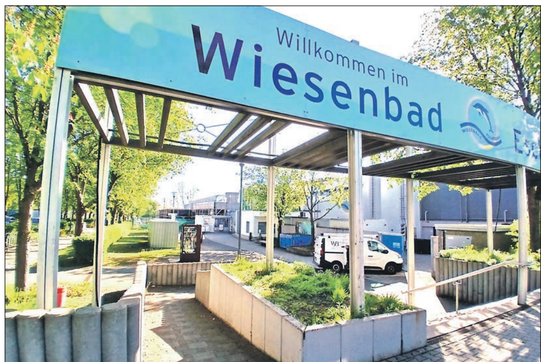
Seit Dienstag heißt das Wiesenbad die Badegäste wieder willkommen.