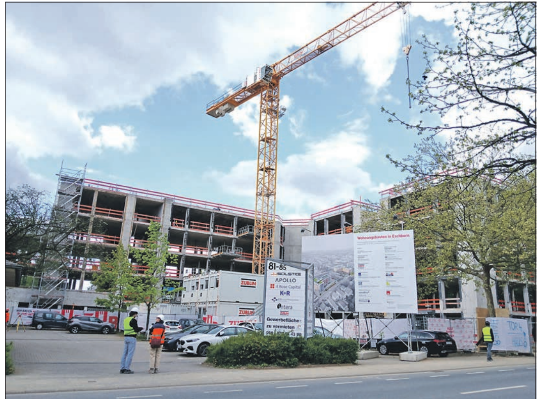
Eigentlich sollen in der Hauptstraße 71 bis 87 preiswerte Wohnungen gebaut werden. Doch ohne Fördergelder werden die Wohnungen teurer.

Die Stadt Eschborn appelliert daher an das Land Hessen, die erforderliche Förderzusage zu erteilen.