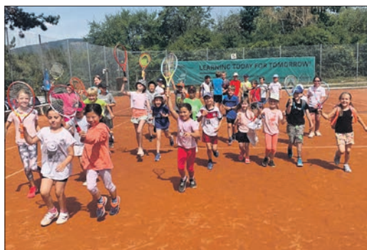
Auch in diesem Sommer wird der Tennisverein Westerbach Eschborn wieder eine Ballschule für Kinder und Jugendliche auf seiner Anlage anbieten.

richtet sich an verschiedene Altersgruppen. Kinder ab drei Jahren sammeln erste Erfahrungen mit dem Ball. Für Kindergarten- und Grundschulkinder gibt es abgestufte Programme, die spielerisch Koordination und Ballgefühl fördern. Neben grundlegenden Bewegungsabläufen lernen die Kinder auch erste Elemente der Tennis-Technik kennen. Das Training findet auf der Anlage des Vereins in Niederhöhnstadt statt und ist kostenlos. Teilnehmende erhalten zudem im ersten Jahr eine kostenfreie Mitgliedschaft. Diese umfasst auch eine passive Mitgliedschaft für einen Elternteil. Die Anmeldung erfolgt über Trainer Michael Hasenbank. Er ist per E-Mail an Mhasenbank@vodafone.de oder telefonisch unter der Nummer 0162-2099176 erreichbar.