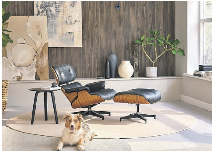
Schön gemütlich wird es in diesem Raum dank Teppich-Layering mit Naturhaar.

(DJD). Teppiche beeinflussen die Wirkung von Wohnräumen stärker als oft angenommen. Sie sorgen für Wärme, reduzieren Trittschall und helfen, offene Grundrisse optisch zu strukturieren. Mit verschiedenen Teppichfarben lassen sich unterschiedliche Zonen innerhalb einer Wohnung gestalten, ohne bauliche Veränderungen vorzunehmen. Ein aktueller Trend ist das Teppich-Layering, bei dem mehrere Teppiche überlappend kombiniert werden. Unter dem Link designer.tretford.eu gibt es einen kostenlosen virtuellen Raumplaner. Teppich mit Naturfasern wie Schurwolle oder Ziegenhaar kann die Luftfeuchtigkeit regulieren und Staub binden, was das Raumklima positiv beeinflusst.