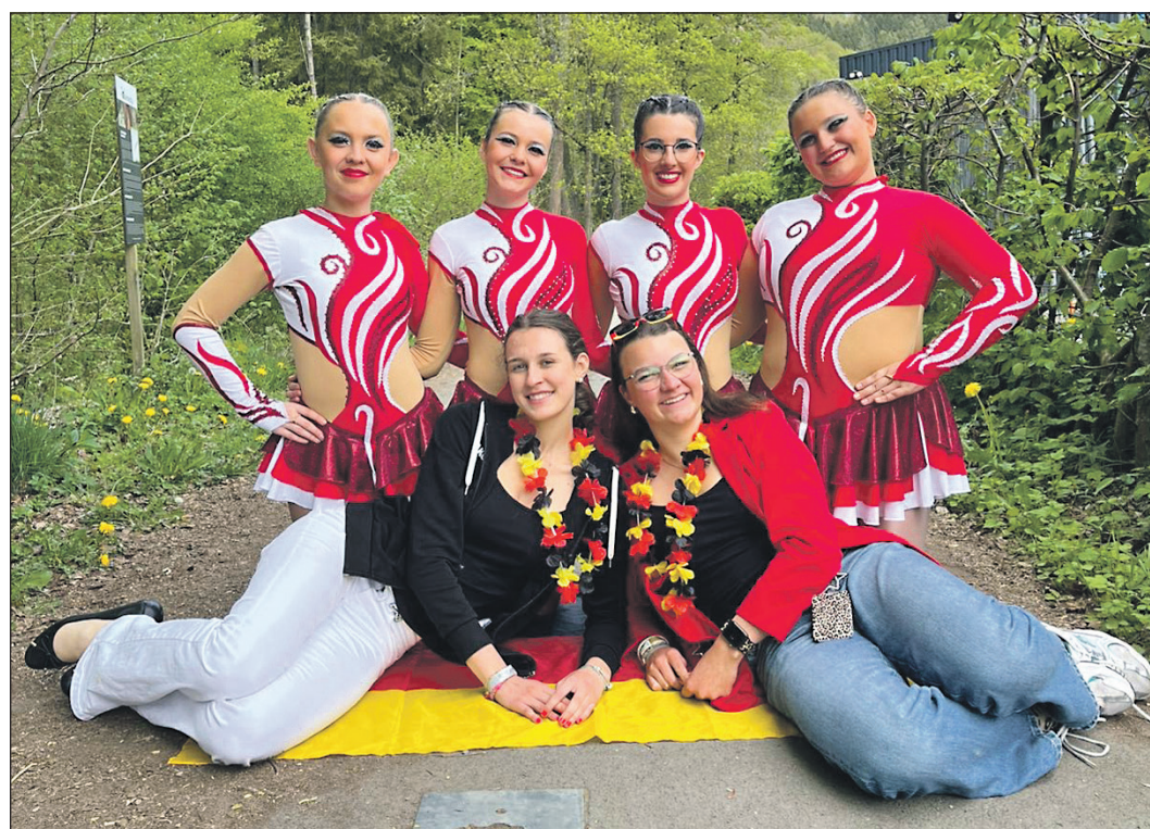
Die vier Tänzerinnen der Tanzgruppe „FireStars“ der Eschborner „Käwwern“ krönte die Saison mit einem vierten Platz bei der „EuroDance 2026“.