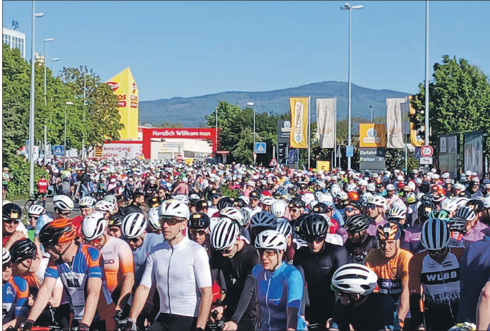
Fahradhelme soweit das Auge reicht. Dabei sind das nur zwei von rund 20 Startblöcken bei der Velotour am Samstag. Im Hintergrund die Taunushöhen, die die meisten der 12.000 Radfahrer erklimmen wollten.