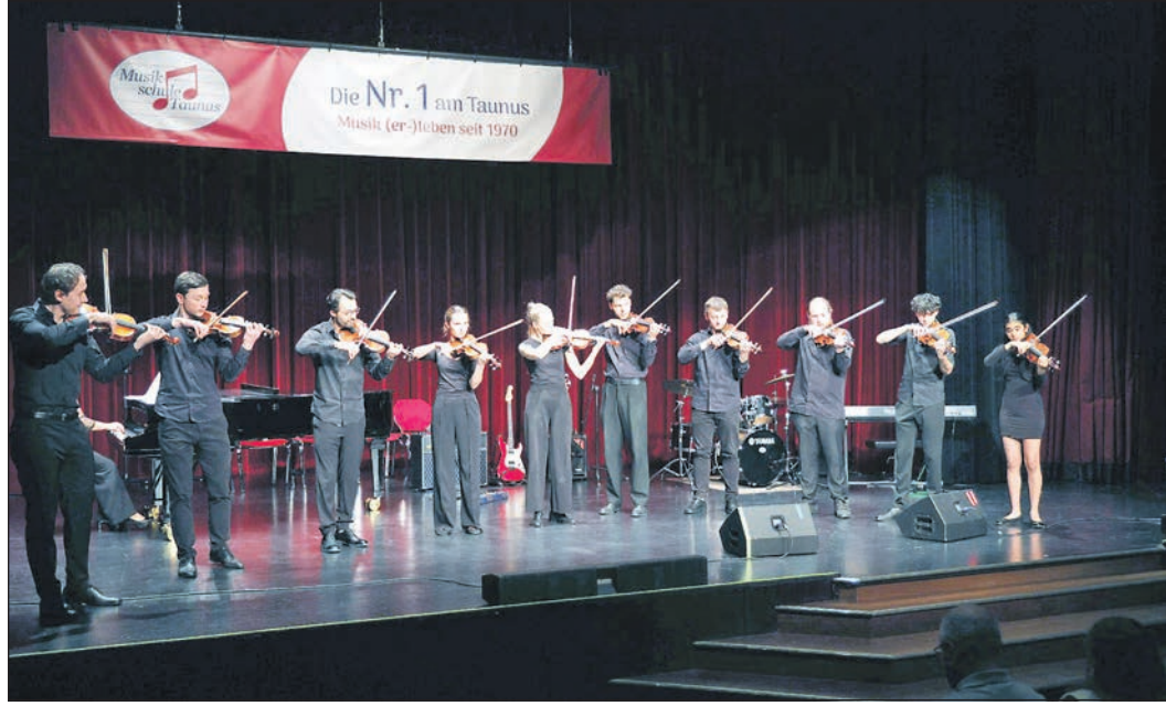
Der Auftritt des Streicher-Ensembles gehörte zu den Höhepunkten des Jahreskonzerts.