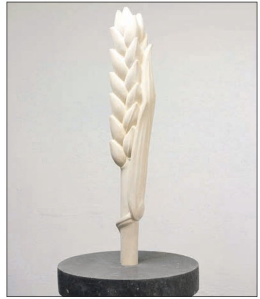
Skulpturen von Joscha Bender sind in diesem Sommer zu sehen.

Der Ausstellungstitel verweist auf die Verbindung von Naturdarstellung und indirekter Aussage. Die Ausstellung entsteht in Zusammenarbeit mit der Galerie Scheffel aus Bad Homburg und läuft bis zum 4. Oktober. Für die Eröffnung am 9. Mai bittet die Stadt um Anmeldung unter der Telefonnummer 06196-490180.