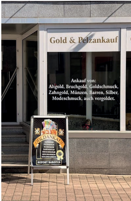
Anders als viele andere Goldankäufer verfügt das „Auktionshaus Schwalbach“ über ein eigenes Ladengeschäft in der Schulstraße in Alt-Schwalbach.