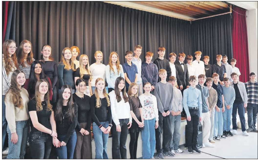
42 jugendliche Konfirmanden aus der Evangelischen Gemeinde Eschborn und der Schwalbacher Friedenskirchengemeinde stellten sich am Sonntag vor.