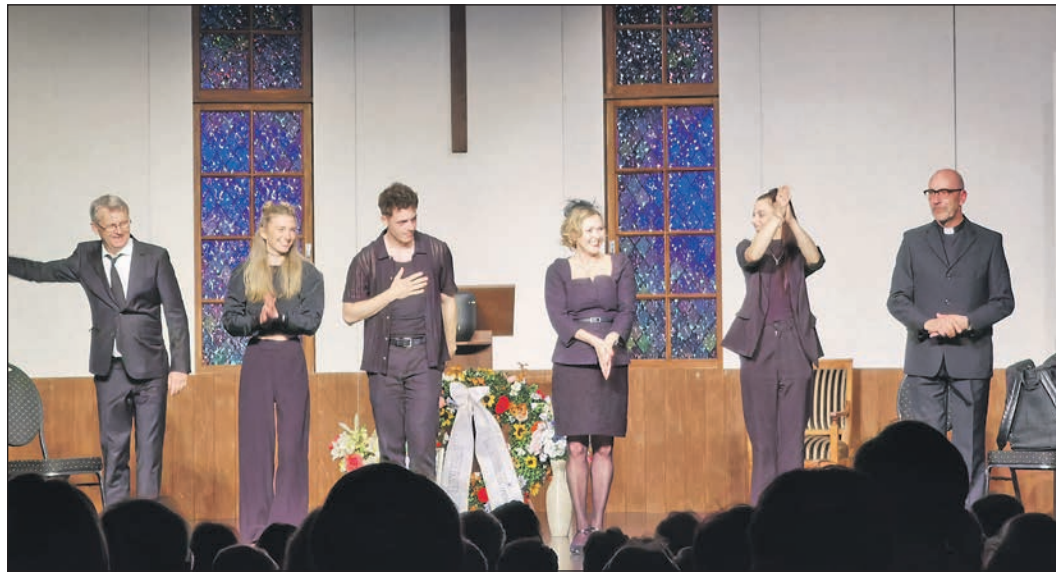
Das Ensemble der Landebühne Rheinland-Pfalz aus Neuwied spielte zum Abschluss der Eschborner Theatersaison im Schwalbacher Bürgerhaus.