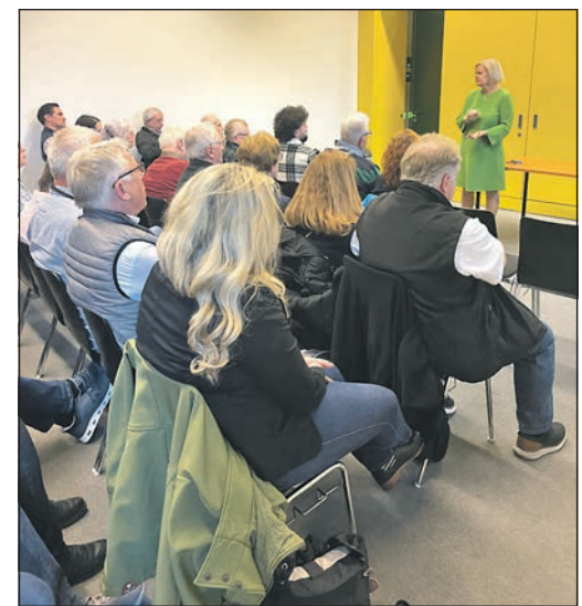
Die SPD-Bundestagsabgeordnete Nancy Faeser lädt wieder zu Bürgerfahrten nach Berlin ein.

Die erste Fahrt ist vom 2. bis 4. September geplant. Eine zweite Reise findet vom 2. bis 4. November statt. Sie richtet sich an Beschäftigte von Polizei, Feuerwehr und Rettungsdiensten. Nancy Faeser erklärt: „Mir ist wichtig, dass möglichst viele Menschen aus unserer Region die Gelegenheit bekommen, Politik in Berlin direkt zu erleben.“ Die Teilnahme ist kostenfrei. Interessierte können sich per E-Mail an nancy.faeser.wk@bundestag.de melden.