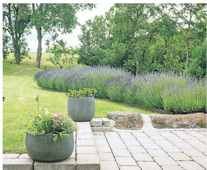
Wer Mauern bewusst plant, findet in ihnen ein wertvolles Gestaltungselement für Außenräume, die den Wohnbereich nach draußen erweitern.

(DJD). Mauern sind heute Teil einer durchdachten Gartengestaltung. Wer sie frühzeitig in die Planung einbezieht, findet in ihnen ein wertvolles Gestaltungselement für „Outdoor Living“ – die konsequente Verlängerung des Wohnbereichs ins Freie. Sie können Hanglagen abfangen, Terrassen fassen, Wege gliedern und Sichtschutz schaffen, wie Beispiele unter www.santuro.de zeigen. Neben Naturstein kommt dafür auch Betonstein infrage: Mauersysteme wie Santuro stehen für robuste, frostbeständige Systeme, die vielseitig einsetzbar sind. In manche Mauersysteme lassen sich Leuchten und Steckdosen einbauen, die den Garten in einen vollwertigen Außenwohnraum verwandeln. Auch naturnahe Konzepte lassen sich damit umsetzen: Hohlräume oder bewusst offen gelassene Bereiche schaffen Rückzugsorte für Insekten.