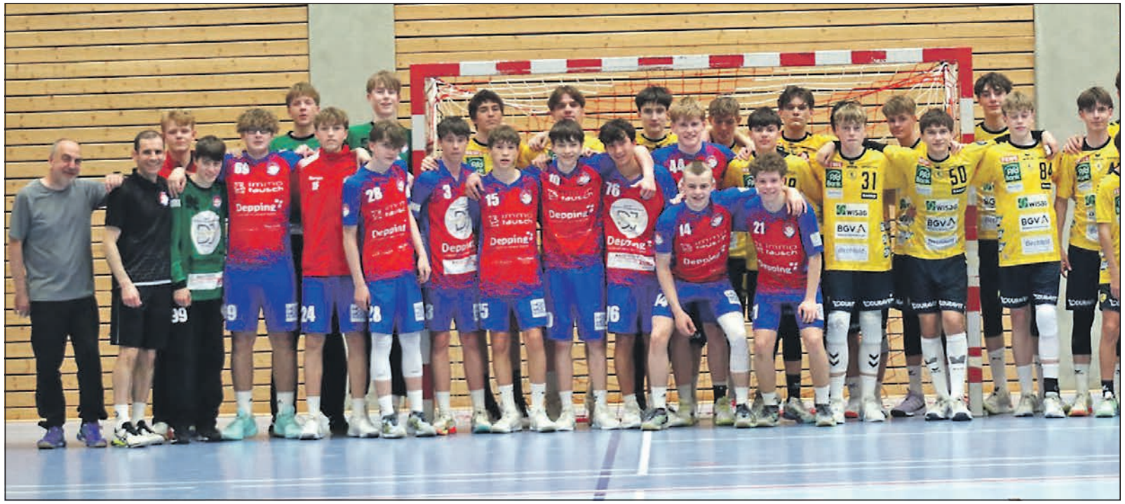
Die A-Jugend der HSG Schwalbach/Niederhöchstadt (rote Trikots) hat nach wie vor die Chance auf den Regionalliga-Aufstieg.