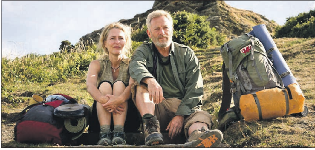
Gilian Anderson und Jason Isaacs spielen die Hauptrollen in dem Film „Der Salzpfad“, der am Freitag im „Eschborn K“ zu sehen sein wird.