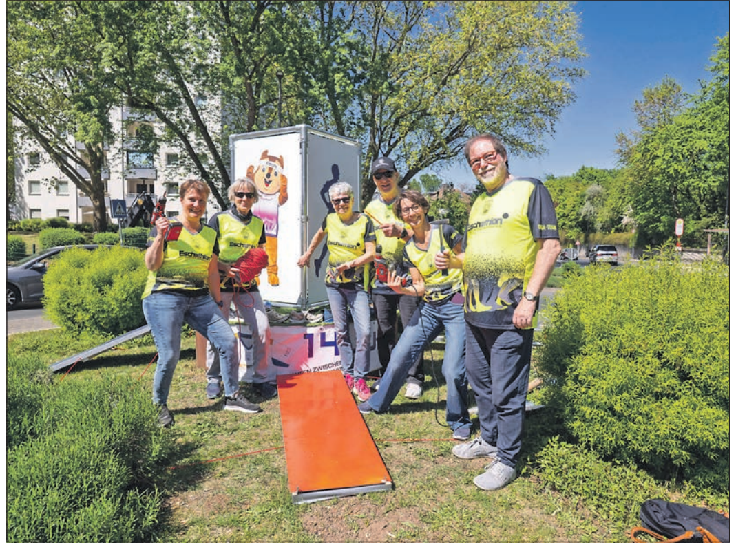
Seit vergangener Woche weist am Vereinskreisel eine eigens entworfene Skulptur auf den Eschathlon 2026 hin, die Mitglieder des Stadtlaufvereins aufstellten.