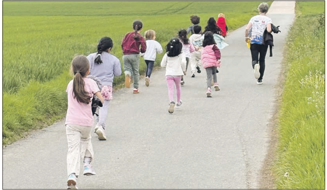
Die Kinder des Hartmut-Campus trainieren für die Bambini-Läufe.

Die Stadtverwaltung bittet um eine kostenfreie Anmeldung über das Eventportal eveno.com/eschborn_waermeplanung im Internet. Weitere Informationen erhalten Interessierte bei der Stabsstelle Energie und Klimaschutz der Stadt Eschborn per E-Mail an klimaschutz@eschborn.de oder unter der Telefonnummer 06196-490279.