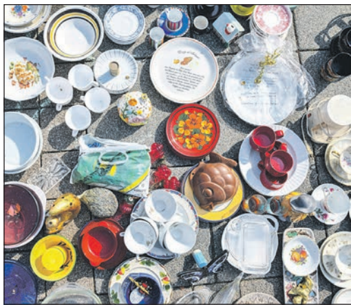
Einmal im Monat findet auf dem Festplatz der Flohmarkt statt.

Der städtische Flohmarkt findet ebenfalls bis auf weiteres auf dem ehemaligen Festplatz statt. Die Termine in diesem Jahr sind am 30. Mai, am 4. Juli, am 22. August und am 19. September, jeweils von 8 bis 14 Uhr. Ein Standplatz auf dem Flohmarkt ist kostenlos. Monatlich ist allerdings eine Voranmeldung erforderlich. Sie kann telefonisch unter der Nummer 06196 490-210 oder per Mail unter ordnung@eschborn.de bei Ivonne Pfeiffer erfolgen.