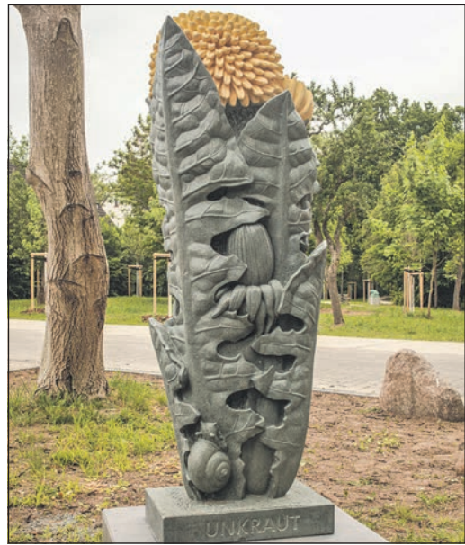
Auch die Skulptur „Unkraut“ ist in Eschborn zu sehen.

In der Schlussphase wurde es noch einmal spannend. Dominik Gremme verkürzte mit einem direkt verwandelten Freistoß auf 5:6, ehe Timo Gremme nach einer Ecke der Ausgleich gelang. Kurz vor dem Ende entschieden die Gäste das torreiche Spiel jedoch durch einen Foulelfmeter zum 7:6 für sich. Erstmals standen bei der Mannschaft der städtischen Körperschaften auch drei Spielerinnen auf dem Platz.