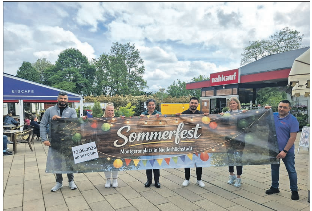
Die Vertreter der Ladengemeinschaft am Montgeronplatz in Niederhochtadt laden für den 13. Juni zum diesjährigen Sommerfest ein.