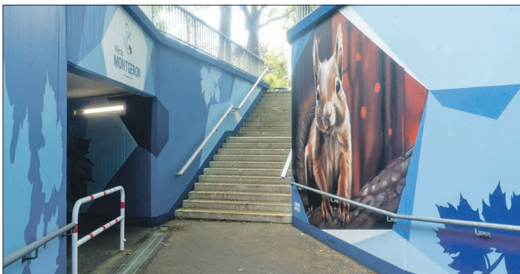
Zwei weitere Unterführungen in Eschborn wurden jetzt neu gestaltet.