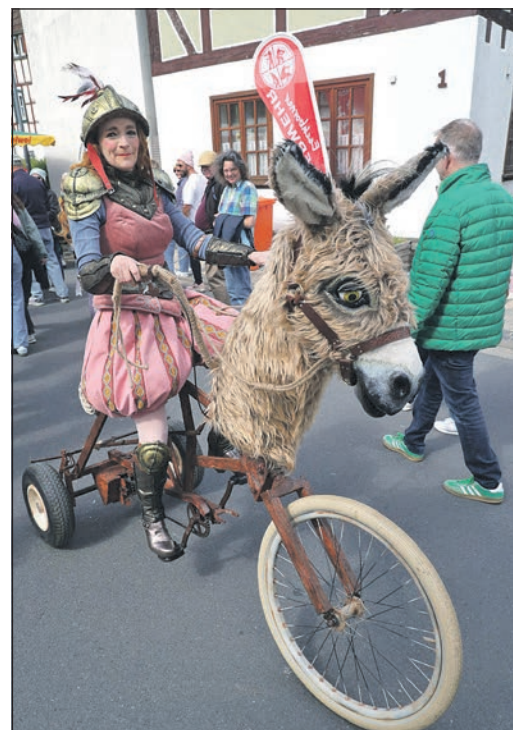
Ein echter Hingucker war der „Driving-Act“ auf hölzernem Fahrrad.