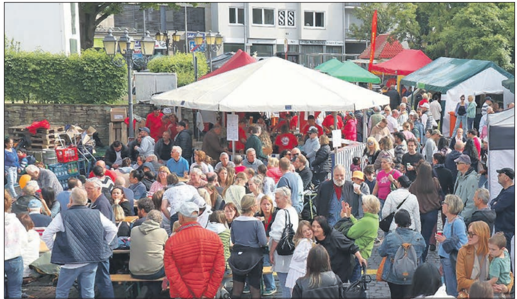
Zentrum des Festes war auch in diesem Jahr der Eschenplatz, wo auf der großen Bühne zahlreiche Bands die verschiedensten Stilrichtungen boten.