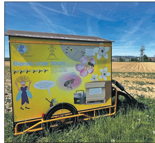
Wie schon im vergangenen Jahr machen die Wanderbienen des Regionalparks wieder in Eschborn Station.

Bis Ende Juli bieten die Imker außerdem Workshops für Kita-Gruppen und Schulklassen an. Dabei können die Kinder auch einen Blick in den Bienenwagen werfen. Weitere Informationen gibt es unter regionalpark-rheinmain.de/wanderbienen im Internet.