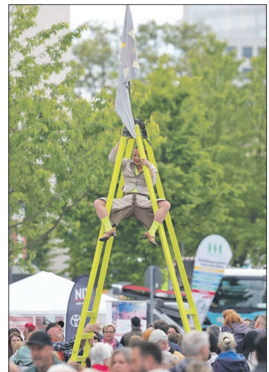
Mitten im Publikum turnte ein Akrobat mit seiner Leiter herum.