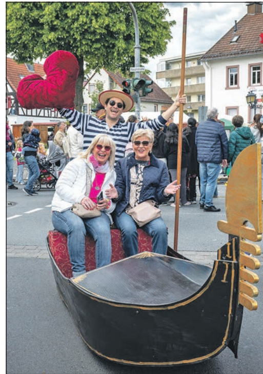
Die rollenden Gondeln sorgten für einen Hauch von Venedig.