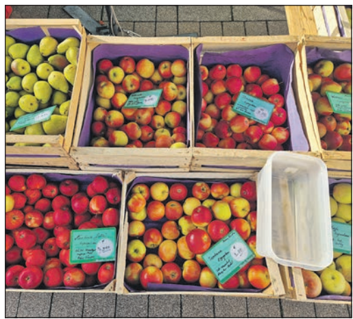
Der Eschborner Wochenmarkt bietet jeden Mittwoch auch frisches Obst und Gemüse in großer Auswahl.

Eschborn (ew). Vor dem Kauf eine Empfehlung und eine manchmal sogar eine Kostprobe erhalten, Plastik vermeiden, die Atmosphäre genießen oder in der verlängerten Mittagspause frische Luft schnappen – es gibt viele gute Gründe, den Wochenmarkt zu besuchen.