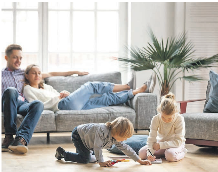
Die Basis für ein behagliches Zuhause: Fließestriche ermöglichen moderne Bodenaufbauten inklusive einer Fußbodenheizung.