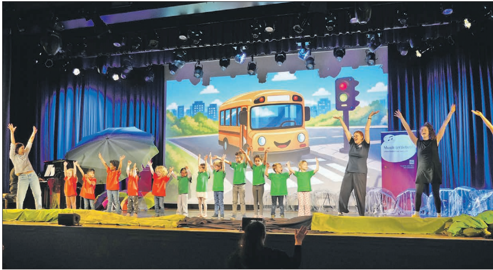
Beim Lied „Die Räder vom Bus drehen sich im Kreis“ forderten Kinder und Musiklehrerinnen das Publikum zum Mitmachen auf und Eltern, Großeltern und Geschwister im Saal machten begeistert mit.