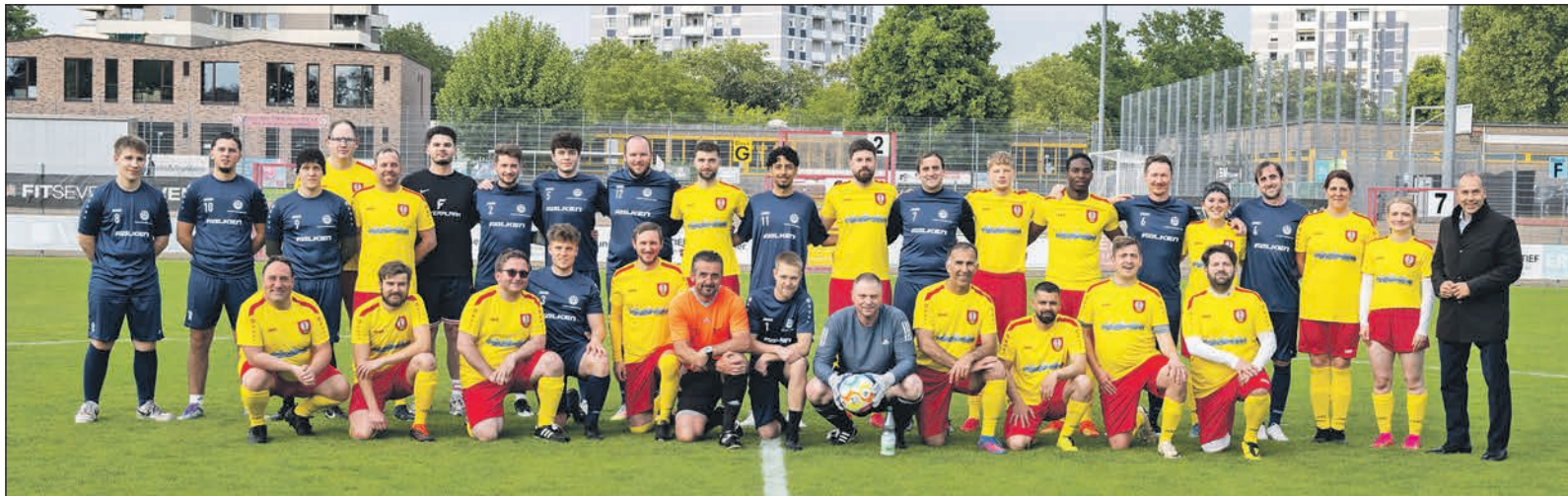
Erstmals traten im „Team der städtischen Körperschaften“ (gelbe Trikots) auch drei Spielerinnen an.

Eschborn (ew). Durch die Sommerausstellung „Durch die Blume“ des Bildhauers Joscha Bender führt Kunsthistorikerin Ingrid Schloegl am Donnerstag, 21. Mai, um 18 Uhr im Park an der Alten Mühle. Erstmals findet die jährliche Skulpturenausstellung in dem neu angelegten Park statt. Gezeigt werden Arbeiten aus der Werkgruppe „Sprichwörter“, in der Joscha Bender florale Motive und Tierdarstellungen aufgreift. Seine Skulpturen entstehen direkt aus dem Steinblock und werden ohne vorheriges Modell gefertigt. Diese Technik wird als „direct carving“ bezeichnet. Treffpunkt für die Führung ist im Park an der Alten Mühle 20. Anmeldungen nimmt die Stadt per E-Mail an kultur@eschborn.de oder telefonisch unter der Nummer 06196-490180 entgegen.