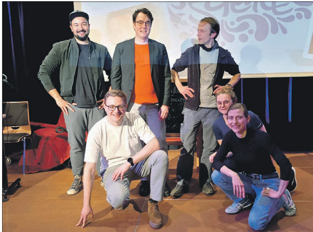
„Frank(l)y Science-Slam“ verbindet am Samstag im „Eschborn K“ wieder trockene Wissenschaft und lustige Unterhaltung.