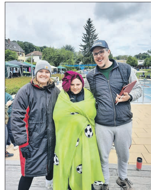
Bei den Bezirksmeisterschaften in Bad Soden waren die Bedingungen wegen der kühlen Witterung nicht optimal.