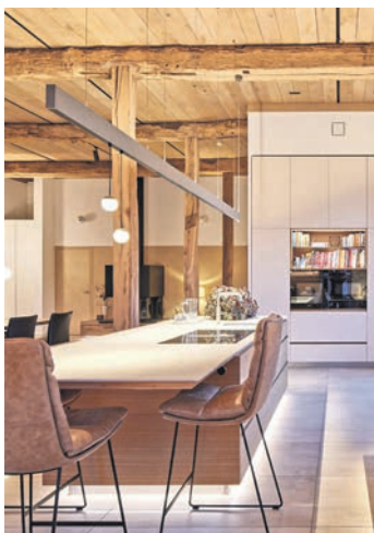
Der Umbau eines Pferdestalls in ein Wohngebäude zeigt, wie viel Charme in historischen Gebäuden stecken kann.

(DJD). Am nachhaltigsten dürfte das Wohnhaus sein, das gar nicht erst gebaut werden muss – weil es schon seit Jahrzehnten steht. Die Sanierung von Altbauten schont Ressourcen und ist somit sowohl ökologisch als auch finanziell eine gute Entscheidung. Historische Häuser strahlen zudem individuellen Charme aus, erfordern bei der Modernisierung jedoch viel Fachwissen. Beispiel: Empfindliche Fassaden benötigen Materialien wie diffusionsoffene Silikat- und Kalksysteme. Auch im Innenraum steht Nachhaltigkeit im Fokus: Konservierungsmittelfreie und emissionsarme Innenfarben fördern die Wohnqualität. Um historische Bausubstanz für die Zukunft zu erhalten, ist eine professionelle Unterstützung unverzichtbar. Mehr Informationen und eine individuelle Beratung gibt es im Fachhandwerk, Ansprechpartner vor Ort lassen sich unter www.brillux.de finden. Die Fachleute bringen Nachhaltigkeit und Qualität auf einen Nenner, damit Gebäude mit Geschichte auch noch viel Zukunft vor sich haben.