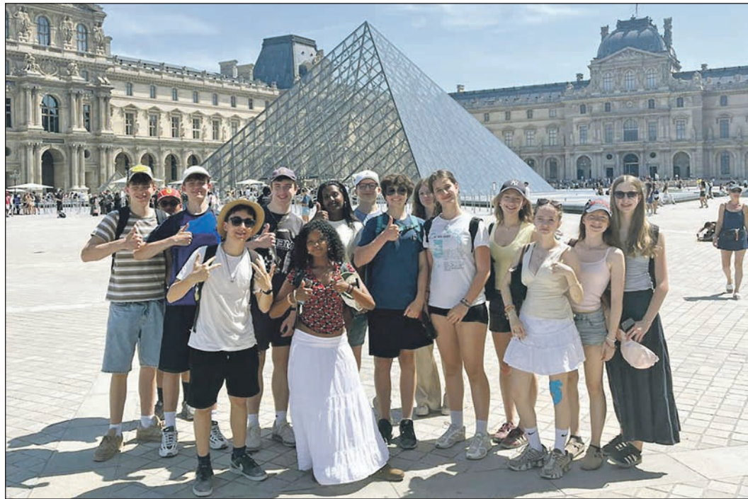
Natürlich stand auch der Louvre mit seiner Glaspyramide auf dem Programm der HvK-Schüler bei ihrem Besuch in Paris und Montgeron.