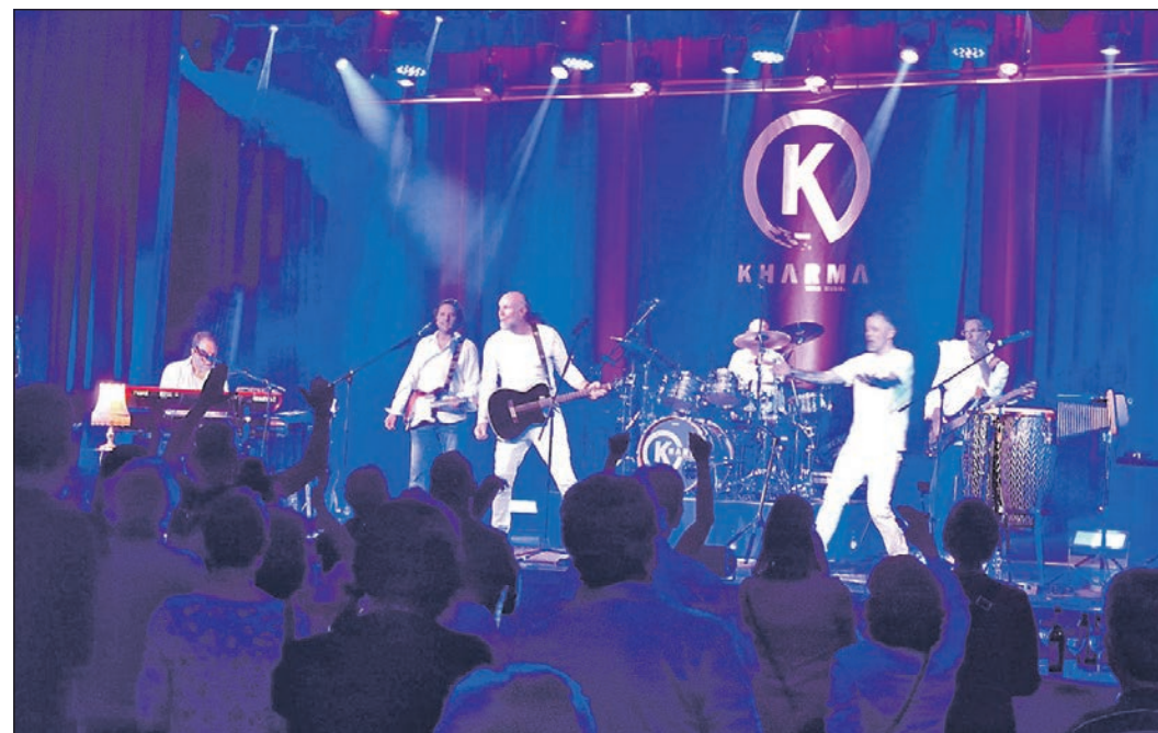
Die Band „Kharm“ sorgte beim diesjährigen Benefizkonzert des Lions Clubs Eschborn für beste Stimmung im Bürgerzentrum Niederhöhnstadt.