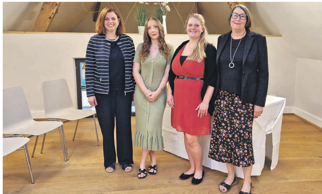
Die vier Eschborner Standesbeamten freuen sich, bald die erste Ehe im Dachgeschoss der Alten Mühle schließen zu dürfen.

Feier in der Gastronomie der Alten Mühle veranstalten. Bei gutem Wetter steht dafür auch der Innenhof zur Verfügung. Das Gelände rund um die Alte Mühle bietet außerdem zahlreiche Möglichkeiten für Hochzeitsfotos. Zunächst steht der neue Trauort ausschließlich Eschborner Bürgerinnen und Bürgern offen. Das bisherige Trauzimmer im historischen Fachwerkgebäude des Museums am Eschenplatz bleibt weiterhin bestehen. Weitere Informationen erteilt das Standesamt per E-Mail an standesamt@eschborn.de oder unter der Telefonnummer 06196-490780.