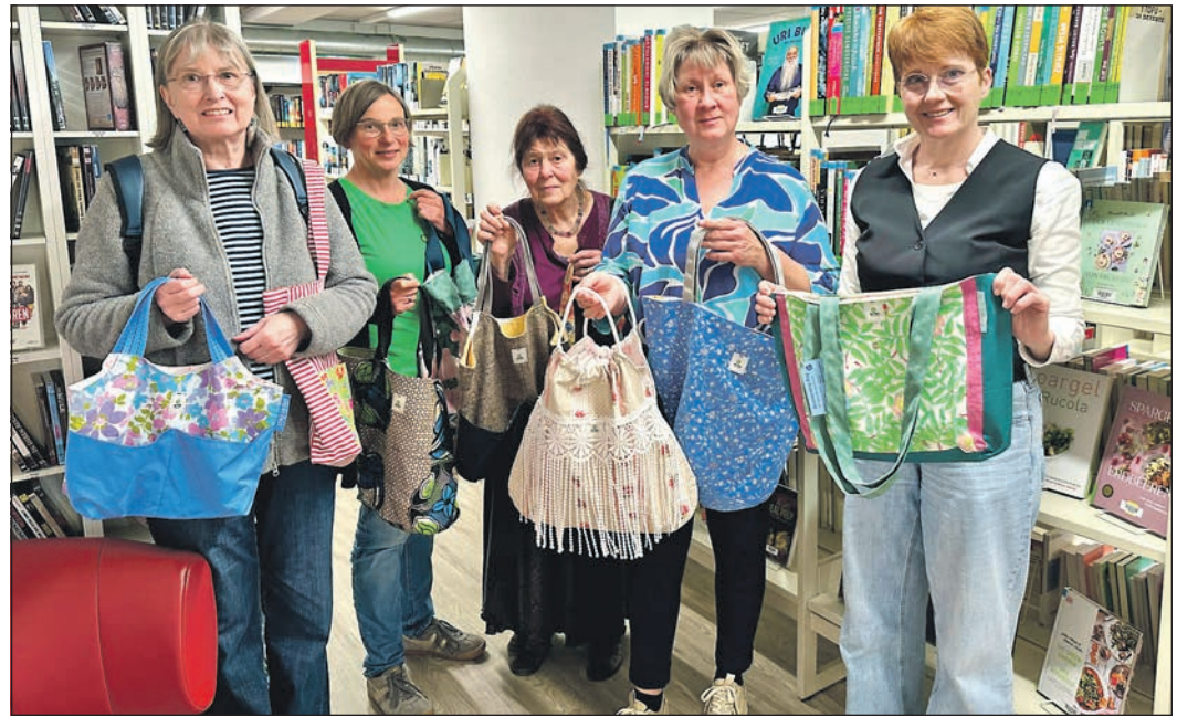
In den städtischen Büchereien in Eschborn und Niederhöhnstadt können jetzt handgenähte Stoffbeutel zum Büchertransport ausgeliehen werden.