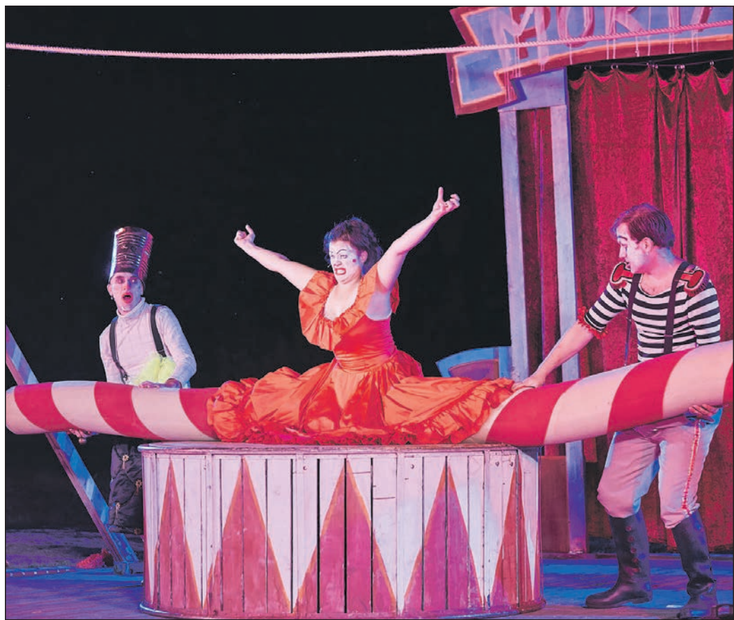
Ein bisschen skurril wird es bei „Spaghetti Mortale“ im August.