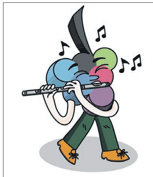
Ein besonderer Auftakt für junge Festivalgäste mit Musik zum Staunen und Mitfiebern: Im Haus der Begegnung erleben Kinder, wie Götter, Helden und Drachen durch Musik lebendig werden.