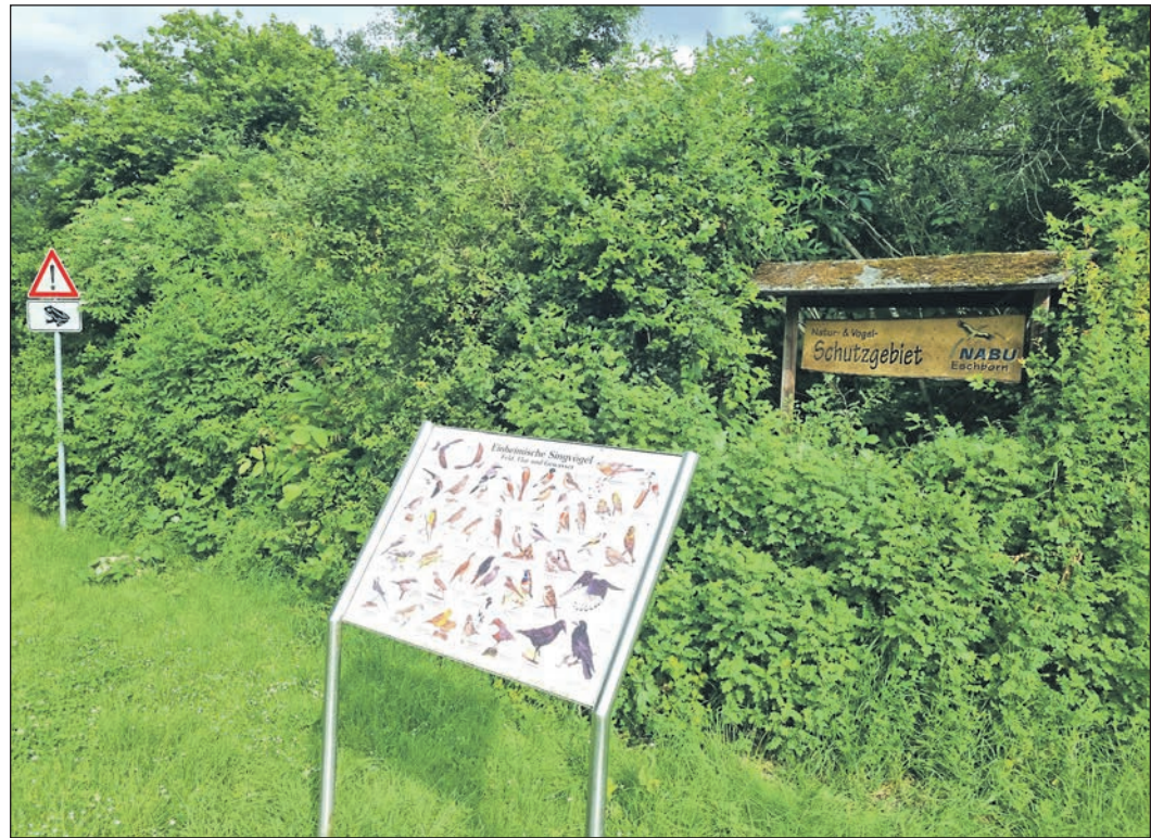
Am 14. Juni kann das Schutzgebiet des Eschborner NABUs erkundet werden.