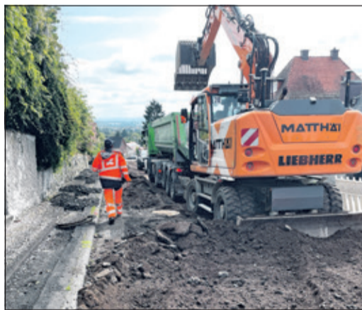
Der Bordstein auf der Nordseite ist schon geöffnet für Glasfaser. Links neben dem Bagger ist der Deckel des Hauptkanals zu sehen.