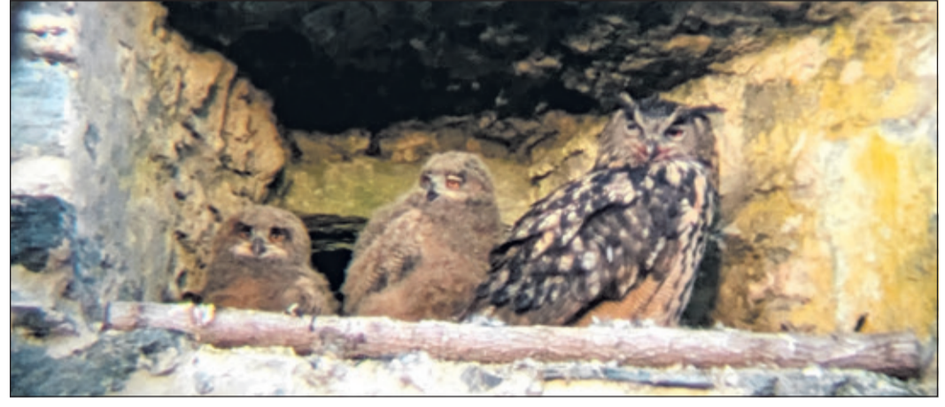
Ein Uhu-Elternteil mit den beiden Jungtieren