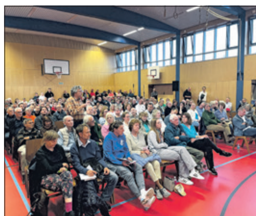
Volle Reihen, gereizte Grundstimmung bei der Infoveranstaltung zur Baumaßnahme