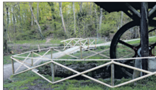
Die Mitarbeiter des städtischen Betriebshofs haben im Woogtal gute Arbeit geleistet und die Geländer erneuert.

Mit viel handwerklichem Können hat der Betriebshof ganze Arbeit geleistet: Die Geländer wurden sorgfältig zugeschnitten und fachgerecht angebracht. Sie fügen sich harmonisch in die Landschaft ein und sorgen gleichzeitig für mehr Sicherheit entlang der