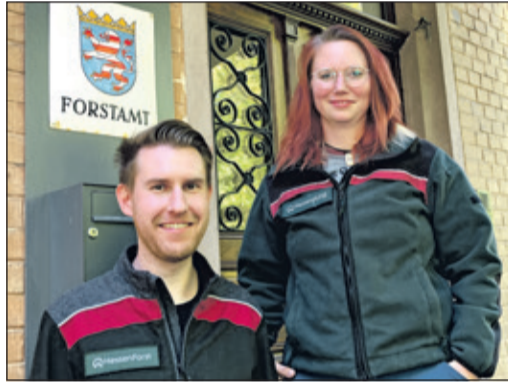
Bisherige und neue Revierleitung im Revier Feldberg

Pracht steht fortan als Ansprechpartnerin im Revier Feldberg zur Verfügung. Das Forstrevier Feldberg umfasst den Bereich rund um