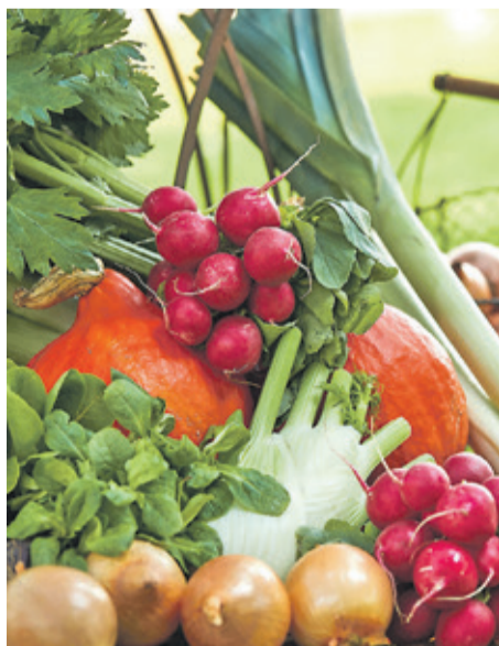
Gesunde Abwechslung auf dem Speiseplan: Traditionelle Gemüsesorten erleben ihre Renaissance.