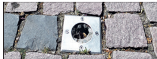
Eine der zerstörten Leuchten

nommen. Wer zur Aufklärung der Tat beitragen kann, wird gebeten, sich unter 06174 9266-0 bei der Polizeistation Königstein zu melden.