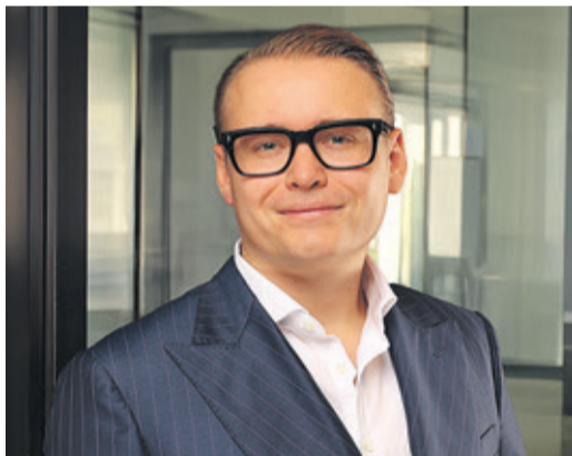
Paul Huelsmann, CEO FINEXITY Group

Huelsmann: Mit VolksInvest öffnen wir ein Segment, das Privatanlegern bislang verschlossen war: langfristig strukturierte Infrastrukturinvestments wie der „Solarpark Ratekau“ – ein Projekt mit rund 5,8 Mio. € Gesamtvolumen und 20 Jahren Laufzeit. Solche Anlagen mit regelmäßigen Zins- und Tilgungszahlungen waren bisher institutionellen Investoren vorbehalten. Die Entwicklung der Sparzinsen seit 2000 – von rund 2,5 % -4,0 % auf ein langjähriges Niedrigzinsniveau nahe null – zeigt, dass klassische Anlageformen kaum noch verlässliche Erträge bieten. Genau diese Lücke schließen wir mit einem Investment bereits ab 50 €, das regelmäßige Auszahlungen mit realwirtschaftlicher Substanz verbindet und somit eine gezielte Diversifikation für einen planbaren, auf Langfristigkeit ausgelegten Vermögensaufbau ermöglicht.