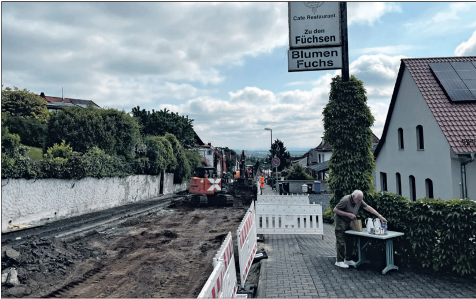
Das Leben auf der Baustelle: Ohne Straße und rasende Autofahrer könnte es so schön ruhig sein, wenn dieser nervige Baulärm nicht wäre. Bei den „Füchsen“ hat man sich für die Cateringsportorte mit den Bauarbeitern gut arrangiert, zum Dank gibt es Kaffee.

Mammolshain (as) – Seit gut einer Woche gibt es jetzt die Vollsperrung auf der Kronthaler Straße in Mammolshain. Eine von – im besten Fall – 50 Wochen, wenn man beide Bauabschnitte zusammennimmt, in denen die Mammolshainer mit der Baustelle leben und sich mit den Einschränkungen arrangieren müssen. Der Zeitplan gilt als verbindlich, die Vorgabe macht ein Großereignis.