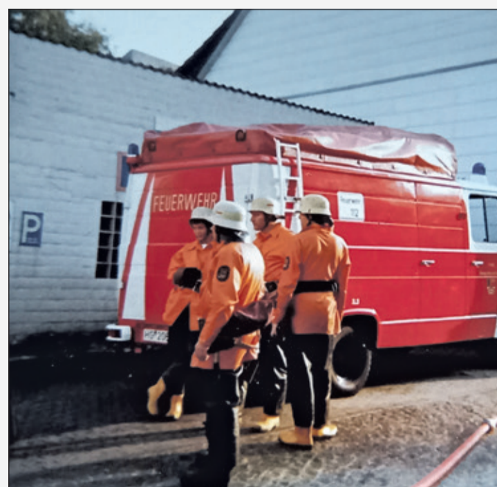
Das Zwischenstadium in Sachen Schutzkleidung: gummierte Schutzanzüge in den 1980er Jahren.

Moderne Einsatzkleidung ist ein durchdachtes System aus mehreren Schichten: eine hitzeabweisende Außenschicht, eine isolierende Zwischenschicht und eine komfortable Innenschicht. Materialien wie hitzebeständige Fasern sorgen dafür, dass Flammen, Strahlungswärme und Funken weniger Schaden anrichten. Ergänzt wird die Kleidung durch robuste Lederstiefel,