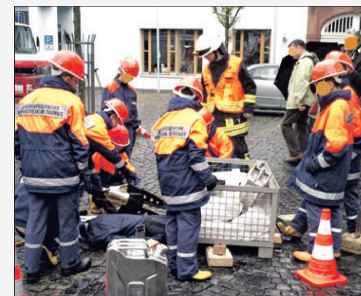
Nachwuchs in Aktion – Ausbildung und Teamgeist seit 1966. Hier ist die Jugendfeuerwehr bei einer Übung in blauer Schutzkleidung zu sehen.

Wer sich für Mitarbeit, Mitgliedschaft oder eine Führung interessiert, findet Informationen auf der Webseite der Stadt Königstein oder direkt am Feuerwehrhaus. Kommen Sie vorbei, lernen Sie uns kennen und erleben Sie Einsatzkleidung und Fahrzeuge live bei unseren Jubiläumsveranstaltungen.