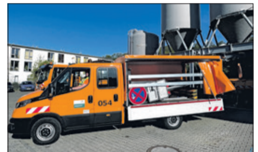
Der neue IVECO Daily für die tägliche Arbeit des Betriebshofs

Neben dem regulären Einsatz im Betriebshof wird das neue Fahrzeug auch für den Katastrophenschutz vorgehalten. Dank seiner Ausstattung ist es zudem in der Lage, Anhänger zu ziehen und es kann flexibel auf unterschiedliche Einsatzanforderungen ausgelegt werden.