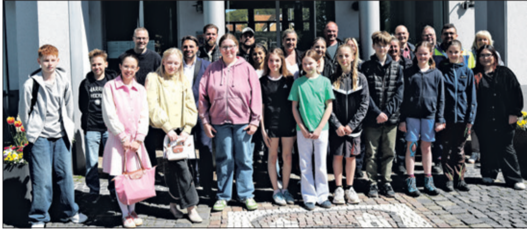
Die teilnehmenden Girls und Boys beim Zukunftsorientierungstag mit ihren Betreuern von der Stadt Königstein

Großer Andrang beim diesjährigen Zukunftsorientierungstag der Stadt Königstein im Taus: Zahlreiche Schülerinnen und Schüler nutzten die Gelegenheit, beim Girls' and Boys' Day spannende Berufsfelder kennenzulernen und neue Perspektiven für ihre berufliche Zukunft zu entdecken.