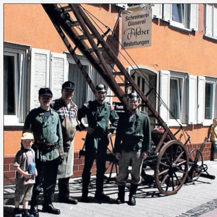
Mitglieder der Königsteiner Feuerwehr in den historischen Drillichjoppen anlässlich eines früheren Jubiläums.

Erkenntnisse aus Brandversuchen und der Einführung von Nomex: In den 1990er Jahren führten eine Reihe kontrollierter Brandversuche zu einer entscheidenden Erkenntnis: Die bis dahin als besonders schützend geltenden Schweißjacken zeigten unter intensiver Hitze unerwartete Schwachstellen. Unter