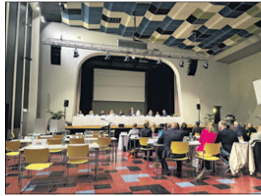
Denkwürdiger Moment: Wo normal die ALK-Fraktion sitzt, herrscht gähnende Leere in der Stadtverordnetenversammlung.

„In der von der Verwaltung vorgelegten 25-seitigen Beschlussvorlage einer neuen Geschäftsordnung sind gegenüber der gar nicht so alten, seit 2017 weitgehend problemlos angewendeten, einschneidende Änderungen enthalten“, kritisiert der ALK-