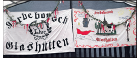
Die Kerbeborsch sind wieder aktiv.

Los geht es mit den Kerbervorbereitungen bereits am kommenden Samstag, also sechs Tage vor dem Auftakt, mit dem Zeltstellen. Der Kerbverein, der binnen zweieinhalb Jahren auf 151 Mitglieder gewachsen ist, hat sich bei der Jahreshauptversammlung Anfang des Jahres selbst einen Kerbeausschuss gegeben, in dem die einzelnen Aufgaben auf insgesamt mehr Schultern verteilt werden als noch in den vergangenen Jahren. Scheint also alles zu laufen für die Kerb in Glashütten. Jetzt muss nur noch das – zuletzt manchmal launische – Pfingstwetter mitspielen.