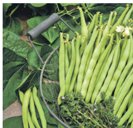
Früher schon beliebt und heute immer noch lecker: Die Buschbohne Saxa zählt zu den traditionellen Gemüsesorten, die wieder neu entdeckt werden.

gemüse Stielmus: Die Sorten beweisen, dass Genuss oft viel mit Tradition zu tun hat.