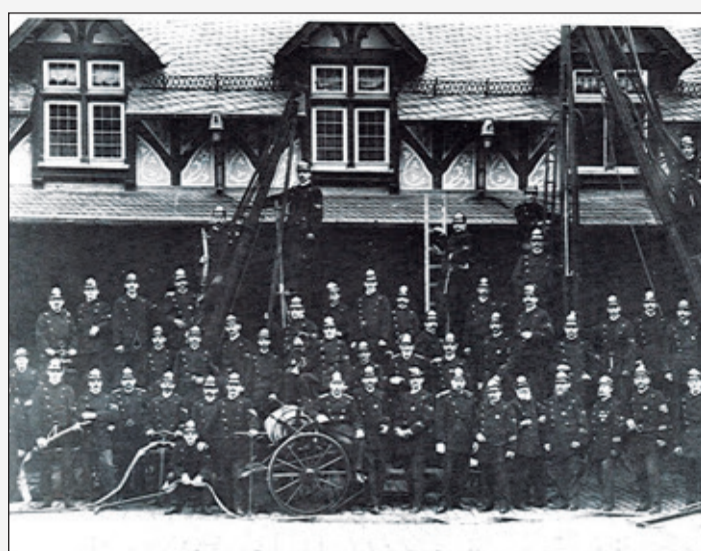
So sah das Jubiläums-Gruppenbild vor 125 Jahren aus.