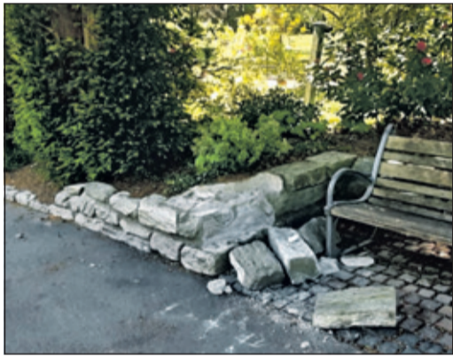
Trümmerfeld: die beschädigte Mauer am Schachfeld.

Königstein (kw) – Am vergangenen Wochenende kam es im Kurpark zu einem weiteren Vandalismussvorfall. Dabei wurde die Steinmauer am Schachfeld erheblich beschädigt. Das Schadensbild ließ zunächst auf eine mögliche Fahrzeugkollision schließen. Da jedoch keine entsprechenden Rückstände oder Hinweise auf ein beteiligtes Fahrzeug festgestellt werden konnten, ist nach aktuellem Stand von mutwilliger und massiver Gewaltanwendung auszugehen. Die Höhe des entstandenen Sachschadens steht derzeit noch nicht fest. Hinweise zum Vorfall nehmen die zuständigen Stellen entgegen. Auch dieser Fall wurde von der Stadtverwaltung bei der Polizei angezeigt. Sachdienliche Hinweise werden gerne entgegengenommen: Tel. 06174 9266-0.