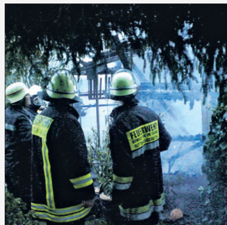
Ein aktueller Einsatz der Freiwilligen Feuerwehr Königstein in Nomex-Schutzkleidung.

ergonomische Helme mit Visier und Atemschutzgeräte, die zusammen ein umfassendes Schutzkonzept bilden.