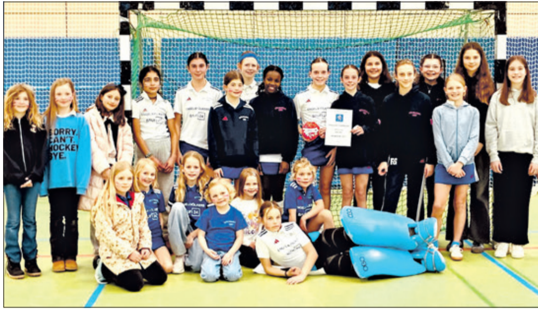
Hockey ist nicht nur ein toller Teamsport, sondern immer auch ein Familien-Hobby: Die WU12-Mädchen des MTV Kronberg nach dem Spiel, umgeben von Spielerinnen anderer Teams und ihren größten Fans – den Geschwisterkindern.

Im Halbfinale besiegten sie die Mannschaft des WHTC Wiesbaden souverän. Das Finale entwickelte sich von Beginn an zu einer in-