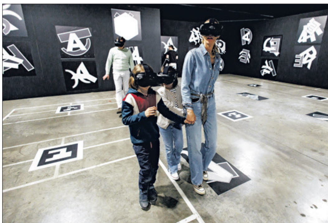
Im Metaversum wandelt man durch die Gänge, lauscht den Gesprächen der Passagiere und kann einen Blick über die Reling werfen.

Eine vollständig computererzeugte, digitale Welt, die die reale Umgebung ersetzt.