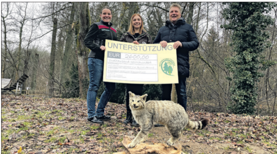
Das neue Auswilderungsgehege befindet sich versteckt im Wald, weit weg von Straßen und Menschen.

Kronberg (kb) – Die europäische Wildkatze ( Felis silvestris ) war im späten 18. Jahrhundert nahezu ausgerottet. Heute ist die Wildkatze eine streng geschützte Art und ihr Bestand erholt sich langsam wieder. Sie genießt den gleichen Schutzstatus wie Tiger oder Nashorn. Im Taunus leben vergleichsweise viele Wildkatzen, das zeigt zuletzt die Wildkatzenerfassung, welche durch die Senckenberg-Gesellschaft initiiert und ausgewertet wurde. Aufgrund der starken Durchschneidung der Lebensräume durch Straßen kommen aber immer wieder Wildkatzen ums Leben und Kätzchen werden zu Waisen. Nach Aufzucht in einem Zoo müssen die Kätzchen wieder ausgewildert werden, um die Population zu erhalten.