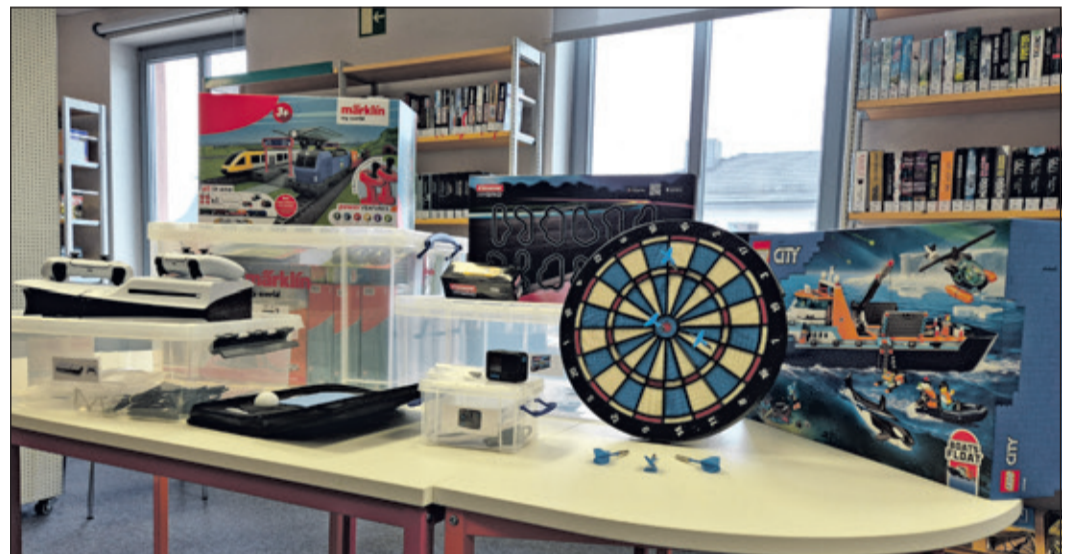
Unter den Sachen, die seit Ende 2025 die Bibliothek der Dinge erweitern, zählen unter anderem eine Dartscheibe, eine Playstation und eine Modelleisenbahn.

Kronberg (kb) – Seit mittlerweile einem Jahr können Nutzerinnen und Nutzer der Kronberger Stadtbücherei dort nicht nur Bücher und andere Medien entleihen, sondern sich auch unentgeltlich die Dienste eines Dampfreinigers, eines Teleskops oder einer Heckenscheere sichern. Die im Februar 2025 eingeweihte „Bibliothek der Dinge“ im Erdgeschoss der Stadtbücherei macht es möglich. Dort finden Interessierte sowohl Sachen, die hilfreich in Haus und Garten sind, als auch Spielwaren, Action Cams und mehr.