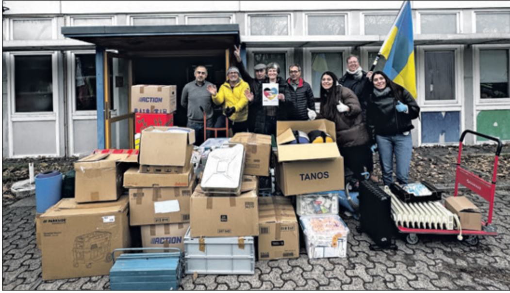
Das Team zeigt sich motiviert in der Fritz-Tarnow-Straße mit einem Teil der angelieferten Dinge.

Kronberg (kb) – Erstmals und aus dem Stand mit einem überwältigen Volumen an Sachspenden hat der Verein Aktives Kronberg am 21. Februar eine Sammlung für die vom Krieg leidgeprüften Ukrainer organisiert. Der Krieg, der die Menschen im Land durch die nicht enden wollenden russischen Angriffe auf die Infrastrukturen und ihr Lebensumfeld bis auf das Äußerste belastet, wird auch von den Menschen hier sehr deutlich wahrgenommen. Er belastet auch sie durch die persönliche Wahrnehmung von Ohnmacht und Hilflosigkeit gegenüber diesen Kriegsfolgen. Die Sammlung erfolgte im Rahmen des Repair Cafés im Stadthaus der Silberdisteln. Innerhalb von 2,5 Stunden kamen von Kronberger Bürgern an diesem Nachmittag im Stadthaus der Silberdisteln etwa acht Kubikmeter gut sortierte Sachspenden zusammen. Per Auto, auf hoch bepackten Sackkarren oder in prall gefüllten Kisten und Taschen spendeten die Bürgerinnen und Bürger, säuberlich sortiert, die auf der Liste ausdrücklich benannten Dinge. Dies macht deutlich: Die