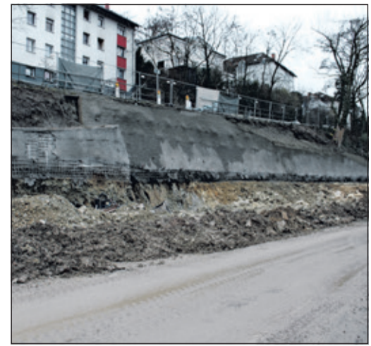
Eine neue Stützmauer am Bahnhof steht bereits.

Nichtsdestotrotz zeigten sich die Projektverantwortlichen optimistisch, diese Verzögerung wieder aufholen zu können und auch finanziell habe man noch ausreichend „Puffer“. Im Zuge der Arbeiten werden rund 20.000