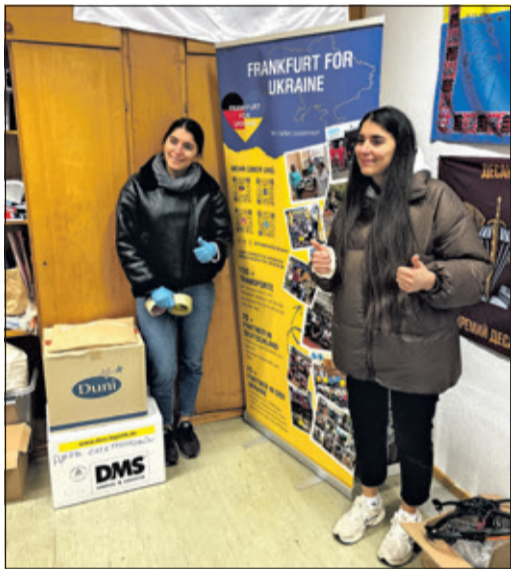
Zwei ukrainische Zwillingsschwwestern, die hier helfen und in Deutschland als Krankenschwestern arbeiten.

Kronberg (kb) – Erstmals und aus dem Stand mit einem überwältigen Volumen an Sachspenden hat der Verein Aktives Kronberg am 21. Februar eine Sammlung für die vom Krieg leidgeprüften Ukrainer organisiert. Der Krieg, der die Menschen im Land durch die nicht enden wollenden russischen Angriffe auf die Infrastrukturen und ihr Lebensumfeld bis auf das Äußerste belastet, wird auch von den Menschen hier sehr deutlich wahrgenommen. Er belastet auch sie durch die persönliche Wahrnehmung von Ohnmacht und Hilflosigkeit gegenüber diesen Kriegsfolgen. Die Sammlung erfolgte im Rahmen des Repair Cafés im Stadthaus der Silberdisteln. Innerhalb von 2,5 Stunden kamen von Kronberger Bürgern an diesem Nachmittag im Stadthaus der Silberdisteln etwa acht Kubikmeter gut sortierte Sachspenden zusammen. Per Auto, auf hoch bepackten Sackkarren oder in prall gefüllten Kisten und Taschen spendeten die Bürgerinnen und Bürger, säuberlich sortiert, die auf der Liste ausdrücklich benannten Dinge. Dies macht deutlich: Die