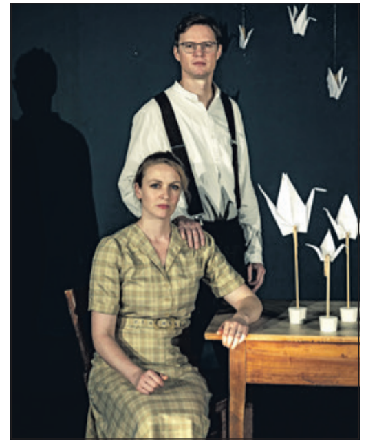
Das Theater Ensemble „duett zu dritt“