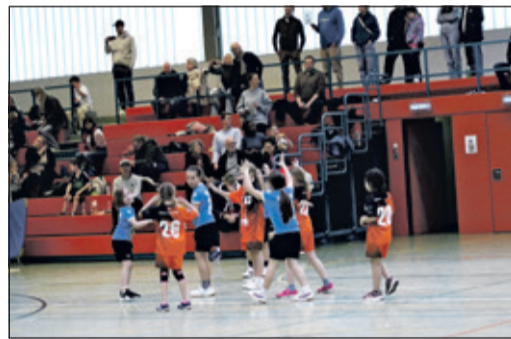
Das Publikum unterstützte die jungen Spieler von der Tribüne aus.

Ein durchweg gelungenes MiniSpielefest, das zeigte, wie viel Freude, Energie und Teamgeist im Kinderhandball steckt. Die HSG Steinbach/Kronberg/Glashütten präsentierte sich als hervorragender Gastgeber – und die jungen Talente bewiesen einmal mehr, dass der Nachwuchs im Handball bestens aufgestellt ist.