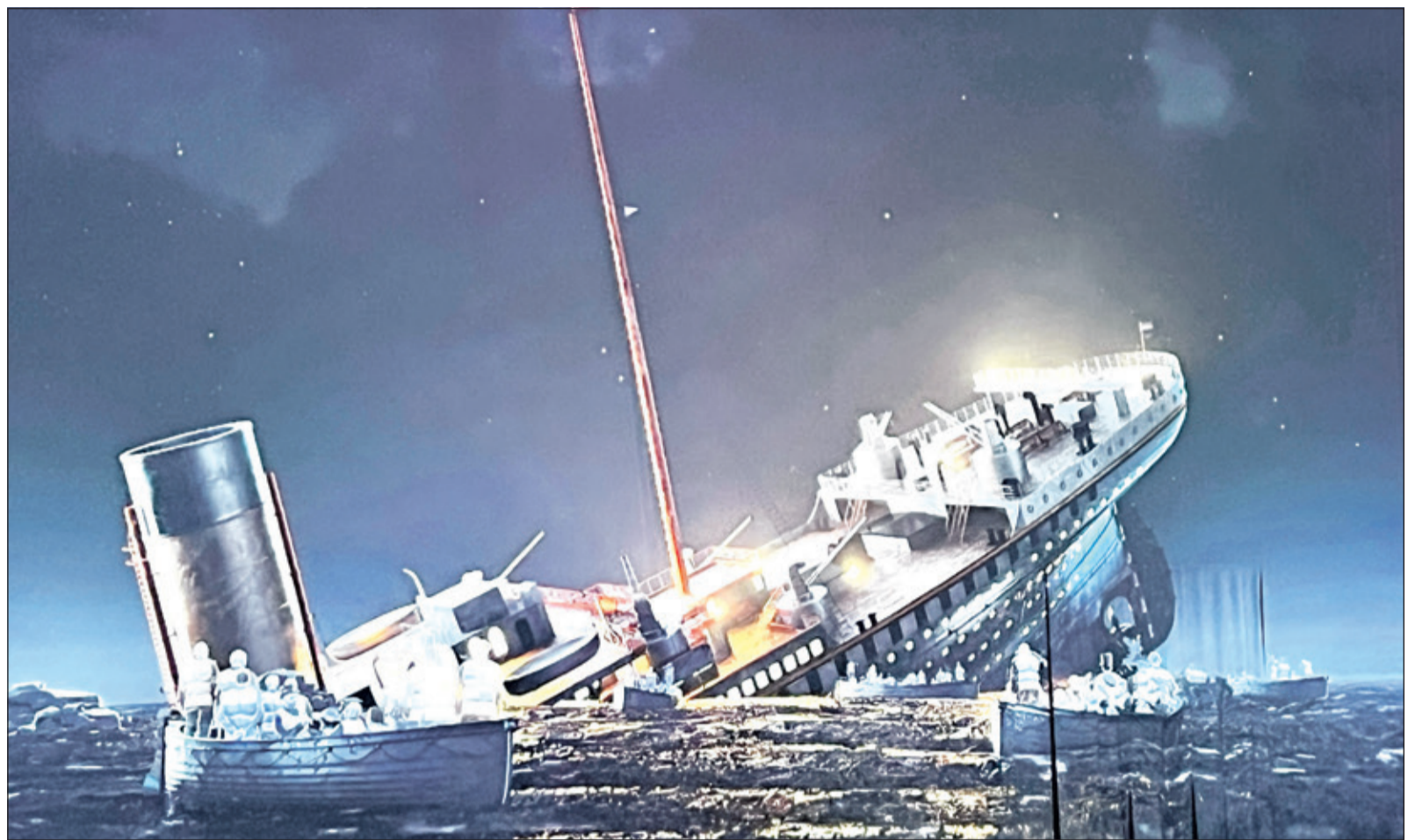
Nur 706 Menschen überlebten den Untergang der Titanic. Die meisten Toten waren Passagiere der Dritten Klasse.

Die Ausstellung führt die Besucher mitten hinein in diese Welt zwischen Triumph und Tragödie. Sie gehen an Bord des schwimmen-