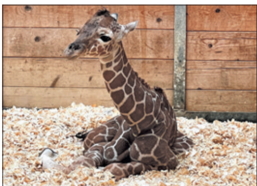
Netzgiraffenkalb „Mumbi“ im Opel-Zoo, ein Tag alt

Kronberg (kb) – Bei den Giraffen im Opel-Zoo gibt es wieder Nachwuchs: Netzgiraffe „Maja“ brachte am Morgen des 22. Februar nach knapp 15 Monaten Tragzeit ihr erstes Kalb zur Welt. Die Tierpfleger gaben dem zierlichen Jungtier in Anlehnung an die afrikanische Herkunft der Giraffen den kenianischen Namen „Mumbi“. Vor einem Jahr sorgte „Kianga“ als erster Netzgiraffen-Nachwuchs im Opel-Zoo seit 1984 für Begeisterung bei den Besuchern. Wie sie ist auch „Mumbi“ Tochter des Bullen „Timon“, der inzwischen schon nicht mehr im Opel-Zoo ist: Er wurde bereits im April 2025 im Rahmen des Europäischen Ex situ-