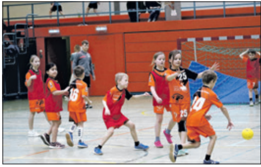
Großes Engagement im Kampf um den Ball.

Kronberg (kb) – Am vergangenen Sonntag verwandelte sich die Altkönigshalle in Steinbach in einen wuselnden, lauten und fröhlichen Treffpunkt für die jüngsten Handballer der Region. Die Handballspielgemeinschaft (HSG) Steinbach/Kronberg/Glashütten richtete ihr MiniSpielefest aus – ein sportliches Highlight für Kinder, Eltern und Trainer gleichermaßen.