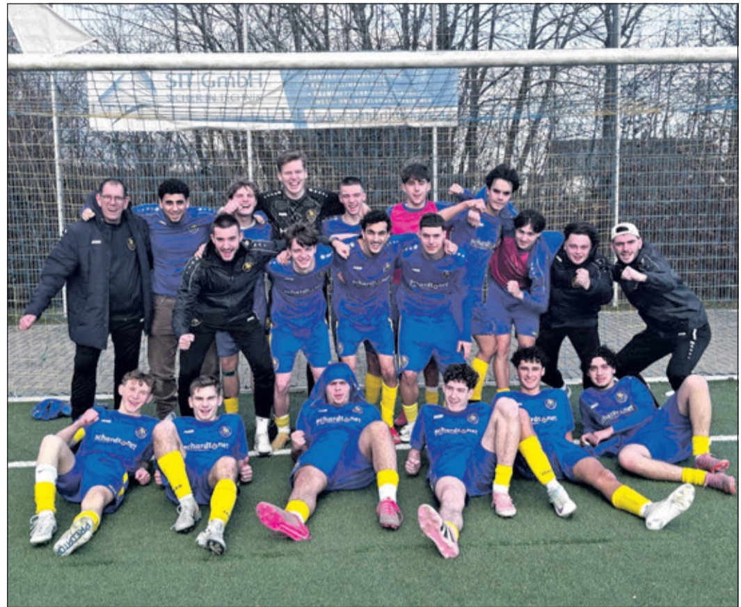
Die Mannschaft der A-Jugend feierte ihren torreichen Sieg in der Gruppenliga. Foto: privat

Oberhöchststadt (kb) – Die erste Mannschaft schießt sich mit einer tollen Vorstellung auf Tabellenplatz zwei, die A-Jugend trifft ebenfalls neunfach – und auch die C-Jugend startet erfolgreich in die Rückrunde.