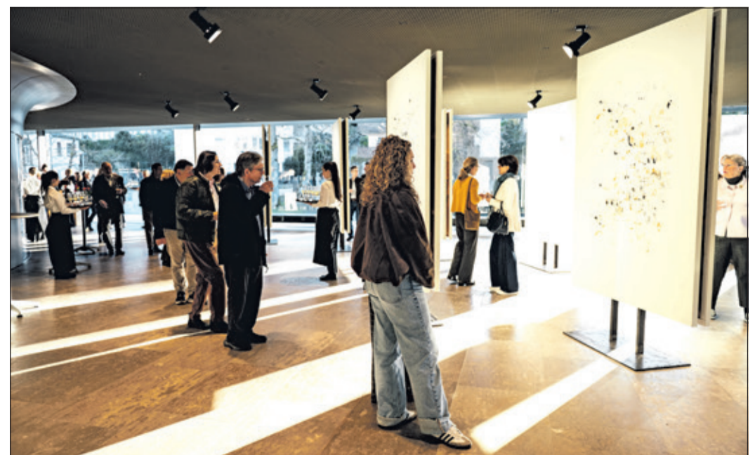
Einige interessierte Gäste ließen nach den Wortbeiträgen im Konzertsaal die Ausstellung auf sich wirken.