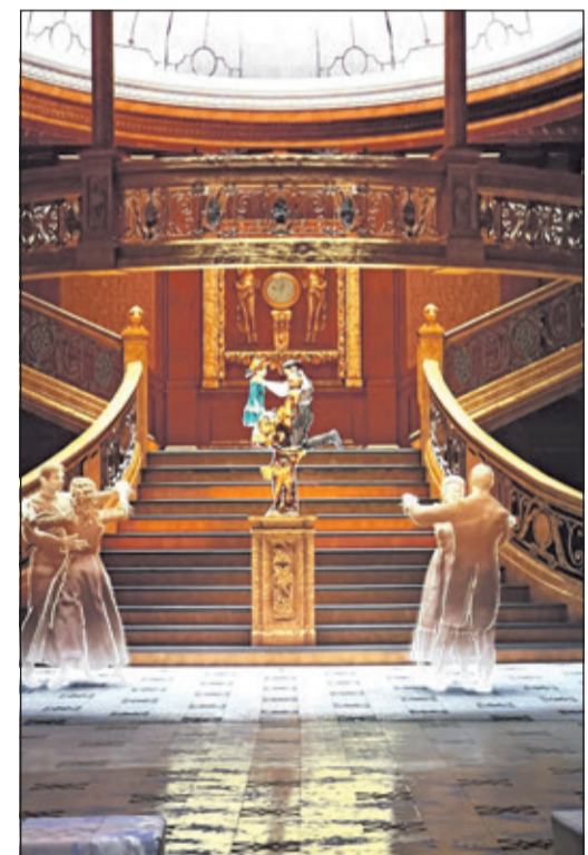
Die Besucher erleben Szenen, wie sie sich auf dem Ozeanliner zugetragen haben könnten.

Die Legende der TITANIC – Die Immersive Ausstellung kann noch bis zum 12. April besichtigt werden in der: Raumfabrik Frankfurt Heddernheimer Landstraße 155 60439 Frankfurt am Main Täglich 10 bis 21 Uhr Tickets ab 22 Euro unter www.titanic-immersiv.de