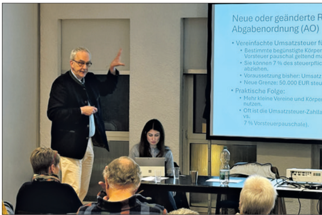
Bei der Jahreshauptversammlung wurden einige wichtige Punkte besprochen.

Kronberg (kb) – Rund 18 Teilnehmerinnen und Teilnehmer kamen zur 59. Jahreshauptversammlung des Vereinsrings Kronberg zusammen. Trotz zeitgleich stattfindender Versammlungen anderer Vereine konnte der Vorstand über wichtige Entwicklungen berichten und verschiedene Themen vorstellen.