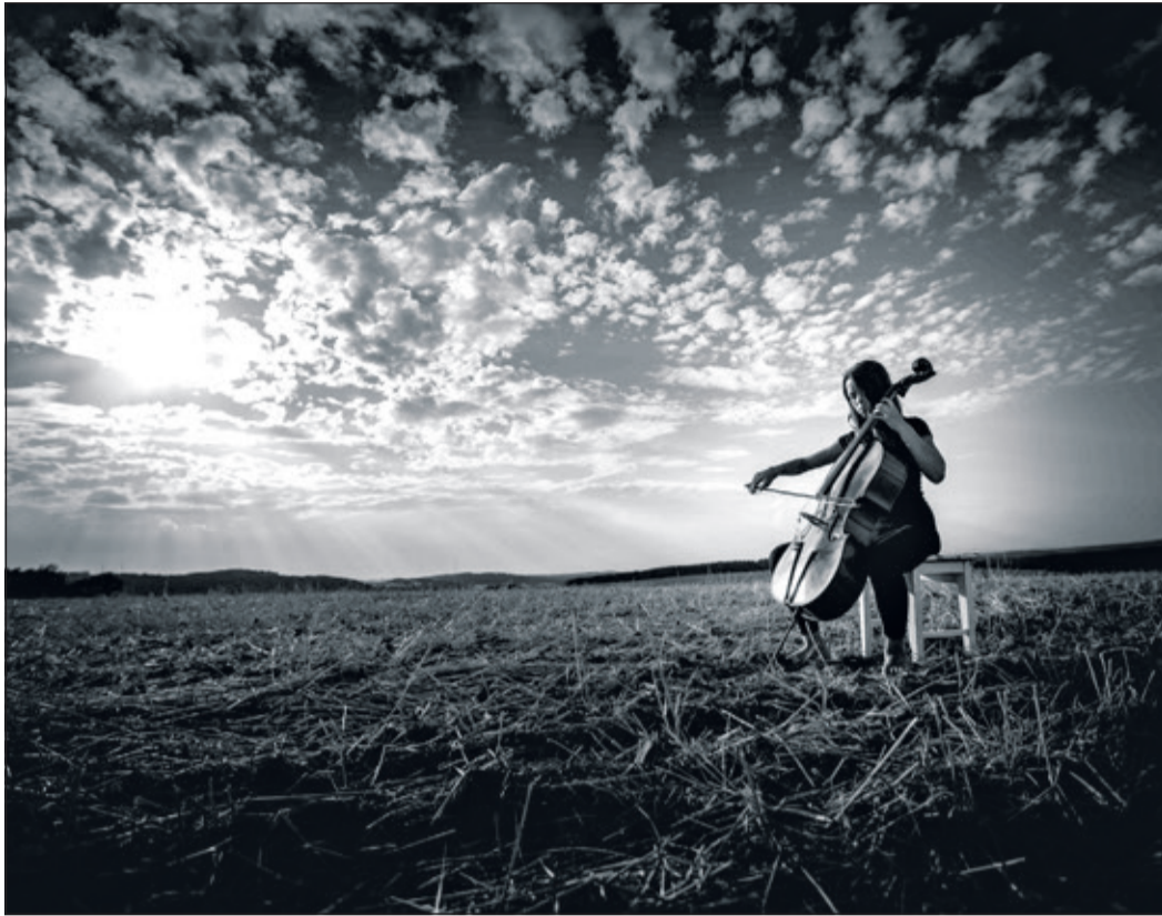
Patricia Truchsess von Wetzhausen, Field 1 , 20213, Fotodruck.

Kronberg (kb) – Mit der Ausstellung „Hauptsache Musik“ setzt das Museum Kronberger Malerkolonie seine Präsentationen zeitgenössischer Kunst fort. 2026 steht erstmals ausschließlich die Fotografie im Mittelpunkt. Fotografien von Musizierenden auf und hinter der Bühne, im Konzertsaal oder auf der Straße zeigen ungewöhnliche Blicke, die sekundenlang festgehalten und vom Publikum meist kaum wahrgenommen werden.