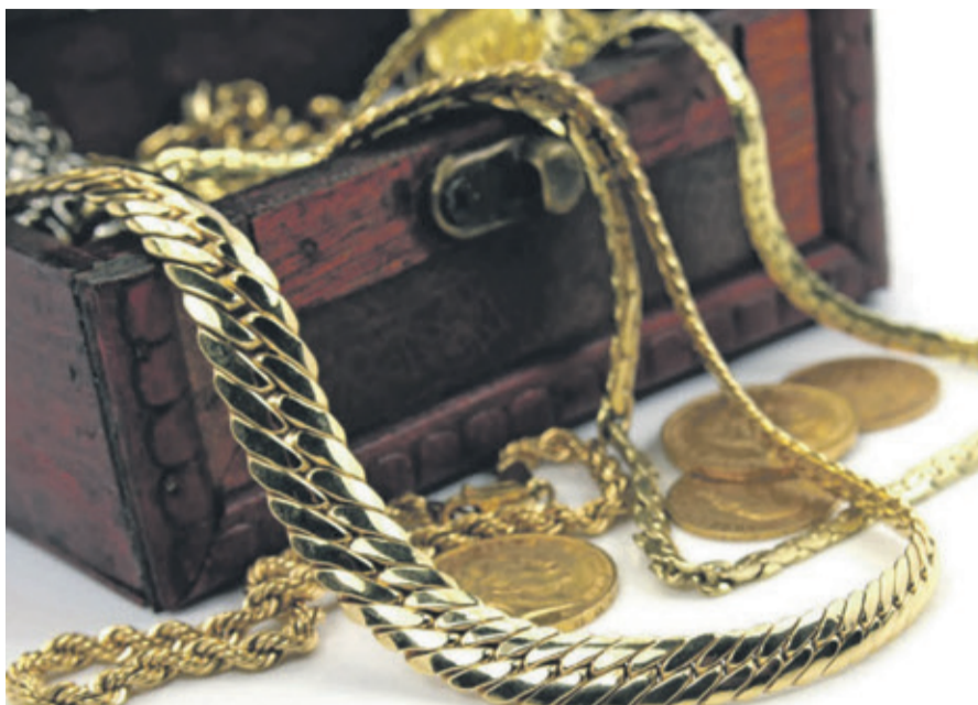
Goldschmuck und Goldmünzen

Experten für Schmuck, Diamanten, Luxusuhren und Bernstein vom 13.04. – 18.04.2026 zu Gast bei Juwelier Fehn in Kronberg