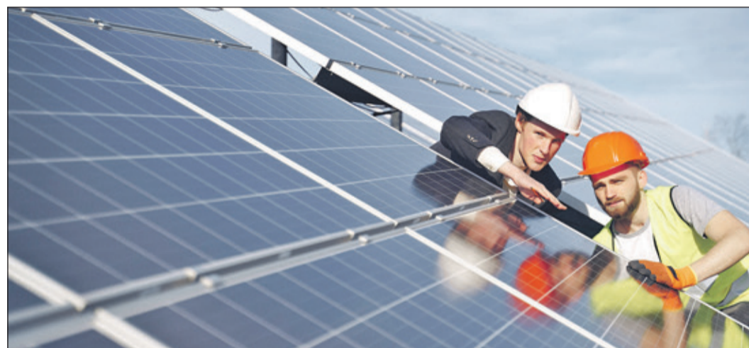
Solaranlagen für saubere Energie.

Doch die Vorteile von Erneuerbaren gehen weit über die Wirtschaftlichkeit hinaus. Sie schaffen lokale Arbeitsplätze, stärken die