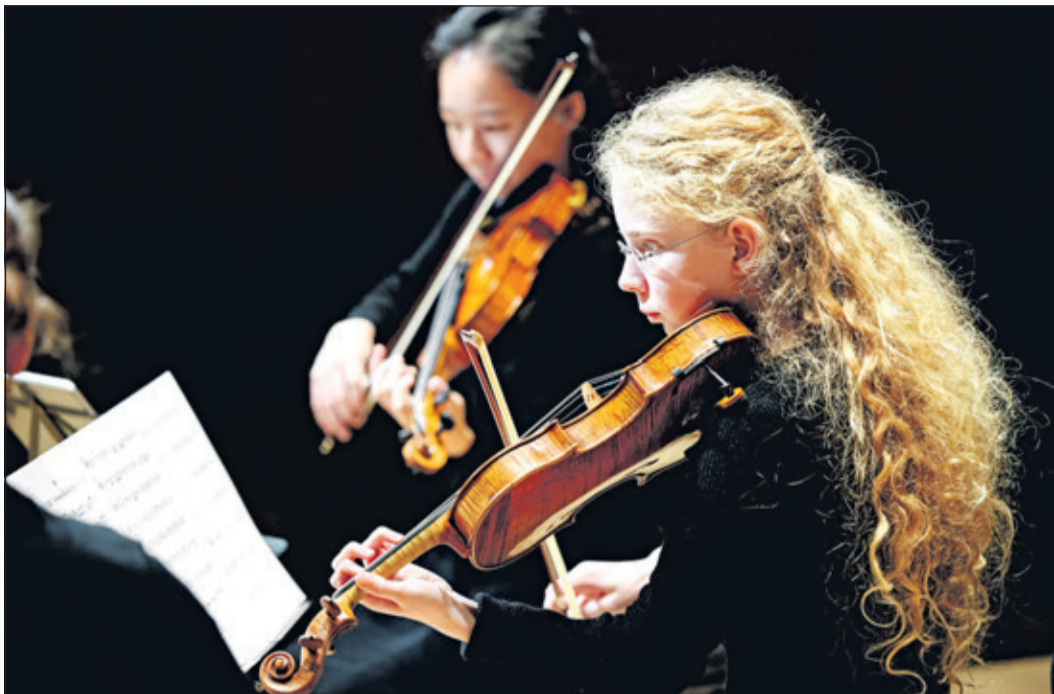
Wie spannend es ist, wenn junge Musiktalente hochkonzentriert mit international anerkannten Nachwuchskünstlern Kammermusikwerke einstudieren, ist am kommenden Wochenende wieder bei „Mit Musik – Miteinander“ im Casals Forum zu erleben.