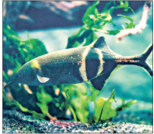
Der Elefantenrüsselfisch im Opel-Zoo.