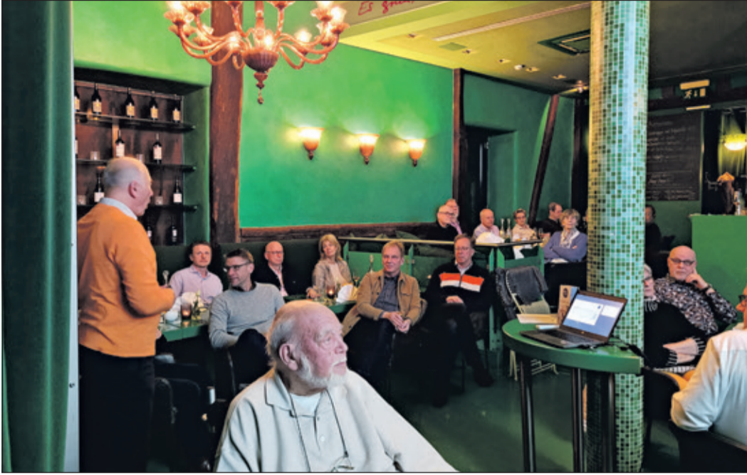
Die Mitgliederversammlung des Vereins Aktives Kronberg fand in der Zehntscheune statt, um im Anschluss noch mit einem gemeinsamen Essen feiern zu können.

Kronberg (kb) – Der Wissenschaftliche Dienst des Deutschen Bundestags hebt im Überblick zur Bedeutung der Vereine für die freiheitliche demokratische Grundordnung auf Seite 11 hervor, „Vereine wirken an der politischen Willensbildung mit und wecken das Bewusstsein für eine breite Palette relevanter sozialer Themen. Da sie vielfach frei von politischen, sozialen und wirtschaftlichen Rücksichtnahmen agieren können und auch vor der Befassung mit unpopulären Themen nicht zurückschrecken, wirken sie in der Gesellschaft als innovative und belebende Faktoren, die nicht selten dazu beitragen, Fehlentwicklungen zu korrigieren“.