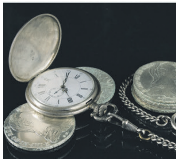
Taschenuhr und Silbermünzen

Bares für Wa(h)res bei Juwelier Fehn Friedrich-Ebert-Straße 14 61476 Kronberg Tel. 06173 1022