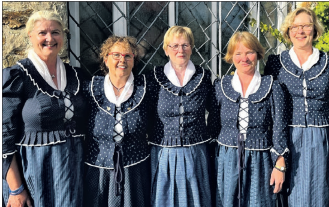
Die fünf Damen der Laienspielschar zeigen sich sehr zufrieden mit ihren neuen Trachtenoberteilen.

Kronberg (kb) – Wer kennt sie nicht, die Kronberger Damentracht, mit der die 1. Kronberger Laienspielschar als Chor und Mundartgruppe auftritt oder die bei den Führungen auf den Laternenwegen als Marktfrau bei den Szenen auf der Schirn getragen werden.