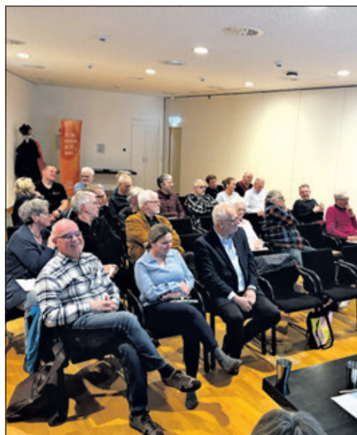
Mehrere Interessierte hatten sich zur Versammlung in der Stadthalle eingefunden.

Der Vorstand des Vereinsrings Kronberg bittet alle Mitgliedsvereine um Anregungen und Hinweise, um die Arbeit und den Austausch weiter zu verbessern.