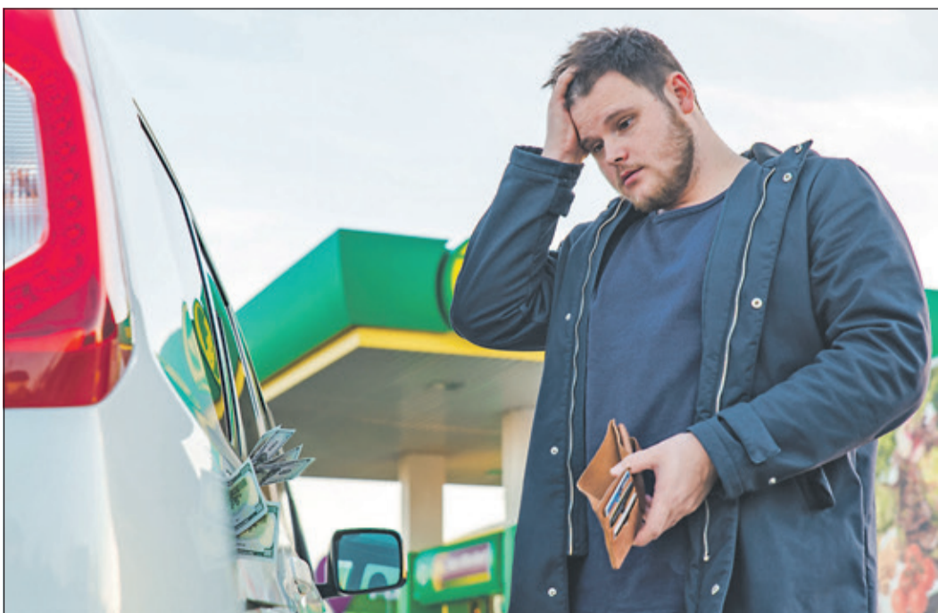
Viele verzweifeln an den hohen Tankkosten.

Die derzeitige Energiekrise ist kein vorübergehendes Phänomen, sondern wird unsere Welt noch auf Monate und Jahre prägen. Und sie ist ein Weckruf an alle: Wer auf fossile Brennstoffe setzt, bleibt abhängig von Krisen, Preisschwankungen und geopolitischen Machtkämpfen. Wer hingegen auf Erneuerbare Energien setzt und in diese investiert, trifft eine Entscheidung für Stabilität, Nachhaltigkeit und wirtschaftliche Sicherheit (Alexander Ullrich)