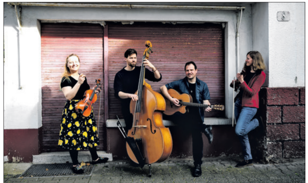
Die Band „Feinschmeckerfolk“ bereitet dem Publikum einen feierlichen Abend.

Schönberg (kb) – Zum vorerst letzten Konzert im „Die Freizeit“ lädt die 142. JamSesh seine Fans und Gönner zum Dinner mit dem „Feinschmeckerfolk“ ein. Wenn sich die Band zum Konzert einfindet, ist das wie bei einem guten Eintopf mit besten Zutaten zu einem