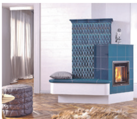
Wer sich frühzeitig über alternative Heizsysteme informiert, ist im Winter unabhängiger von externen Entwicklungen.

(DJD). Die Wärmewende wird meist unter Klimaschutzaspekten diskutiert. Doch angesichts steigender Energiepreise, wachsender Stromabhängigkeit und geopolitischer Risiken rückt eine andere Frage stärker in den Mittelpunkt: Wie krisensicher ist unsere Wärmeversorgung?