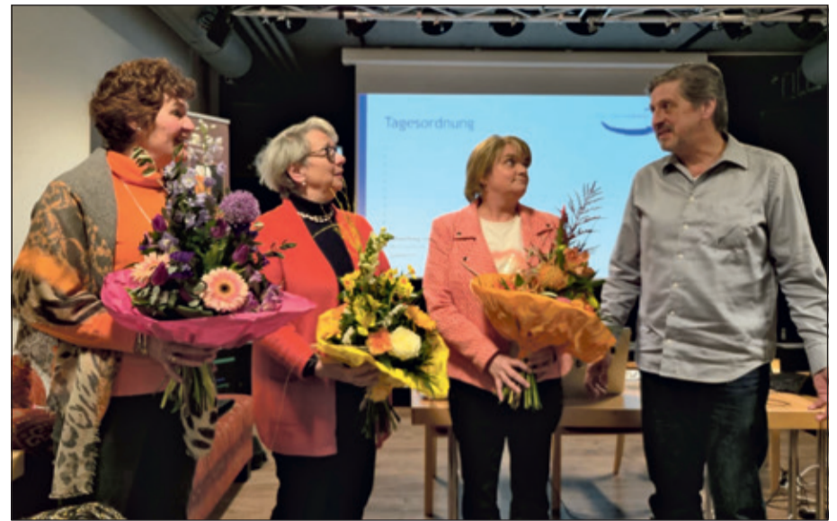
Die Jahreshauptversammlung des Vereins zeigte den guten Zusammenhalt und die engagierte Mitarbeit der Mitglieder.

Die Versammlung war geprägt von einer lebendigen und konstruktiven Diskussion. Zahlreiche Mitglieder brachten ihre Gedanken und Anregungen ein, sodass ein reger Austausch entstand und viele gute Ideen gesammelt werden konnten. Im Anschluss fanden die turnusmäßigen Neuwahlen des Vorstands statt. Dabei wurde der bisherige