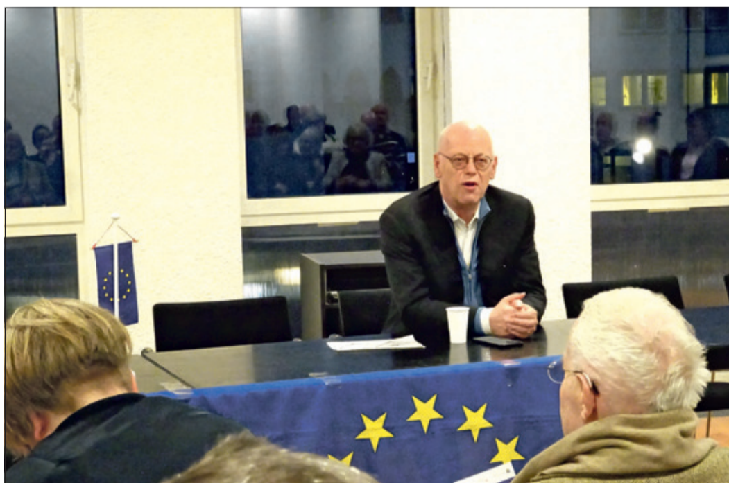
Rudolf Scharping, früherer Ministerpräsident von Rheinland-Pfalz, äußerte sich zur schwierigen Lage Europas.

trügen bei den Amerikanern zu Entwicklungen bei, die in Europa fehlten. Der Einfluss der amerikanischen Stärken auf dem Digitalmarkt seien für Europa nicht sonderlich hilfreich. Es sei daher von großer Bedeutung, dass auf dem europäischen Kontinent sehr schnell eine europäische digitale Souveränität entwickelt würde. Mit einer drastischen Bemerkung machte Scharping klar, was er meinte: „Bots sind manchmal wirkungsvoller als Soldaten“. In Sachen Aufrüstung hatte er einen weiteren Punkt, an dem schnell gearbeitet werden müsse. Europa verfüge über keine eigenen Satelliten, die notwendig wären für die Lenkung der Streitkräfte. Sicherheit und Wirtschaft in Europa könnten nur gemeinsam erfolgreich sein. Nach Abschluss seiner Rede gab es interessante Fragen – auch über das Thema hinaus. Scharping erwähnte unter anderem die „gefährliche Vernachlässigung Afrikas“. Deutschland brauche wegen seiner geringeren wachsenden Einwohnerschaft jüngere Menschen von dort, wo die Bevölkerung schneller wachse. Eine weitere Mahnung gab es am Schluss. Man solle sich nicht auf die Risiken fokussieren, sondern auf die Chancen.