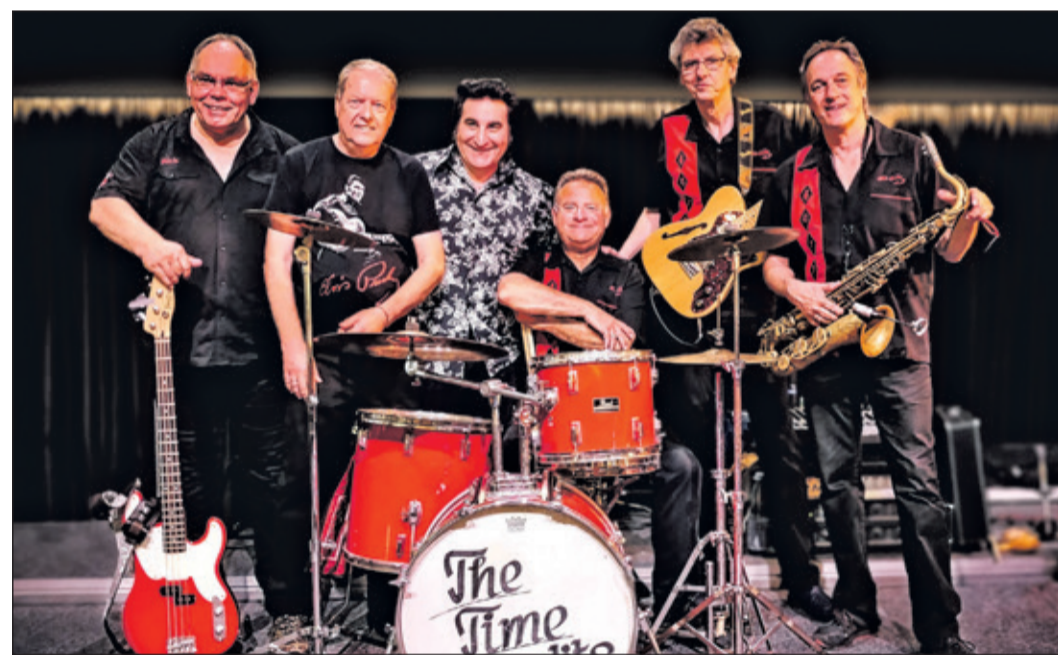
„The Time Bandits“ bringen mit ihrer Rock 'n' Roll Musik ordentlich Stimmung in den Recepturkeller.

Besucherinnen und Besucher können sich auf einen abwechslungsreichen Rock'n'Roll Abend mit den Time Bandits freuen.