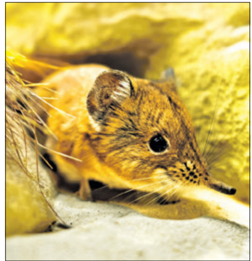
Den Kurzohrrüsselspringer gibt es im Opel-Zoo zu entdecken.

Beide Tierarten ziehen sich gern in geschützte Bereiche zurück und noch sind die Tiere dabei, sich in ihren neuen Umgebungen einzugewöhnen. So können vorerst noch etwas Geduld und ein gutes Auge gefragt sein, um die sympathischen Neulinge mit den ‚Rüsseln‘ im Opel-Zoo zu entdecken.