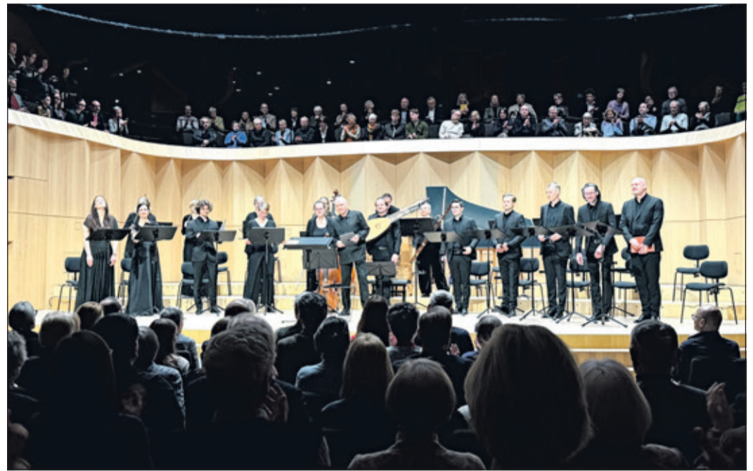
Vor dem ersten Ton liegt eine eigentümliche Spannung über dem Casals Forum: unten die Bühne im Licht, darüber der erste Rang schon besetzt, als würde das Publikum die Bachkantaten innerlich längst fortspinnen, noch bevor sie beginnen.

Kronberg (nl) – Es ist ein Programm wie ein Weg. Einer, der im Halbdunkel beginnt, tastend, beinahe zögerlich und der sich, Schritt für Schritt, ins Licht vorarbeitet. Am Ende steht Jubel, aber keiner, der naiv wäre. Sondern einer, der weiß, woher er kommt.