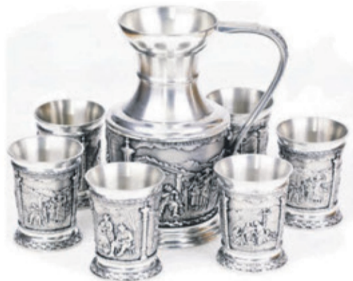
Zinnkrug und Zinnbecher