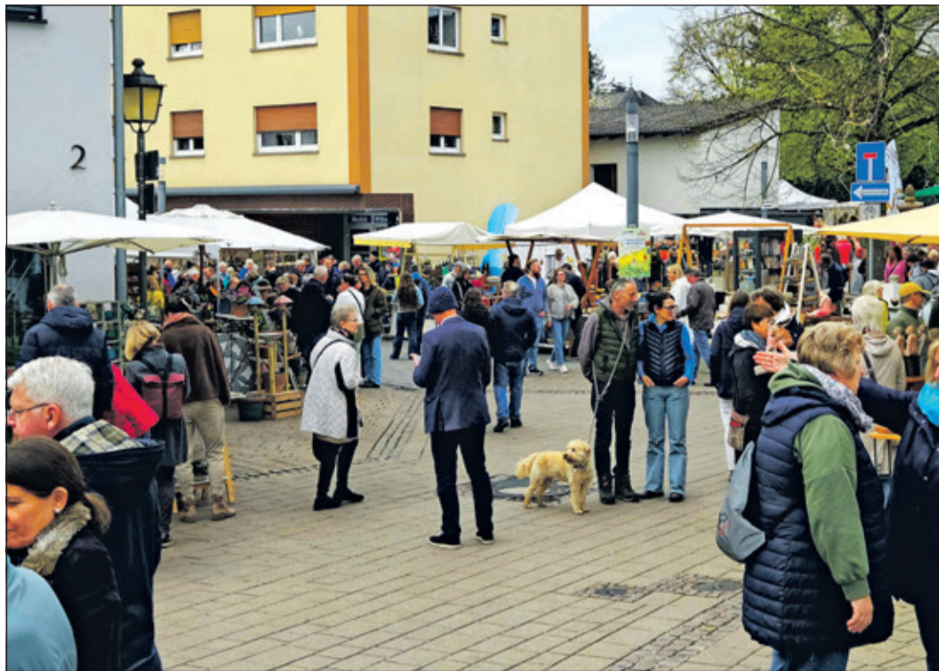
Das bunte Treiben zwischen den vielen Ständen auf dem Keramikmarkt sorgte für beste Stimmung bei Klein und Groß.

Oberhöchststadt (nel) – Zum elften Mal hat der Keramikmarkt in Oberhöchststadt den Ortskern rund um den Dalles in einen lebendigen Treffpunkt für Kunsthandwerk, Begegnung und Austausch verwandelt. Der traditionsreiche Markt, den keramik-hessen gemeinsam mit der Stadt Kronberg organisiert, gilt seit Jahren als feste Größe in der Region. Rund 40 professionelle Werkstätten aus ganz Deutschland präsentierten hier ihre Arbeiten und zeigten, wie vielseitig Keramik heute ist – von Gebrauchsgeschirr über dekorative Stücke bis hin zu kunstvollen Einzelobjekten.