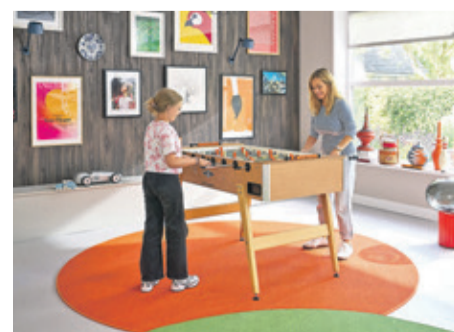
Kräftige Teppichfarben setzen lebendige Akzente und strukturieren den Raum.

oder Ziegenhaar kann die Luftfeuchtigkeit regulieren und Staub binden, was das Raumklima positiv beeinflusst.