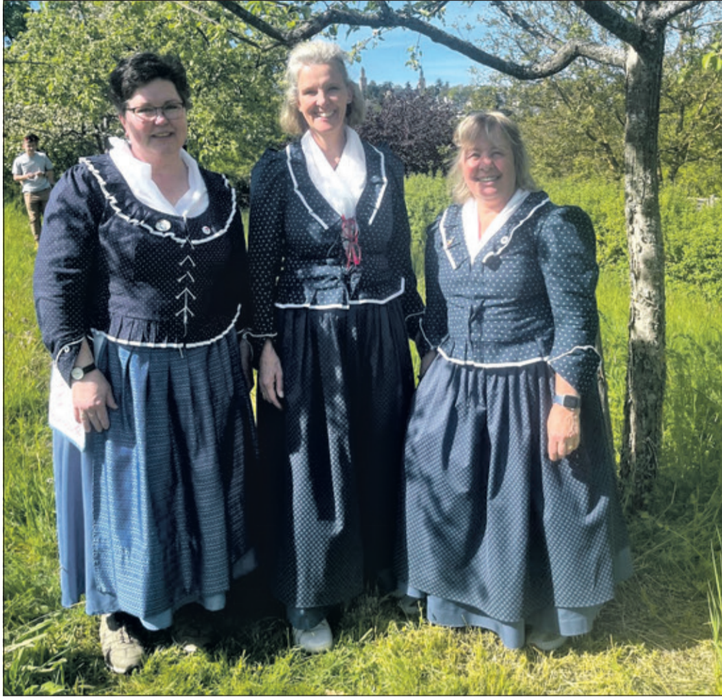
Einige Damen der 1. Kronberger Laienspielschar werden Mundart-Gedichte zum Frühling, zu Obst und zu Apfelwein zum Besten geben.

Kronberg (kb) – Anlässlich des „Tags der Streuobstwiese“ am Freitag, 24. April, finden europaweit sowie auch am darauffolgenden Wochenende zahlreiche Veranstaltungen statt. Unter dem Motto „Gutes aus Streuobst“ machen viele Initiativen ihre Arbeit sichtbar, etwa durch Führungen über die Wiesen, Verkostungen, Feste, Informationsangebote oder kreative Aktionen. Damit wollen sie auf den Wert der Streuobstwiesen aufmerksam machen und die besondere Verbindung von Natur, Kultur und Genuss in den Blickpunkt stellen.