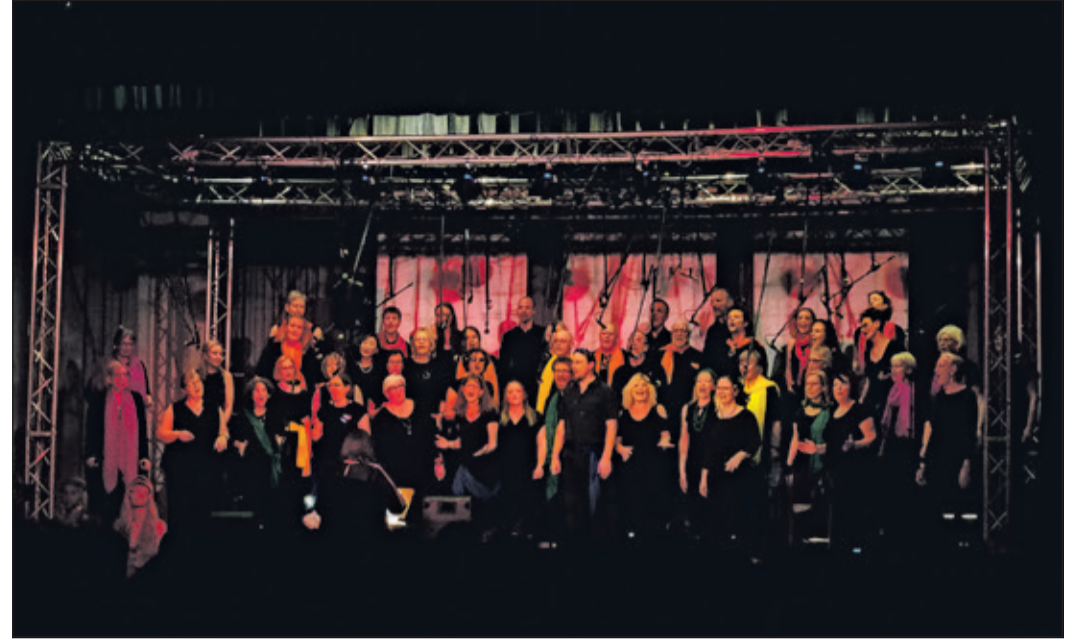
In bunten Lichtern und guter Stimmung präsentierte der Chor ein breites Programm an deutsch- und englischsprachigen Liedern.

Oberhöchststadt (nel) – Mit ihrem neuen Programm „Vox auf Rezept“ hat der Pop- und Rockchor Vox Musicae der Sängervereinigung 1861 Oberhöchststadt nach zwei Jahren am vergangenen Wochenende zahlreiche Besucherinnen und Besucher ins Haus Altkönig gelockt.