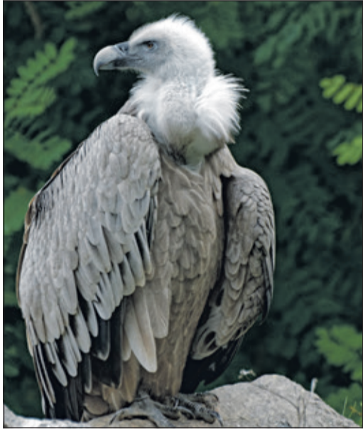
Ein Gänsegeier im Opel-Zoo