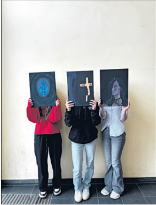
Schülerinnen der Humboldtschule mit ihren Selbstporträts

Kronberg (kb) – Im Herbst letzten Jahres besuchte der Kunst-Leistungskurs der Hum-