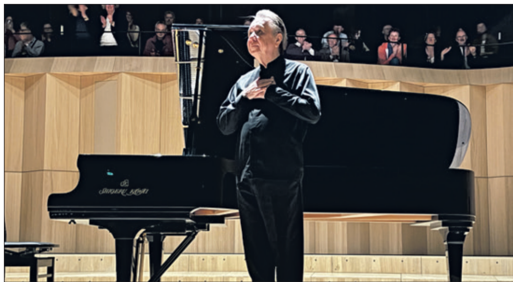
Die Hände auf der Brust, der Blick nach oben: Dankbarkeit, ja, aber eine stille, nach innen gerichtete. Das Publikum applaudiert, Pletnev ist schon woanders.

Liszt fand das Werk „zu schwer verdaulich für das Publikum”. Schumann selbst zweifelte an der Eignung des Stücks für öffentliche Aufführungen. Er befürchtete zu Recht, das Publikum könne es nicht verstehen. Clara Wieck, die die Bedeutung des Werks sofort erkannte, spielte es trotzdem öffentlich. Plet-