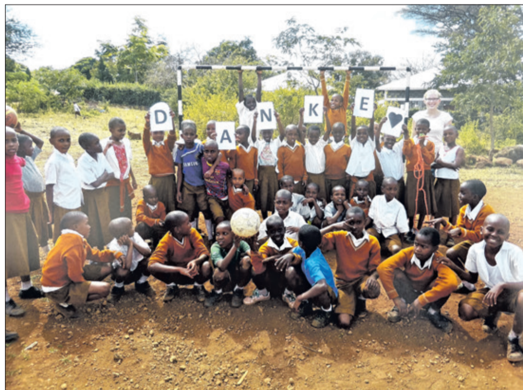
Die Kinder aus Tansania bedanken sich bei allen Teilnehmern der Aktion.