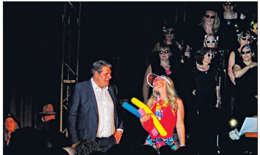
Der Lebenscoach erörterte gemeinsam mit der Teilnehmerin des Workshops, wo das Problem ihrer Unzufriedenheit liegt.

Das Publikum reagierte durchweg positiv und ließ sich von der Mischung aus Theater und Musik unterhalten. „Vox auf Rezept“ zeigte eindrücklich, wie sich musikalische Darbietung und szenisches Spiel zu einem stimmigen Gesamtkonzept verbinden lassen. „Nach so einer Vorstellung geht man einfach gut gelaunt nach Hause“, sagte eine Besucherin, die summend den Saal verließ.