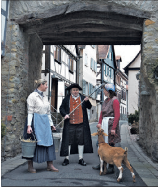
Auf dem Laternenweg gibt es unterhaltsame neue Dinge zu lernen.

Kronberg (kb) – Kronberger Geschichte steckt seit hunderten von Jahren voller Leben. Diese übertragenen, teils wahren Geschichten, teils überlieferte Anekdoten finden sich in den Scherenschnitten der Kronberger Alt-