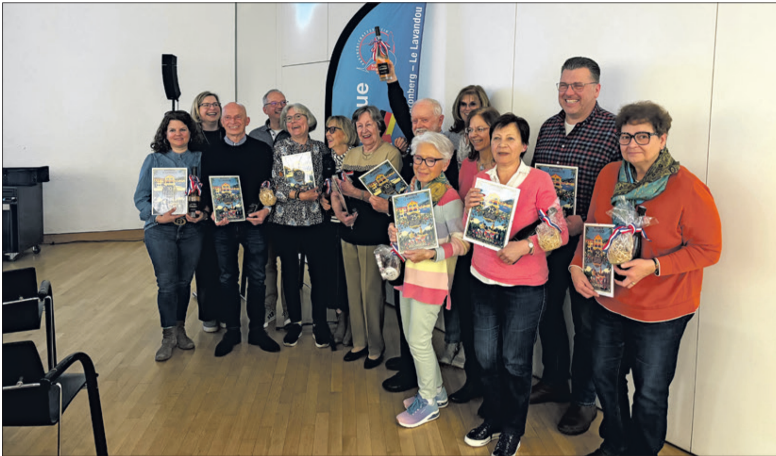
Mehrere Mitglieder wurden im Rahmen ihres 10-jährigen und 25-jährigen Jubiläums geehrt und freuten sich über kleine Präsente.