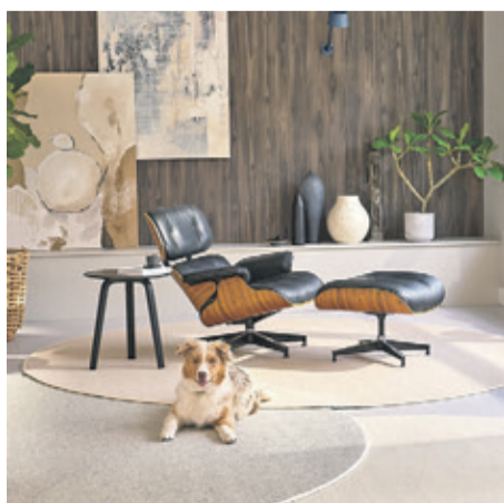
Schön gemächlich wird es in diesem Raum dank Teppich-Layering mit Naturhaar.

(DJD). Teppiche beeinflussen die Wirkung von Wohnräumen stärker als oft angenommen. Sie sorgen für Wärme, reduzieren Trittschall und helfen, offene Grundrisse optisch zu strukturieren. Mit verschiedenen Teppichfarben lassen sich unterschiedliche Zonen innerhalb einer Wohnung gestalten, ohne bauliche Veränderungen vorzunehmen. Neben klassischen Bahnen bieten modulare Teppichfliesen, etwa von Tretford, flexible Gestaltungsmöglichkeiten. Ein aktueller Trend ist auch das Teppich-Layering, bei dem mehrere Teppiche überlappend kombiniert werden. Unter dem Link designer.tretford.eu gibt es einen kostenlosen virtuellen Raumplaner. Teppich mit Naturfasern wie Schurwolle