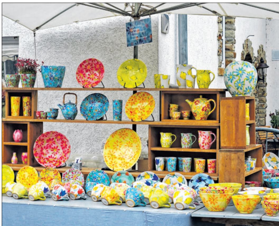
Die bunten Keramiken zauberten den Besuchern ein Lächeln ins Gesicht und brachten gute Laune in den grauen Sonntag.

Ergänzt wurde das Angebot durch historische Ausstellungsstücke, die bekannte Orte und Gesichter aus vergangenen Jahrzehnten wieder lebendig werden ließen. Der elfte Oberhöchststädter Keramikmarkt verband damit einmal mehr hochwertige Handwerkskunst, gelebte Ortsgeschichte und ein offenes, einladendes Miteinander.