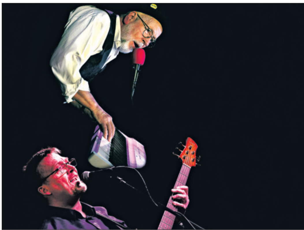
Die Bühne öffnet sich nach der Eröffnung durch die C-Lounge House Band für allerlei Musiker.

Schönberg (kb) – Die Friday Jam Sessions gehen in die nächste Runde. Die C-Lounge House Band ist am Freitag, 24. April, um 20 Uhr zu hören. Der letzte Freitag im Monat ist neben allen anderen Friday-Specials der Jam-Session-Tag und findet in der Kellerbar in der Taunushalle, Friedrichstraße 57, Schönberg statt. Der Eintritt beträgt 10 Euro. Für Jam-Musicians, die beabsichtigen, sich aktiv an der Session zu beteiligen, ist der Eintritt frei, sie melden sich an der Eintrittskasse. Fragen und Wünsche der Musiker, die beabsichtigen, teilzunehmen, können im Vorfeld per E-Mail an session@creative-sounds-