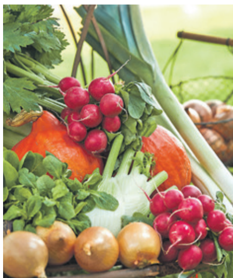
Gesunde Abwechslung auf dem Speiseplan: Traditionelle Gemüsesorten erleben ihre Renaissance.

(DJD). Zurück zu den Wurzeln: Immer mehr Hobbygärtner entdecken die Vorzüge traditioneller Gemüsesorten neu. Fernab makelloser Industrieware stehen hier Geschmack, Charakter und Geschichte im Vordergrund. Klassiker wie die unkomplizierte Buschbohne Saxa oder die goldgelbe Wachsbohne Beste von Allen bringen nicht nur besonders viel Aroma, sondern auch optische Vielfalt zurück in die Beete. Unter dem Motto „Tradition trifft Geschmack“ hat der Saatgutpezialist Sperli 44 authentische Gemüsesorten ausgewählt, die als lebendige Kulturgüter neu entdeckt werden wollen. Ob die vitaminreiche, tiefviolette Möhre Purple Sun oder das würzig schmeckende, pflegeleichte