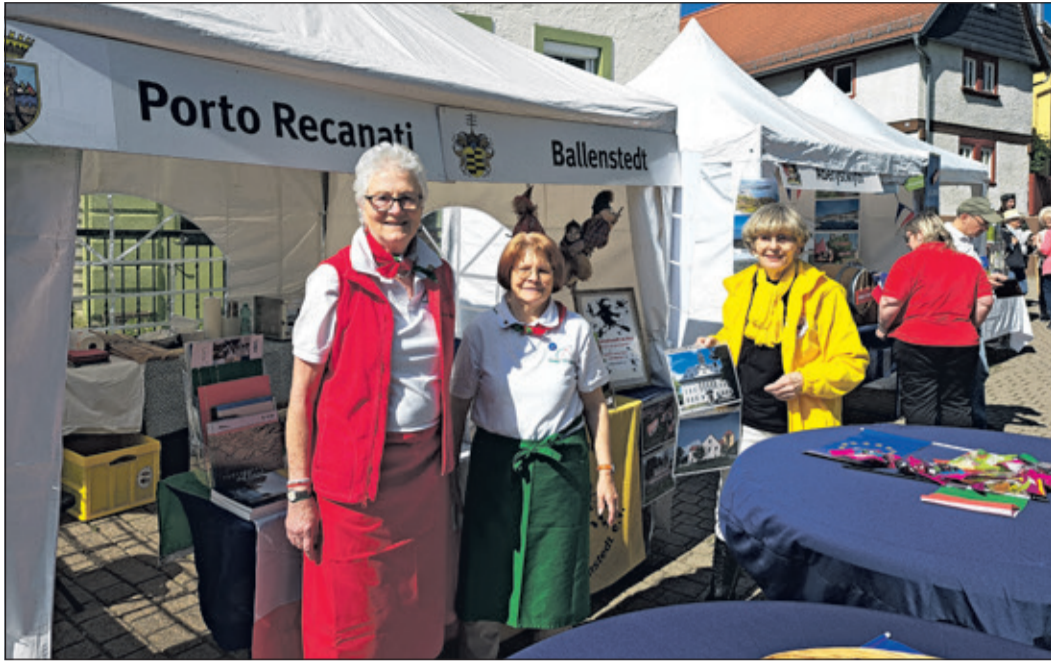
Kronbergers Partnerstädte Porto Recanati und Ballenstedt teilten sich einen Pavillon. Le Lavandou und Aberystwyth bezogen gleich nebenan ihren Stand.

Hochtaunus (kb) – Die Stimmung beim diesjährigen Europatag in Steinbach hätte nicht besser sein können. Zum zweiten Mal nach 2015 richtete die Stadt dieses Traditionsfest im Hochtaunuskreis, mit dem Frieden, Einheit und Zusammenarbeit in Europa gefeiert wird, aus. Der Europatag ist auch eine Gelegenheit, die Vielfalt der europäischen Kulturen zu würdigen und das Gefühl