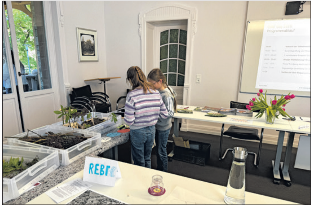
Wie die Profis konnten die Teilnehmerinnen im Fachreferat Stadtentwicklung und Umwelt Modelle für moderne Wohnquartiere und naturnahe Kinderspielplätze entwerfen.

Kronberg (kb) – Früh übt sich, wer später einmal Stadtplanerin, Erzieher oder auch Gärtnerin werden will. Diesem sinnvollen Gedanken ließen dieser Tage 25 Mädchen und Jungen im Alter zwischen zehn und 16 Jahren Taten folgen.