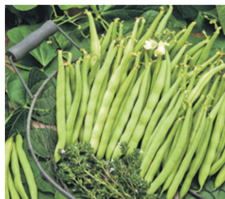
Früher schon beliebt und heute immer noch lecker: Die Buschbohne Saxa zählt zu den traditionellen Gemüsesorten, die wieder neu entdeckt werden.

Frühlingsgemüse Stielmus: Die Sorten beweisen, dass Genuss oft viel mit Tradition zu tun hat.