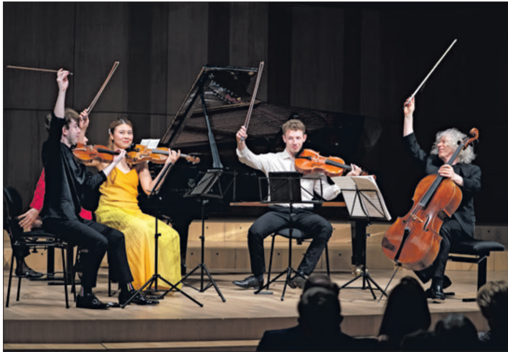
Die glücklichen Gesichter verraten es: Geschafft – und wir waren gut! Dieser Meinung war auch das Publikum nach der Präsentation des Klavierquintetts von Vítězslav Novák im Auftaktkonzert des Chamber Music Festivals Samstagabend im Casals Forum.