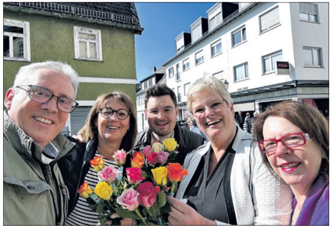
Viele Rosen fanden an diesem Vormittag ihren Weg zu den Kronbergerinnen.