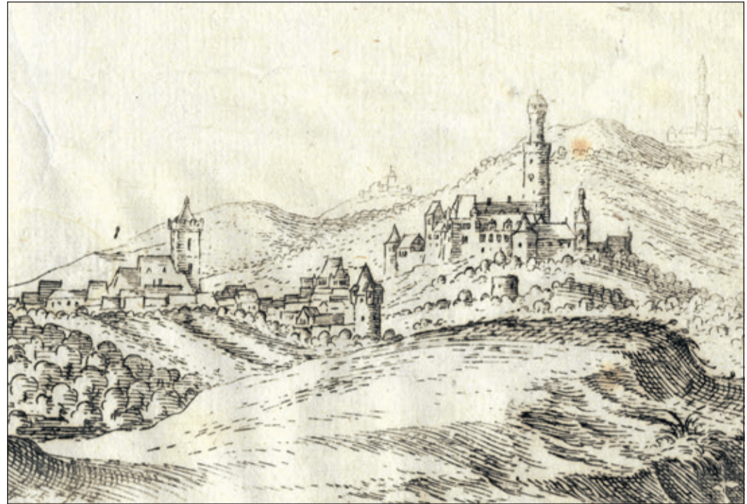
Der Vortrag soll die widersprüchlichen Entwicklungen dieser Periode im Vordertaunus thematisieren.