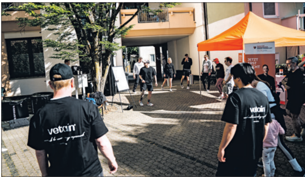
Bei dem Benefizevent sollte für mehr Bewusstsein hinsichtlich der erkrankten Kinder und der Arbeit der Stiftung gesorgt werden.