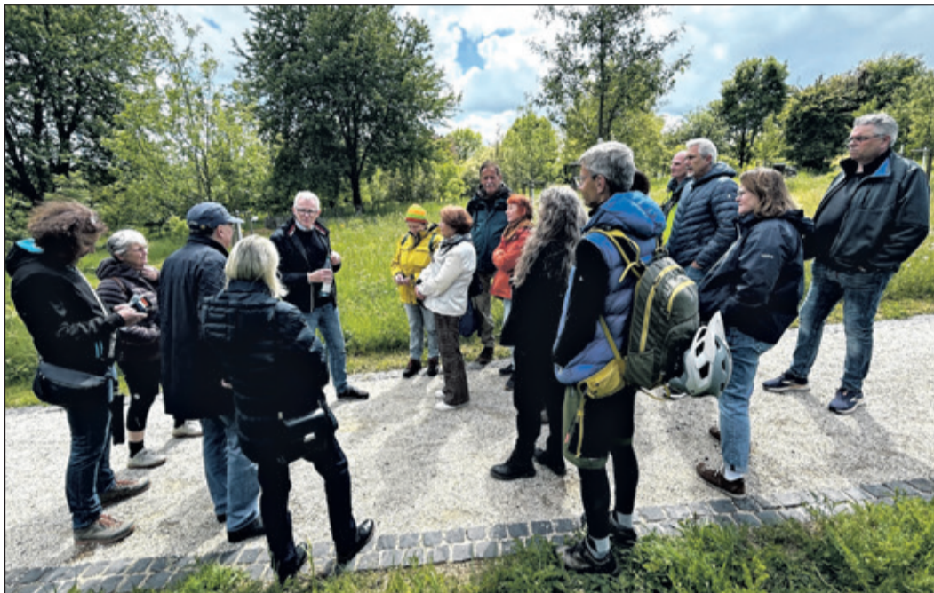
Die Mitglieder des OGV zu Besuch im Wissenschaftsgarten

Zum Ausklang kehrte die Gruppe anschließend noch gemütlich im Posthaus ein. Bei gutem Essen und angeregten Gesprächen wurden die zahlreichen Eindrücke des Tages noch einmal vertieft. Die Exkursion war für alle Beteiligten eine gelungene Mischung aus Naturerlebnis, wissenschaftlichem Einblick und geselligem Vereinsleben.