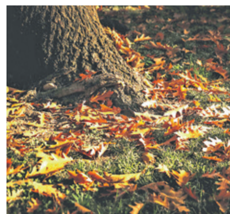
Für Schatten eignen sich spezielle Rasensaatsmischungen. Laub sollte zudem regelmäßig entfernt werden, um Fäulnis zu vermeiden.

rund 300 Experten bundesweit für eine individuelle Beratung vor Ort.