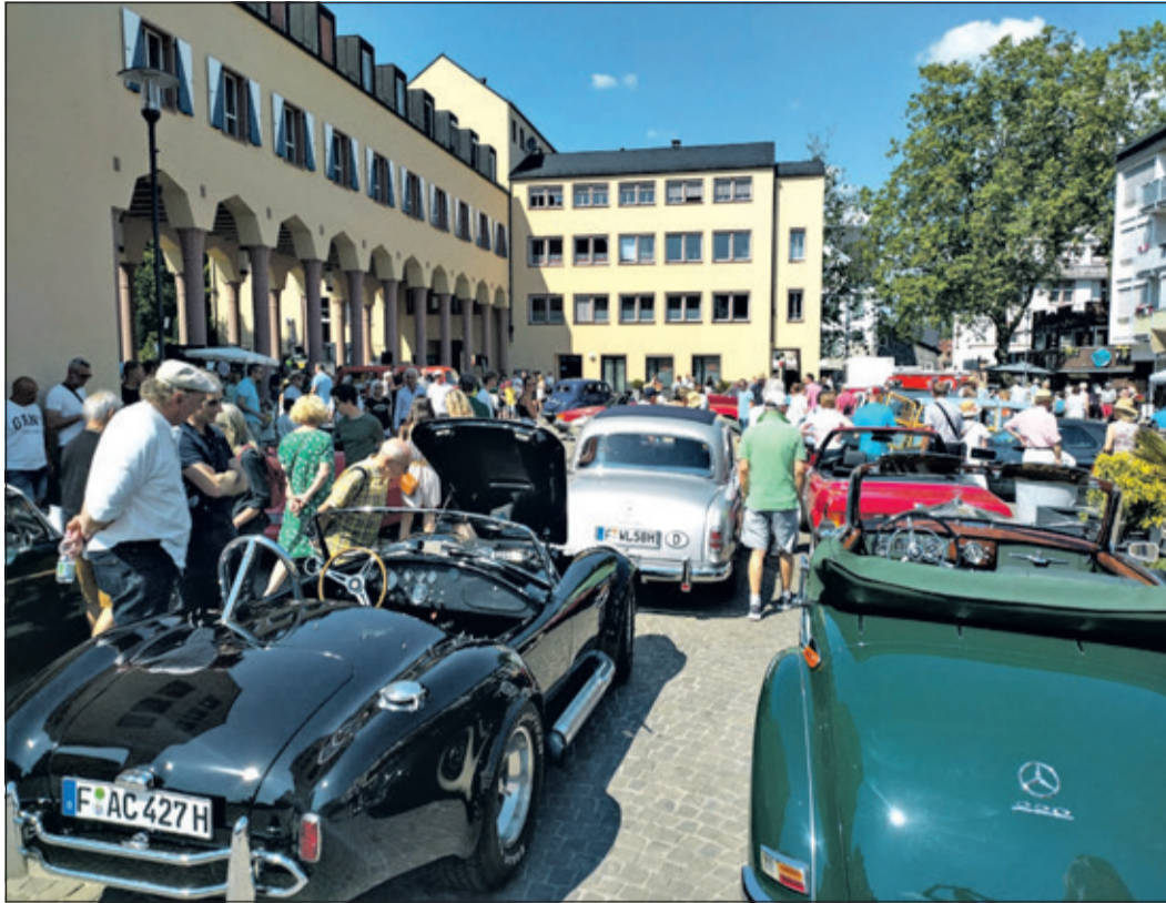
Einsteigen und Gutes tun heißt es wieder beim diesjährigen Rotary Oldtimer-Mitfahrttag.

Kronberg (kb) – Am Sonntag, 14. Juni, verwandelt sich der Berliner Platz in Kronberg zum bereits zehnten Mal in ein rollendes Freilichtmuseum der besonderen Art. Beim Jubiläums-Oldtimer-Mitfahrttag können Besucherinnen und Besucher von 11 bis 17 Uhr nicht nur automobile Schätze bestaunen, sondern auch selbst einsteigen und eine Rundfahrt durch Kronberg genießen – und das alles für den guten Zweck.