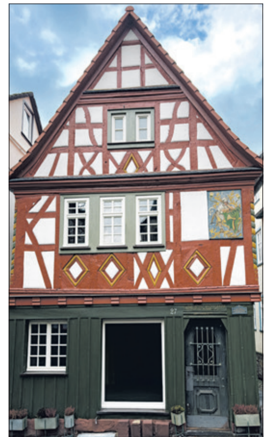
Das Haus Hembus in der Friedrich-Ebert-Straße ist ein aktuelles Beispiel dafür, mit viel Engagement und Liebe zum Detail die Kronberger das Herzstück der Altstadt erhalten.