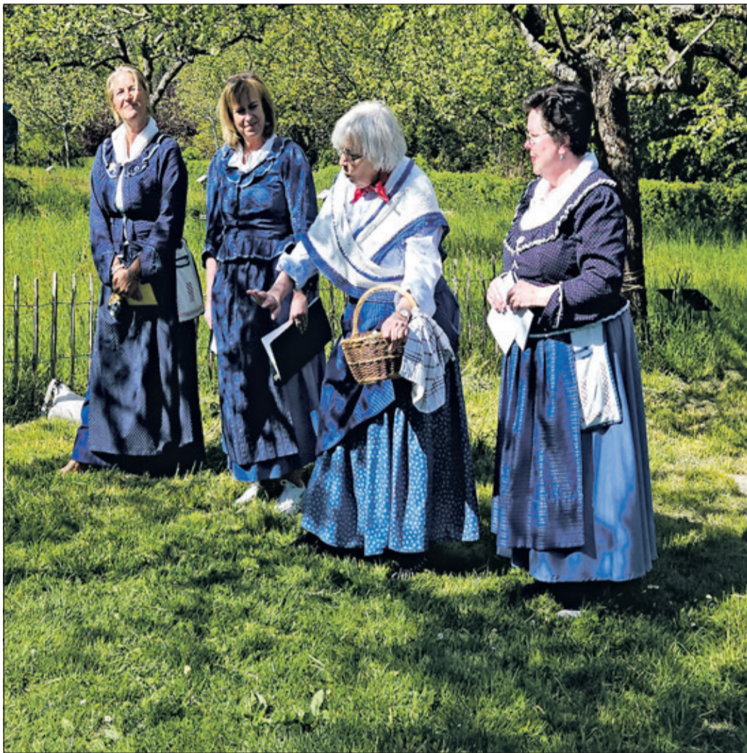
Auch Mundart darf nicht fehlen: Vortragende der Kronberger Laienspielschar präsentieren ein buntes Programm.

Kronberg (kb) – Erlebnisobstwiese, Pfarrer-Christ-Wiese und Jubiläumswiese: Diese drei Kronberger Streuobstwiesen pflegt und unterhält der Obst- und Gartenbauverein Kronberg, um die besondere und einmalige Kulturlandschaft des Vordertaunus mit seiner artenreichen Tier- und Pflanzenwelt zu bewahren. Anlässlich des internationalen Tags der Streuobstwiese lud der Verein auf die Erlebnisobstwiese, kurz EOW, ein, um den Besuchern und Besucherinnen deren Vielfalt und Bedeutung aufzuzeigen.