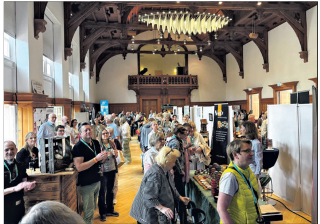
Rund 800 Besucher kamen über den Messetag verteilt, um das vielfältige Angebot an 35 Messeständen zu entdecken.

Ihren Ursprung hat die Kronberger Genuss-Messe im Jahr 2016, als „Taste-ination“ gemeinsam mit der Wirtschaftsförderung Kronberg die Idee einer hochwertigen Genussveranstaltung in der Stadthalle entwickelte. Das stilvolle Ambiente, die gelungene Mischung aus bekannten und neuen Ausstellern sowie die persönliche Atmosphäre machten auch die siebte Ausgabe erneut zu einem besonderen Erlebnis für Genießer. Nach coronabedingten Unterbrechungen in den Jahren 2020 und 2021 sowie einer Pause im vergangenen Jahr zeigte die starke Resonanz am 10. Mai: Das Konzept der Kronberger Genuss-Messe kommt weiterhin gut an.