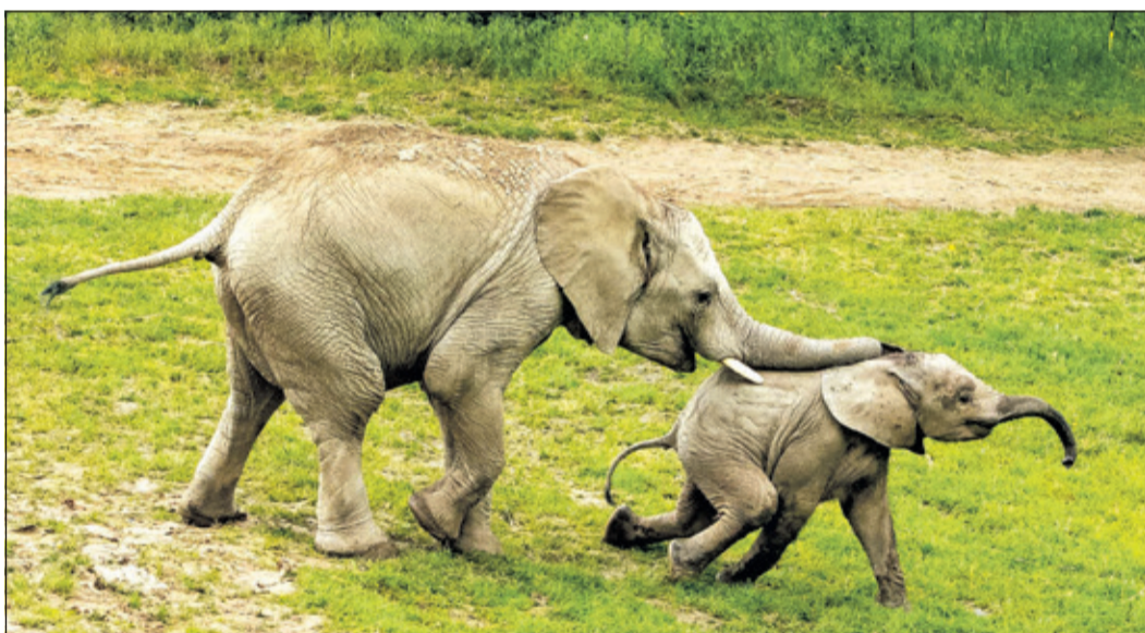
Neco and Kaja are having a lot of fun playing energetically in the outdoor area.

mother and calf, and so it wasn't long before Kaja nourished by plenty of mother's milk, quickly and robustly gained weight from her birth weight of 97 kg to 355 kg in May of this year. To this day, Lilak continues to care for the calf alongside Kariba. In the meantime, Kaja has grown strong; after the elephant house, she quickly explored the large outdoor enclosure with its mud and sand pits and, above all, befriended the five-year-old 'Neco'. The two are now romping around the enclosure with boundless energy, playfully chasing each other, snuffling at one another tirelessly, and – from the adult female elephants' perspective – no doubt getting into all sorts of mischief. But they are well watched over and protected by the other members of the herd. Happy 1st birthday, Kaja!