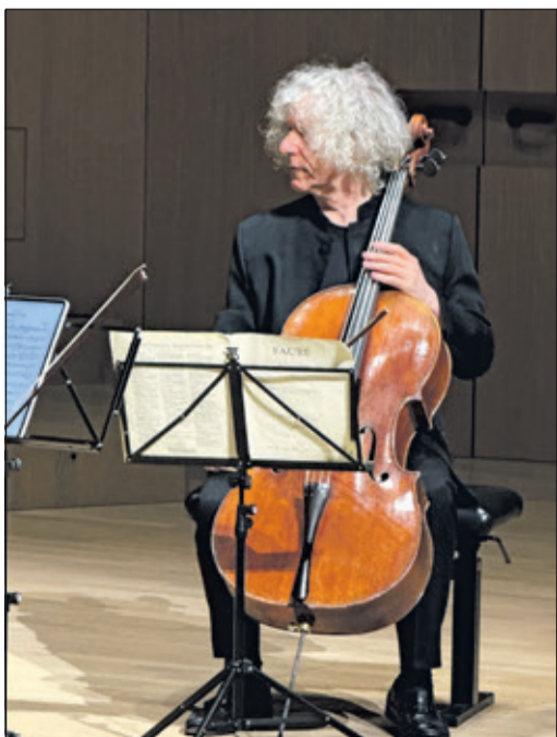
Steven Isserlis mit Fauré, ganz bei der Musik

Um 21.15 Uhr hört die Musik auf, im Saal zu sein. Sie fängt an, im Kopf weiterzugehen. Man verlässt das Casals Forum nicht mit dem Gefühl, etwas Erzählbares gehört zu haben. Eher mit dem Gegenteil: mit etwas, das man lieber für sich behält. Manche Musik ist kein Gegenstand. Sie ist ein Raum und der Zuhörer bleibt darin, auch wenn er schon längst draußen ist.