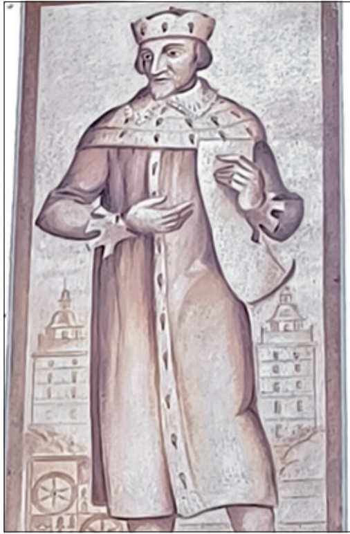
Schweikard als Kurfürst von Mainz an der Außenwand des Gasthofs „Zum Grünen Wald“ an der Schirm in Kronberg