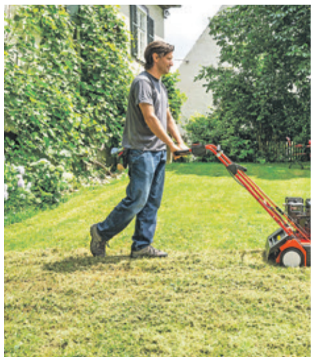
Ein Vertikutieren beseitigt Moos und lässt den Rasen wieder durchatmen.

Was bei Schatten, Trockenheit und verdichteten Böden helfen kann