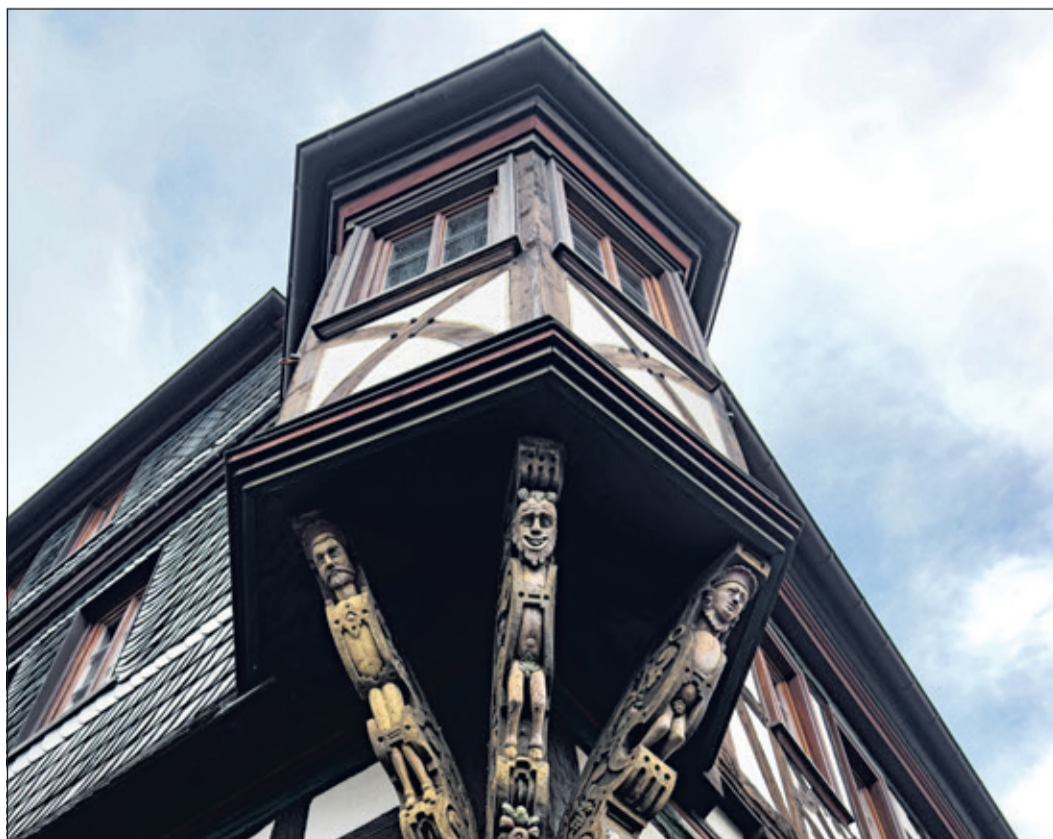
Der Erker am Haus „Drei Ritter“ ist ein besonderer Hingucker und bestärkt die Annahme, dass das Gebäude in früheren Jahrhunderten als Rathaus diente.