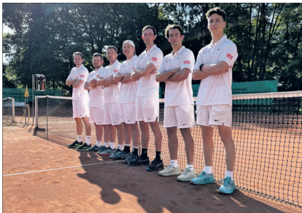
Mission Hessenliga erfolgreich gestartet – die erste Herrenmannschaft des TEVC Kronberg freut sich auf die Saison.

Darüber hinaus werden die ersten Damen in der Hessenliga erneut um die hessische Meisterschaft spielen (erstes Heimspiel am Samstag, 4. Juli um 10 Uhr) und freuen sich auf gewohnt spannende Spitzenspiele. Auch das Herrentennis in Kronberg ist wieder erstarkt: Die erste Herrenmannschaft hat dieses Jahr das klare Ziel des Aufstiegs in die Hessenliga. Den ersten Schritt sind sie bereits am 10. Mai mit einem überzeugenden 8:1 im Auftaktspiel gegangen.