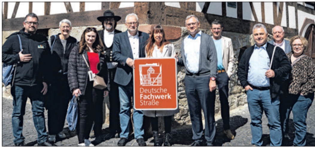
Im Anschluss an ihr Regionalstrecken-Treffen in Kronberg verschafften sich die Fachwerkstraßen-„Nachbarn“ einen Eindruck von der Altstadt.

oder Post: Frankfurter Str. 1-3; 65779 Kelkheim