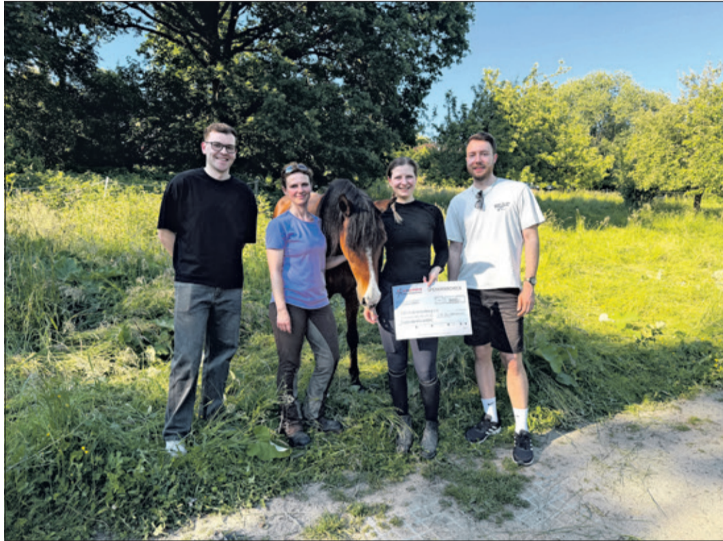
Der Verein freut sich über diese Anerkennung.