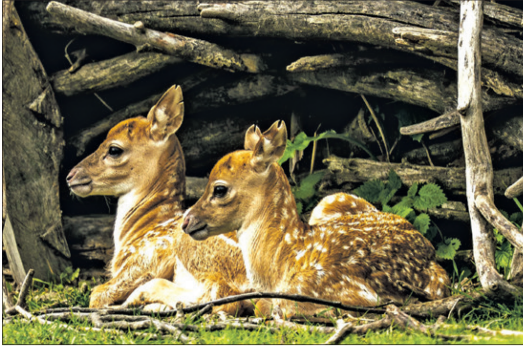
Auch in diesem Jahr gab es wieder Nachwuchs bei den in ihrem Bestand bedrohten Mesopotamischen Damhirschen.

Kronberg (kb) – BioFrankfurt ist ein Netzwerk im Rhein-Main-Gebiet, dessen Mitglieder – wie beispielsweise der Opel-Zoo – sich mit ihrer Erfahrung und ihrem Wissen für die Erhaltung der biologischen Vielfalt einsetzen und sich darum bemühen, das öffentliche Bewusstsein für die Bedeutung der Biodiversität zu stärken.