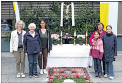
Mit viel Geduld und Hingabe richteten die Künstlerinnen den Altar her.

Kronberg (kb) – Der Aufbau eines Altars, ausgestattet mit einem Blumentepich, ohne Regenschutz, war in diesem Jahr kein leichtes Unterfangen.