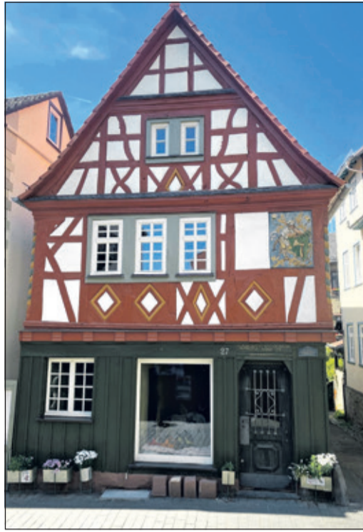
Das denkmalgeschützte Haus Hembus wurde etwa 1689 errichtet.