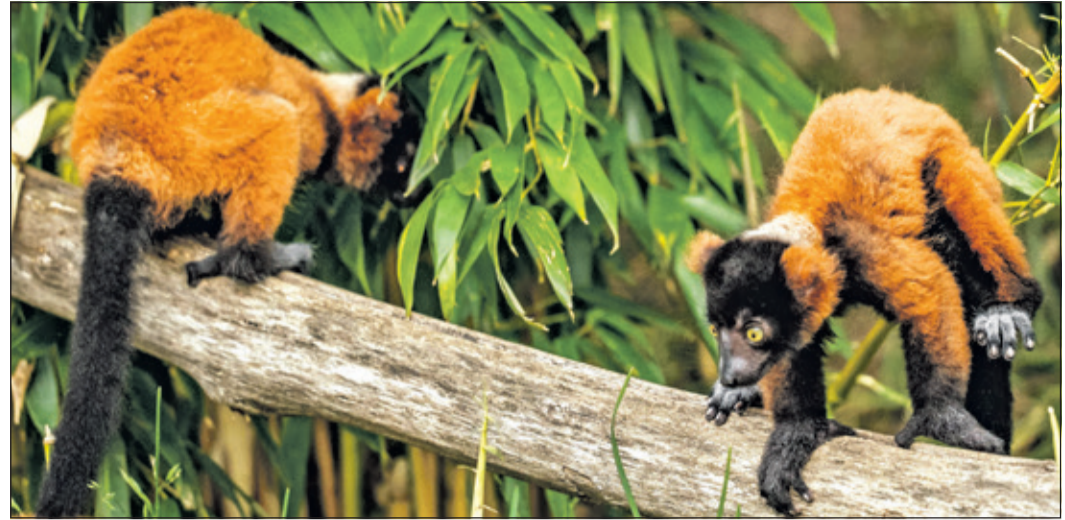
Diese zwei jungen Roten Varis wurden am 22. April geboren.