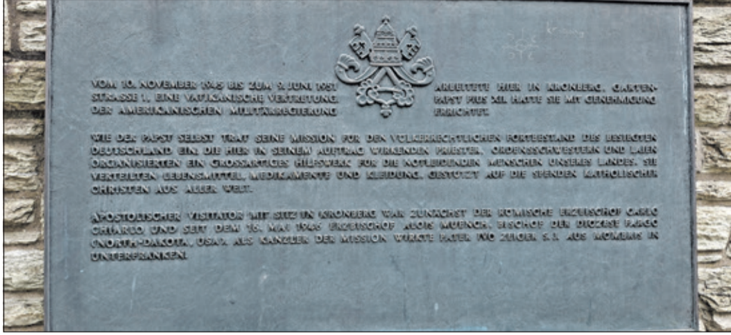
Heute erinnert nur noch eine Gedenkplatte an der Außenmauer vor dem Pfarrhaus neben der katholischen St. Peter und Paul Kirche an die einstige Apostolische Mission.