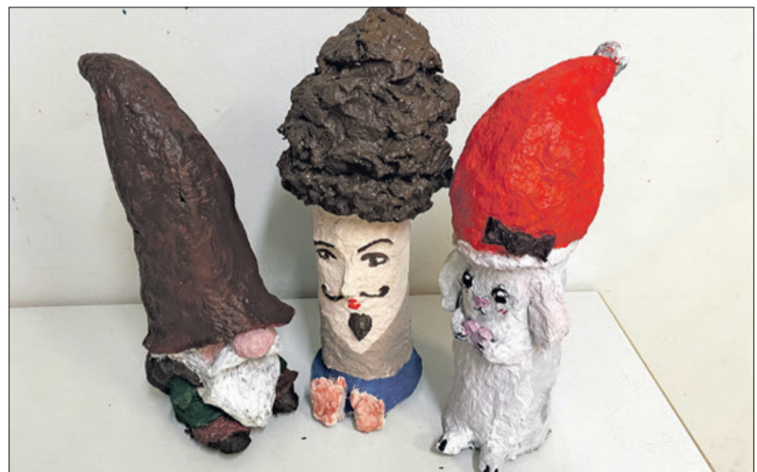
Farbenfrohe Tiere und Figuren aus Pappmaché zählen zu den Arbeiten, die in der Ausstellung zu sehen sind.

Kronberg (kb) – Endlich ist es wieder so weit. Die Kunstschule Kronberg lädt herzlich zur Vernissage ihrer Jahresausstellung am Freitag, 12. Juni, ab 19 Uhr ins Museum Kronberger Malerkolonie ein. Die Ausstellung umfasst eine Auswahl an Arbeiten, die im letzten Halbjahr in den Kinder- und Erwachsenenkursen entstanden sind. Farbenfrohe Tiere und Figuren aus Pappmaché und Stoff, fantasiereiche Gemälde, abstrakte Kompositionen und kleinformatige Figuren