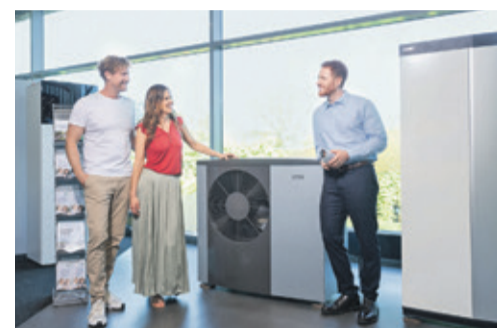
MVV lädt am 13.06. zum Tag der offenen Tür mit buntem Rahmenprogramm, geöffnetem Showroom und Beratungsmöglichkeit ein.

MVV bietet als Energieunternehmen mit über 150 Jahren Erfahrung nachhaltige Energielösungen aus einer Hand – von der Beratung über die Planung bis hin zur Installation durch eigene Fachhandwerker.