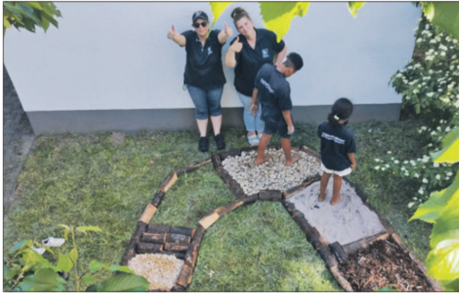
Die Jugendrotkreuz-Ortsgruppen (JRK) aus Oberursel und Kronberg haben einen Barfußpfad gebaut.