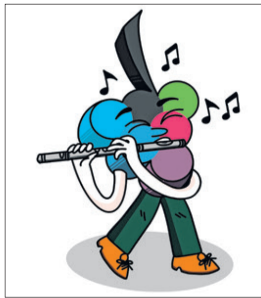
Im Haus der Begegnung erleben Kinder, wie Götter, Helden und Drachen durch Musik lebendig werden.

Weitere Informationen zum Konzert, zum Kinder- und Jugendprogramm sowie zum gesamten Festivalprogramm 2026 gibt es auf der Website des Rheingau Musik Festivals unter www.rmf.de . Karten sind ebenfalls online erhältlich sowie über die Karten- und Infofonie des Festivals unter 06723 / 602170.