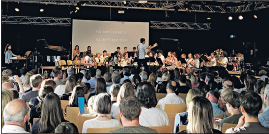
In der Aula der Altkönigschule herrschte feierliche Konzertstimmung – es wurde verschiedenste Filmmusik präsentiert.

Kronberg (nel) – Unter dem Motto „Film-musik“ hatte die Altkönigschule zu ihrem Sommerkonzert in die Aula eingeladen. Bei sommerlichen Temperaturen füllten zahlreiche Besucherinnen und Besucher den Saal, um ein vielseitiges Programm aus Filmmelodien und Pop-Hits zu erleben. Sechs Ensembles gestalteten den Abend und spannten dabei einen Bogen von jugendlicher Spielfreude bis zu orchestraler Wucht.