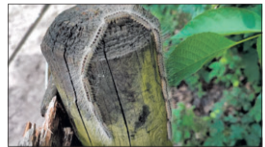
Der Eichenprozessionsspinner hat zahlreiche Eichen auf dem Gelände befallen.

Die Herausforderung: Viele Nester befinden sich in großer Höhe und sind nur mit spezieller Ausrüstung einer Fachfirma sicher zu entfernen. Die Entfernung eines Nestes kostet 143 Euro. Die Bäume sind mit mindestens