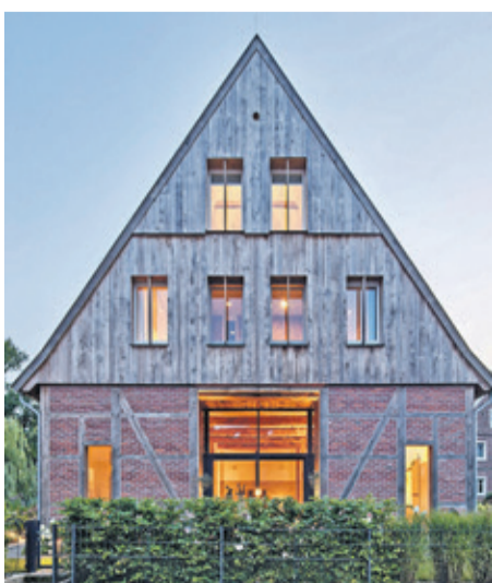
Bei der Sanierung historischer Fassaden, wie hier an einem Bauernhof in Münster, ist viel Fachwissen gefragt.

Viele Gründe sprechen für den Erhalt und die Pflege älterer Gebäude