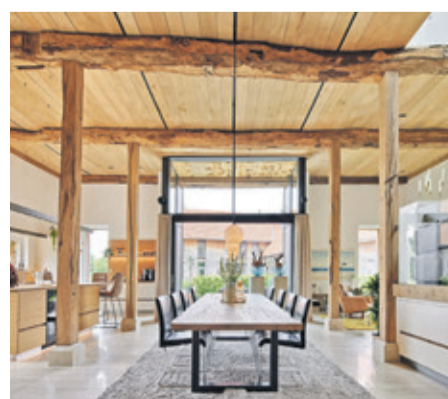
Der Umbau eines Pferdestalls in ein Wohngebäude zeigt, wie viel Charme in historischen Gebäuden stecken kann.

kompetente Betriebe für eine fachgerechte Umsetzung und Beratung vor Ort finden.