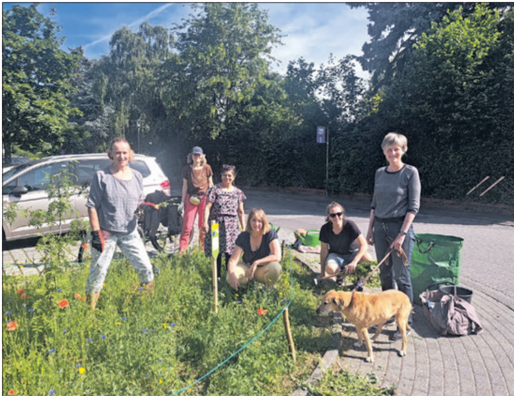
Eine Gruppe von Aktiven befreite das selbst angelegte Beet von unerwünschten Beikräutern.