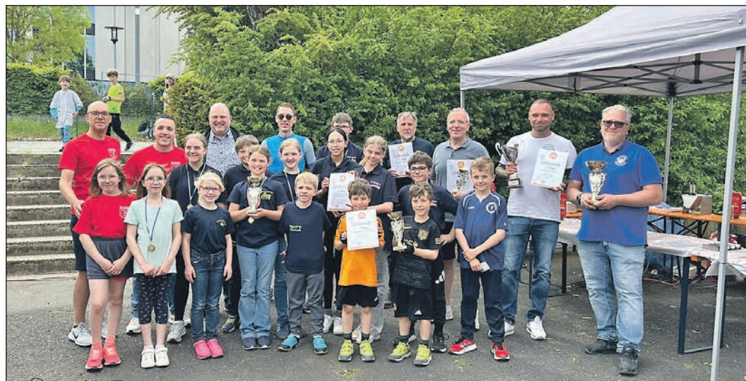
Gruppenfoto der Sieger des 44. Stierstädter Volksradfahrens.