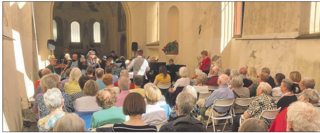
Volles „Haus“ in der Ruine

Die Beerdigung findet am Montag, dem 11. Mai 2026 um 11.00 Uhr auf dem Alten Friedhof in Oberursel-Süd statt.