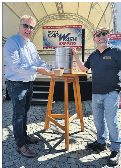
Gekommt ist gekommt ...