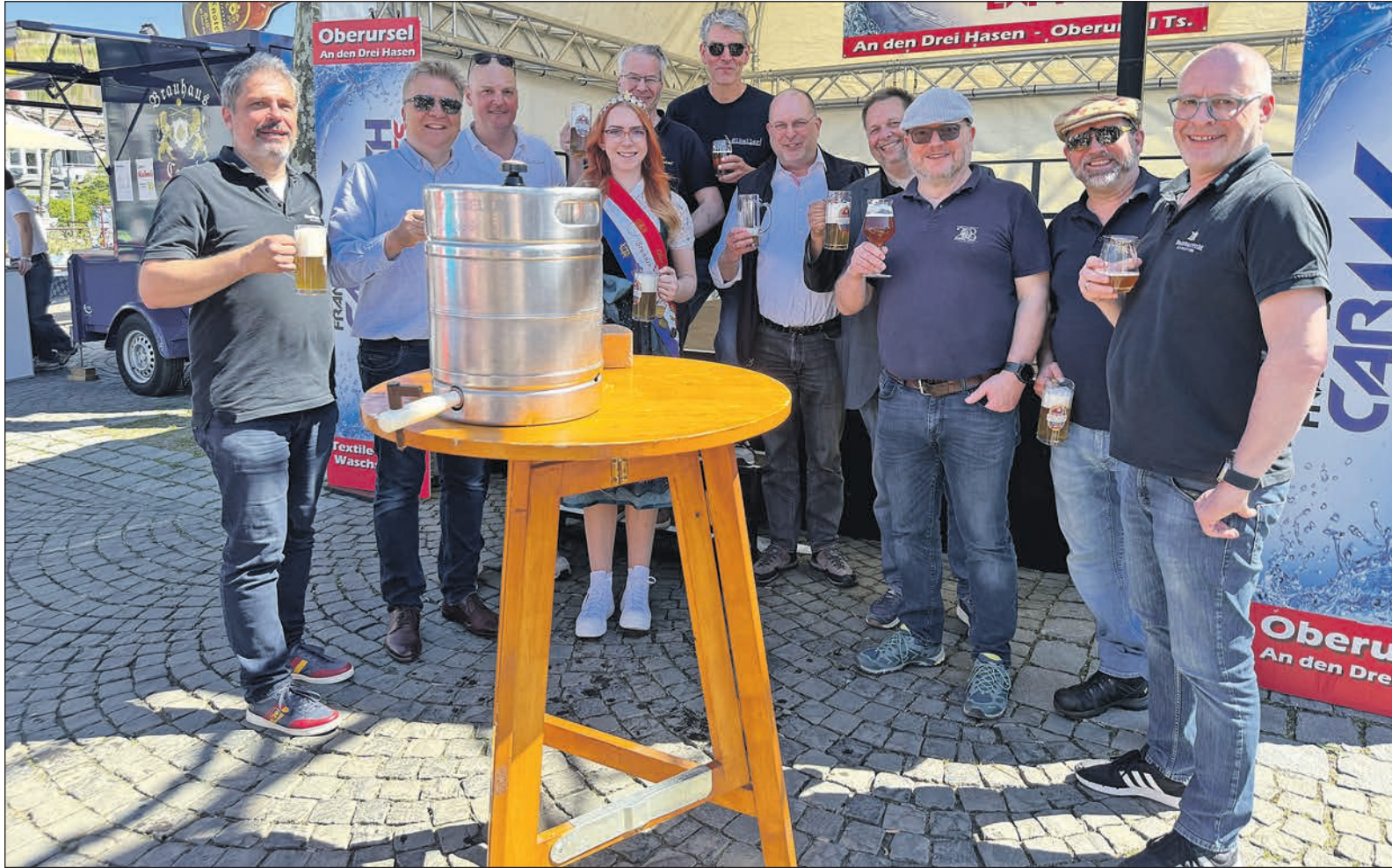
Gute Stimmung nach dem Fassbieranstich auf dem Rathausplatz anlässlich des Festes zum Tag des Bieres.