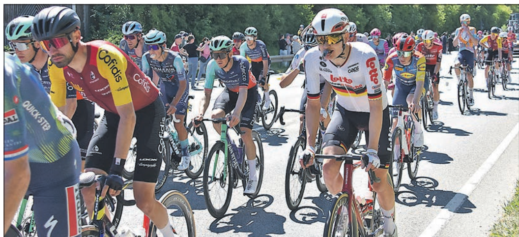
Die Stärkung scheint geholfen zu haben – der Sieger Georg Zimmermann.

211 Kilometer liegen hinter dem Feld. Zwölf Fahrer vorne. Tempo hoch. Taktik gefragt. Und dann: der Sprint. Georg Zimmermann wartet, lauert – und zieht durch. Perfektes Timing. Keine Chance für die Konkurrenz. Hinter ihm: Tom Pidcock und Ben Tulett. Der größte Sieg seiner Karriere. Und ein deutscher Sieg, der perfekt zu diesem Tag passt. Doch dieser Freitag, 1. Mai, hat mehr als nur einen Gewinner. Er gehört auch dem Fahrer, der seine Karriere noch nicht beenden will. Der durch seine Heimat fährt und spürt, was das mit ihm macht. John Degenkolb. Vielleicht war es genau dieser Tag. Diese Stimmung. Diese Nähe. Noch ein Jahr. Noch ein Start. Oberursel hat gezeigt, warum dieses Rennen mehr ist als Sport. Und warum Degenkolb noch nicht fertig ist.