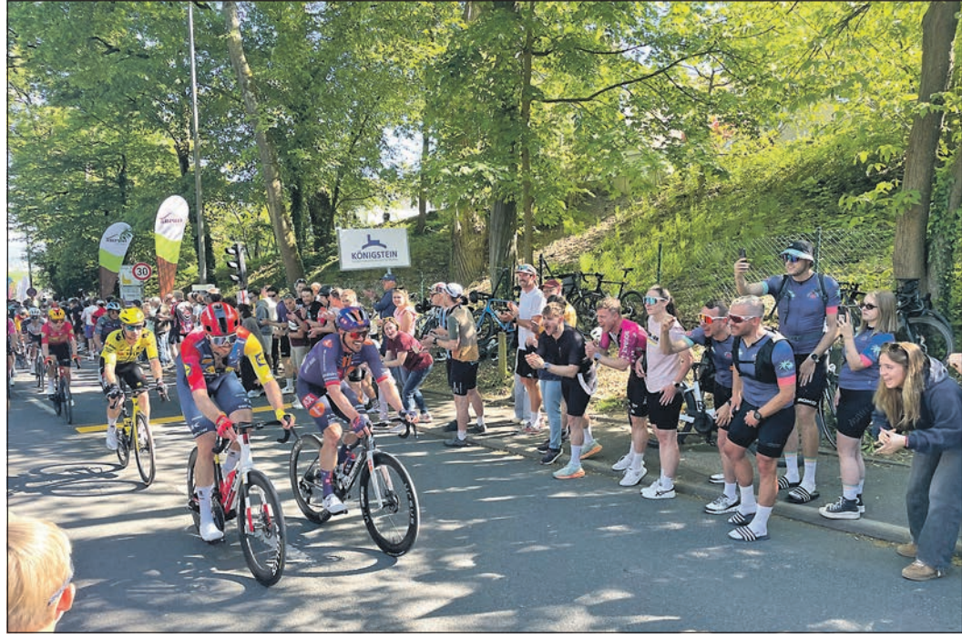
Degenkolb am Berg nach dem Mammolshainer Stich „Am Mönchswald“.