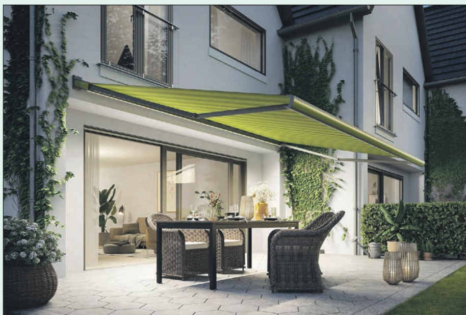
Ein fachgerecht montierter Sonnenschutz macht Terrasse oder Balkon zum langlebigen Rückzugsort und schützt dank robuster Markenqualität auch bei wechselhaftem Wetter zuverlässig.

Weitere Informationen gibt es auf dem Rollladen- und Sonnenschutzportal unter www.rollladen-sonnenschutz.de oder beim Informationsbüro Rollladen + Sonnenschutz unter 0228 95210-500.