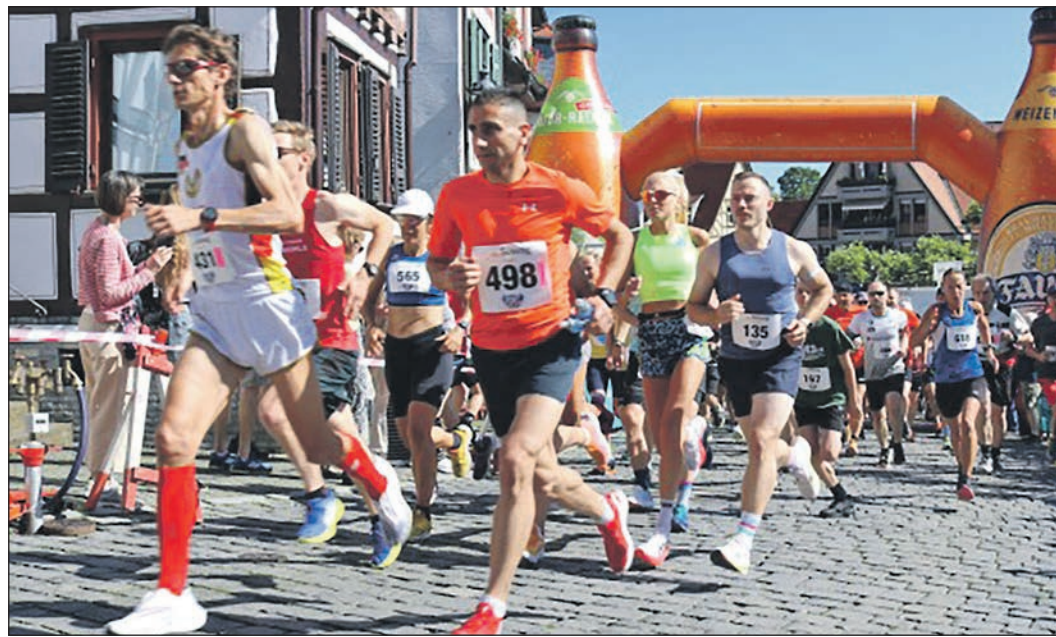
Mehr als 1.000 Läufer werden zum Brunnenfestlauf erwartet Ende Mai.

Interessierte, die sich gerne als „Volunteer“ engagieren möchten, zum Beispiel bei der Streckensicherung oder der Getränkeausgabe, können sich per E-Mail an info@tsg-oberursel.de oder unter Telefon 06171-51860 melden und so am Veranstaltungstag unterstützen.