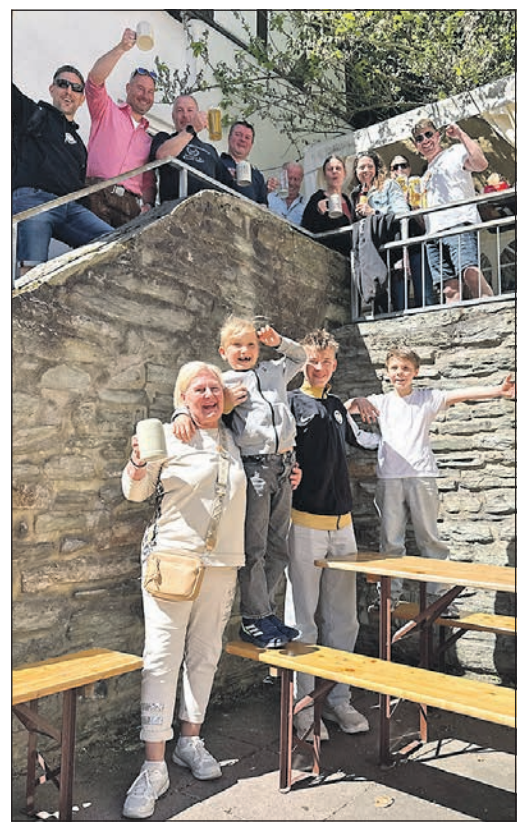
Glück, wer an der Rennstrecke wohnt und das Radrennen mit einer Party verbindet.