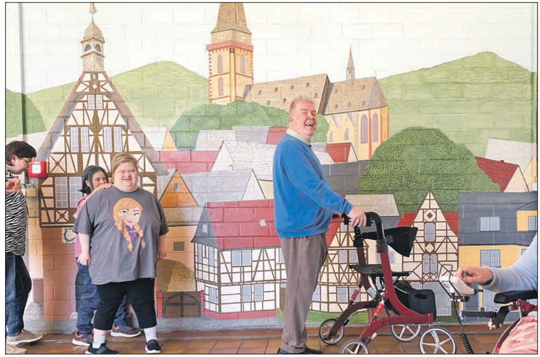
Gemächlich geht es zum Mittagessen