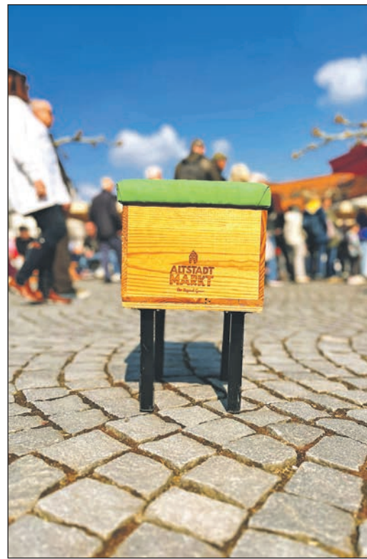
Der Altstadtmarkt in Oberursel.

Auch in der nahegelegenen Stadtbücherei gibt es ein passendes Angebot für Familien: das Internationale Vorlesen. Jeden Samstag um 10.30 Uhr lesen Vorleserinnen und Vorleser Kindern ab drei Jahren Bilderbücher in ihrer jeweiligen Herkunftssprache vor. Das Angebot ist kostenfrei und ohne Anmeldung. Am Samstag wird auf Ukrainisch vorgelesen. Standbetreibende, Künstler sowie Vereine, die sich am Altstadtmarkt beteiligen möchten, können sich bei der städtischen Wirtschaftsförderung melden – telefonisch unter 06171 502-284 oder per E-Mail an wirtschaftsfoerderung@oberursel.de .