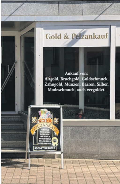
Anders als viele andere Goldankäufer verfügt das „Auktionshaus Schwalbach“ über ein eigenes Ladengeschäft in der Schulstraße in Alt-Schwalbach.