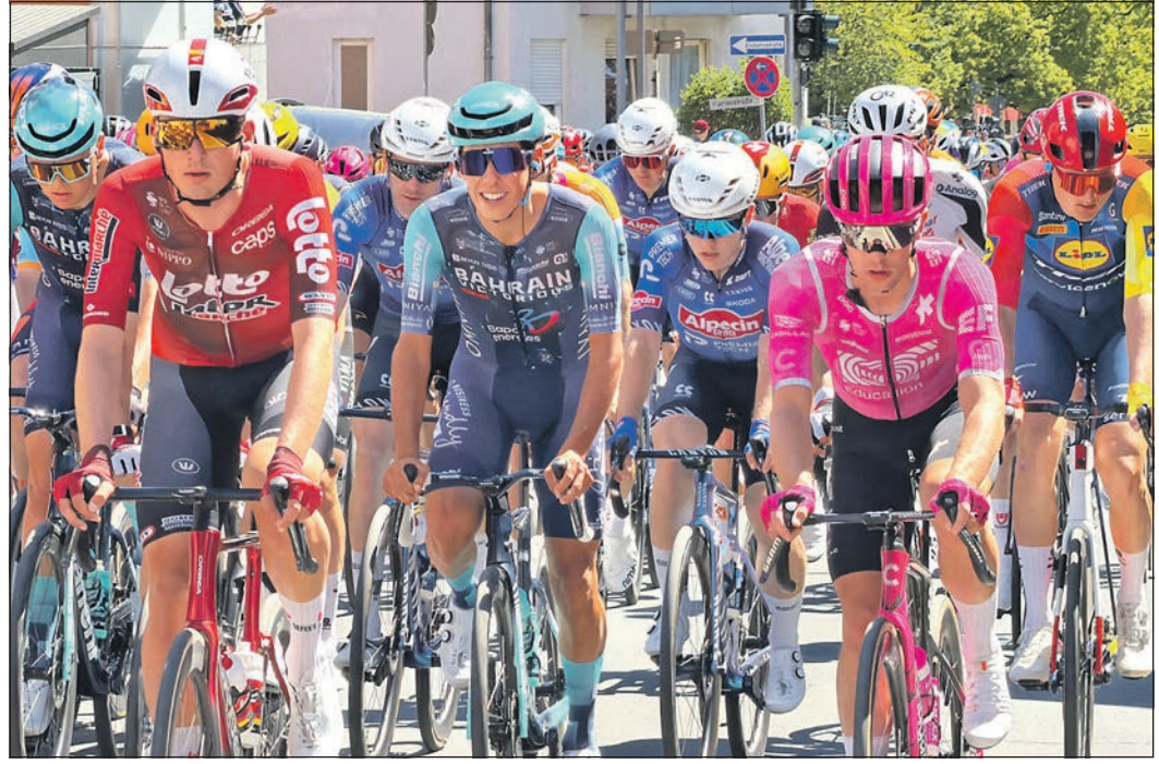
Die Profis on tour, nachdem sie den Marktplatz hinter sich gelassen haben.