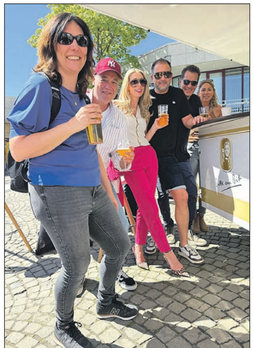
Gute Laune bei den Gästen von nah und fern.