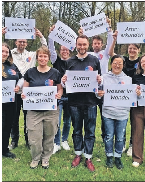
Die Klimabeauftragten der teilnehmenden Kommunen.