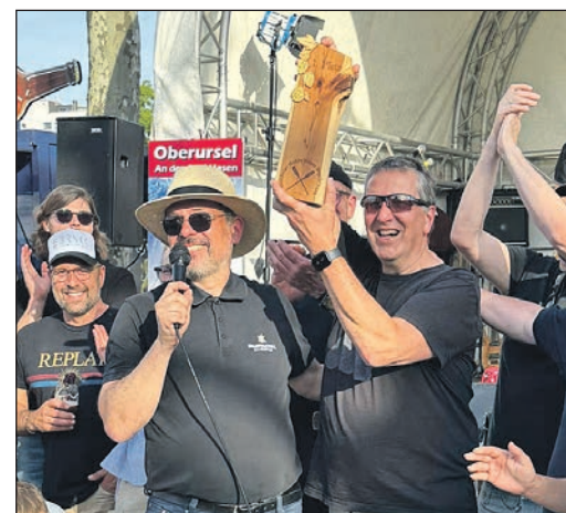
Der Sieger in Siegerpose