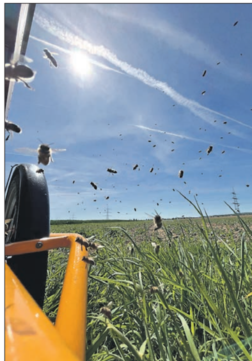
Die Wanderbienen nach ihrem Winterschlaf.

Spielerisch entdecken sie die Lebenswelt der Bienen, probieren verschiedene Honige und Pollen und erhalten im Rahmen eines kleinen „Honigfrühstücks“ einen altersgerechten Zugang zu den Produkten der Bienen. Im Anschluss können die Wanderbienen vor Ort beobachtet werden – außerhalb und, mit entsprechender Schutzkleidung, auch im Bie-