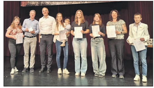
Nahmen die Auszeichnungen für ihre Erfolge – darunter der zweite Platz bei der Deutschen Vereinsmeisterschaft im Agility – stellvertretend auch für ihre Hunde entgegen: Die Hundeführerinnen und -führer der Hundefreunde Schwalbach.