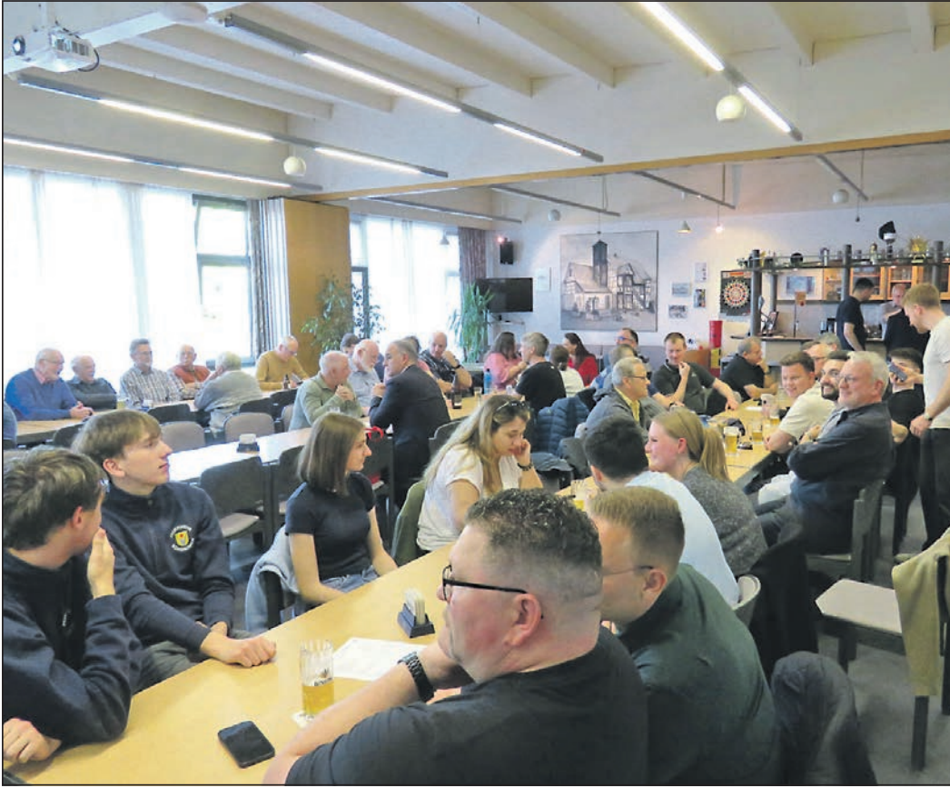
Gut besucht war Ende April die Jahreshauptversammlung des Feuerwehrvereins im Saal des Gerätehauses in der Hauptstraße.