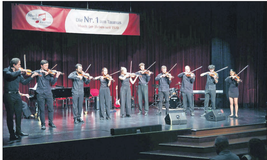
Der Auftritt des Streicher-Ensembles gehörte zu den Höhepunkten des Jahreskonzerts.