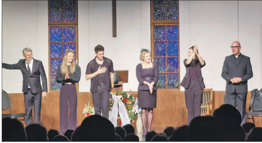
Das Ensemble der Landebühne Rheinland-Pfalz aus Neuwied spielte zum Abschluss der Eschborner Theatersaison im Schwalbacher Bürgerhaus.