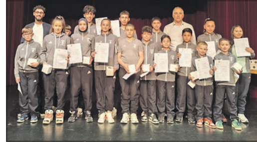
Waren bei zahlreichen regionalen, nationalen und internationalen Turnieren erfolgreich: die Sportlerinnen und Sportler der Taekwondo-Abteilung der TG Schwalbach.