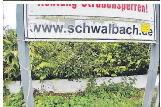
Bis die neuen Zusatzschilder geliefert sind, wollten „Die Eulen“ vorübergehend für Ersatz gesorgt. Doch auch deren „Ersatzschilder“ waren nach wenigen Tagen verschwunden.