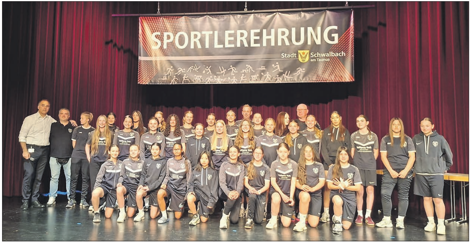
Vize-Meister der Gruppenliga Frankfurt, Kreispokalsieger, Regionpokalsieger, Vize-Pokalsieger im Hessenvokal, Futsalkreismeister – Die Fußballerinnen des BSC Schwalbach erzielten zahlreiche sportliche Erfolge.