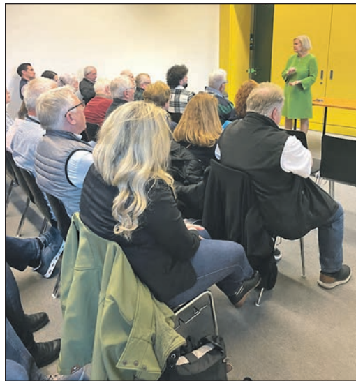
Die SPD-Bundestagsabgeordnete Nancy Faeser lädt wieder zu Bürgerfahrten nach Berlin ein.

Main-Taunus-Kreis (sz). Die SPD-Bundestagsabgeordnete Nancy Faeser lädt Bürgerinnen und Bürger aus dem Main-Taunus-Kreis zu politischen Informationsfahrten nach Berlin ein. Die Fahrten werden vom Bundespresseamt organisiert und vom Deutschen Bundestag unterstützt. Ziel ist es, Einblicke in die politische Arbeit in der Hauptstadt zu geben. Auf dem Programm stehen unter anderem ein Besuch im Bundestag sowie Gespräche mit Nancy Faeser und in Ministerien. Die erste Fahrt ist vom 2. bis 4. September geplant. Eine zweite Reise findet vom 2. bis 4. November statt. Sie richtet sich an Beschäftigte von Polizei, Feuerwehr und Rettungsdiensten. Nancy Faeser erklärt: „Mir ist wichtig, dass möglichst viele Menschen aus unserer Region die Gelegenheit bekommen, Politik in Berlin direkt zu erleben.“ Die Teilnahme ist kostenfrei. Interessierte können sich per E-Mail an nancy.faeser.wk@bundestag.de melden.