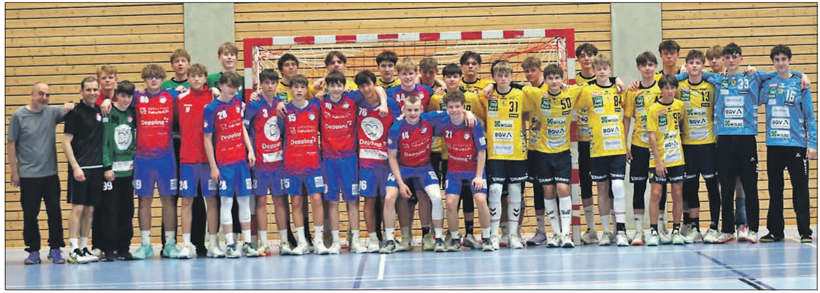
Die A-Jugend der HSG Schwalbach/Niederhöhnstadt (rote Trikots) hat nach wie vor die Chance auf den Regionalliga-Aufstieg.