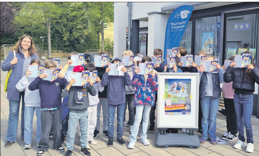
Grundschülerinnen und -schüler aus Niederhöhnstadt und Schwalbach besuchten zum Tag des Buchs die Buchhandlung „7. Himmel“ am Montgeronplatz.