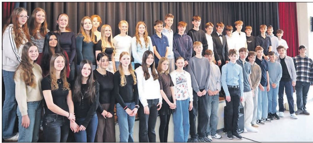
42 jugendliche Konfirmanden aus der Evangelischen Friedenskirchengemeinde und der Evangelischen Gemeinde Eschborn stellten sich am Sonntag vor.