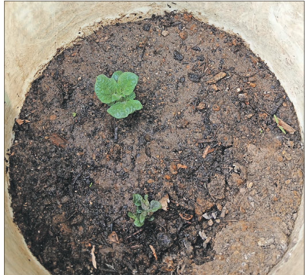
Zwei Triebe haben sich aus der Saatkartoffel der Sorte „Linda“ gebildet. Ab sofort will „ChatGTP“ die Gießmenge erhöhen.

Nächster Düngetermin ist am Samstag. Und wenn die beiden Pflänzchen bis dahin eine Größe von 15 Zentimetern geschafft haben, beginnt auf Befehl des Chatbots das Anhäufeln. Fortsetzung folgt.