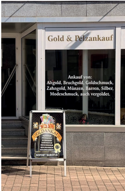
Anders als viele andere Goldankäufer verfügt das „Auktionshaus Schwalbach“ über ein eigenes Ladengeschäft in der Schulstraße in Alt-Schwalbach.