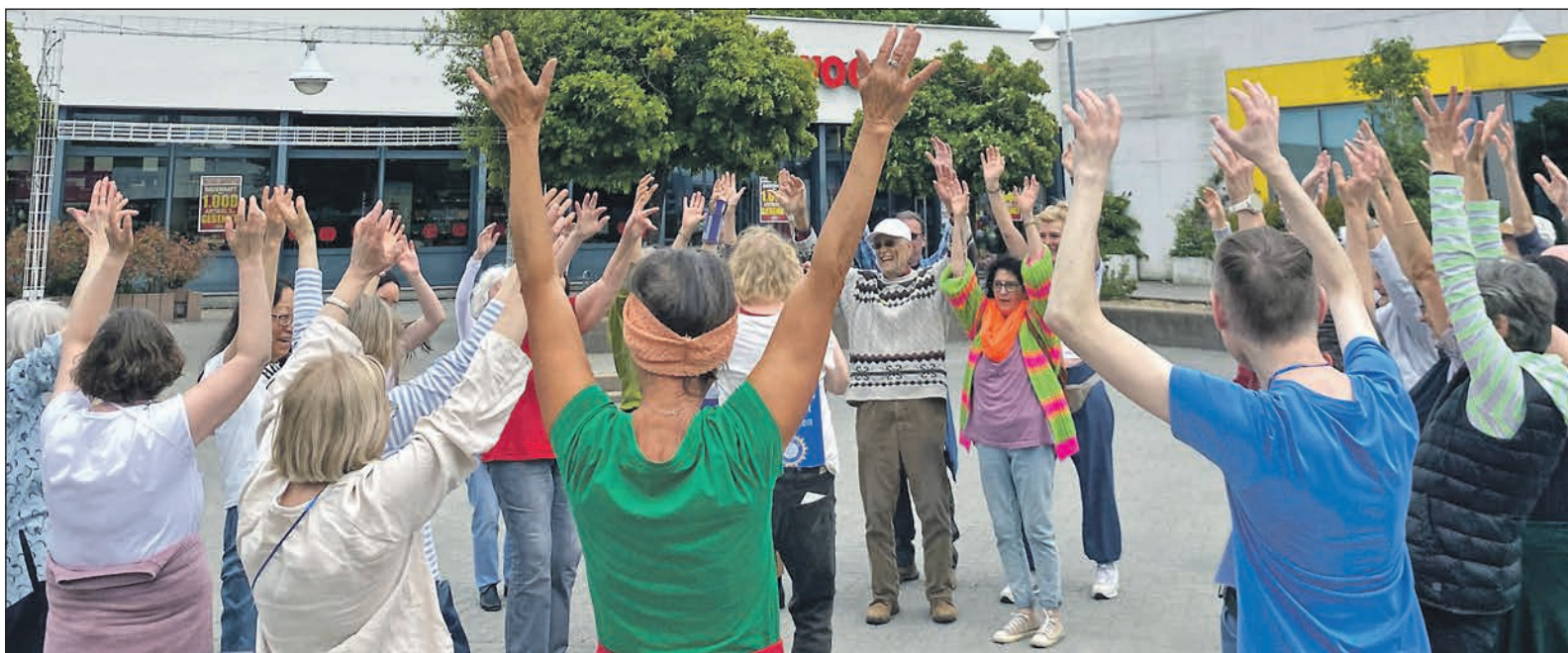
Rund 50 Schwalbacherinnen und Schwalbacher feierten am Sonntag auf dem Marktplatz den Weltlachtag.