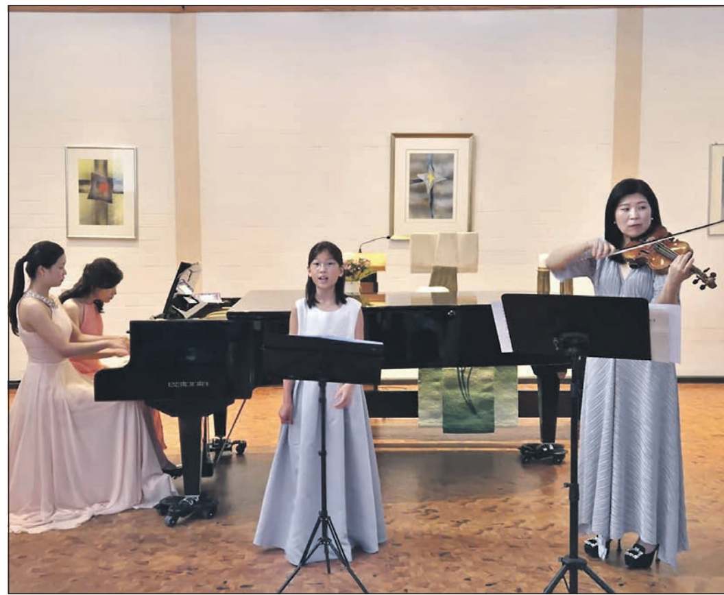
Vier Musikerinnen aus Korea spielen am 10. Mai ein Muttertagskonzert.

Donnerstag, 21. Mai: Spieleabend um 18 Uhr in der Stadtbücherei am Marktplatz.