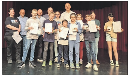
Von Platzierungen bei den Bezirksmeisterschaften der U11, U13 und U15 bis hin zum ersten Platz bei der Deutschen Meisterschaft in der Ü30 reichten die sportlichen Erfolge der Judo-Abteilung der TG Schwalbach.