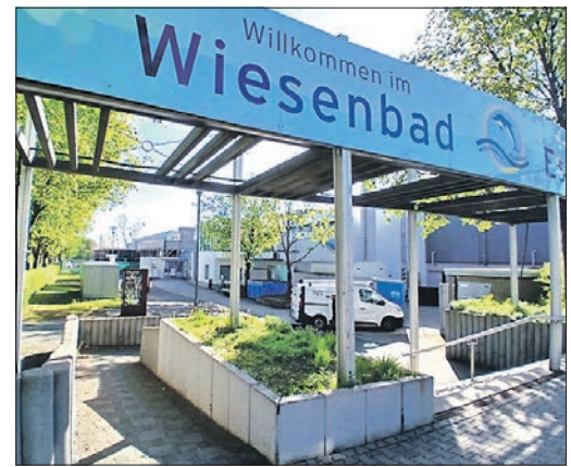
Seit Dienstag heißt das Wiesenbad die Badegäste seit dem 21. April wieder willkommen.