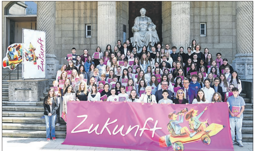
Die Stiftung Handschrift zeichnete in Wiesbaden Schülerinnen und Schüler aus ganz Hessen aus. Zwei der Preisträgerinnen besuchen die Schwalbacher Obermayr-Schule.

Fische Dinge, die jetzt ans Tageslicht kommen, sind von entscheidender Bedeutung für Ihr weiteres Handeln. Kann es sein, dass Sie sich in einem Menschen komplett geirrt haben? 20.2.–20.3.