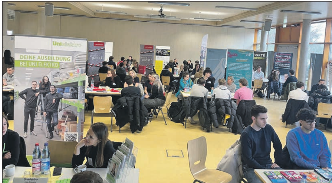
Rund 20 Minuten dauerten die Gesprächsrunden, bei denen die Schülerinnen und Schüler ihre Eindrücke mit Unternehmensvertretern vertiefen konnten.