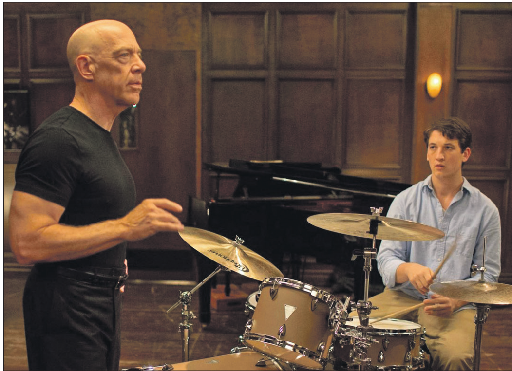
Das vielfach ausgezeichnete Drama „Whiplash“ ist am Freitagabend in der Kinowerkstatt im „Eschborn K“ zu sehen.