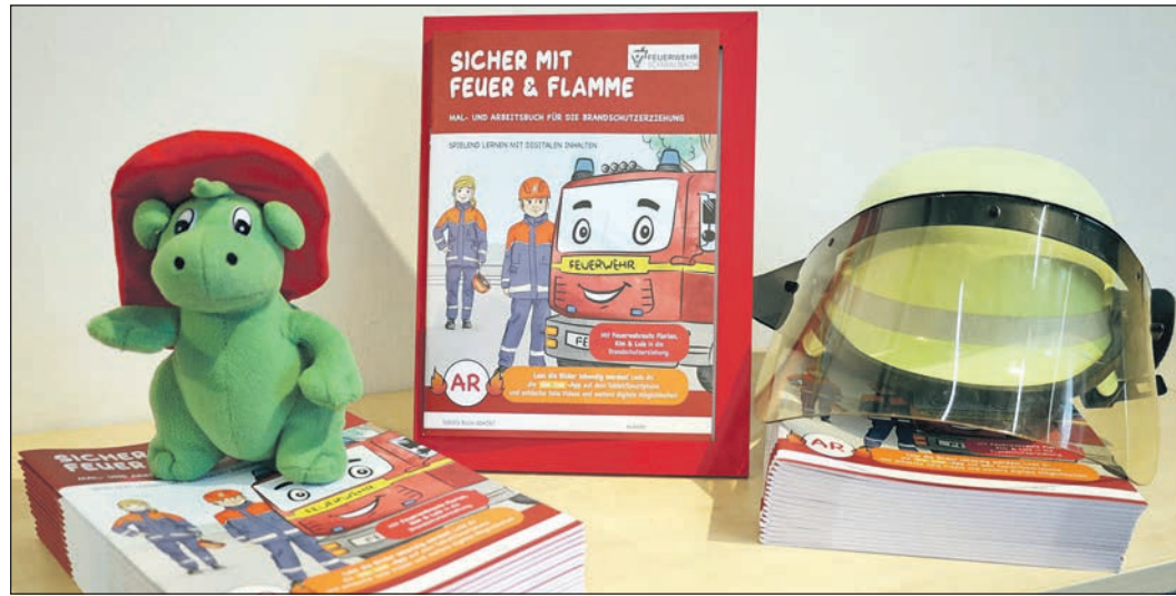
So sehen die neuen Arbeitsbücher für die Brandschutzerziehung der Schwalbacher Grundschüler aus.

Zum Abschluss verabschiedete die Stadt die Gäste am Waldfriedhof mit einem kleinen Geschenk.