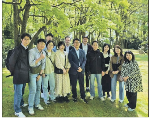
Eine zehnköpfige Delegation aus Süd-Korea informierte sich im Rathaus über die Grünanlagen.

Schwalbach (sz). Eine Delegation aus der südkoreanischen Provinz Gyeongsangbuk-Do hat Ende April Schwalbach besucht. Die zehnköpfige Gruppe des Amtes für Forst- und Tourismusentwicklung informierte sich über kommunale Konzepte zu Grünflächen, Naturschutz und Lebensqualität. Empfangen wurden die Gäste von Wirtschaftsförderer Philip Sokolowski und