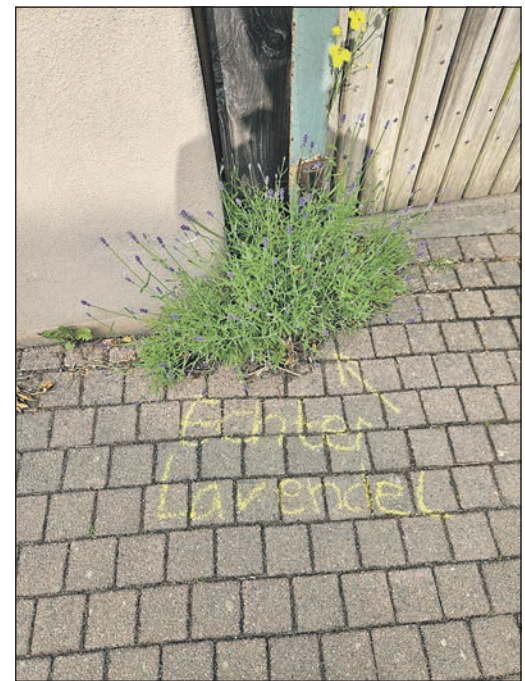
Bei der Krautschau am kommenden Sonntag werden Ritzenkräuter bestimmt und mit Kreide beschriftet.

den. Sein Referat mit dem Titel „Vielfalt zum Niederknien – Pflanzliche Helden zwischen Stein und Asphalt“ findet um 19.30 Uhr in Frankfurt statt, kann aber auch online verfolgt werden. Mehr Infos dazu gibt es auf den Seiten der Senckenberg-Gesellschaft oder unter gruenlink.de/tbjpwbq93c im Internet.