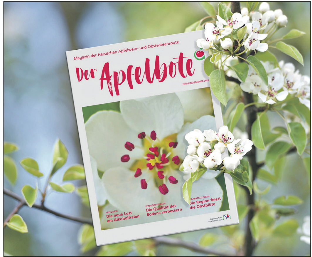
So sieht die aktuelle Ausgabe des „Apfelbotens“ aus, die der Regionalverband gerade herausgegeben hat.

Schwalbach (sz). Vor Beginn der Sommerferien präsentiert der Arbeitskreis „Smart Energy“ ein Thema, das für fast jeden interessant ist: Wie lässt sich das eigene Zuhause sicher, energiesparend und komfortabel für die Urlaubszeit vorbereiten? Dieser Frage widmet sich der nächste Informationsabend des Arbeitskreises am Dienstag, 19. Mai, ab 19 Uhr im Raum 6 im Bürgerhaus. Moderne Smart-Home-Technik ermöglicht heute eine zuverlässige Steuerung und Kontrolle des Hauses – auch aus der Ferne. Entscheidend ist jedoch eine gute Vorbereitung. Anhand praxisnaher Beispiele und einer umfangreichen Checkliste erfahren die Teilnehmerinnen und Teilnehmer, wie sich Sicherheit erhöhen, Energie sparen und technische Probleme während der Abwesenheit vermeiden lassen. Eine Anmeldung ist nicht nötig. Der Eintritt ist frei. Interessierte Bürgerinnen und Bürger sind willkommen.