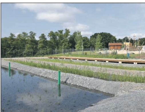
Das Regenerationsbecken wurden aufwändig erneuert.

Um die Wasserqualität auch bei hoher Belastung