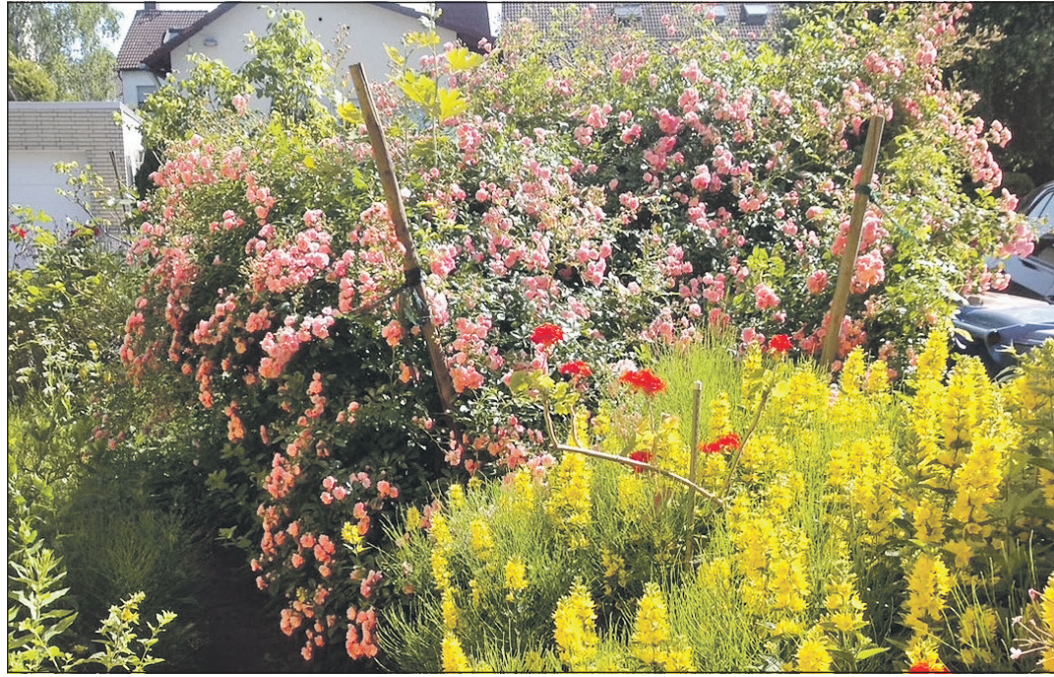
Die Strauchrose „Fairy“ blüht beinahe das ganze Jahr über.

senbusch, der meinen Beethügel ganz überdeckt und den Untergrund vor dem Austrocknen schützt. Doch wenn sie mich sogar in der Winterzeit mit einzelen Blüten überrascht, dann geschieht es aus Dankbarkeit, weil ich mich weder von der Jahreszeit, noch von Vorschriften leiten ließ, sondern sie so lange blühen ließ, wie sie wollte, auch wenn sie spärlicher und bescheidener aussah gegen Jahresende und nicht mehr über die Blütenfülle des Sommers verfügte. Die „Fairy“ blüht auch auf dem Grab meines Mannes als kleines Bäumchen und lehnt sich an die beiden Buntsandstein-Stelen an. Und ich denke, daß sie es auch dort gut hat, bei ihm, der sie einst im Garten so liebte in ihrer Fülle und in ihrer Kargheit.“