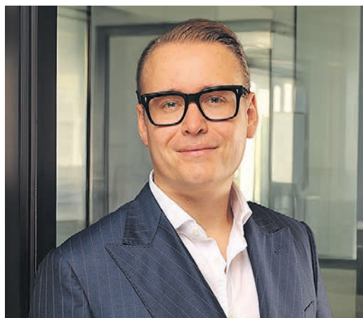
Paul Huelsmann, CEO FINEXITY Group

Die Entwicklung der Sparzinsen seit 2000 – von rund 2,5 %–4,0 % auf ein langjähriges Niedrigzinsniveau nahe null – zeigt, dass klassische Anlageformen kaum noch verlässliche Erträge bieten. Genau diese Lücke schließen wir mit einem Investment bereits ab 50 €, das regelmäßige Auszahlungen mit realwirtschaftlicher Substanz verbindet und somit eine gezielte Diversifikation für einen planbaren, auf Langfristigkeit ausgelegten Vermögensaufbau ermöglicht.