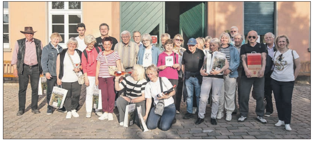
Zum Abschluss des Besuchs im rheinhessischen Oppenheim gab es eine Weinprobe in einem der Weingüter in der Stadt am Rhein.