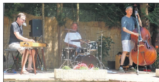
Boogie-Woogie mit dem „Jerry Ree Lewis Trio“ bei „Mutter Krauss“.