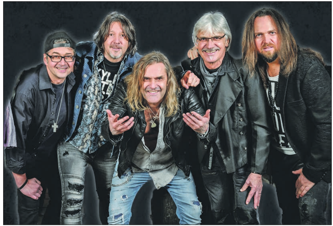
Mit „Too Young To Rust“ startet die diesjährige Sommertreff-Reihe.

Während der ersten vier Ferienwochen bleibt die Stadtbücherei zu den gewohnten Zeiten geöffnet. Anschließend beginnt die Sommerpause. Letzter Öffnungstag vor der Schließung ist Freitag, 24. Juli. Ab Dienstag, 11. August, ist das Team wieder für die Leserinnen und Leser da. Auch während der Schließzeit können Nutzerinnen und Nutzer auf das digitale Angebot zugreifen. Über die „Onleihe Hessen“ stehen rund um die Uhr E-Books, Hörbücher, digitale Zeitungen und weitere Medien zur Verfügung.