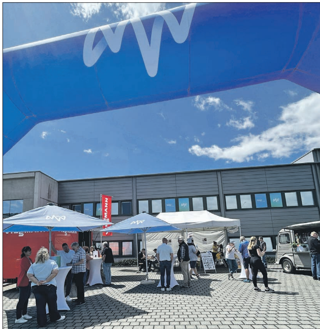
Gut besucht waren die Infostände am Tag der offenen Tür bei MVV.

Komponenten miteinander verknüpft werden können. Erstmals beteiligte sich auch der Heiztechnikhersteller Viessmann an der Veranstaltung. Das Unternehmen präsentierte einen Wärmepumpen-Testsieger in einem eigenen Infotruck. Ergänzt wurde das Programm durch Führungen über das Gelände sowie Angebote für Familien. MVV ist seit April 2024 mit einem Standort im Gewerbegebiet Camp Phönix Park vertreten. Das Unternehmen bietet Energielösungen aus einer Hand an – von der Beratung über die Planung bis zur Installation.