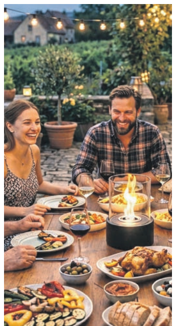
Gemütlichkeit im Schein der Flammen. Foto: DJD/Droste (KI generiert)

(DJD). Ob beim romantischen Dinner zu zweit oder in geselliger Runde: Tischfeuer sorgen an Sommerabenden für eine stimmungsvolle Atmosphäre. Allerdings sind nicht alle Modelle gleich sicher. So stehen Geräte mit Ethanol in der Kritik, da bei der Verbrennung gesundheitsschädliche Partikel entstehen können. Zudem besteht beim Nachfüllen die Gefahr von Verpuffungen oder Stichflammen. Als risikoarme Alternative gelten Tischfeuer mit speziellen Sicherheitsbrennstoffen, etwa von Feuertisch. Hochwertige Tischfeuerlösungen sind so konzipiert, dass die Flamme bei einem versehentlichen Umstoßen von selbst erlischt. Unter www.feuertisch.de gibt es dazu weitere Informationen, Erklärvideos und Modelle zum Auswählen.