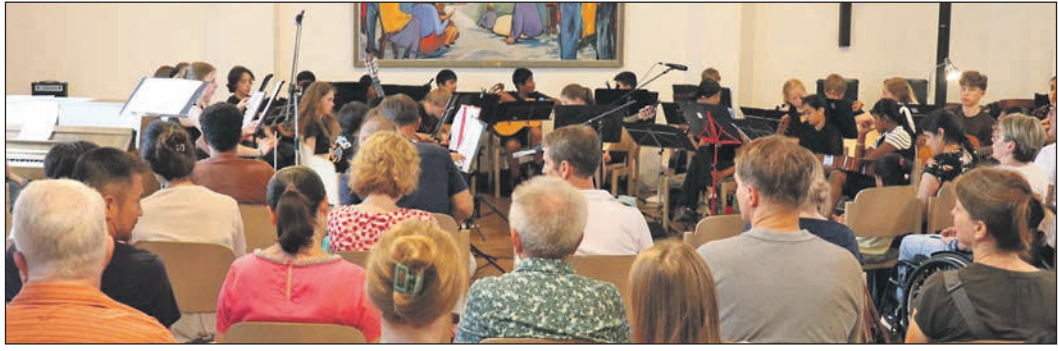
Eine der größten Gruppen war das Ensemble „Mixed Ages“, das im katholischen Gemeindezentrum Stücke aus Klassik und Pop spielte.