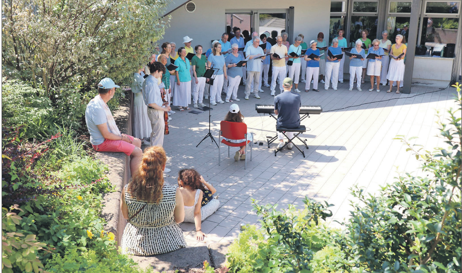
Als erstes sang am späten Vormittag der Chor „TonArt“ am Unteren Marktplatz vor dem Bürgerhaus.

Schwalbach ist die einzige Stadt im Main-Taunus-Kreis, die an der mittlerweile weltweiten „Fête de la musique“ teilnimmt, die jedes Jahr am 21. Juni stattfindet. Die Idee entstand einst in Frankreich. Mittlerweile machen über 1.000 Städte mit, 180 davon in Deutschland. In Schwalbach initiierte Margit Reiser-Schober im Jahr 2022 die Premiere, die sehr gut ankam. Und nach der fünften Auflage am Sonntag hat sich das kleine Musikfestival mittlerweile fest im Terminkalender von Schwalbach etabliert – auch wenn es dieses Mal wirklich ein bisschen zu heiß war.