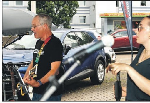
Am Autohaus Schwalbach hatte die Band „CU“ ihren Auftritt.