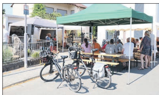
Die „Old Men Group“ rockte in der Odenwaldstraße.