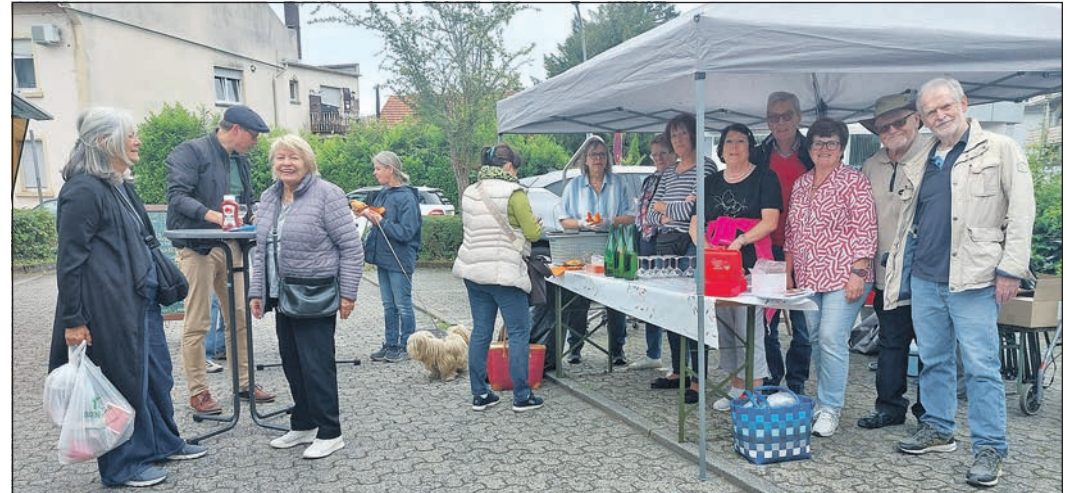
Seniorenbeirat und AWO-Ortsgruppe sorgten am Dienstag vergangener Woche für Grillwürste beim Dienstagsmarkt in Alt-Schwalbach.