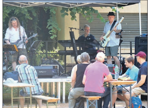
„Dealers of Life“ hatten die Bühne hinter der Alten Schule.