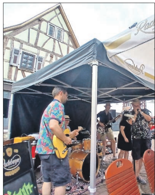
Viel los war bei der Session des „BluesHaus“ am Historischen Rathaus.