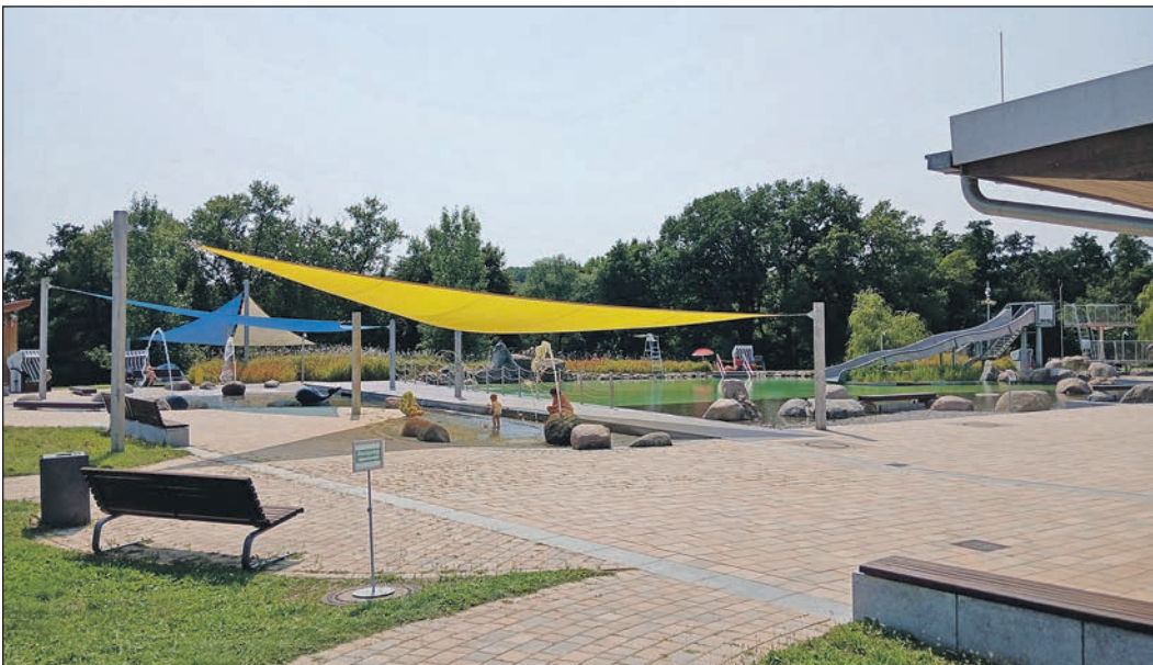
Wie schon im vergangenen Jahr herrschte am Wochenende trotz besten Badewetters gähnende Leere im Naturbad, weil die Becken gesperrt werden mussten.