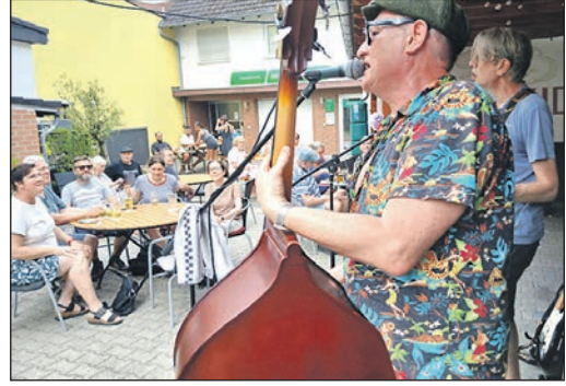
„The Tulips“ heizten im Hof der Kult-Eiche mit Rockabilly-Punk ein.