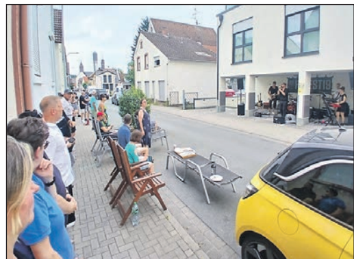
„Forrest 19“ hatte sein Publikum auf der anderen Seite der Schulstraße.