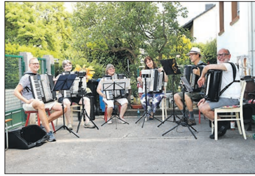
Das Ensemble Mathasi spielte mit sechs Akkordeons „Am Schollengarten“.