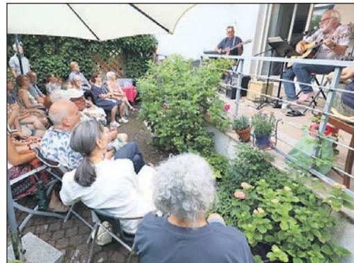
Proppenvoll war der Garten mit dem Duo „JR“ in der Altkönigstraße.