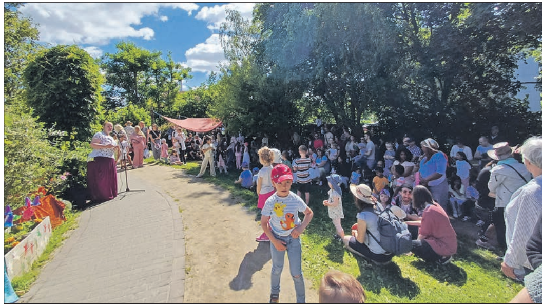
Das Gelände der Kita „Mittendrin“ wurde beim Sommerfest der Einrichtung Mitte Juni zum einem „Magischen Zauberwald“.