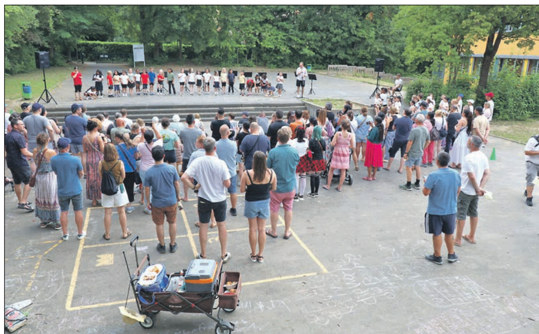
An der Georg-Kerschensteiner-Schule sang ein Schülerchor vor einem etwas größeren Publikum aus Eltern und Verwandten.