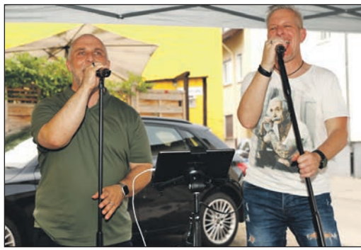
Die „WonderVoices“ verzückten am Raben mit ihren Stimmen.