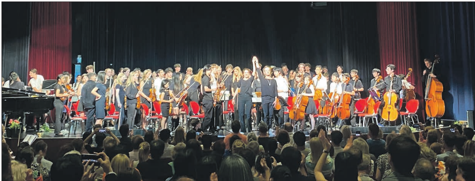
Zum Abschluss des Sommerkonzerts der Albert-Einstein-Schule standen alle rund 120 Musikerinnen und Musiker auf der Bühne im großen Saal des Bürgerhauses und genossen den langanhaltenden Applaus des Publikums.

Main-Taunus-Kreis (sz). Zur Fußball-Weltmeisterschaft veranstaltet die Main-Taunus-Verkehrsgesellschaft (MTV) ein Gewinnspiel auf ihren Kanälen bei Instagram und Facebook. Zu gewinnen gibt es zehn Fußbälle mit MTV-Logo. Bis Donnerstag, 2. Juli, veröffentlicht die MTV jeden Freitag um 18.30 Uhr ein neues Video auf ihren Social-Media-Kanälen. Wer teilnehmen möchte, muss das jeweilige Video mit „Gefällt mir“ markieren, die dazugehörige Frage in den Kommentaren beantworten und dem MTV-Kanal auf Facebook oder Instagram folgen. Nach Angaben der MTV kann die Gewinnchance erhöht werden, wenn Freunde markiert oder das Gewinnspiel in der eigenen Story geteilt wird. Die Teilnahme ist kostenlos. Weitere Informationen gibt es unter mtk-web.de im Internet.