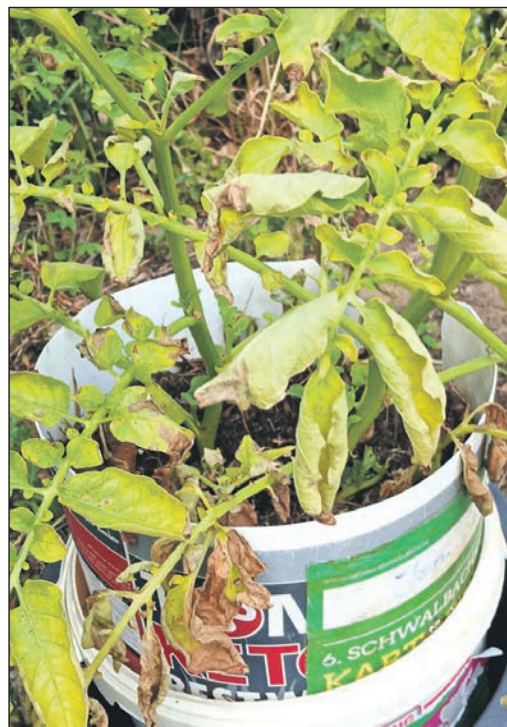
Die Hitzewelle hat braune und gelbe Blätter hinterlassen. Der Sieg beim Kartoffelwettbewerb ist dadurch ernsthaft in Gefahr.

sich die Pflanze bisher gut entwickelt hat. Allerdings ist der Eimer nach Meinung der KI mittlerweile nährstofftechnisch „fast leer“. Wenn sich die Pflanze etwas erholt hat, hält „ChatGPT“ die Gabe eines kaliumbetonten Düngers für angebracht. Der Sieg ist nach dem heißen Wochenende erstmal in die Ferne gerückt. Vor der Hitzewelle seien durchaus 900 Gramm möglich gewesen, jetzt tippt der virtuelle Gartenhelfer darauf, dass im September nur 400 bis 700 Gramm im Eimer sein werden. Das hat in den vergangenen zehn Jahren leider noch nie zum Sieg gereicht. Fortsetzung folgt.