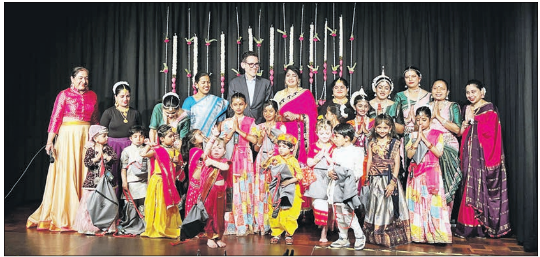
Prachtvolle indische Gewänder waren bei der jüngsten Ausgabe von „Schwalbachs Farben“ auf der Bühne im Raum 1 im Bürgerhaus zu sehen.