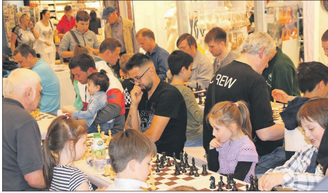
Vor allem Kinder und Jugendliche sollen mit den Schachtagen im Main-Taunus-Zentrum für den strategischen Denksport interessiert werden.