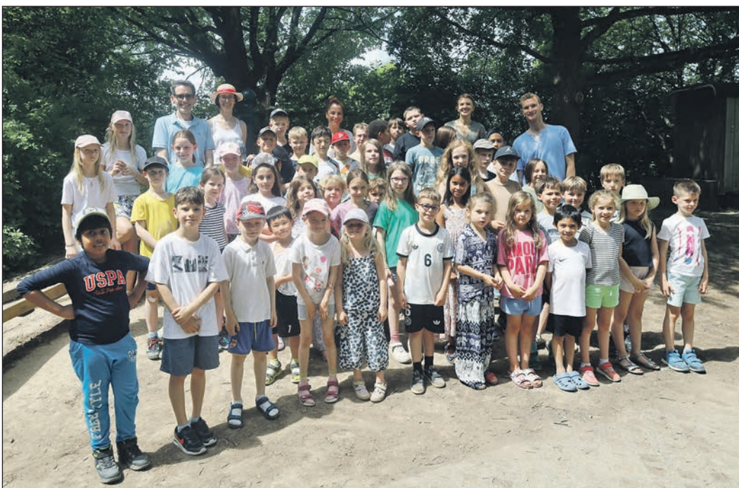
Auch zahlreiche Schülerinnen und Schüler der „Kinderzeit-Gute Zeit-Schule“ am Kronberger Hang beteiligten sich an der Müllsammel-Aktion.

Der „Saubere Schulweg“ findet im Rahmen der hessischen Umweltkampagne „Saubere Hessen“ statt, die junge Menschen seit mittlerweile 24 Jahren spielerisch und praxisnah an Umweltthemen heranzuführt. Schwalbach ist Mitglied des entsprechenden Arbeitskreises und unterstützt die Schulen vor Ort bereits seit 2009 bei der Umsetzung.