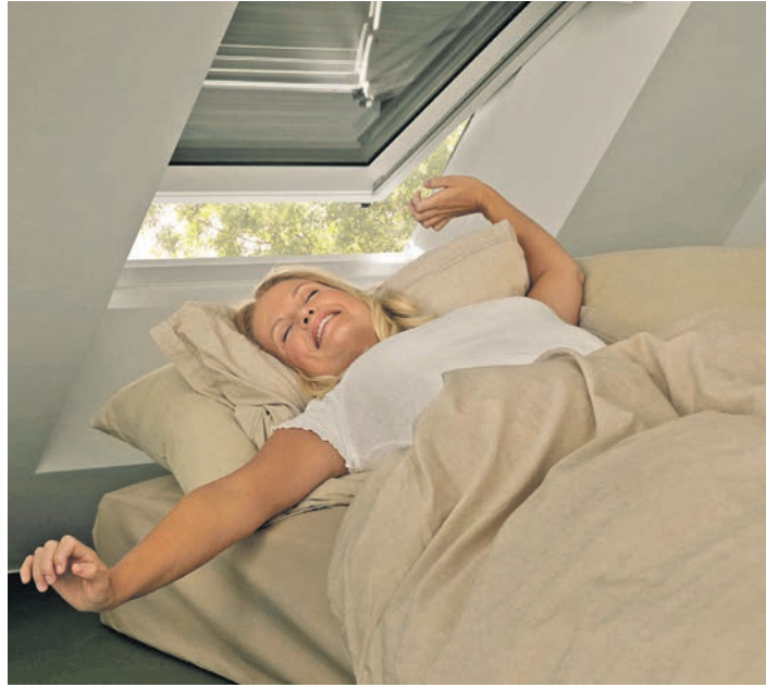
Außenrollläden sorgen für Hitzeschutz und bieten zusätzlich eine Verdunkelung – beste Voraussetzungen für einen erholsamen Schlaf.

(DJD). Fenster sind im Hochsommer die Stelle, an der Wärme besonders schnell in den Raum gelangt. Mit dem passenden Zubehör lässt sich dies verhindern. Wirksamer als innen liegende Rollos oder Verdunkelungen sind außen liegende Lösungen wie Hitzeschutz-Markisen oder Rollläden. Sie verhindern, dass sich die Fensterscheibe überhaupt stark aufheizt. Gerade bei Dachfenstern macht dies einen spürbaren Unterschied. Moderner Hitzeschutz ist nicht nur im Rahmen einer kompletten Fenstersanierung realisierbar. Zahlreiche Zubehörlösungen lassen sich problemlos nachrüsten, auch bei älteren Dach- oder Fassadenfenstern. Wichtig sind vor allem die Auswahl und der fachgerechte Einbau des Systems, dabei werden Eigentümer von Fachbetrieben wie TLS-Dachfenster unterstützt. Infos: www.tls-dachfenster.de.