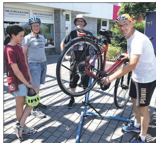
Gut angenommen wurde die mobile Fahrradwerkstatt des ADFC auf dem Marktplatz.