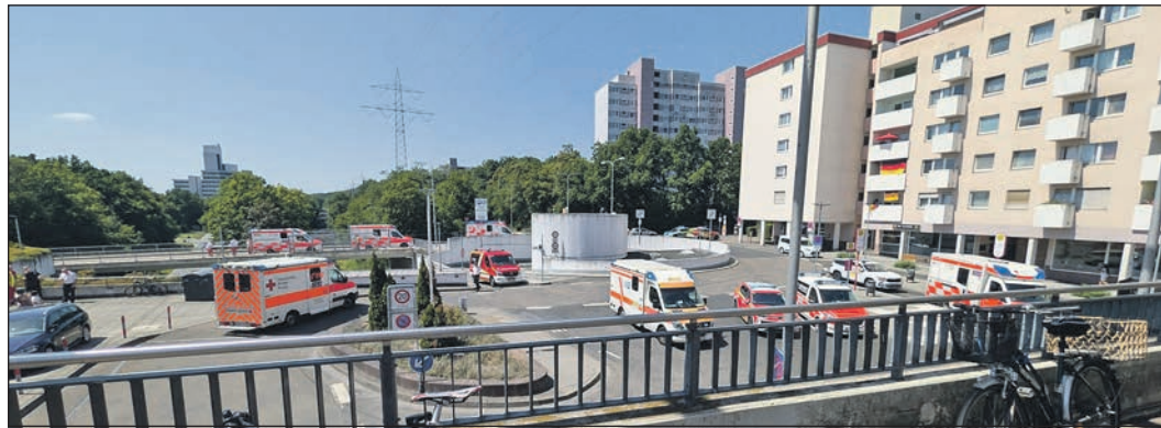
Ein Großaufgebot an Rettungs- und Notarztwagen raste am vergangenen Donnerstag zum Bürgerhaus.