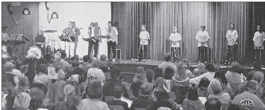
Immer komplett voll mit Kindern war der Mehrzweckraum der AES, wenn die Evangelisch-Freikirchliche Gemeinde Anfang der 2000er-Jahre zum „KiMiKo“ einlud.

Bestehen bleiben wird nach der Auflösung der Evangelisch-Freikirchlichen Gemeinde auch das Engagement für die Schwalbacher Flüchtlingshilfe. Hanne Pöppel wird ihre Aufgaben dort künftig als Privatperson erfüllen. „Das liegt mir sehr am Herzen und da mache ich natürlich weiter“, sagt sie.