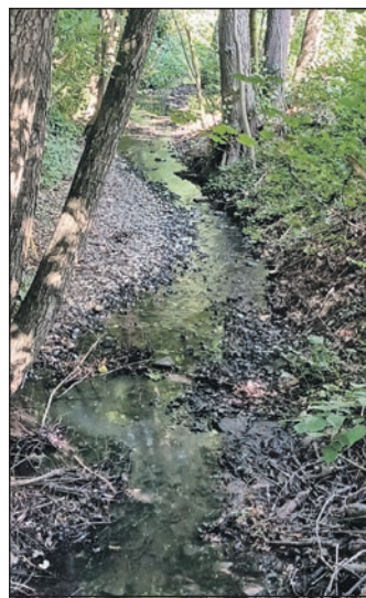
Auch der Waldbach führt im Moment nur wenig Wasser. Entnahmen sind daher seit Anfang der Woche aus Wald-, Sauerborns- und Schwalbach verboten.

Main-Taunus-Kreis (sz). Die anhaltende Trockenheit hat die Wasserstände vieler Bäche in Südhessen auf ein kritisches Niveau sinken lassen. Das Regierungspräsidium Darmstadt weist deshalb darauf hin, dass mehrere Untere Wasserbehörden die Entnahme von Wasser aus oberirdischen Gewässern bereits untersagt haben. Auch im Main-Taunus-Kreis gilt ein solches Verbot. Nach Angaben des Regierungspräsidiums soll die Maßnahme die Bäche schützen, deren Wasserstände und Durchflussmengen aufgrund der anhaltenden Trockenheit stark zurückgegangen sind. Die Behörde appelliert deshalb grundsätzlich, bei Niedrigwasser auf die Entnahme von Wasser aus Bächen, Teichen und Seen zu verzichten. Auch die Besitzerinnen und Besitzer einer so genannten wasserrechtlichen Erlaubnis werden aufgefordert, sparsam mit dem entnommenen Wasser umzugehen.