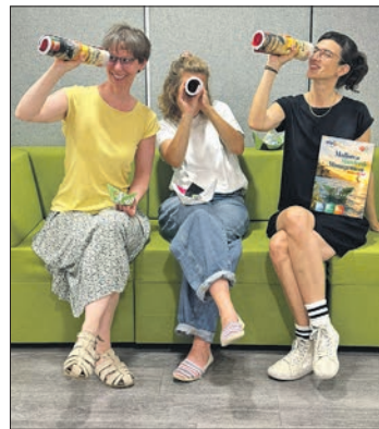
Die Vhs-Mitarbeiterinnen präsentieren das neue Programmheft.

schule ihr Angebot um Bildungsurlaube zu den Themen Führung und systemische Beratung. Hinzu kommen neue Kurse zum Nähen, Stricken und Modezeichnen. Mit dem kostenlosen Treff „Auf ein zweites Frühstück mit...“ soll zudem ein weiteres Begegnungsangebot entstehen. Auch das Gesundheitsprogramm wurde ausgebaut. Neu sind unter anderem Lachyoga-Kurse und -Wanderungen. Im Bereich Ernährung stehen zusätzliche Kochkurse auf dem Programm, darunter erstmals Angebote zur rumänischen und türkischen Küche. Neben den klassischen Sprachkursen in Englisch, Spanisch, Italienisch und Französisch bietet die Volkshochschule auch Unterricht in Japanisch, Niederländisch, Russisch und Türkisch an. Darüber hinaus können Interessierte unter anderem Brasilianisch, Portugiesisch, Kantonesisch und Isländisch lernen.