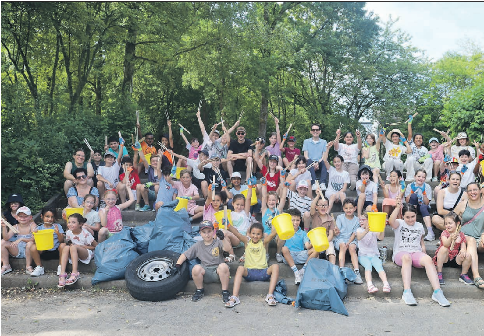
Drei Schulklassen der Georg-Kerschensteiner-Schule beteiligten sich in diesem Jahr am „Sauberen Schulweg“.