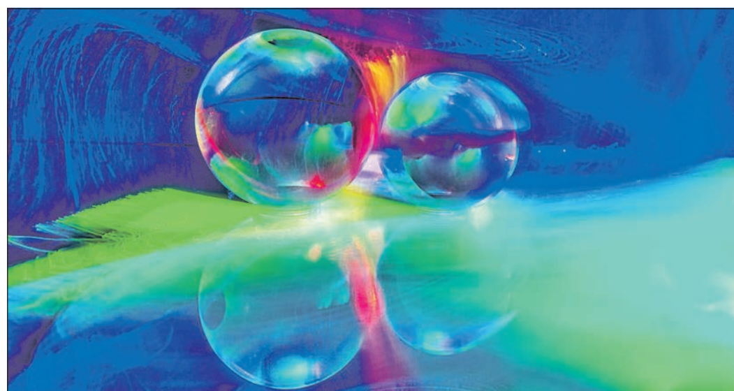
Ungewöhnliche Foto-Motive sind zurzeit in den Schaufenstern auf der Brücke über die Avrillestraße zu sehen.

entwickelten daraus ungewöhnliche Bildideen. Durch den gezielten Einsatz von Licht, Farben und optischen Effekten entstanden Aufnahmen, die zwischen Realität und Illusion wechseln. Die Ausstellung zeigt, wie vielfältig fotografische Gestaltungsmöglichkeiten sein können und dass kreative Motive oft direkt vor der eigenen Haustür entstehen. Gleichzeitig verdeutlichen die Arbeiten, wie spielerisches Experimentieren zu neuen fotografischen Ausdrucksformen führen kann. Der Fotokreis Schwalbach trifft sich jeden Dienstag um 20 Uhr in den Räumen der Evangelischen Limesgemeinde am Ostring. Weitere Informationen gibt es unter fotokreis-schwalbach.de im Internet.