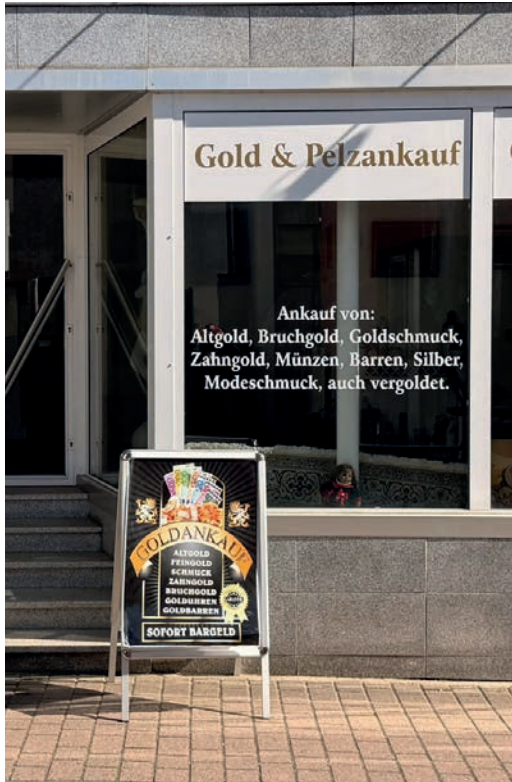
Anders als viele andere Goldankäufer verfügt die „Edelmetalle & Antiquitäten Galerie Schwalbach“ über ein eigenes Ladengeschäft in der Schulstraße in Alt-Schwalbach.

Herr Bengo versucht mit einem eigenen Ladengeschäft Vertrauen zu schaffen. Seit mehreren Jahren ist die „Edelmetalle & Antiquitäten Galerie Schwalbach“ in den ehemaligen Räumen des Reisebüros in Alt-Schwalbach zu finden. Insgesamt sind er und seine Familie seit mehr als 25 Jahren im Ankauf-Geschäft tätig. „Wenn jemand unzufrieden ist, kann er sich jederzeit an uns wenden. Wir sind ja hier vor Ort und verschwinden nicht einfach“, erklärt er. Bei fahrenden Händlern sei das anders. Man sollte immer darauf achten, wie lange ein Anbieter oder Aufkäufer schon im Geschäft ist.