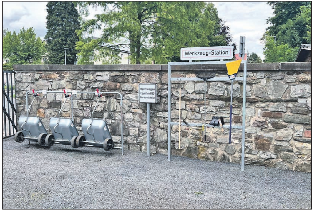
Die neuen Werkzeugstationen