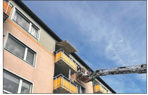
Feuerwehr wird alarmiert und löscht Balkonbrand.

Steinbach (stw). Die offene Sprechstunde des Steinbacher Ortsgerichts am 4. Juni entfällt aufgrund des Feiertags Fronleichnam. Der nächste reguläre Termin findet am 2. Juli statt. Die offene Sprechstunde ohne Terminvereinbarung findet jeweils am ersten Donnerstag eines Monats von 16 bis 18 Uhr im Sitzungszimmer des Rathauses, Gartenstraße 20, statt. Zusätzlich können individuelle Termine vereinbart werden. Ansprechpartner sind Wolfram Klima unter Telefon 06171-700097 sowie Jürgen Euler unter 06171-700098. Bei der Bitte um Rückruf bitte unbedingt eine Telefonnummer angeben.