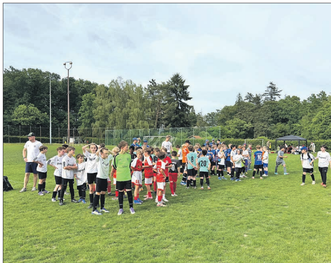
Siegerehrung der Mannschaften von Pfingstsonntag.