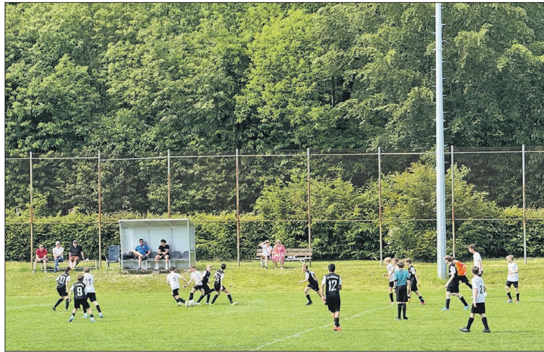
Spielszenen des Turniers