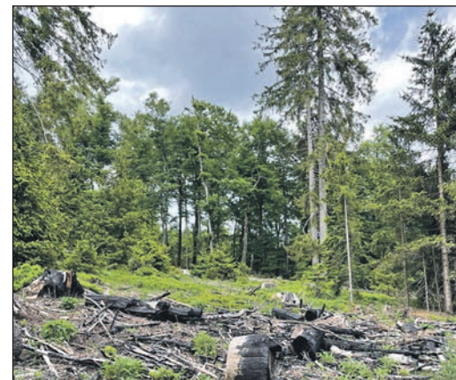
Brandstelle am Feldberg