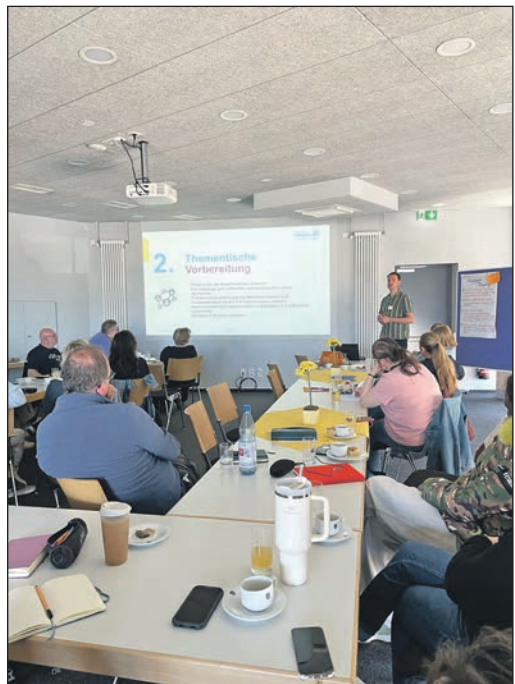
Großes Interesse der 30 Akteure der Gemeinwesenarbeit aus ganz Hessen

Ein besonderer Dank der SPD Steinbach gilt allen Helferinnen und Helfern, die mit großem Einsatz den Auf- und Abbau sowie die Durchführung der Veranstaltung ermöglicht haben.