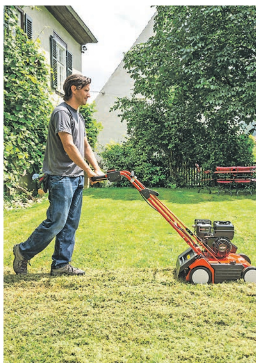
Ein Vertikutieren beseitigt Moos und lässt den Rasen wieder durchatmen.

(DJD). Ob tiefer Schatten oder brennende Sonne: Rasen ist auch an schwierigen Standorten im Garten möglich. In Schattlagen ist Lichtmangel meist die größte Herausforderung, hier dünnt das Gras aus, während Moos dominiert. Deshalb raten etwa die Greenbase-Fachhändler zu speziellem Schattenrasen und einer Schnitthöhe von über fünf Zentimetern, um die Lichtaufnahme zu maximieren. Anders bei sonnigen Südlagen. Diese benötigen trockenheitsresistente Rasenmischungen, die tief wurzeln. Ist der Boden stark verdichtet, kann es helfen, ihn mechanisch zu lockern und etwas Sand einzuarbeiten. Weitere Tipps für die Rasenpflege bietet zum Beispiel das Rasen-ABC unter www.greenbase-shop.de. Dort finden Gartenbesitzer zudem rund 300 Experten bundesweit für eine individuelle Beratung vor Ort.