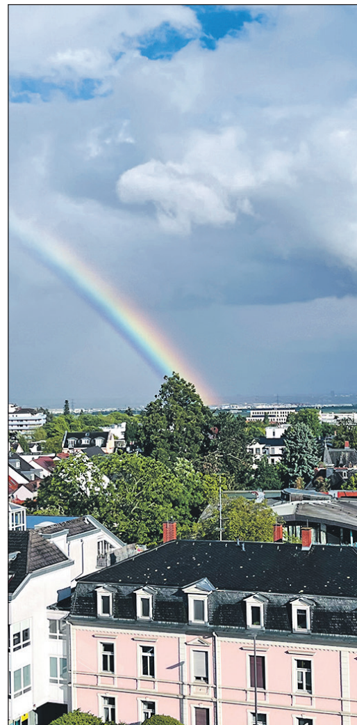
Der Regenbogen über den Dächern der Stadt Oberursel erinnert in diesem Zusammenhang an die Vielfalt der Stadtgesellschaft der Brunnenstadt und die Bedeutung von Respekt, Offenheit und gegenseitiger Wertschätzung.

Der Pride Month geht auf die sogenannten Stonewall-Unruhen zurück, die nach einer