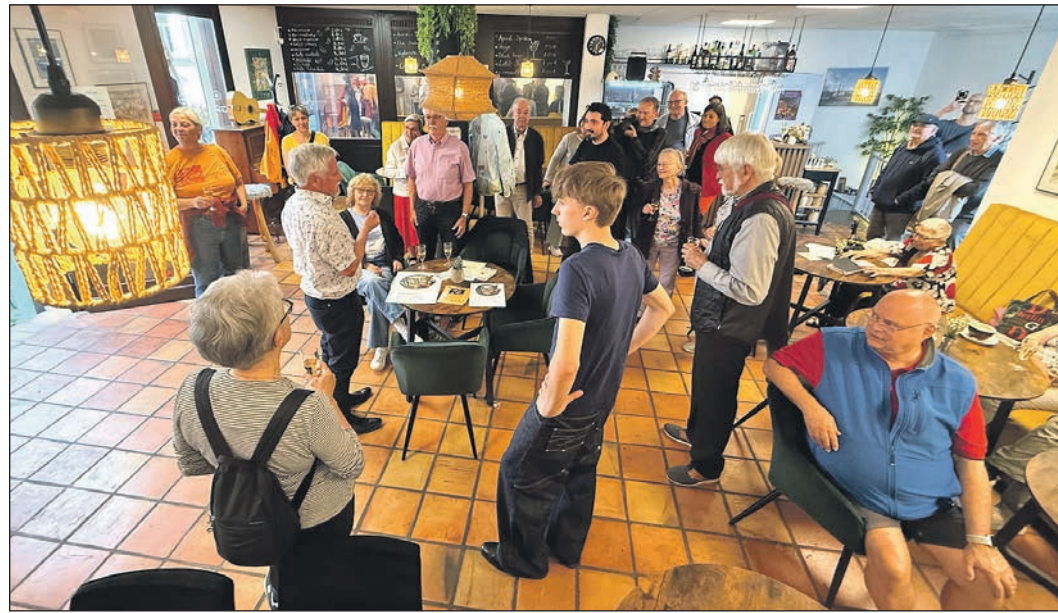
Direkt zu Beginn der Eröffnung zeigte sich großes Interesse an den Bildern des Künstlers Martin Schreck.