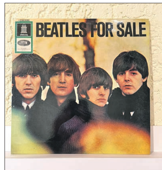
Darf nicht fehlen in der Sammlung: Beatles for sale.

Und noch mit einem Mythos räumt der künftige Geschäftsinhaber auf. Das berühmte Knistern alter Schallplatten? Für viele gehört es zur Kindheit. Zum Klang von früher. Zur Erinnerung. „Häufig sind es schlicht Rückstände oder Verschmutzungen“, erklärt Fink. Deshalb gehört zum Konzept von „Imagine“ sogar ein Schallplatten-Waschservice – nicht nur für alte, sondern auch für neue Vinyls. „Imagine“ versteht sich als Treffpunkt. Als erste Anlaufstelle für Musikliebhaber. Als Ort für Austausch. Für Entdeckungen. Für Menschen, die Musik bewusst hören wollen. Nicht einfach nur Musik verkaufen. Sondern einen Ort schaffen, an dem Menschen wieder bewusster hören. Entdecken. Erinnern. Manche Träume verschwinden nicht. Sie warten. Manchmal Jahre. Manchmal Jahrzehnte. Und manchmal drehen sie sich irgendwann mit 33 Umdrehungen pro Minute doch noch in die richtige Richtung.