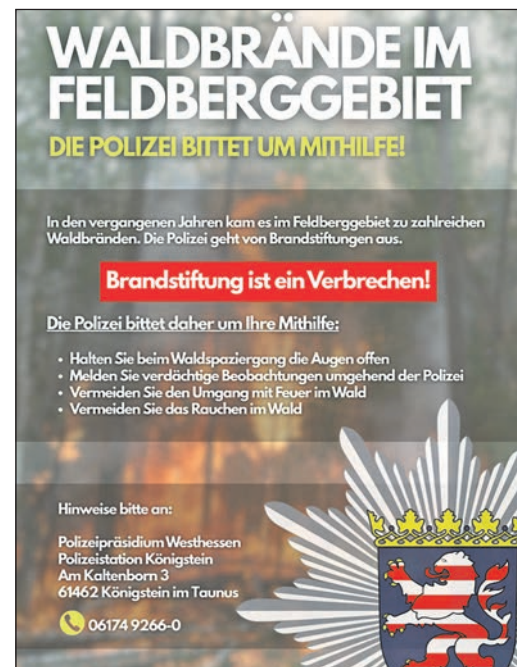
Die neuen Plakate in der Feldbergregion.