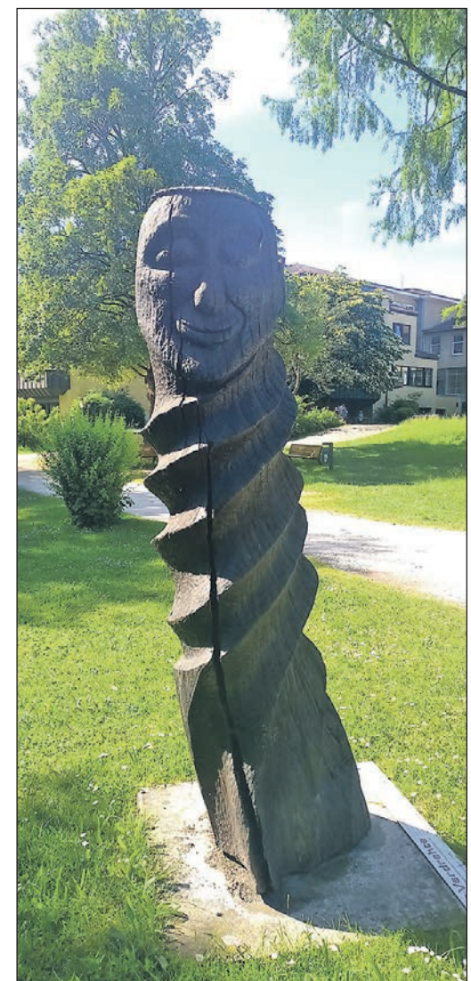
Skulptur der „Täter“, die im Rushmoor-Park ganz in der Nähe der Werkstatt steht.

Für den Kreisausschuss äußerte der Kreisbeigeordnete Thorsten Schorr die Hoffnung, dass Oberursel bei der Suche nach einer Lösung behilflich sei. Der Kreis habe „keine geeigneten eigenen Räumlichkeiten“, die er dem Verein kurz- oder mittelfristig zur Verfügung stellen könne. Laut Bürgermeisterin Runge laufen aktuell bereits Gespräche mit dem Bistum Limburg mit Blick auf eine