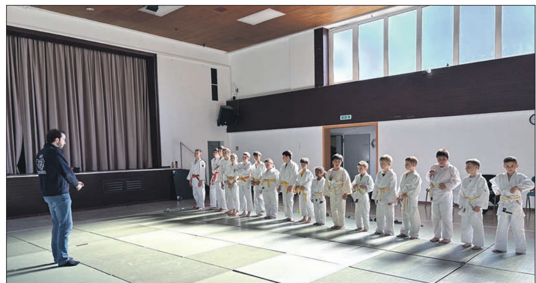
18 Nachwuchs-Judoka der TSG Oberursel bei der Judo-Safari in Oberstedten.

Trainer und Assistenten zeigten sich sehr zufrieden mit dem Ablauf der Veranstaltung und dem Engagement der Kinder. Am Ende konnten alle Teilnehmer stolz ihre Abzeichen entgegennehmen – ein gelungener Judo-Tag, der sicher noch lange in Erinnerung bleibt.