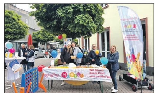
Kindertagespflege Mobilé besuchte die Vorstadt mit einem Stand.

Oberursel (ow). Am vergangenen Samstag, 16. Mai, präsentierte sich die Kindertagespflege Mobilé mit einem Stand in der Oberurseler Vorstadt. Die motivierten Kindertagespflegepersonen informierten vor Ort interessierte Eltern rund um das Thema Kinderbetreuung in kleinen Gruppen mit einer stabilen Bezugsperson. Auch Jugendlichen bot der Stand Rede und Antwort rund um das Thema Babysitten. Die Kindertagespflege Mobilé existiert seit über 20 Jahren und vermittelt professionell ausgebildete Kindertagespflegepersonen sowie Babysitter für das Wohl der zu betreuenden Kinder. Bei Interesse ist eine Kontaktaufnahme möglich per Telefon unter 06171-883322, per E-Mail an info@kindertagespflege-mobile.de . Weitere Informationen im Internet unter www.kindertagespflege-mobile.de .