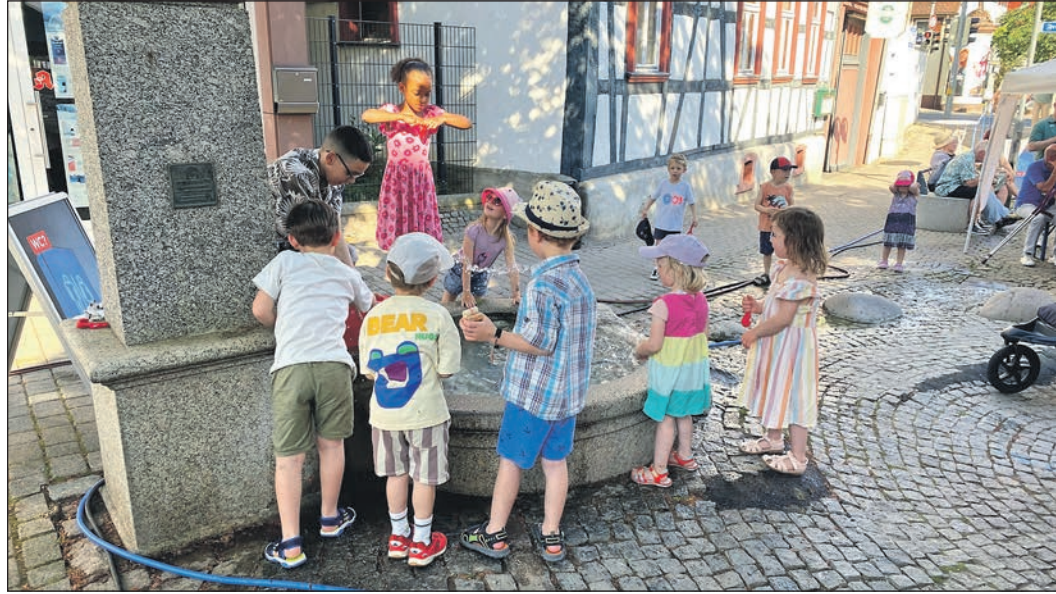
Bei bestem Sommerwetter feiert die SPD Steinbach ihr Sommerfest. Viel Spaß haben auch die Kinder am kühlenden Brunnen.