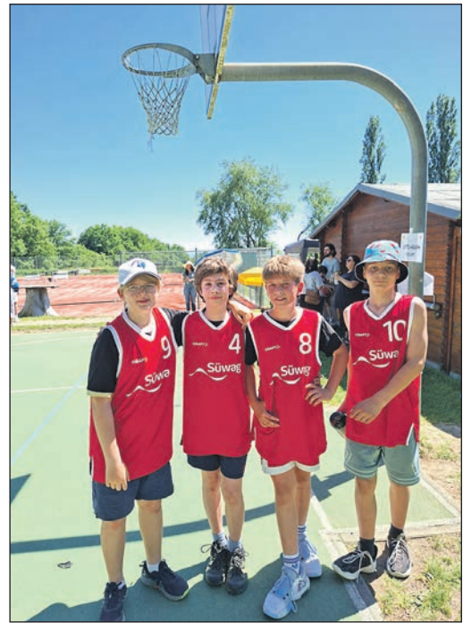
Das erfolgreiche Stierstadt Bulls 3x3 Team beim Lotto Hessen Turnier in Kelkheim.