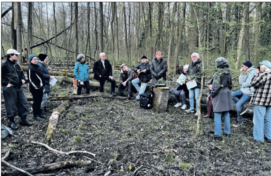
Am Gedenkstein im Eichwald erinnerte sich rund 15 Teilnehmerinnen und Teilnehmer an ein Verbrechen, das dort genau 81 Jahre zuvor verübt worden war.