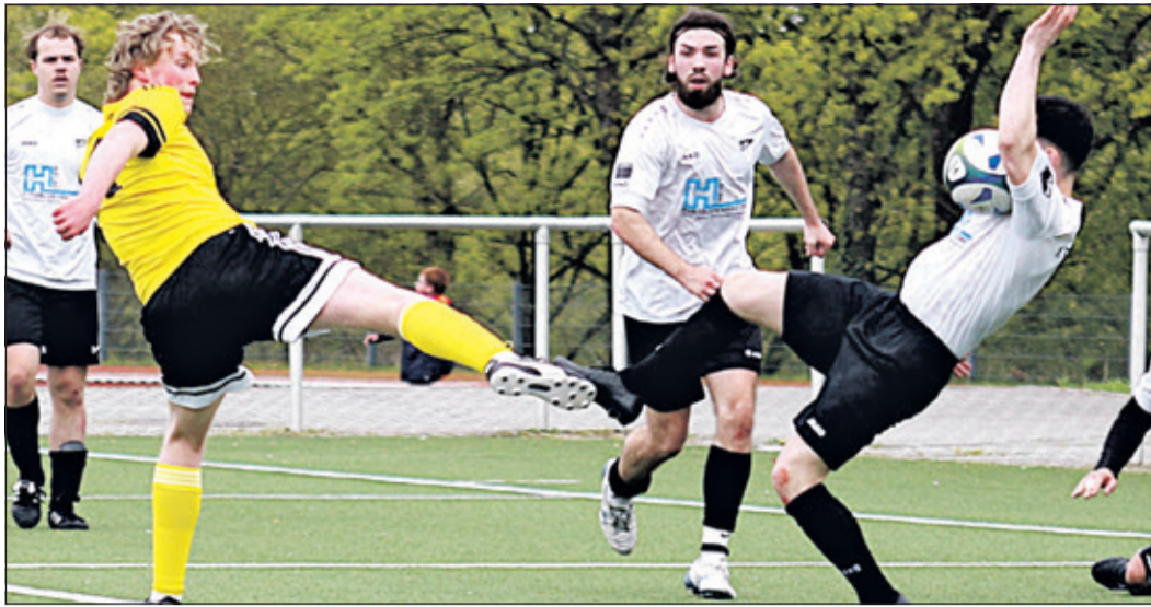
Brust oder Keule? Dieser Körpereinsatz war jedenfalls regelwidrig, ein Elfmeterpfiff und das 1:1 waren die Folge.