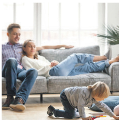
Die Basis für ein behagliches Zuhause: Fließestriche ermöglichen moderne Bodenaufbauten inklusive einer Fußbodenheizung.

Welche Rolle Fließestrich für die Energieeffizienz spielt