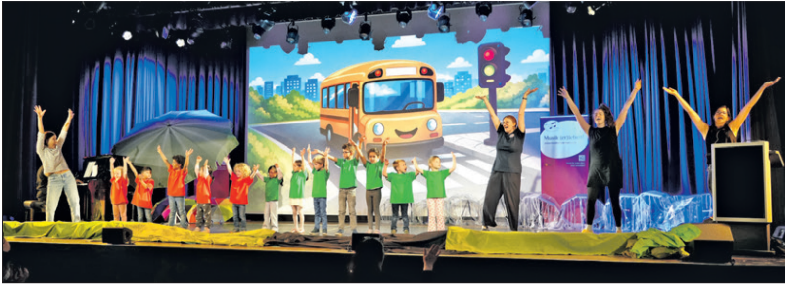
Beim Lied „Die Räder vom Bus drehen sich im Kreis“ forderten Kinder und Musiklehrerinnen das Publikum zum Mitmachen auf und Eltern, Großeltern und Geschwister im Saal machten begeistert mit.