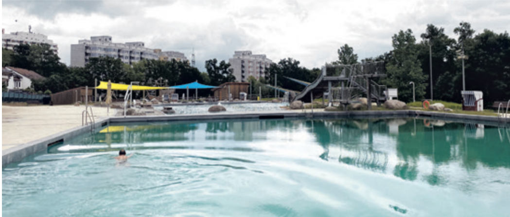
Obwohl das Wasser nur 13,5 Grad hatte, stiegen einige mutig hinein.