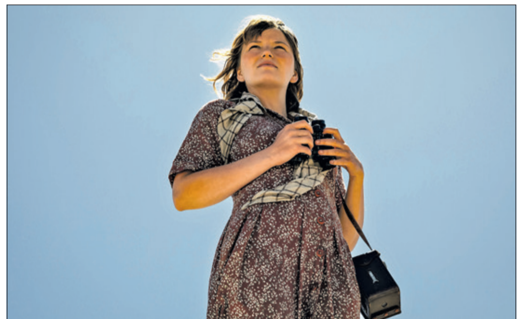
Der Film „Maria Reiche – Das Geheimnis der Nazca-Linien“ befasst sich mit den Forschungen der deutschen Mathematiklehrerin in Peru.