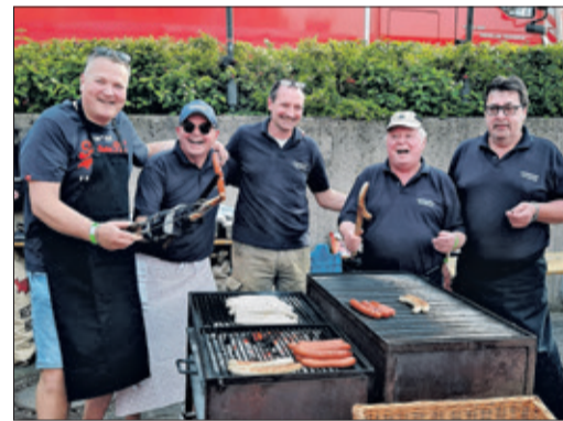
„Brat oder Rind?“ lautete die Standardfrage des Grill-Teams.

christlichem Verständnis absovierten. Die Lieder stimmte das Ensemble „Sol Vivo“ an. Anschließend startete das Familienfest mit Essen und Trinken sowie vielen Aktivitäten für die Kinder. Viele Besucher blieben zum Mittagstisch gleich da, genossen Leckerer vom Grill, die gezapften kühlen Getränke dazu und sparten sich somit den Verpflegungsbesuch am Abend. In vier Schichten kümmerten sich 65 Aktive – auch aus anderen Vereinen – um das Wohl der Festbesucher: am Grill, an der Bar, in der Küche, am Eisstand, hinter der Kuchentheke, als ambulante Service-Teams.