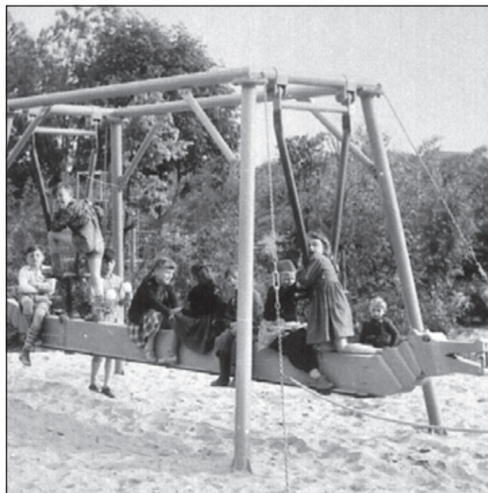
Auch die Krokodilschaukel im Heinrich-Kleber-Park dokumentiert den Wandel der Gemeinde.

Zur interessanten Zeitreise „Die „soziale Aufrüstung des Dorfes“ heißen wir Sie herzlich willkommen. Das Erzählcafé findet am Mittwoch, 03. Juni 2026, um 16:00 Uhr in gewohnter Weise im Schultheißensaal des Bürgerzentrums „Frankfurter Hof“ statt. Die Abendveranstaltung mit demselben Thema folgt als Dämmerchoppen am Dienstag, 23. Juni 2026, um 20:00 Uhr im Gewölbekeller. Eine Gemeinschaftsveranstaltung der Gemeinde Sulzbach (Taunus) und des Geschichtsvereins Reichsdorf Sulzbach 1979 e. V.