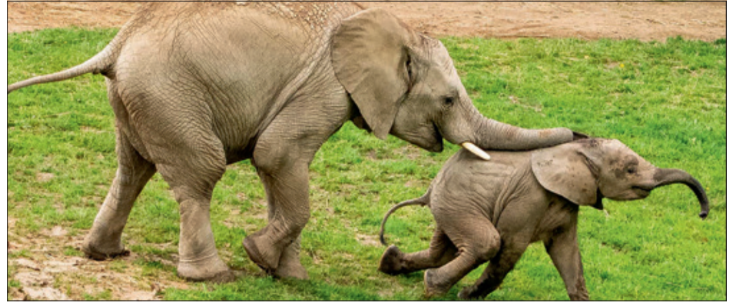
In Neco hat Kaja einen guten Spielkameraden gefunden. Die beiden tollen immer wieder ausgelassen über die Anlage.

Kronberg (sua) – Vor genau einem Jahr sorgte sie für große Begeisterung im Opel-Zoo – nun feiert Elefantenkab „Kaja“ bereits ihren ersten Geburtstag. Am 27. Mai 2025 war das kleine Afrikanische Elefantenmädchen nach 21 Monaten Tragzeit geboren worden. Für den Opel-Zoo war die Geburt etwas ganz Besonderes: Zum ersten Mal seit fast 57 Jahren kam dort wieder ein Elefantenkab zur Welt. Mutter „Kariba“ brachte damals ihr erstes Jungtier zur Welt, Vater ist Elefantenne „Tamo“, der ebenfalls zum ersten Mal Nachwuchs bekam. In den ersten Tagen nach der Geburt brauchten Mutter und Kalb noch etwas Zeit, um sich aneinander zu gewöhnen. Besonders wichtig war dabei die Unterstützung der erfahrenen Elefantenkuh „Lilak“. Die über 50 Jahre alte Elefantendame hatte bereits die Geburt von „Kariba“ erlebt und war nach dem Tod der Mutter eine Art Ersatzmutter für sie geworden. Geduldig half sie nun auch dabei, dass das Säugen problemlos funktionierte. Mit