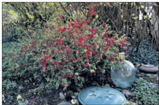
Die wilde Zierquitte blüht feuerrot und liefert schmackhafte Früchte.

kelstein. Sie ist ein kleinwüchsiger, sommergrüner Strauch mit dicht verzweigtem, stacheligem Geäst. Doch ihre Stacheln sind nicht so verletzend wie die Dornen von Rosen. Und dann warte ich nach dem leuchtenden Blüten den ganzen Sommer auf den Herbst, bis sich endlich die Früchte zeigen, erst grün, dann gelb wie eine Zitrone, treffender quitengelb. Sie sind viel kleiner als die Früchte der kultivierten Apfel-oder Birnenquitte, die nur noch selten als Baum in Gärten zu entdecken ist. Doch innen drin ist ein Gehäuse, das weicher ist, sich leichter durchschneiden lässt und in dem unzählige, kleine Kerne versteckt sind, viel mehr als in den dicken, schweren Früchten der bekannteren Baumquitte. Es zögert so mancher, diese zu verarbeiten, weil für das in Stücke zu schneidende Fruchtfleisch oft ein Messer nicht ausreicht, mag es noch so geschärft sein. Ich ziehe die Früchte der Zierquitte vor. Sie sind säuerlicher, intensiver im Geschmack und unterstreichen ihn in besonderer Weise, wenn sie mit süßeren Früchten wie Mirabellen, Pflaumen, Äpfeln, Birnen oder Pfirsichen verbunden werden.“