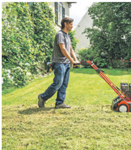
Ein Vertikutieren beseitigt Moos und lässt den Rasen wieder durchatmen.

Was bei Schatten, Trockenheit und verdichteten Böden helfen kann