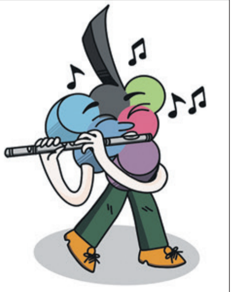
Ein besonderer Auftakt für junge Festivalgäste mit Musik zum Staunen und Mitfiebern: Im Haus der Begegnung erleben Kinder, wie Götter, Helden und Drachen durch Musik lebendig werden.

Weitere Informationen zum Konzert, zum Kinder- und Jugendprogramm sowie zum gesamten Festivalprogramm 2026 gibt es auf der Website des Rheingau Musik Festivals unter www.rm.f.de . Karten sind ebenfalls online erhältlich sowie über die Karten- und Infoline des Festivals unter 06723 / 602170.