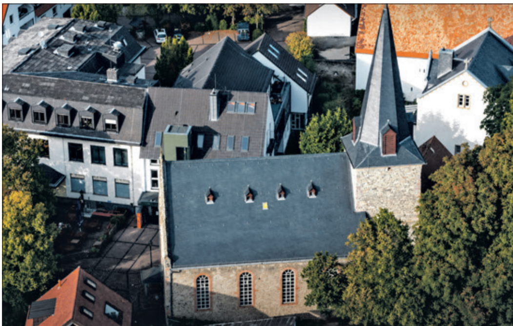
Die meisten Gebäude des Ensembles der Evangelischen Kirchengemeinde am Platz an der Linde erhalten auch in Zukunft Zuschüsse von der Landeskirche.

Hintergrund des „Gebäudebedarfs und Entwicklungsplans“ ist, dass die Landeskirche im Rahmen des Zukunftsprozesses „ekhn2030“ den Gebäudebestand wegen sinkender Gemeindegliederzahlen und damit auch zurückgehender Kirchensteuereinnahmen an den tatsächlichen Bedarf und die wirtschaftlichen Möglichkeiten anpassen will. Allein im Dekanat Kronberg unterhält die evangelische Kirche 142 Gebäude, die zusammen einen Normalherstellungswert von 92 Millionen Euro haben. Die Immobilien haben 7.057 Quadratmeter sakrale Flächen in Kirchen und 5.798 Quadratmeter profane Flächen in den Gemeindehäusern. Die Landeskirche will den Gebäudebestand um 20 bis 25 Prozent reduzieren. 54 Gebäude im Dekanat Kronberg haben daher ein „C“ erhalten, 26 ein „B“. „Ziel ist ein verschlankter Immobilienbestand mit attraktiven Gebäuden, die nachhaltig finanziell und ehrenamtlich personell bewältigt werden können und das evangelische Profil in der Nachbarschaft, der Region und im Dekanat stärken“, schreibt das Dekanat Kronberg in der Pressemitteilung zum Beschluss der Synode.