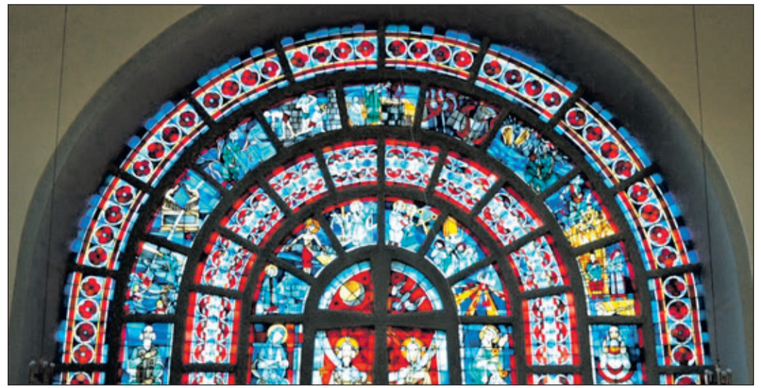
Eindrucksvolle Fenster in der Kirche St. Katharina