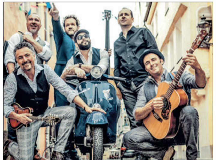
Die Band „I Dolci Signori“ kommt im August wieder zu einem Auftritt in den Heinrich-Kleber-Park.

Lassen Sie sich dieses Open-air-Erlebnis nicht entgehen und kommen Sie zum Italienischen Abend in den Sulzbacher Park! Veranstalter ist der Gemeindevorstand der Gemeinde Sulzbach (Taunus)