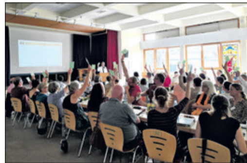
Ende Mai beschloss die Synode des Dekanats Kronberg den „Gebäudebedarfs und Entwicklungsplan“.

Keine Veränderungen wird es bei der Kirche selbst, beim historischen Pfarrhaus und beim Bürotrakt geben, die alle in der Kategorie A eingestuft wurden. Das Pfarrbüro bleibt auf jeden Fall erhalten, soll es