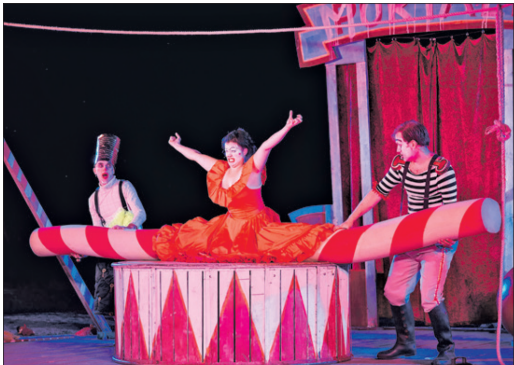
Ein bisschen skurril wird es bei „Spaghetti Mortale“ im August.