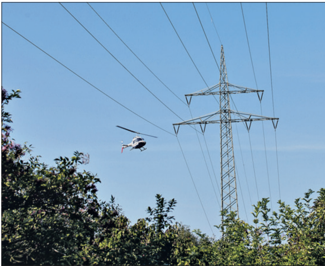
Im Tiefflug schwebt der Kontroll-Hubschrauber an der Hochspannungsleitung entlang. Bis Mitte Juni dauern die ungewöhnlichen Flüge im Main-Taunus-Kreis.