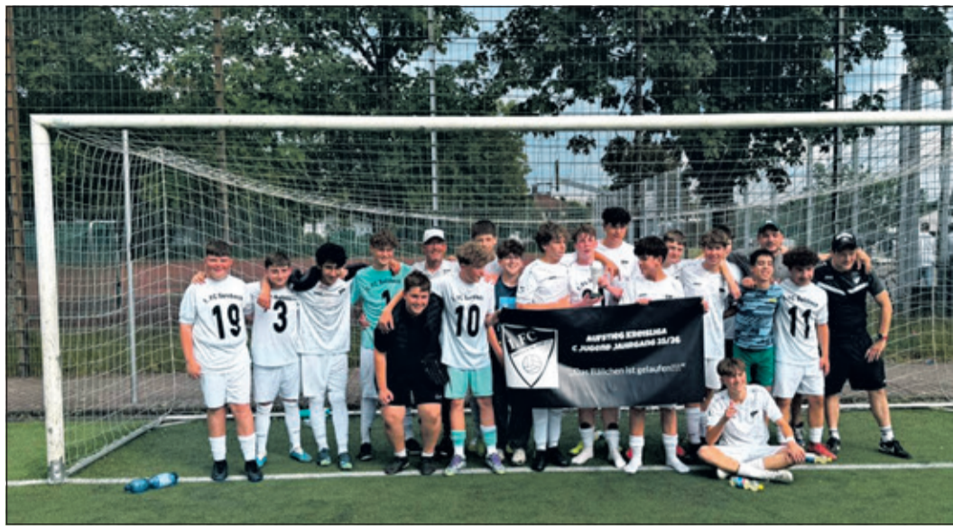
In Unterzahl siegte die C-Jugend des 1. FC Sulzbach gegen ihren Verfolger aus Eschborn und steigt dadurch verdient in die Kreisliga auf.