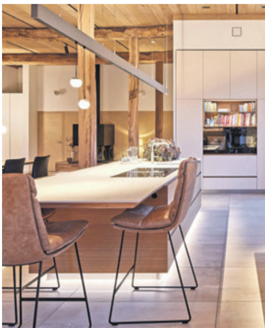
Der Umbau eines Pferdestalls in ein Wohngebäude zeigt, wie viel Charme in historischen Gebäuden stecken kann.

(DJD). Am nachhaltigsten ist oft das Gebäude, das bereits steht. Die Sanierung von Altbauten schont Ressourcen und ist somit sowohl ökologisch als auch finanziell eine gute Entscheidung. Historische Häuser strahlen zudem individuellen Charme aus, erfordern bei der Modernisierung jedoch viel Fachwissen. Beispiel: Empfindliche Fassaden benötigen Materialien wie diffusionsoffene Silikat- und Kalksysteme. Auch im Innenraum steht Nachhaltigkeit im Fokus: Konservierungsmittelfreie und emissionsarme Innenfarben fördern die Wohngesundheit. Um historische Bausubstanz für die Zukunft zu erhalten, ist eine professionelle Unterstützung unverzichtbar. Unter www.brillux.de/zuhause etwa lassen sich kompetente Betriebe für eine fachgerechte Umsetzung und Beratung vor Ort finden.