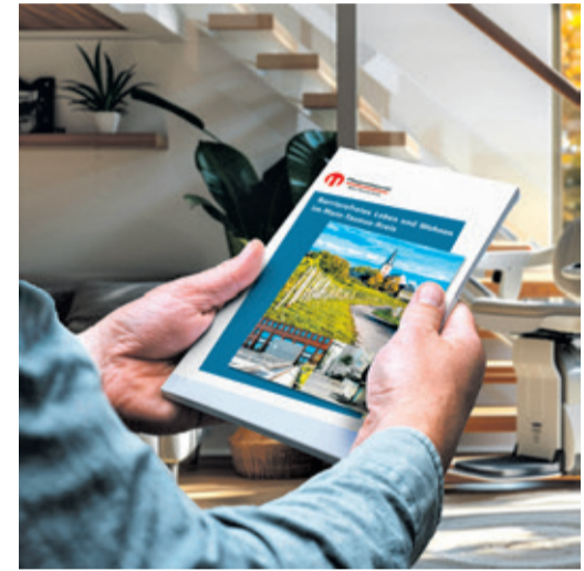
Tipps und Adressen rund um das barrierefreie Wohnen bietet die neuaufgelegte Broschüre des Main-Taunus-Kreises.

per E-Mail an pflugestuetzpunkt@mtk.org möglich. Außerdem steht die Broschüre unter mtk.org im Internet zum Download bereit.