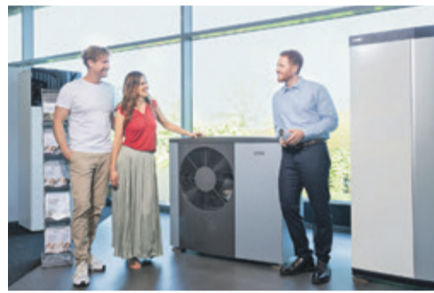
MVV lädt am 13.06. zum Tag der offenen Tür mit buntem Rahmenprogramm, geöffnetem Showroom und Beratungsmöglichkeit ein.

MVV bietet als Energieunternehmen mit über 150 Jahren Erfahrung nachhaltige Energielösungen aus einer Hand – von der Beratung über die Planung bis hin zur Installation durch eigene Fachhandwerker.