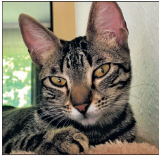
Die Katzen-Geschwister Ondara (links) und Otti sind ein Jahr alt und suchen dauerhaft ein neues Zuhause, in dem sie gemeinsam leben können.