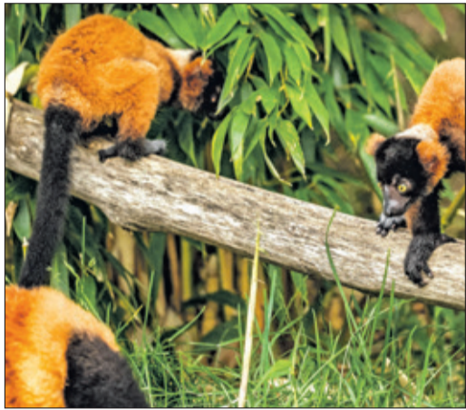
Nachwuchs gab es auch bei den Roten Varis.

Taunus (bs) – Im Opel-Zoo wird in jedem Frühsommer eine besonders beliebte Öffentliche Führung angeboten, nämlich die zu den Jungtieren. Sie findet in diesem Jahr am Samstag, dem 13. Juni um 15 Uhr statt. Und Jungtiere gibt es auch in diesem Jahr reichlich: Nicht nur die inzwischen einjährige „Kaja“, das Kalb bei den Afrikanischen Elefanten, die beiden Trampeltier-Jungtiere „Chuck“ und „Victoria“ oder auch die junge Netzgiraffe „Mumbi“ begeistern die Zoobesucher. Auch in zahlreichen weiteren Anlagen gibt es Nachwuchs zu entdecken.