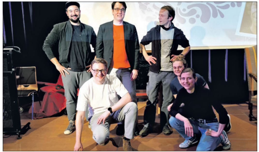
„Frank(l)y Science-Slam“ verbindet am Samstag im „Eschborn K“ wieder trockene Wissenschaft und lustige Unterhaltung.

Gesetzlicher Risikohinweis: Der Erwerb dieser Wertpapiere ist mit erheblichen Risiken verbunden und kann zum vollständigen Verlust des eingesetzten Vermögens führen.