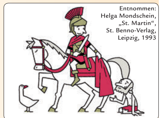
Entnommen: Helga Mondschein, „St. Martin“, St. Benno-Verlag, Leipzig, 1993

Auch in diesem Jahr wird die Pfarrei St. Ursula ein Erzählzelt zum Martinsmarkt am Samstag, 9., und Sonntag, 10. November, in der Vorstadt aufbauen. In gemütlicher Atmosphäre wird hier die Geschichte vom Heiligen Martin erzählt. Wie kam es dazu, dass er seinen Mantel geteilt hat, warum wurde er heilig gesprochen...all dies wird erklärt, und es wird gemeinsam gesungen. Natürlich teilen alle im Zelt symbolisch für den Mantel leckere Martinswecken miteinander und lassen sich diese