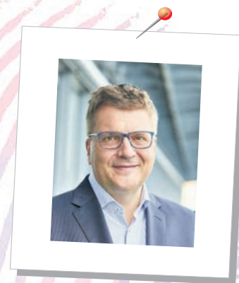
Ihr Ulrich Krebs Landrat

Der Ausbildungstag zeigt eindrucksvoll die Stärke unserer Region im Taunus: ein vielfältiges Wirtschaftsleben, das zahlreiche Möglichkeiten bietet, in einem Umfeld von höchster Lebensqualität. Nutzen Sie die vielfältigen Angebote – ich wünsche Ihnen, dass Sie viele Anregungen für die Gestaltung Ihrer beruflichen Zukunft mitnehmen können!