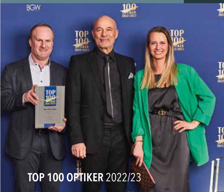
TOP 100 OPTIKER 2022/23

Als Dankeschön für Ihre Treue haben wir eine exklusive Aktion für Sie vorbereitet: