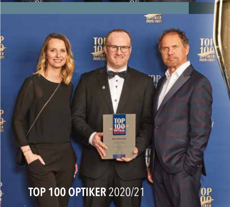
TOP 100 OPTIKER 2020/21