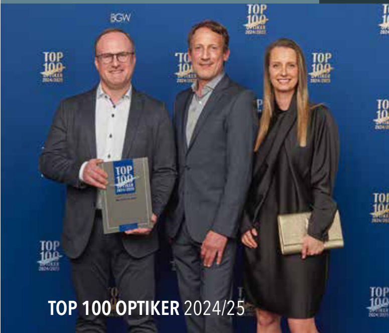
TOP 100 OPTIKER 2024/25