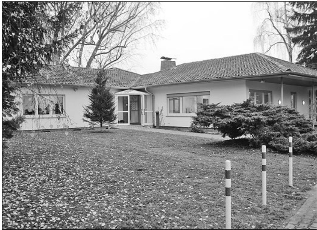
Das Vereinshaus Dornholzhausen in der Saalburgstraße 158 wurde komplett renoviert und umgebaut.