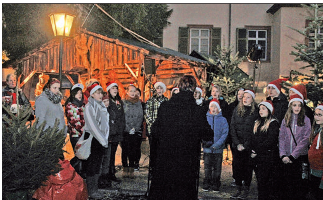
Der Kinderchor aus Greiz eröffnet traditionell an der Krippe mit Weihnachtsliedern den Bad Homburger Weihnachtsmarkt.