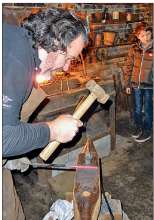
Auf dem alten Amboss schlägt der Meister einen Stahlstab zum Vierkant.

Für den Stadtteil Ober-Eschbach mit seinen reichen historischen Orten und Schätzen ist die Wiederinbetriebnahme der alten Hufschmiede eine große Bereicherung. Und so feierten zahlreiche Ober-Eschbacher bei Schmalzbraten und heißen Getränken im kerzengeschmückten dämmrigen Hof der Familie Fischer/Velte das Ereignis und sorgten mit dem Kauf von handgefertigten Weihnachtskarten, Plätzchen und Marmelade auch noch dafür, dass mit dem Verkaufserlös die Flutopfer Südasiens unterstützt werden können. Die alte Schmiede soll zu besonderen Gelegenheiten immer mal wieder geöffnet sein.