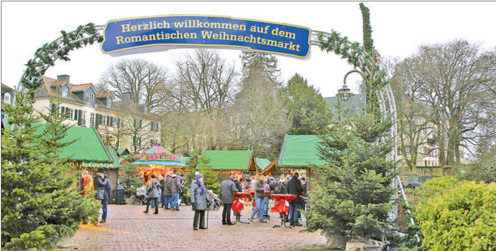
Seit diesem Jahr werden die Besucher des Romantischen Weihnachtsmarkts am Schloss mit diesem Schild begrüßt.