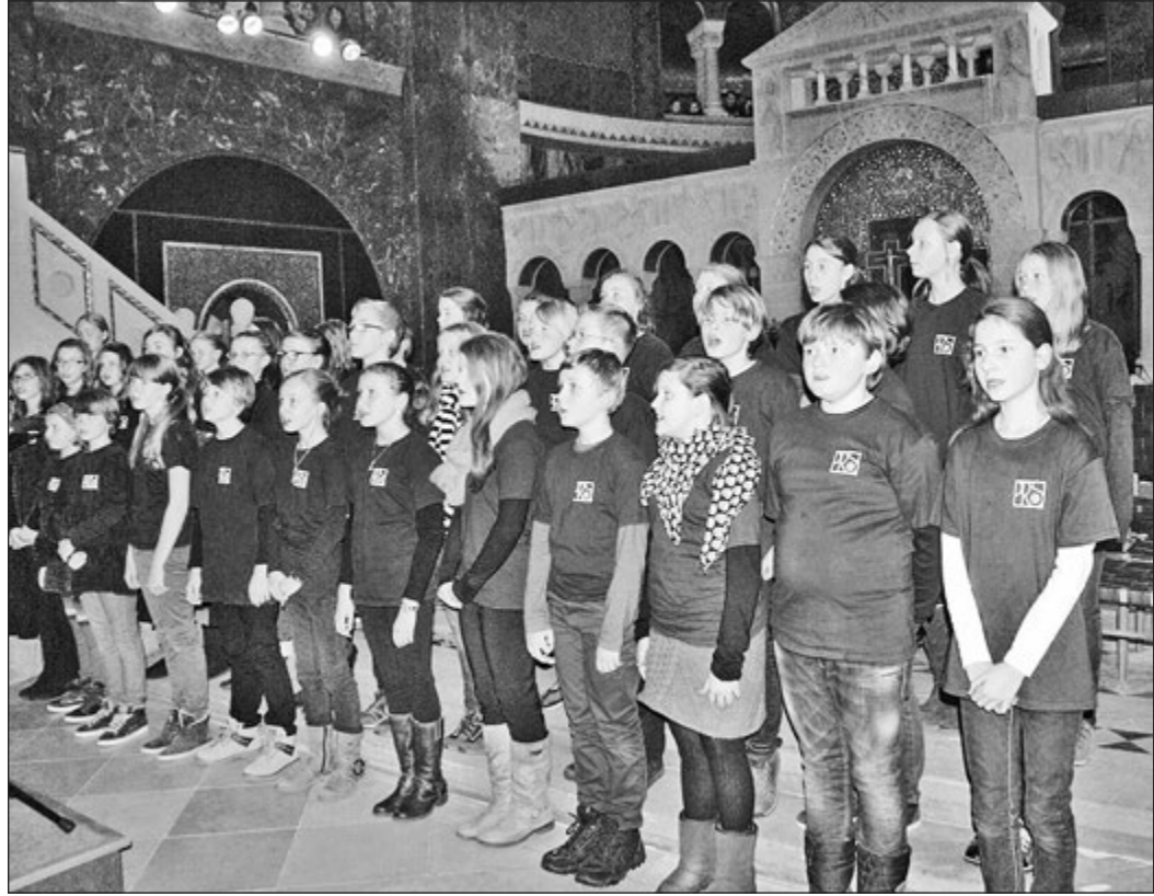
Die Singklasse 6 der Friedrichsdorfer Philipp-Reis-Schule eröffnete das weihnachtliche Konzert der Hochtaunus-Schulen in der Bad Homburger Erlöserkirche.