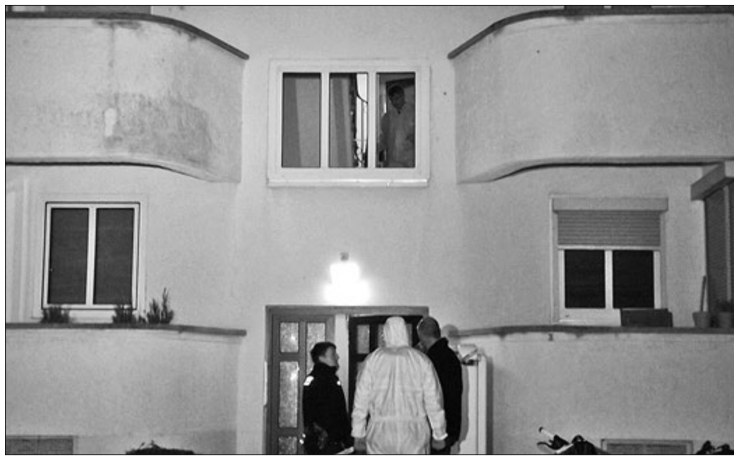
Polizeibeamte und Kriminaltechniker vor dem Haus in der Brandenburger Straße ließen erah- nen, dass sich hinter diesen Mauern etwas Furchtbares zugetragen hat.

Die Mutter kam am Wochenende sogar in die Wohnung, um Sachen zu holen. Als sie nach der Tochter fragte, erhielt sie vom Vater die Auskunft, sie halte sich bei Bekannten auf. Erst am Montag wurde sie misstrauisch und ging zur Polizei, um ihre Tochter als vermisst zu melden. Zugleich informierte sie Angehö- rige über das Verschwinden des Mädchens, die wiederum eine Suchaktion starteten. Auch das Jugendamt schaltete sich ein und erkundigte sich beim Vater nach dem Mädchen. Darauf- hin verschwand er spurlos. Auf ihrer Suche machten die Verwandten im Keller des Mehr- familienhauses, in dem sich die Wohnung des Vaters befindet, die schreckliche Entdeckung. Sie fanden die 16-Jährige tot in einem Ver- schlag unter Kartons versteckt.