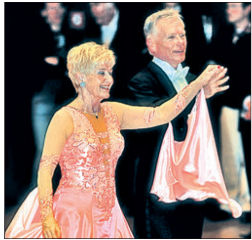
Das Ehepaar Kießling vertritt den veranstaltenden Tanzsportclub Schwarz-Weiß.