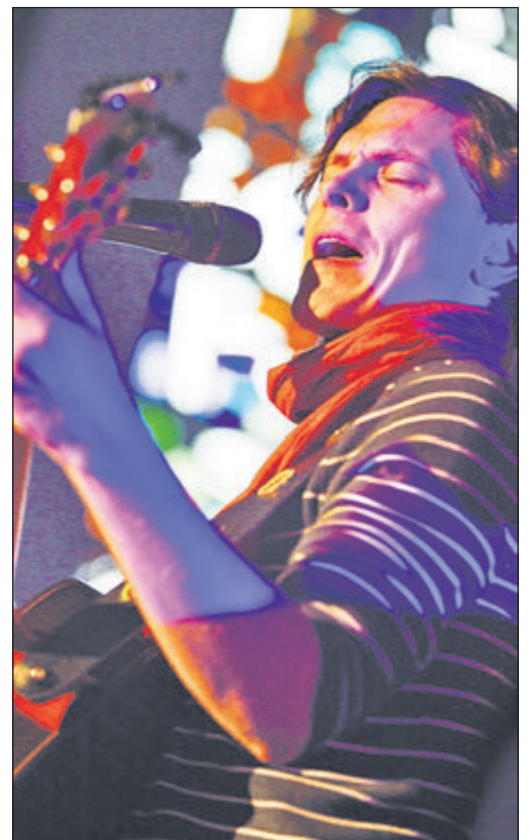
Paddy Kelly begeisterte seine Fans im Bad Homburger Kurtheater.

Im Vordergrund der Show standen jedoch die leisen Töne. Kellys Zeit im Kloster hat ihn auch musikalisch stark geprägt. Der Glaube spielte eine große Rolle in der Show. In einer Zeit, in der Kirche für viele ein Ort ist, den man höchstens zu Weihnachten besucht, nahm er die Zuhörer in eine kurze Zeit der Stille mit, begeisterte sie für Mönchsgesänge und verabschiedete alle am Ende mit einem kräftigen und freudigen: „God bless you!“