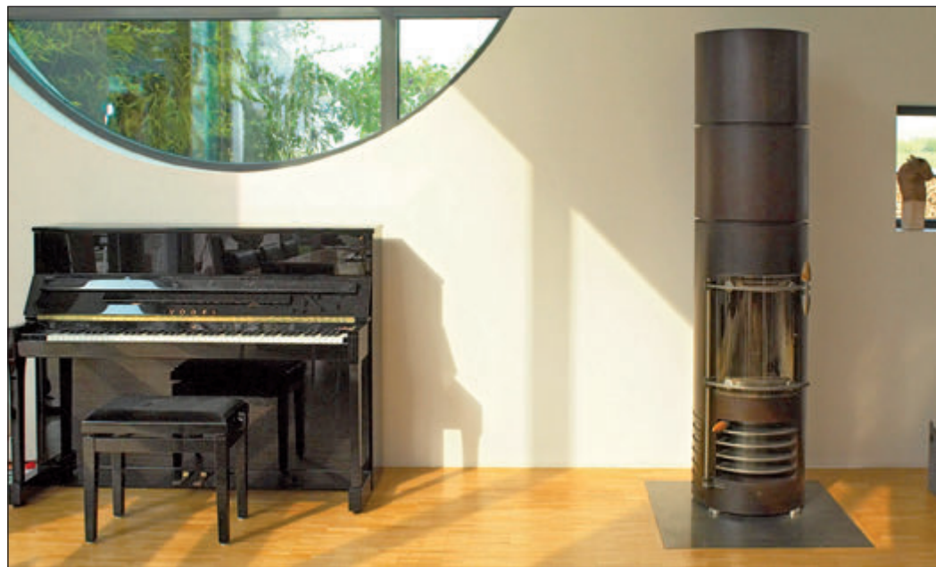
Wenn zur kühleren Jahreszeit der Kamin wieder angefeuert wird, hilft „Rotkalk“ an der Wand gegen schlechte Gerüche.

Wandputze mit hohem Mineralanteil verhelfen zu einem guten Raumklima