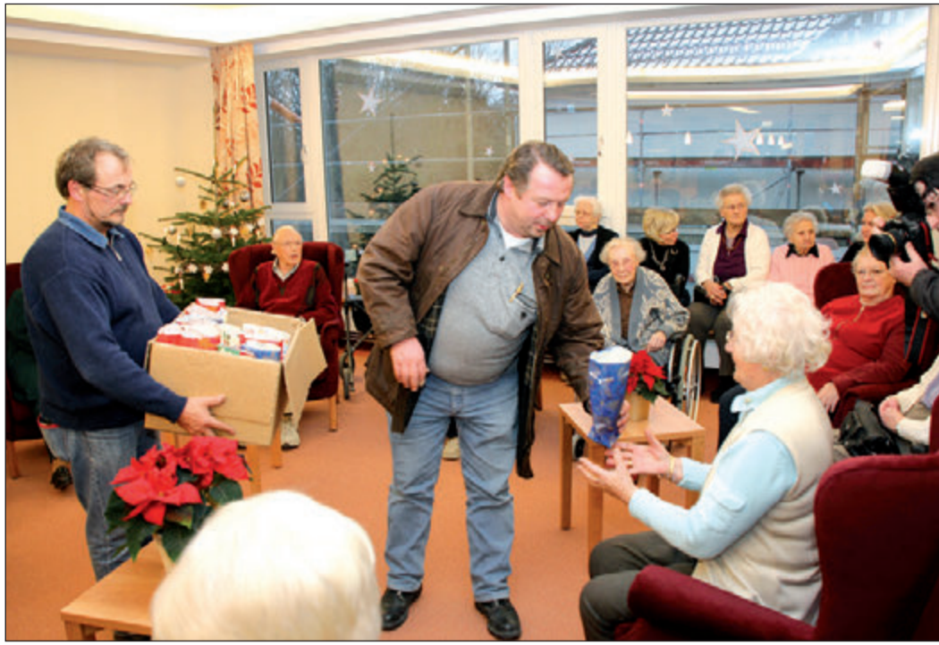
Im neuen Gemeinschafts-Wohnzimmer gab es für die Bewohner von den Vertretern der am Bau beteiligten Firmen Weihnachtsgeschenke.