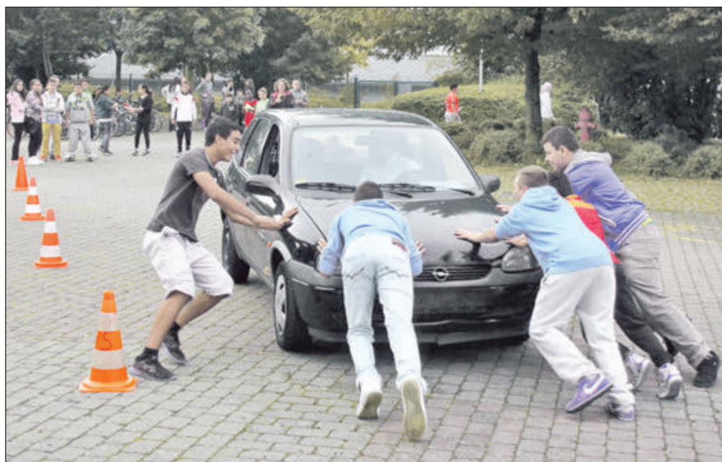
Allein geht es auch, doch im Team geht es besser: Den EKS-Schülern machte es viel Spaß, ein Auto über den Schulhof zu schieben.