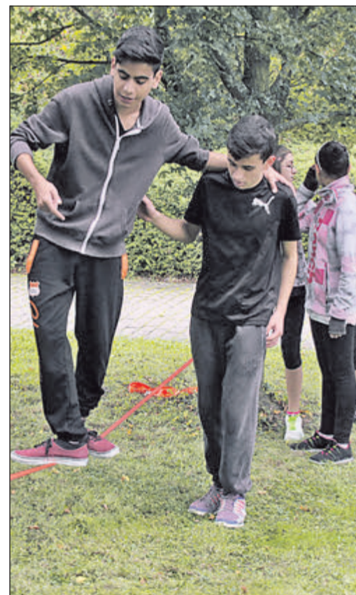
Um die Slackline zu bewältigen, war man auf die Hilfe eines Klassenkameraden angewiesen.

Neben den neun Teamstationen gab es auch allgemeine Bewegungsangebote wie ein Auto schieben, Frisbeegolf, Crossboccia, eine Slackline oder einen Fühlparcours. Einige Oberurseler Vereine haben sich dabei präsentiert und Schüler, die Lust bekommen haben, mal eine andere Sportart auszuüben, hatten die Gelegenheit, sich zu informieren oder sich gleich anzumelden.