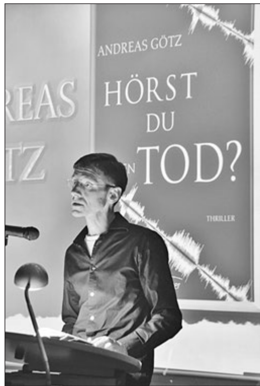
„Hörst Du den Tod?“ ist ein packender Jugendthriller, der bis auf die letzte Sekunde fesselt.