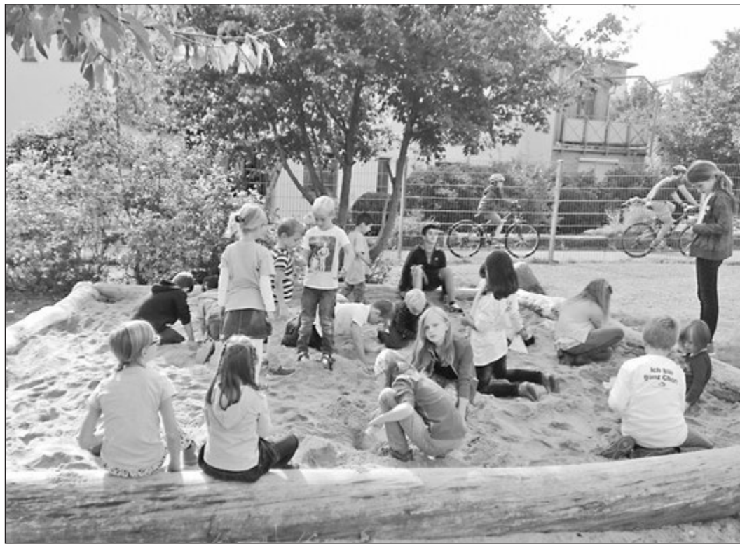
Im großen Sandkasten waren „Edelsteine“ in allen Farben versteckt.