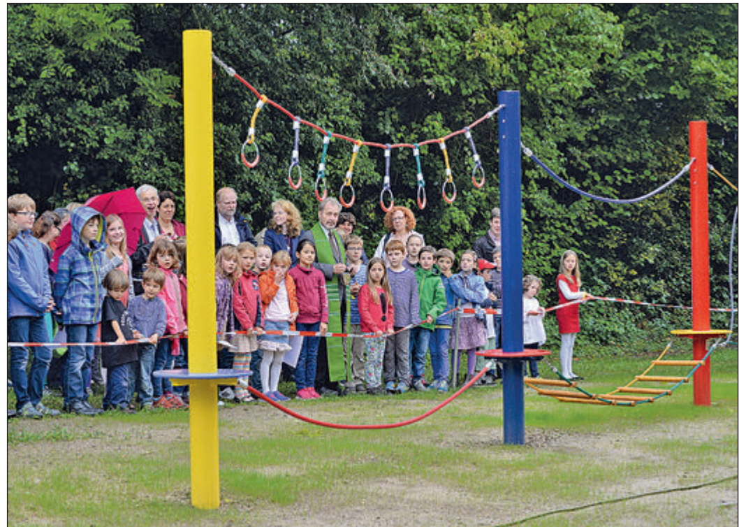
Gespannt warteten Kinder wie Erwachsene vor der Absperrung, bevor das neue Klettergerüst feierlich eingeweiht wurde.

Oberursel (ow). Mit einem Waldgottesdienst der Adventgemeinde Oberursel startete die Aktion „Kinder helfen Kindern!“ der Hilfsorganisation ADRA Deutschland. 40 000 Kinderpäckchen im letzten Jahr und über 471 000 Pakete seit 1999 verdeutlichen das große Engagement. Die Aktion hat das Ziel, besonders Kinder in Deutschland in ihrer sozialen Kompetenz zu stärken. Sie lernen Not zu sehen, Mitgefühl zu entwickeln und verantwortlich zu handeln, indem sie teilen. Gleichzeitig erleben sie die Freude und Dankbarkeit der Kinder, die ihre Pakete bekommen haben. Bis Mitte November können Pakete gepackt werden, dann werden diese auf Lastwagen verladen und erreichen bedürftige Kinder in Mazedonien und Montenegro in der Adventszeit kurz vor Weihnachten. Nähere Informationen gibt es bei der Adventgemeinde Oberursel, Schulstraße 38, Marina Monti, Tel. 06172-859600, und im Internet unter www.kinder-helfen-kindern.org .