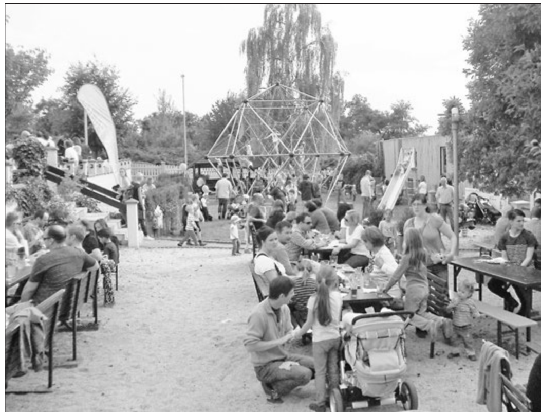
Während Eltern die Sitzbänke mit Wein oder Äpfel in Beschlag nahmen, suchten die Kinder ihr Vergnügen lieber auf dem Abenteuerspielplatz.