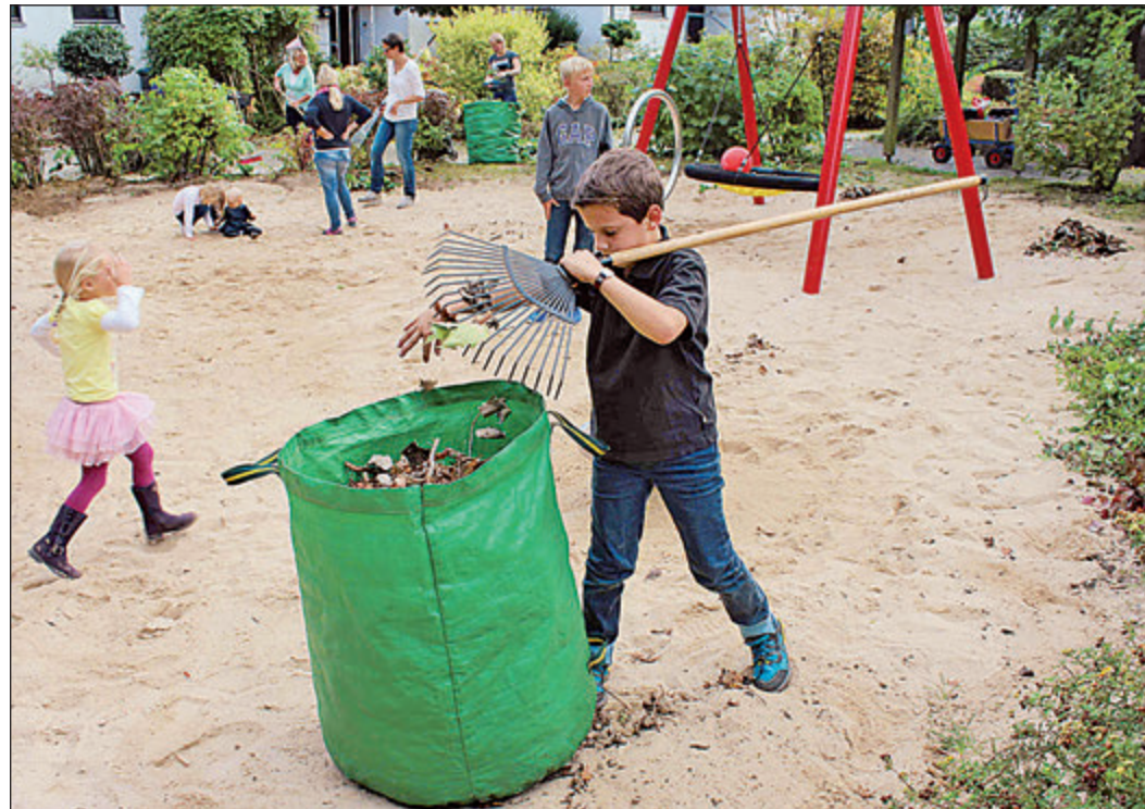
Eltern und Kinder führten eine Reinigungsaktion auf dem Spielplatz Hasengarten durch.