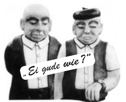
„Schaa & Schambes“ sind im Aumühlenhof der Aumühlenresidenz zu Hause.