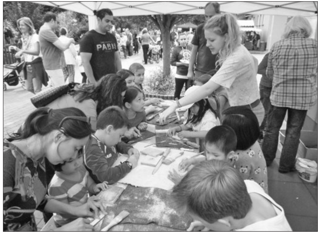
Am Stand des Kunsttäter-Vereins durften die Kinder Specksteine schleifen.