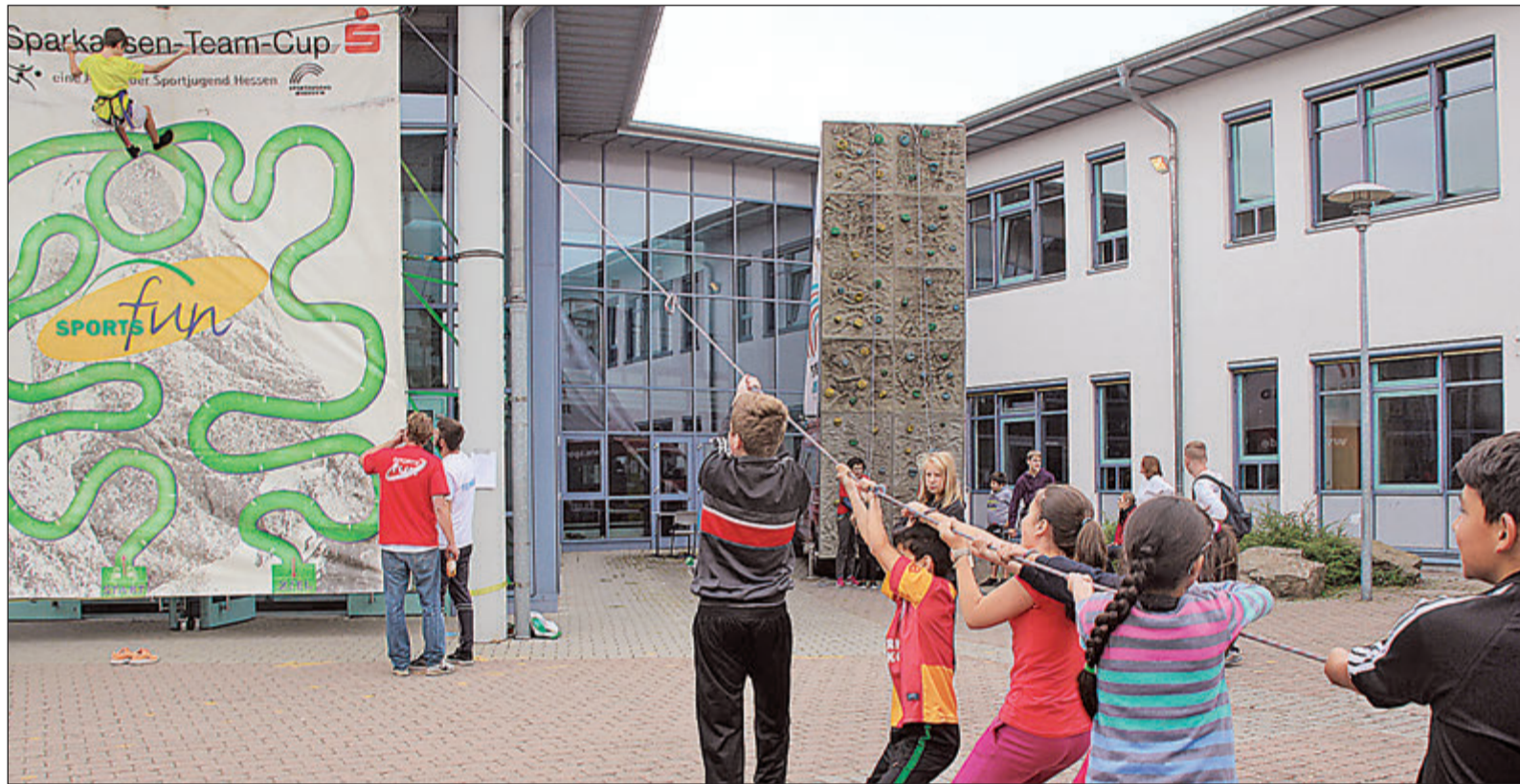
Es war gar nicht einfach, den Klassenkameraden an der Seilbrücke entlang des Parcours zu dirigieren.