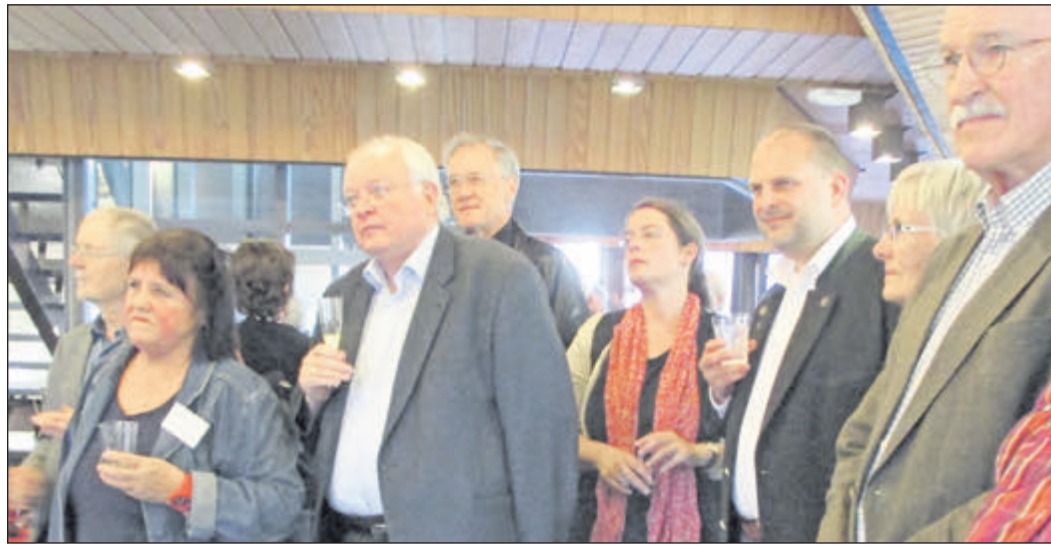
Die Galerie der Bücherei war bei der Vernissage mit vielen Besuchern gefüllt.