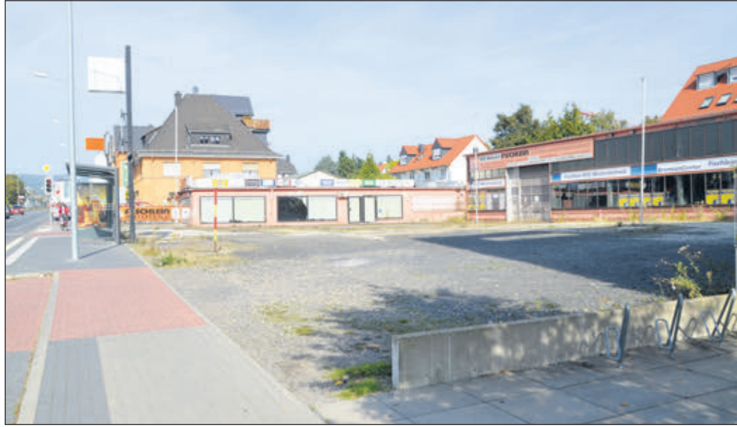
Das Fischlein-Gelände ist bis auf Weiteres das letzte ehemalige Gewerbegrundstück in der Hohemarkstraße, auf dem Wohnbebauung errichtet werden soll.