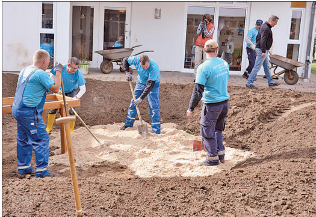
Das Stadtwerke-Team war am „Social Day“ mit viel Spaß bei der Arbeit.