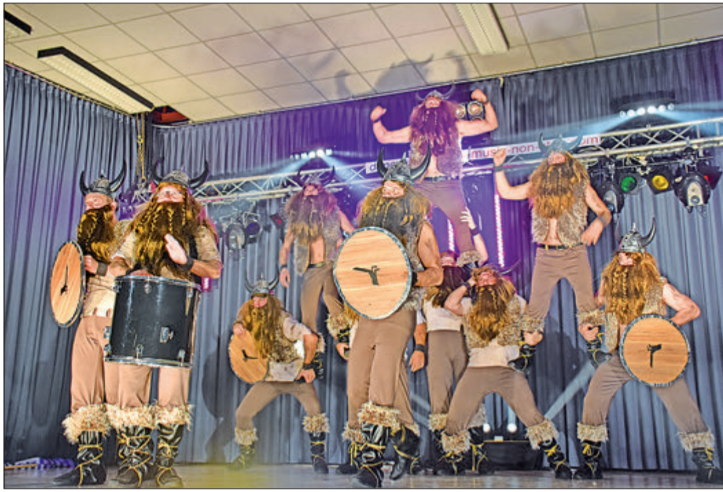
Nicht unbedingt Leichtigkeit und Grazie, sondern Kraft und Power versprühten die Bachstelzen und holten damit in Pfaffenwiesbach den Siegerpokal.