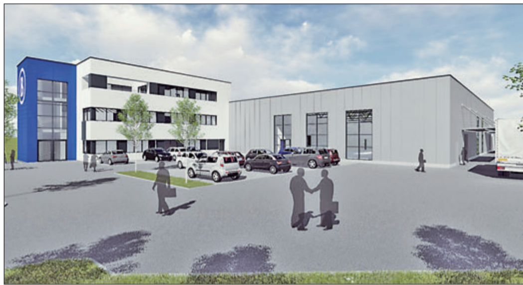
So soll der Neubau der Bollin-Armaturenfabrik, für den die Bauarbeiten Mitte dieses Jahres beginnen werden, aussehen.

Die ersten Flächen wurden von den Oberurseler Unternehmen Messko und Maier Gasstechnik bebaut. Spätestens seit Porsche und Audi hier ihre regionalen Handelszentren angesiedelt haben, zählt der Standort zu einer der bekanntesten Adressen für hochkarätige Unternehmen aus der Region. 2014 eröffnete im Eingangsbereich an der Homburger Landstraße das Gartencenter „Pflanzen-Mauk Gartenwelt“. Darüber hinaus hat das Unternehmen Wepler Filter An den Drei Hasen einen zusätzlichen Standort gebaut. Und auch die Tian Cheng China GmbH hat ein Grundstück gekauft und will ein Europäisches Design- und Vertriebszentrum für Badmoden errichten. Entlang der Karl-Hermann-Flach-Straße wurden zuletzt drei Grundstücke an Unternehmen verkauft, die in unterschiedlichen Bereichen tätig sind: KW Aufzugstechnik, EUKO Group und ESM Erodiersysteme Müller.