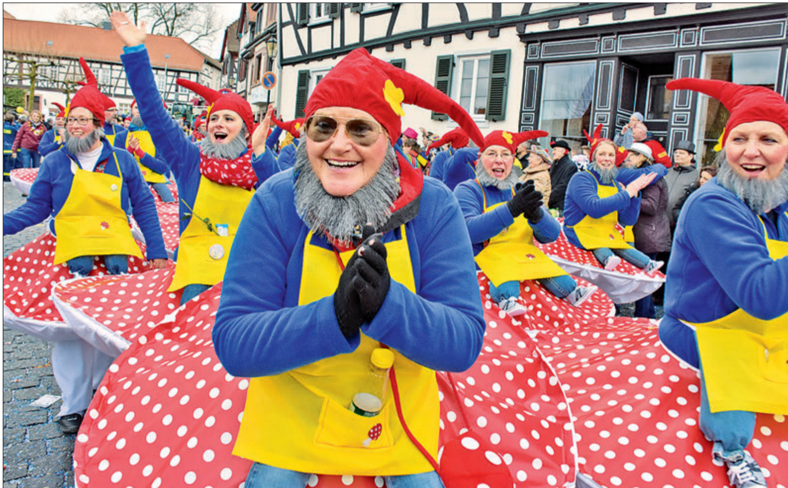
Von wegen ein Giftzwerg! Der BCV hat sein Motto „In jedem noch so tolle Verein kann auch mal ein Giftzwerg sein“ um ein Vielfaches übertroufen und mit seiner exzellenten Präsentation den ersten Preis unter den Fußgruppen abgeräumt.