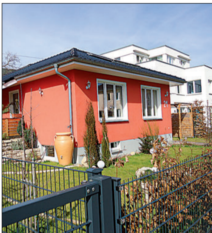
Ips/Cb. Fertighaus mit individueller Planung

Ips/Cb. Als Fertighaus gilt ein Haus, das mindestens in Teilen werkseitig vorgefertigt an die Baustelle geliefert und dort endmontiert wird. Fertighäuser haben einige Vorteile gegenüber einem in konventioneller Bauweise errichteten Haus. Dazu zählen die kurze Bauzeit, weniger Probleme wegen der Feuchte im neuen Haus, Angebote zu Festpreisen, Musterhäuser zur Ansicht, Planungssicherheit beim Erwerb eines schlüsselfertigen Typenhauses.