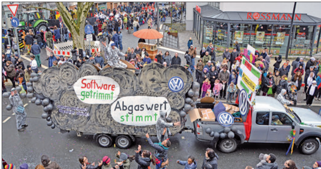
Das Stinkefahrzeug der Marke VW, mit dem der Verein Kunstgriff unterwegs war, amüsierte die Zuschauer und war der Jury die Verleihung des „Ohlenspiegels“ wert.

Den Ehrenpreis des Landrats bekam der Komitee Wagen der Carneval Freunde Usinger Land (Nr. 107) „Wirf die Gläser an die Wand, elf Jahre außer Rand und Band“, den Ehrenpreis der Frankfurter Volksbank gab es für die Hochtaunusschule. Sie überzeugten mit Motivwagen und Fußgruppe „Wissen macht sexy“ (Nr. 67 und 68) gleichermaßen. Den Wanderpokal Rushmoor-Oberursel erhielten die Fußball-Kids vom SV Bommersheim (Nr. 108) für ihre Fußball-Idol-Fußgruppe „Wer ein Idol will sein, der spielt zuerst in Bommersheim“. Der „Ohlenspiegel“, ging an die Fußgruppe des Vereins Kunstgriff (Nr. 54), die Ex-Prinzen vergaben ihren Sonderpreis an die Garde des Club Humor aus Bad Homburg (Nr. 84). Das Kipri-Paar wählte für seinen Pokal die Nr. 123 aus, unter der die Fußgruppe der Kita am Park mit ihrem „We are the world“-Motiv unterwegs war und den Pokal des SV Stierstadt für die beste Garde sicherte sich die Tanzgarde Rodheim (Nr. 63). Die Preisverleihung findet am 19. März beim „Schwanen-Heinzi“ statt.