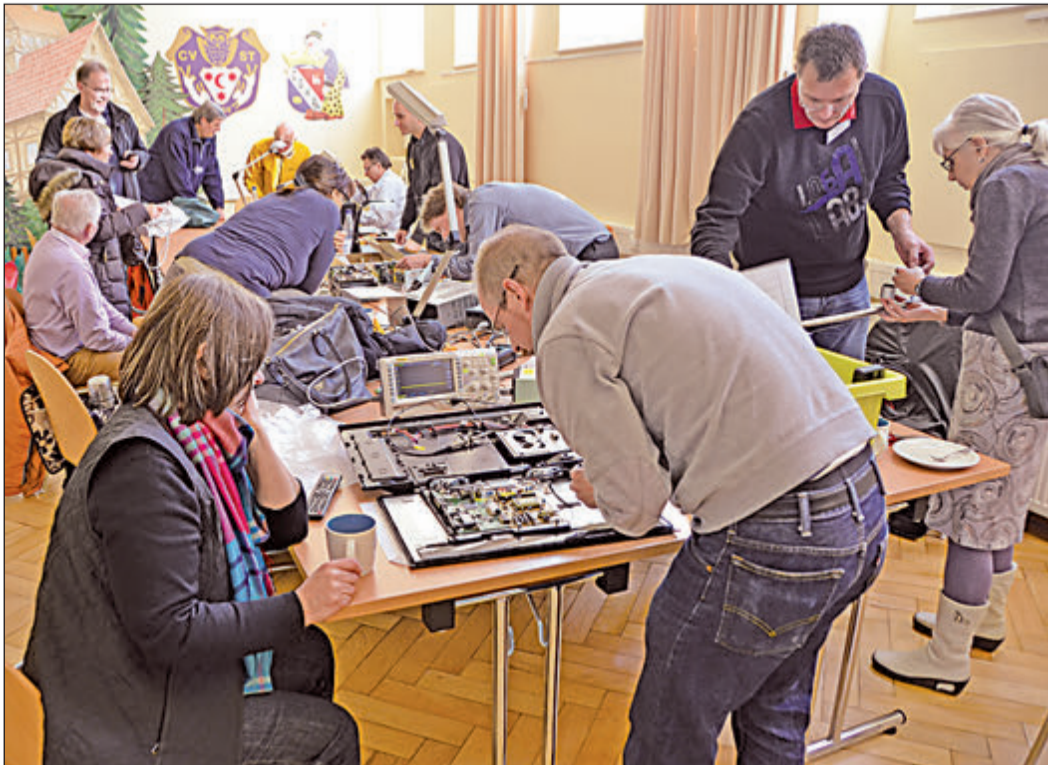
Gemeinsam mit den „Kunden“ nahmen die Experten die mitgebrachten Geräte genauestens unter die Lupe, um mögliche Fehler zu finden.

Das Projektteam sucht noch weitere Mitstreiter. Wer über handwerkliches Geschick verfügt und gerne mitmachen möchte, sollte mit dem Netzwerk Bürgerengagement Kontakt aufnehmen. Unter E-Mail Zeit_spenden@oberursel.de , Tel. 06171-502180 oder persönlich während der Bürozeiten mittwochs und samstags von 10 bis 13 Uhr in der Oberhöchstatter Straße 7, Seiteneingang des Rathauses.