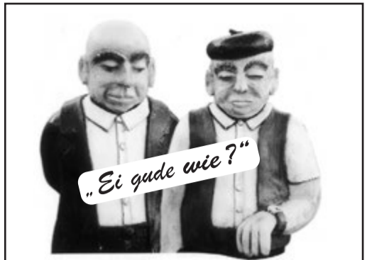
„Schaa & Schambes“ sind im Aumühlenhof der Aumühlenresidenz zu Hause.

Schaa: Seit gestern iss Fastenzeit, da wäsche die Narr'n in viele Geschende ihr Portmonee.