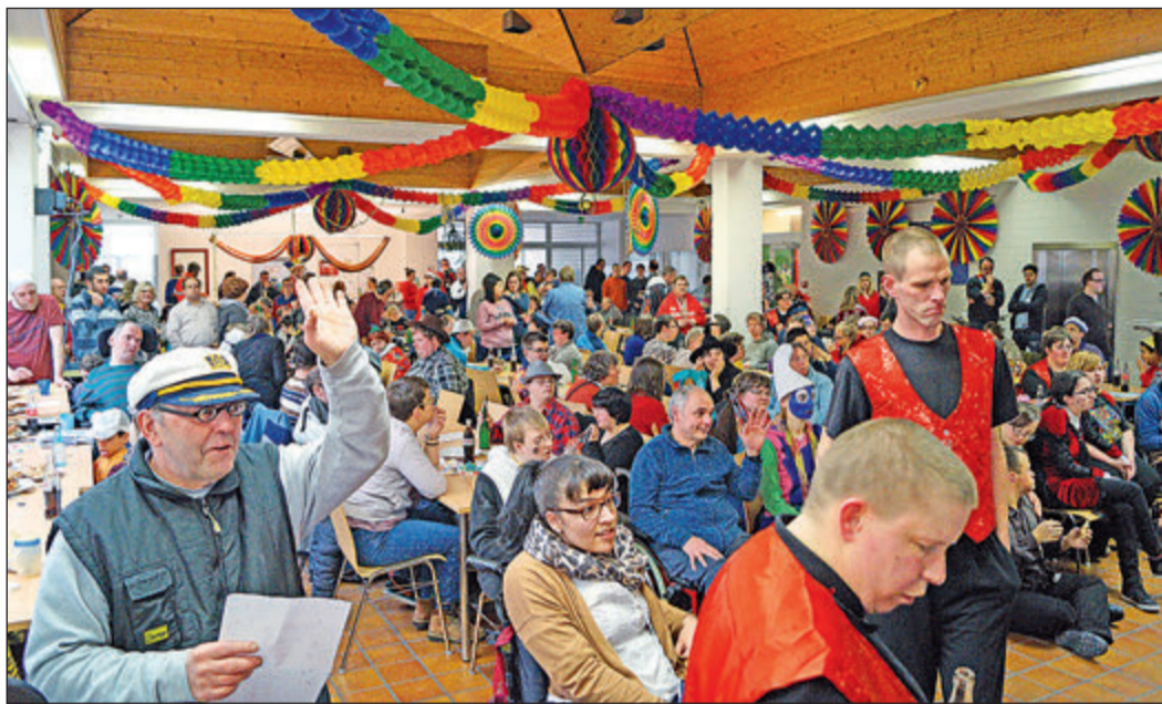
Rappellvoll war es in den Räumen der Oberurseler Werkstätten beim närrischen Gipfeltreffen.