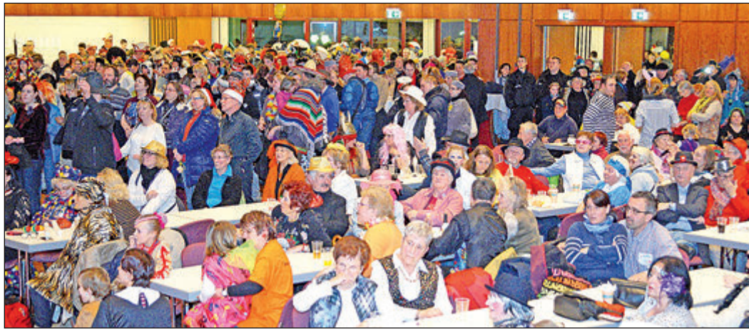
Gespant warteten bei der After-Zug-Party in der vollen Stadthalle alle gebannt auf die Bekanntgabe der Gewinner.