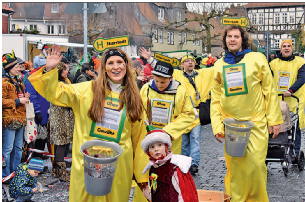
Die Lustigen Stierstädter, an deren Bushaltestelle ein Prinz wartet, bis er den Anschluss zur Fassenacht findet, wurden mit dem Ehrenpreis der Stadt belohnt.