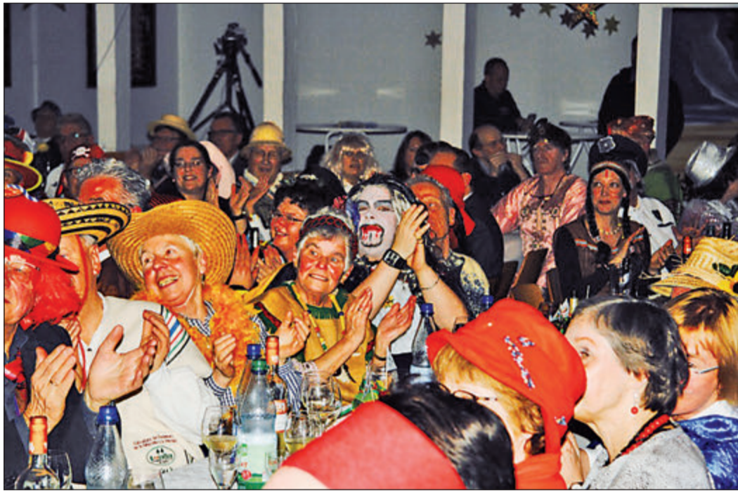
Beim Auswärtsspiel im Vereinsheim des Frohsinn waren die Hedwistaner-Fans bestens gelaunt.