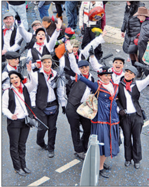
Ebenfalls preisgekrönt: Die Mary Poppins-Fußgruppe des Frohsinn-Balletts.

Beide Schwimmkurse beginnen am 29. März und finden vormittags ab 10.15 Uhr beziehungsweise ab 11.30 Uhr statt. Die Kurseinheiten umfassen jeweils 60 Minuten. Anmeldungen sind online über www.stadtwerke-oberursel.de möglich. Dort gibt es auch Informationen zu den jeweiligen Kursen.