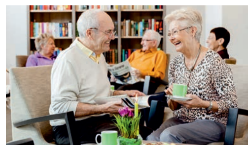
Geselligkeit & gute Laune in der Artis-Lounge.

Diese Anforderungen erfüllt Artis Service-Wohnen am Schloss in Bad Homburg ab Januar 2018. Vermietet werden 64 hochwertige Wohnungen mit Gemeinschaftsflächen. Im Haus: Artis Service-Center, und Pflege-Center „Deutsches Rotes Kreuz“.