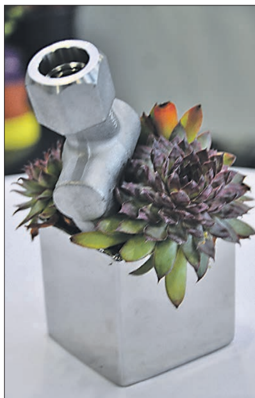
Originelle Tischdekoration „à la Bollin“ durfte bei der Eröffnung der Armaturenfabrik nicht fehlen.