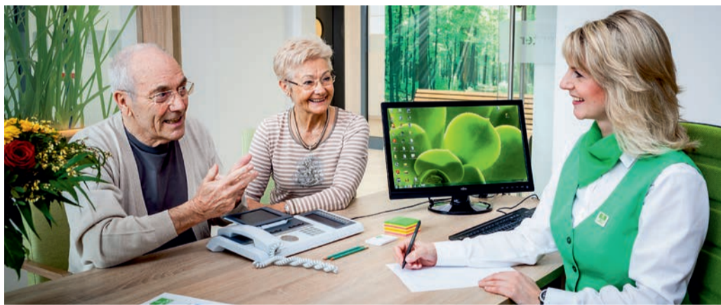
Im Artis Service-Wohnen Bad Homburg wird Service- und Dienstleistung großgeschrieben.

Da die Wohnqualität ganz entscheidend die Lebensqualität bestimmt, gehört es zu den wichtigsten Vorbereitungen auf das Alter, sich frühzeitig Gedanken darüber zu machen, wie und wo man später wohnen möchte.