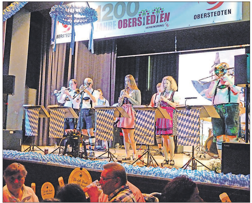
Mit Stimmungsmusik heizt die Band „Reinheitsgebot“ den vielen Besuchern des Stedter Oktoberfests so richtig ein.