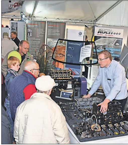
Die Stände beim Herbsttreiben sind insgesamt gut besucht und die Gäste neugierig. Die Besucher fragen viel, wie hier im Handwerker-Zelt auf dem Epinay-Platz.