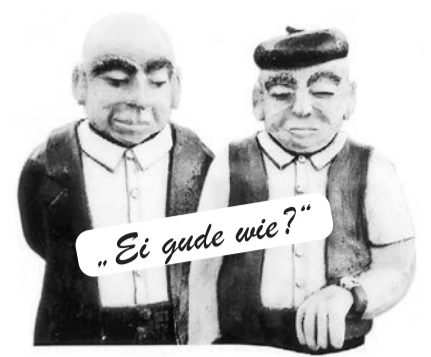
„Schaa &amp; Schambes“ sind im Aumühlenhof der Aumühlenresidenz zu Hause.

Für weitere Fragen stehen die Straßenverkehrsbehörde und die Verkehrsplanung unter Telefon 06171-5020 zur Verfügung.