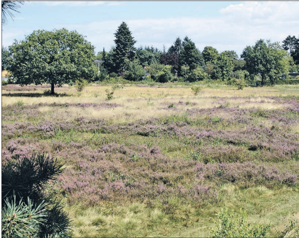
Dank regelmäßiger Pflegemaßnahmen ist aus einem mit Birken bewachsenen Grasland wieder eine Heidelandschaft geworden.

Bei der Arbeiten ist jede Hand hilfreich. Die Aktiven der SDW Oberursel und alle Freiwilligen treffen sich um 9.30 Uhr zur freiwilligen und geselligen Naturschutzaktion auf der Stierstädter Heide unterhalb des Sportplatzes an der Königsteiner Straße. Für Getränke und Verpflegung der Helfer wird von Seiten der SDW gesorgt. Weitere Heideaktionen finden am 28. Oktober und am 18. November statt.