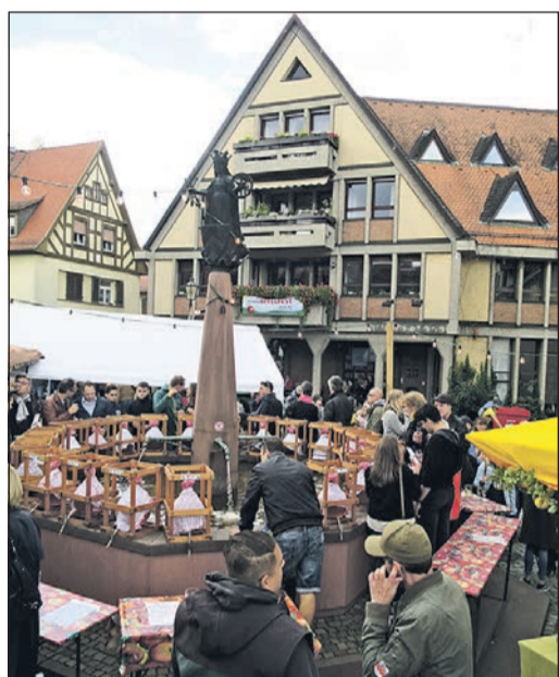
Über 300 Interessierte suchen den besten Äppler und küren in diesem Jahr ein „Königspaar“.