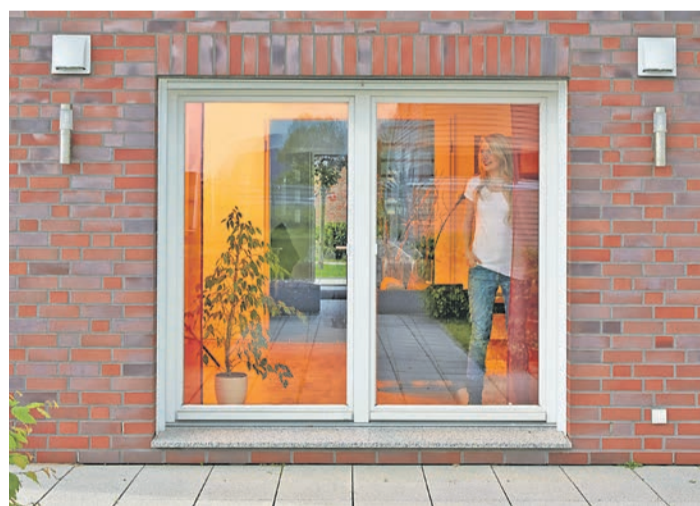
Dank einer Abtropfkante schützt die UV-beständige Außenhaube des Frischluft-Wärmetauschers die Hauswand vor unschönen Wasserspuren

Energetische Sanierungsmaßnahmen wie die Erneuerung der Fenster oder die Dämmung des Dachbodens führen zu einer höheren Luftdichtheit des Gebäudes. Deshalb muss derjenige, der dämmt, auch an eine Lüftung denken. Effiziente Lösungen wie etwa