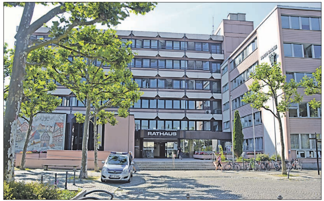
Rathaus mit aktuellem Haupteingang. Das Nebengebäude wird fallen, auf der Platzseite sollen neue Gebäude für Einzelhandel und Wohnungen gebaut werden.