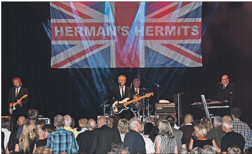
Hier werden Erinnerungen wahr: Die Herren von „Herman's Hermits“ schicken die Besucher der Beat-Night auf eine Zeitreise.