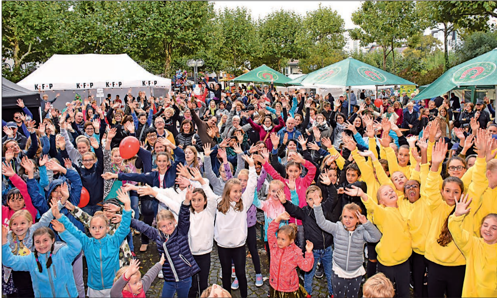
Riesenstimmung auf dem Rathausplatz! Umgeben von der Atmosphäre Apuliens wird auf der Bühne getanzt, musiziert und Stimmung gemacht. Dafür sorgen die „Stierstädter Spatzen“, die Musikschule Oberursel und die Shows der Tanzschule Prützer sowie die Cheerleader der Frankfurt Samsung Universe. Den Gästen gefällt es.