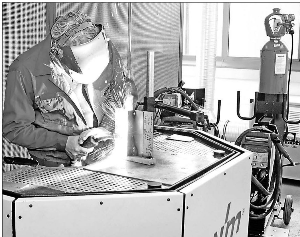
Die Gäste können eine Schweißvorführung an einer neuen „forceArc plus“, die eine Revolution in der Schweißtechnik sein soll, mit eigenen Augen verfolgen.