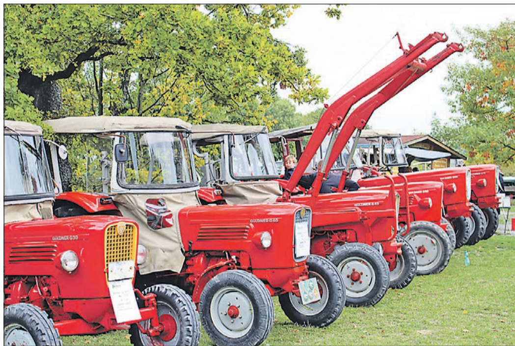
Am letzten Septemberwochenende verwandelt sich das Freilichtmuseum zu einem Tummelplatz für alte Traktoren.