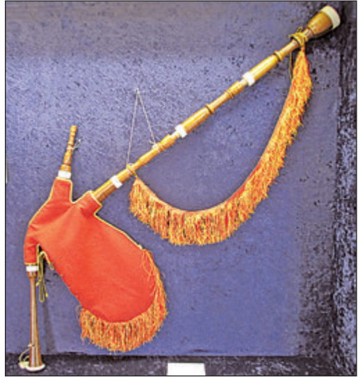
Diese Sackpfeife (Gaita gallega, Spanien) ist in der Ausstellung zu sehen.

Oberursel (ow). Die Stadt Oberursel ist wie 95 Prozent aller hessischen Kommunen an das kommunale IT-Dienstleistungsunternehmen ekom21 mit seinem Melderegister angebunden. Das Unternehmen ersetzt das bisherige Fachverfahren im Einwohnerwesen durch ein neu konzipiertes Einwohnermeldeverfahren. Die Umstellung wird in Oberursel vom 14. bis 17. Mai stattfinden. Das Einwohnerbüro bleibt daher am 15. Mai, dem Tag nach Christi Himmelfahrt, geschlossen. Die für die Anwendung der neuen Software erforderlichen Schulungen der Mitarbeiterinnen werden am 29. und 30. April durchgeführt. Das Einwohnerbüro muss deshalb auch an den zwei Tagen vor dem Maifeiertag geschlossen bleiben.