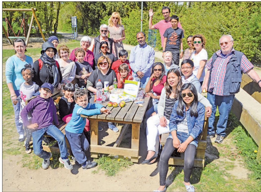
Ein sonniges Fleckchen am Spielplatz haben sich die Familien aus der französischen Partnerstadt Epinay für ihre Rast mit Picknick am Maasgrundweiher ausgesucht.