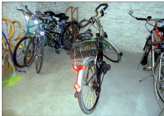
Ips/Cb. Fahrradkeller

Ips/Cb. Kann einem Mieter ein Kellerraum gewissermaßen zwangsweise per Modernisierungsankündigung zur Verfügung gestellt werden, um ein wohnwertminderndes Merkmal (kein nutzbarer Abstellraum im Gebäude außerhalb der Wohnung) zu beseitigen? Hat der Mieter dies zu dulden, wenn keine Kosten für die Nutzung anfallen?