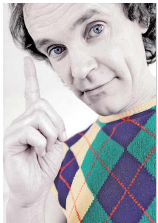
Olaf Schubert präsentiert sein aktuelles Programm „SO“ am 27. Mai im Kurtheater.

Hochtaunus (how). Der neue Schubert ist da. Gott sei Dank in alter Form, denn er sagt wie immer: „SO!“ Zu erleben ist er am Mittwoch, 27. Mai, ab 20 Uhr im Kurtheater. „SO“ sind nicht nur Olaf Schuberts spiegelbildliche Initialen – vielmehr sprechen diese beiden Buchstaben für ihn selbst, denn wer „SO“ sagt, hat Reserven. Dass Schubert diese Reserven überhaupt aktivieren muss, ist unwahrscheinlich, seine Akkus sind voll und selbst im gewöhnlichen Standby gibt er schon 150 Prozent Leistung. Seine Auftritte sind le-