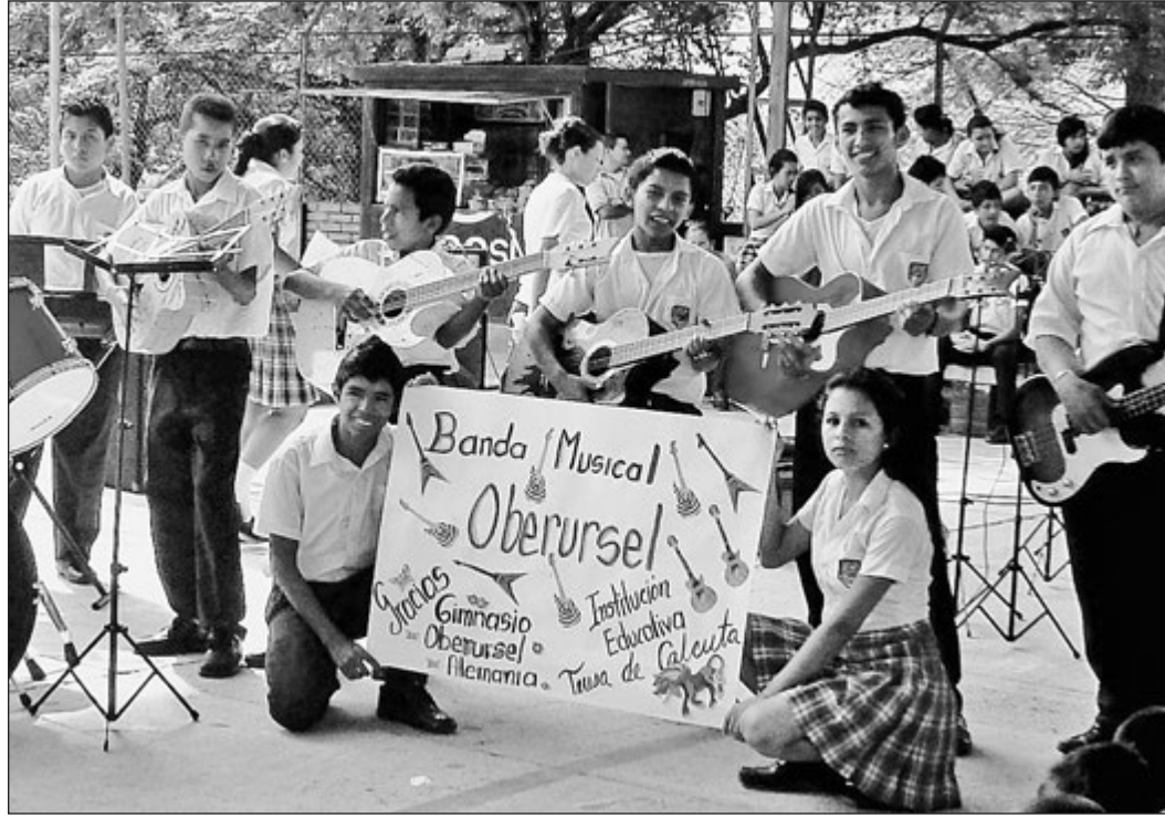
Die Gruppe „Banda Musical Oberursel“ in Yopal würde sich über neue Musikinstrumente freuen.