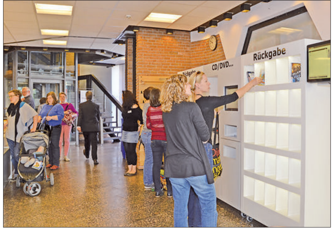
Das Buch einfach ins Regal stellen und rechts am Monitor neben dem Titel den grünen Haken sehen, einfacher gehts kaum. Und der nächste Büchereibesucher kann schon schauen, ob er es eventuell haben möchte.

Oberursel (ow). Am Sonntag, 26. April, um 11 Uhr lädt der Förderverein Schulwald zum Tag des Baumes auf dem Gelände des Schulwaldes Oberursel, Ecke verlängerter Altenhöfer Weg/St. Johannes-Weg. Im Mittelpunkt steht der Feld-Ahorn (Acer campestre). Zur vorerst letzten Ergänzung des vielseitigen Baumbestandes werden noch weitere Pflanzungen nach Vorberatung mit und unter Leitung von Förster Mathias Brand der Stadt Oberursel erfolgen. Zu dieser öffentlichen Veranstaltung sind alle Bürger eingeladen. Für Getränke und einen kleinen Imbiss ist gesorgt.