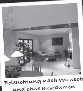
Beleuchtung nach Wunsch und ohne ausräumen

Besuchen Sie unsere Ausstellung: Di. + Do. 14–18 Uhr Sa. 12–16 Uhr