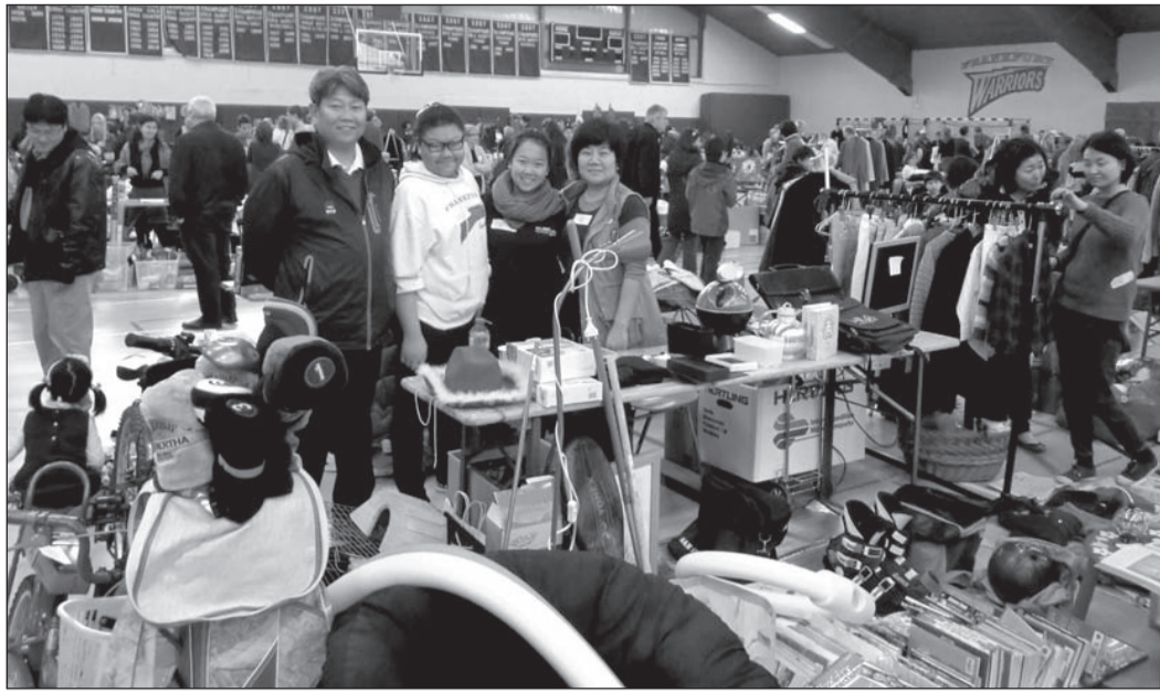
Viele gutgepflegte und beehrte Waren boten die Kims interessierten Flohmarktbesuchern.