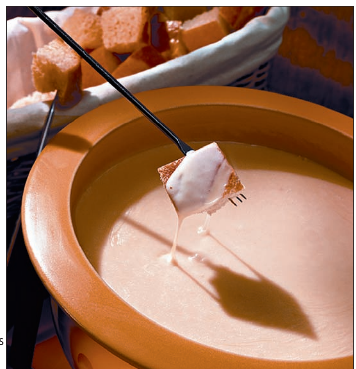
Tip: Für das Fondue sollte der gleiche Wein verwendet werden, den man auch zum Essen serviert.

Baguette so in Würfel schneiden, dass jeder Würfel an mindestens einer Seite eine Kruste hat. Während des Essens nach und nach Wein oder Milch unterrühren, um das Fondue geschmeidig zu halten.