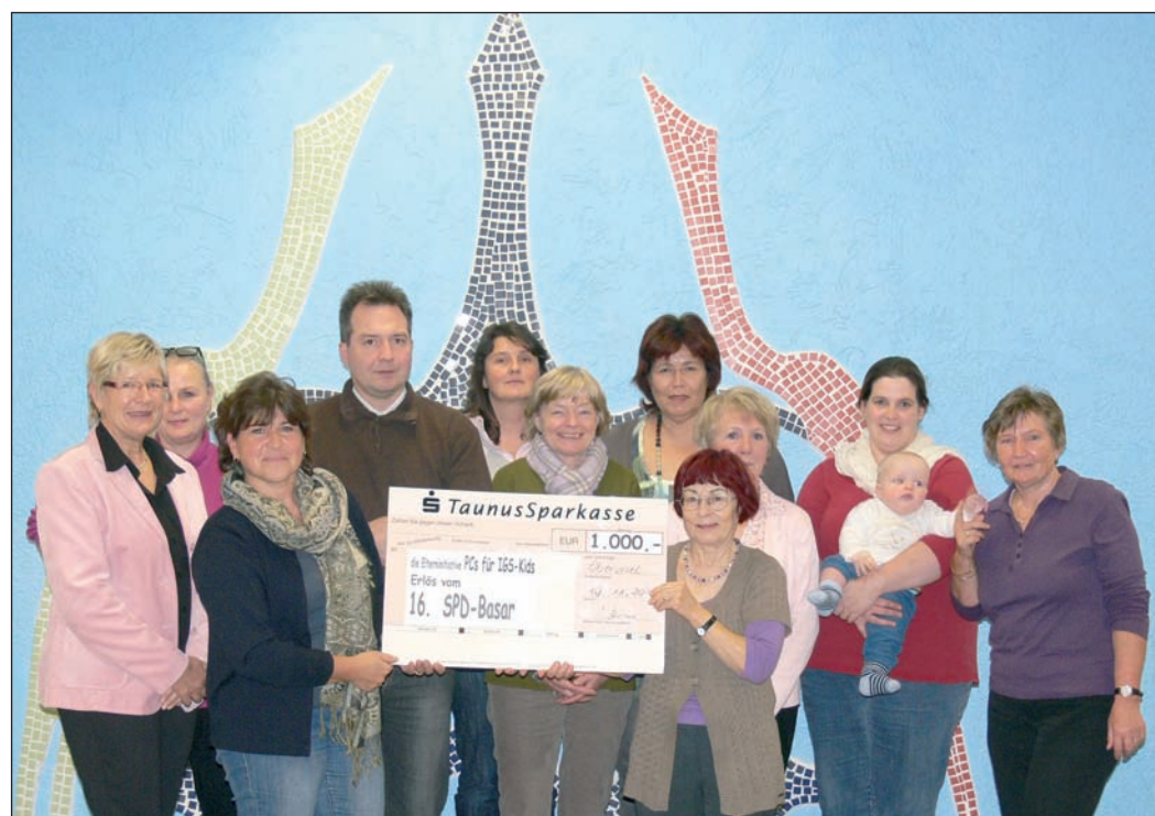
Mitglieder der PC-Initiative der IGS und einige Damen des SPD-Basarteams bei der Scheckübergabe vor dem IGS-Logo.