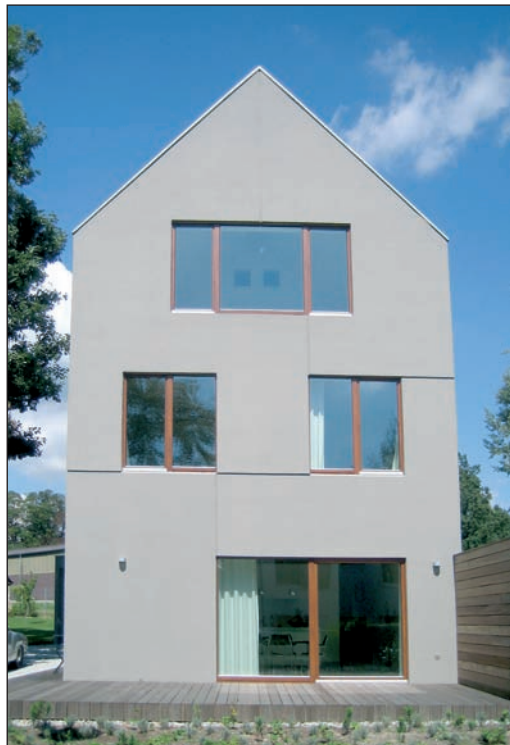
Das „Graue Haus“ im Camp King wurde erneut mit einem Architekturpreis bedacht.

Oberursel (ow). Das „Graue Haus“ im Camp King ist mit dem „Green Building Award 2011“ in der Region Rhein-Main ausgezeichnet worden. Es ist der dritte Preis nach der „Auszeichnung vorbildlicher Bauten im Land Hessen 2008“ und dem „Gestaltungspreis der Wüstenrot-Stiftung für energieeffiziente Architektur in Deutschland“ im selben Jahr. Das Einfamilienhaus mit Büroeinheit wurde aufgrund der vorbildhaften modernen Architektursprache in Kombination mit einer ökonomischen zukunftsweisenden Haustechnik (Passivhausstandard) prämiert. Es zeigt nach Ansicht der Jury beispielhaft eine angemessene Nachverdichtung in einer bestehenden Siedlungsstruktur der 1930er-Jahre im Camp King-Areal.