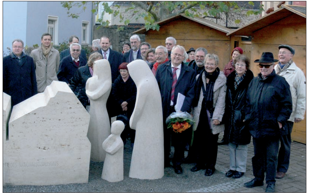
Nach dem Aufstellen der neuen Figuren zeigte man Präsenz am Denkmal hinter der Hospitalkirche.