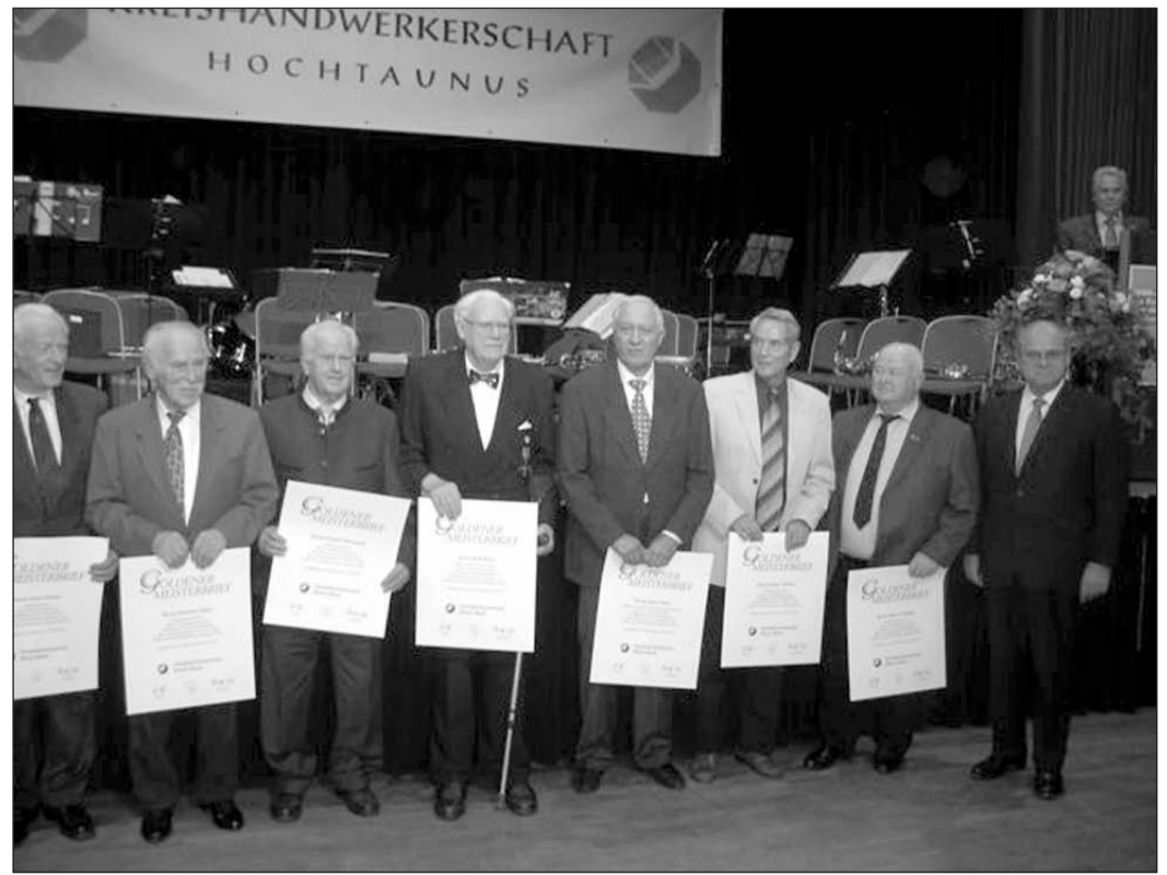
Die Riege der „Altmeister“ im Handwerks mit ihren Goldenen Meisterbriefen.