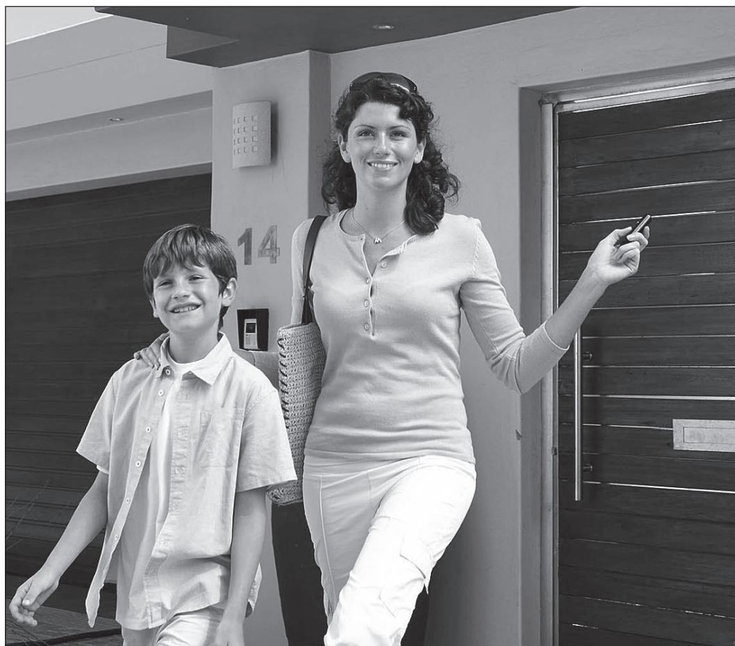
Ips/Bo. Komfort auf Knopfdruck – die Elektronik macht's möglich.

Telefon: 069 330001-0 bildnotruf@bsg-sicherheit.de www.bsg-sicherheit.de