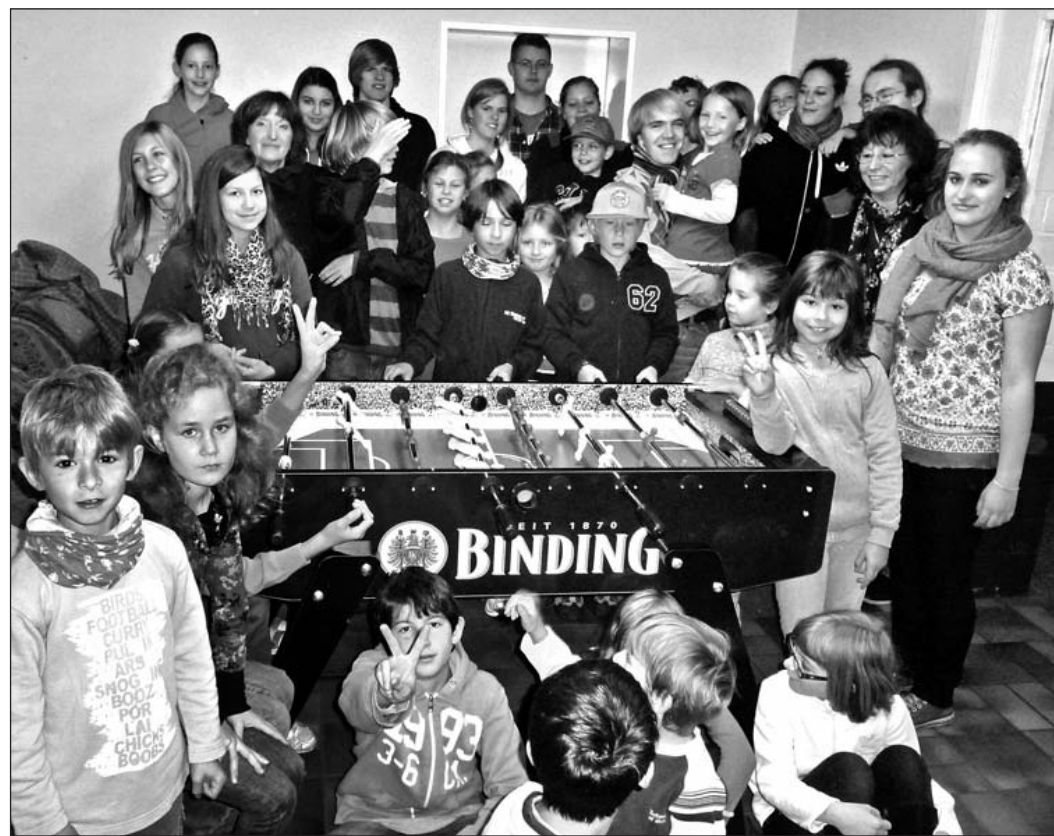
Bei den Herbstferien der Heilig Geist-Kirche haben die Kinder einen neuen Tischkicker einweihen.

Und so schnell wie die Woche verging kam auch der Freitag, an dem die Kinder einen neuen Tischkicker einweihen durften, für ihr