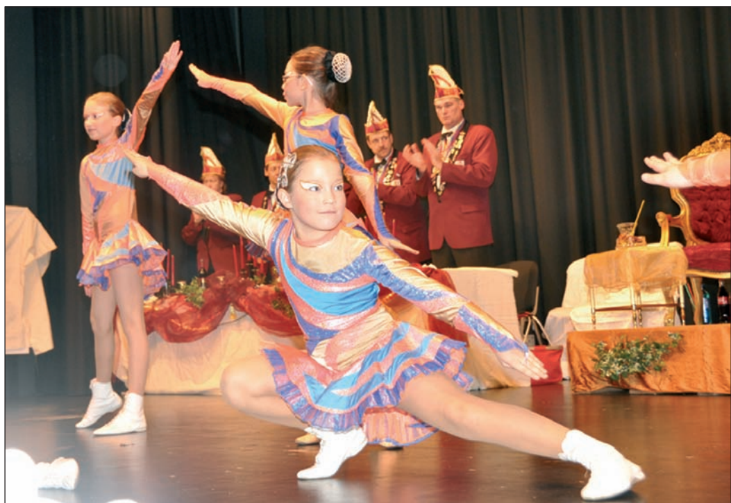
Der Polkamix der drei Garden war eine Schau. Hier einige der jungen Minis, im Hintergrund ein Teil des Elferrats.

hoch in Ihre Bäume ... hoch in unserer Leistung ... hoch in der Kundenzufriedenheit ... Zertifizierte Baumpflege und Komplett-Fällungen vom Feinsten! „Der Garten - Fritz“™ & Team Meisterbetrieb www.der-garten-fritz.com 06174 - 61 98 98 0162 - 86 82 258 Ihre persönlichen Experten im Garten ... ... schnell, zuverlässig, preis - wert, gut !!