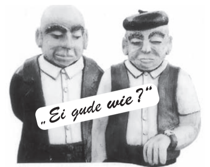
„Schaa & Schambes“ sind im Aumühlenhof der Aumühlenresidenz zu Hause.