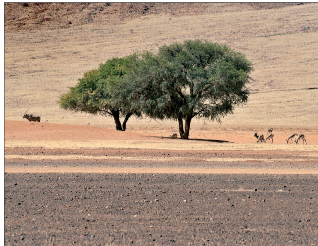
Beeindruckende Fotos aus einer den meisten Menschen nicht selbst erlebten Welt – aus Afrika – von Anja Georgi kann man ab 5. Dezember im Rathausfoyer erleben.