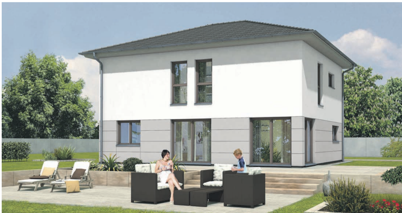
Die Idee des RötzerCreativ Konzepts ist so simpel wie faszinierend: Rötzer Creativ ist die Quintessenz der Erfahrung von tausenden geplanter und gebauter Häuser.

Stein auf Stein – und doch ganz schnell rein – Bausystem vereinigt Vorteile eines individuell geplanten, massiven Eigenheims mit vorgefertigten Elementen