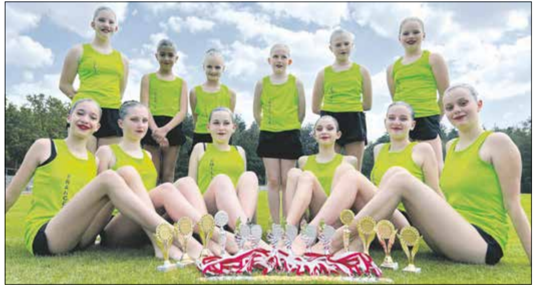
Die Sodener Synchro-Nixen waren in Kaiserslautern mit je einem Team in den Wertungsklassen der 13- bis 15-Jährigen (sitzend) und der Zehn- bis Zwölfjährigen (stehend) am Start. Die jeweils sechsköpfigen Teams landeten auf Platz eins und zwei.

Auch die jüngsten Synchro-Nixen des ESSC präsentierten sich gut vorbereitet für den