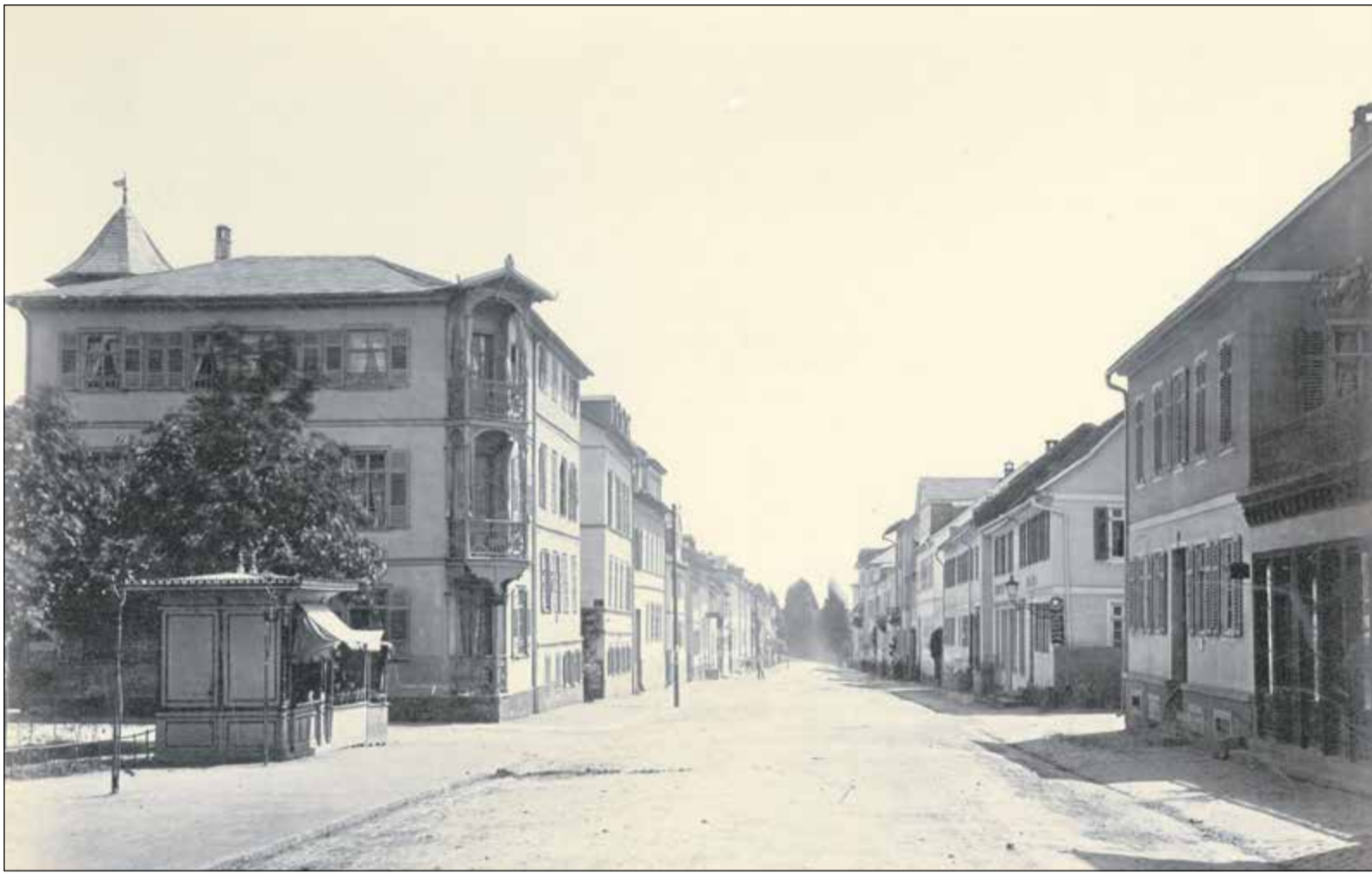
Diese Fotografie ist das Museumsstück des Monats Juli. Es zeigt die Königsteiner Straße in Blickrichtung Höchst.