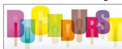
„Buchdurst“ heißt die Schmökeraktion der Stadtbücherei. Grafik: Stadt Bad Soden

die Sommerferien soll jedes Kind drei Bücher lesen und anschließend bewerten. Ob die Kinder auf Vampire stehen, auf Freundschaftsgeschichten oder auf ganz große Abenteuer – auf jeden Fall kann man in der Stadtbücherei das richtige Buch finden. Und selbst wer bisher nicht so viel gelesen hat, findet bestimmt Geschichten, die Appetit auf mehr machen. Die ausgefüllte Bewertungs-