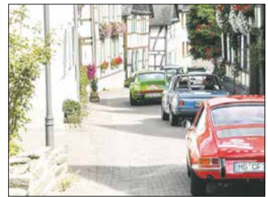
Die hessischen Dörfer und Städte mit ihren Fachwerkhäusern bieten historische Kulissen.