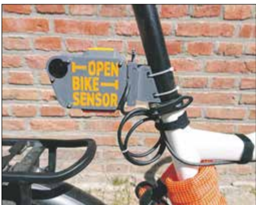
Der OpenBikeSensor wird an der Sattelstütze montiert.

Main-Taunus (bs) – Mit einer neuen Aktion nimmt sich der ADFC Main-Taunus des für viele besonders wichtigen Problems im Straßenverkehr an – dem oft zu geringen Abstand zwischen den Radfahrern und den überholenden Autos. Und so wird die Straßenverkehrsordnung zitiert: „Beim Überholen mit Kraftfahrzeugen von zu Fußgehenden, Radfahrenden und Elektrokraftfahrzeugführenden beträgt der ausreichende Seitenabstand innerorts mindestens 1,5 m und außerorts mindestens 2 m.“ (StVO, § 5 Abs. 4). Dabei spielt es übrigens keine Rolle, ob der Radfahrer oder die Radfahrerin auf der Straße oder auf einem Radfahr- oder Schutzstreifen fährt.