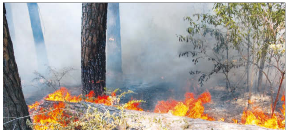
Eine achtlos weggeworfene Zigarette kann fatale Folgen haben.