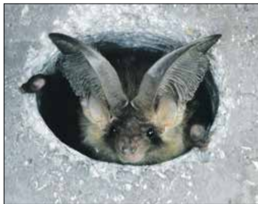
Braunes Langohr

Hessen (bs) – Mit der Geburt der Jungen beginnt für Fledermausmütter in ihren Sommer-Quartieren, den „Wochenstuben“, eine aufregende Zeit. Bis zur Selbständigkeit der Jungtiere Ende August müssen sie sich nun intensiv um ihren Nachwuchs kümmern. Dabei kommt es immer wieder vor, dass einzelne Jungtiere zu vorwitzig sind und aus dem Quartier purzeln, verwaisen, abstürzen oder geschwächt am Boden liegen. Fledermausmütter sind sehr fürsorglich und suchen nach ihren Jungen, um sie wiederaufzunehmen. Damit dies gelingen kann, ist jedoch oftmals Hilfe nötig.