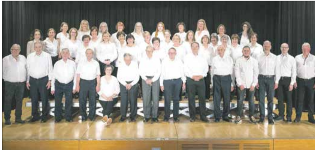
... und so ist es heute.

Der Eintritt zum Jubiläumskonzert ist frei, der Verein freut sich aber über eine Spende.