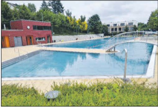
Das Freibad im Altenhainer Tal