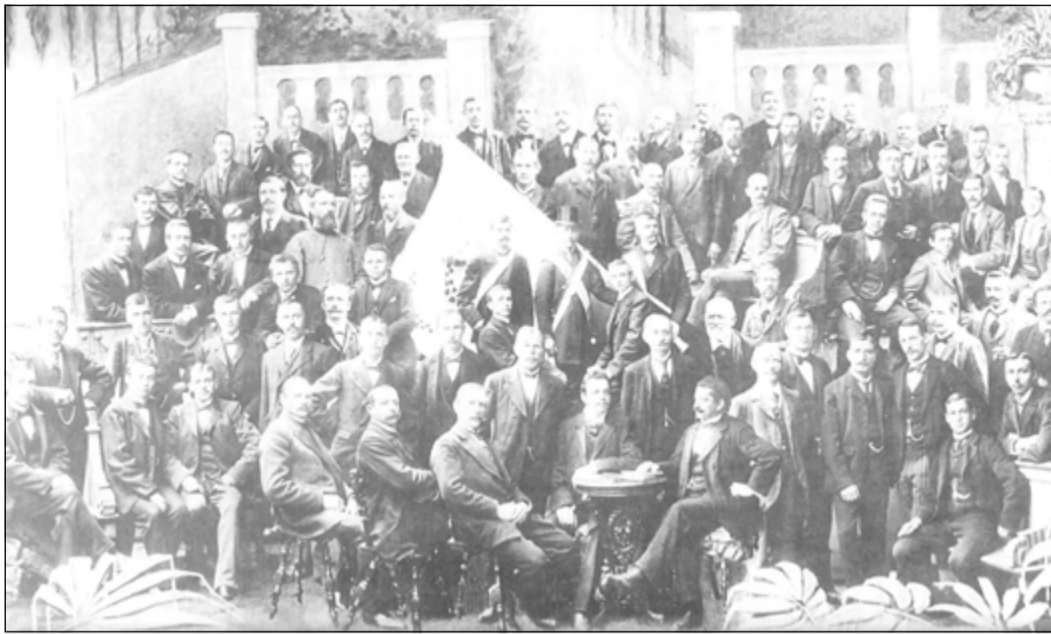
Der Neuenhainer Männergesangsverein (MGV) feiert sein 150-jähriges Jubiläum: So war es im Jahr 1873...

Neuenhain (bs) – Mit einem Jubiläumskonzert feiert der Neuenhainer „Männergesangsverein Brüderlichkeit 1873 e.V.“ sein 150-jähriges Bestehen. Das Konzert mit den Chören des MGV findet am Samstag, 8. Juli, um 17 Uhr im Bürgerhaus Neuenhain statt. „Alle Interessierten sind eingeladen, mitzufeiern“, schreibt der Verein. Der Eintritt ist frei, der Verein freut sich aber über eine Spende.