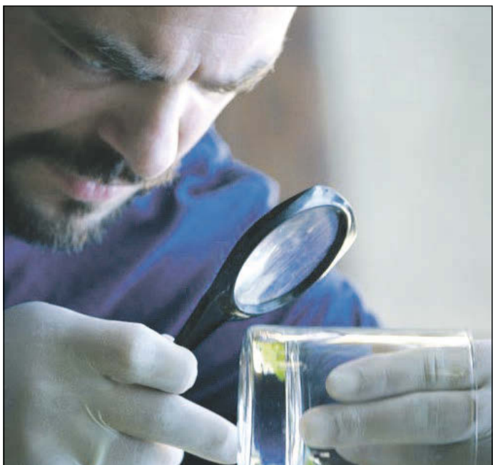
Genau hinschauen: Diese Spur könnte zum Täter führen.